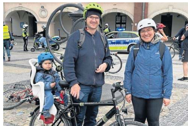
Uczestnicy dopisali, a świetna atmosfera towarzyszyła wydarzeniu jeszcze przed wyruszeniem na trasę

Po energicznej rozgrzewce kolorowy peleton ruszył w kierunku Ogrodu Botanicz-