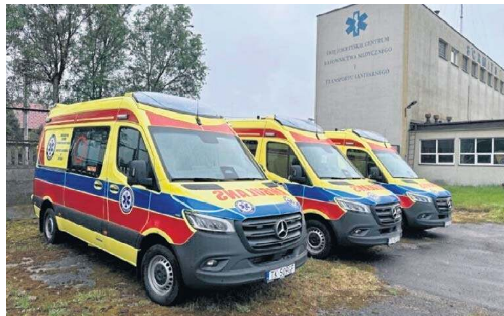
Nowe ambulanse typu C, określane często mianem „mobilnych oddziałów intensywnej terapii”, są przeznaczone do ratowania pacjentów w stanach nagłego zagrożenia życia

Nowe ambulanse typu C, określane często mianem „mobilnych oddziałów intensywnej terapii”, są przeznaczone do ratowania pacjentów w stanach