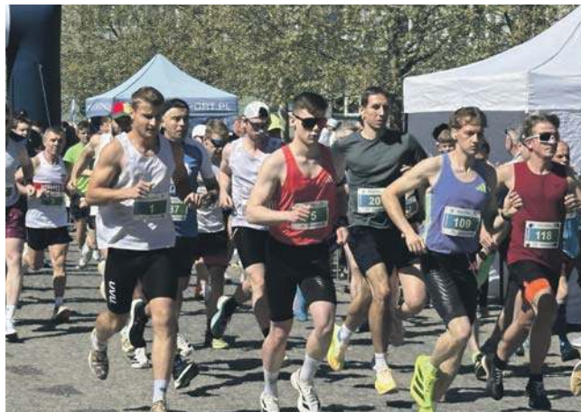
W głównym biegu na 10 kilometrów wystartowało ponad 200 biegaczy, w biegach na krótszym dystansie - 90.

Trzy główne formy aktywności: Dycha nad Pilicą (10 km): Szybka i płaska trasa, idealna do bicia rekordów życiowych. Bieg Rekreacyjny (3 km): Krót-