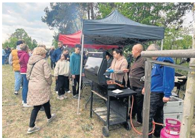
Była darmowa kiełbaska, ale każdy mógł przynieść swoje produkty do grillowania.

Dla uczestników przygotowano symboliczny darmowy poczęstunek - grillowaną kiełbaskę. Była również możliwość przyniesienia własnych produktów, które przygotowuje doświadczona obsługa grillowa. Na miejscu była miejscowa Ochotnicza Straż Pożarna, która chwaliła się swoim nowoczesnym sprzętem. Pionki miały z kolei okazję pochwalić się całkiem fajnym miejscem na organizację imprez plenerowych jakim są „Błonia”. To teren między linią kolejową a ulicami Adama Mickiewicza i Niepodległości, który dopiero kilka lat temu „ucywilizowano”, zagospodarowano i oddano mieszkańcom w użytkowanie.