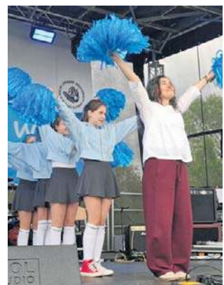
Występ uczennic ze szkoły numer 12 w Radomiu.

W sobotnie popołudnie, 9 maja, nad Zalew Borki odbył się rodzinny piknik edukacyjny