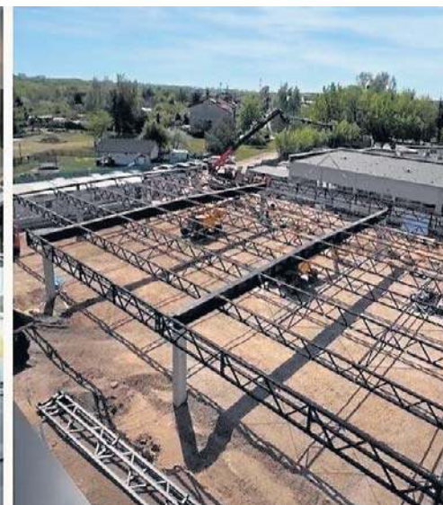
Tak obecnie wygląda budowa nowego salonu Lexus Radom.