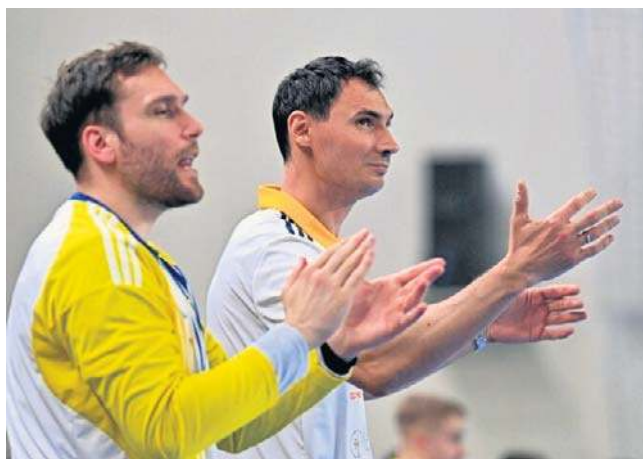
Trener Industrii Kielce Krzysztof Lijewski podczas meczu z Rebud KPR Ostrowia Ostrów Wielkopolski

- Przestrzegalem swoich zawodników, że mierząc się z drużyną, która nie ma nic do stracenia, gra się bardzo ciężko. Rywale z Ostrowa Wielkopolskiego byli ambitni, grali konsekwentnie. My chcieliśmy piłkę w obronie wyłuskać jak najszybciej i zamienić ją na bramkę, czasami jednak trzeba zwolnić tempo, a pozycja rzutowa też się znajdzie. Do tego niewykorzystane sytuacje sam na sam plus błędy własne spowodowały to, że w pierwszych minutach mecz był bardzo wyrównany. Co prawda, straciliśmy 11 bramek - to dobry wynik - ale aż cztery z kontrataków i siedem z ataku pozycyjnego. Z obrony jestem