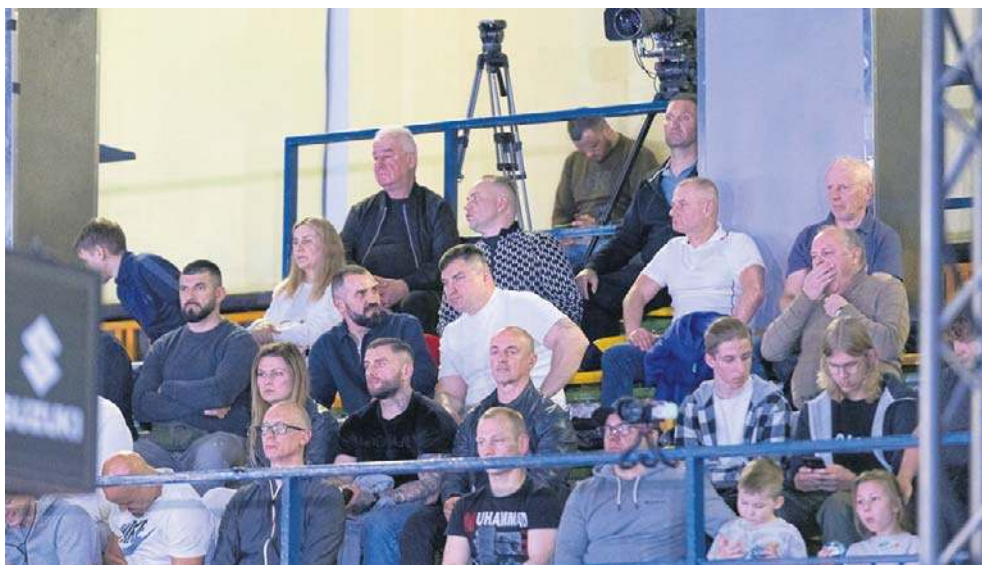
Nie było wielu kibiców na finałowych pojedynkach. Szkoda, bo emocji było mnóstwo