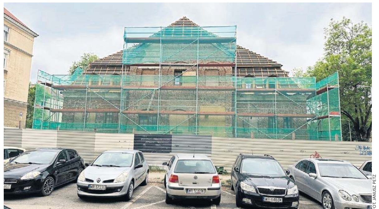
Ważną częścią rewitalizacji obiektu była odbudowa dachu razem z więźbą dachową.

Dużą część załogi powstającej Fabryki Broni stanowili samotni mężczyźni. Z myślą o nich w budowanych budynkach mieszkalnych projektowano dość luksusowe jak na tamte czasy kawalerki z bieżącą wodą, kanalizacją, prądem i gazem. Już na etapie projektowym zrezygnowano jednak z łaźni, po to by zaoszczędzić jak najwięcej miejsca i przydzielić mieszkania jak największej liczbie pracowników. ©