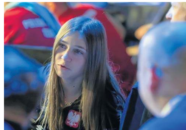
Walki Polaków, swoich przyjaciół z kadry oglądała z trybun Julia Szeremeta, medalistka igrzysk olimpijskich