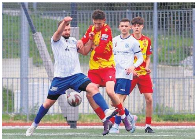
KKP Korona Kielce - Lechia Strawczyn aż 11:0! To najwyższe zwycięstwo w tym sezonie

WICHER MIEDZIANA GÓRA - STAL KUNÓW 7:1 (5:1)