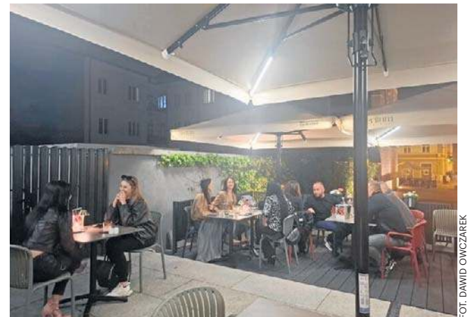
W Hotelu Hilton Garden w Radomiu pojawił się ogródek restauracyjny. Radomianie chętnie z niego korzystali.

cialnymi promocjami. W piątek, 8 maja, Hilton Garden Inn Radom świętował swoje drugie urodziny. Z tej okazji restauracja Meritum przygotowała dla gości specjalne atrakcje. Od godzin wieczornych przestrzeń przed restauracją wypełniła się gośćmi, którzy bawili się przy muzyce serwowanej przez DJ-a. Od samego początku wydarzenia w restauracji panowała wyjątkowa atmosfera. ©