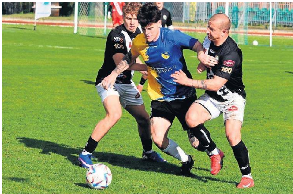
Proch Pionki doznał porażki w meczu z Promykiem Nowa Sucha

- Granie trzech meczów w ciągu tygodnia to z pewnością nie jest domena Drogowca - widać to gołym okiem, ale inna sprawa, że Chlebnią odniosła siódme, wiosenne zwycięstwo, bo miała więcej jako-