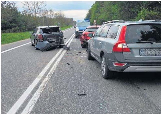
W Lisowie 44-letnia kobieta kierująca Volvo nie zachowała ostrożności i najechała na tył Renaulta

Wszyscy uczestnicy obu zdarzeń byli trzeźwi.