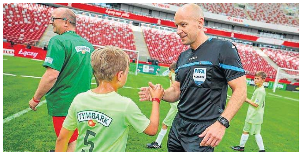
Sędzia FIFA Szymon Marciniak z chęcią prowadzi mecze Pucharu Tymbark

Od 2023 roku Puchar Tymbark i jego uczestnicy są oficjalnym partnerem piłkarskiej reprezentacji Polski, a mecze finałowe odbywają się przed meczami kadry.