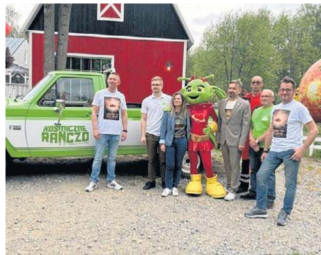
Kosmiczne Ranczo w Rososzu w nowej odsłonie rozpoczęło sezon 2026. Kusi wieloma atrakcjami.

W 2026 roku powiększono kolekcję eksponatów, w tym imponującą kolekcję kosmicznych zestawów LEGO oraz pamiątek związanych z eksploracją wszechświata. Nowością jest pełnowymiarowa figura astronauty Sławosza Uznańskiego-Wisniewskiego wraz z opisem misji IGNIS, przybliżająca osiągnięcia współczesnej polskiej technologii kosmicznej. Na rozległym terenie są też karuzele, dmuchańce i inne atrakcje. Kosmiczna Farma będzie działać sezonowo do końca września. ©©