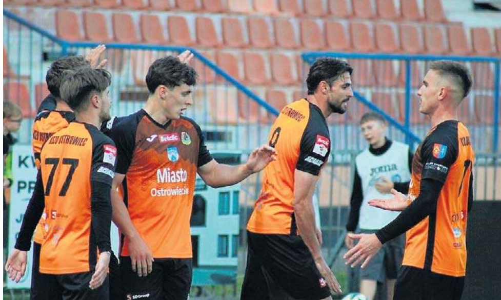
KSZO 1929 Ostrowiec Świętokrzyski gra z Wisłą II Kraków. Do lidera traci dwa punkty

- Trzeba pogratulować trenerowi postawy, bo naprawdę Wisła postawiła warunki. Wszyscy na stadionie mogli pomyśleć, po 20 minutach, że jest pozamiatane, po naszych dwóch bramkach, bo dobrze graliśmy w ataku. Myślę, że zawodnicy też tak mogli pomyśleć, a Wisła wróciła w wielkim stylu. Przerwa dotyczyła właśnie tej sytuacji, żeby się poświęcić w takich chwilach, bo nie możemy wypuszczać dwubramkowego prowadzenia w tak łatwy sposób. Po przerwie znów był polot w ataku, myślę, że nawet większy niż kiedyś. Z łatwością dochodziliśmy do pola karnego, a rywale mieli duży kłopot w bronieniu. Cieszę się, że dzisiaj stałe fragmenty gry dały nam zwycięstwo. Gratuluję zespołowi, bo wykonał ciężką pracę i widać było po zawodnikach w szatni że byli mocno