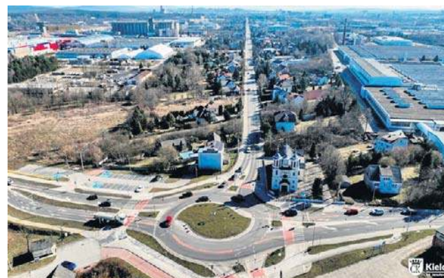
Modernizacja obejmie niespełna kilometrowy odcinek od ronda generała Bończy-Załęskiego w kierunku centrum miasta

Inwestycja została podzielona na kilka kluczowych ele-