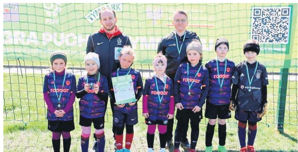
Szkoła Podstawowa z Woli Szczygiełkowej była rewelacją rozgrywek Pucharu Tymbark

-Ta szkoła zgłosiła się po raz pierwszy. Wystawiła dwie drużyny, w kategorii U-10 chłopców i U-8 dziewczynek. Młode futbolistki spisały się znakomicie. Rywalizowały ze szkołami, które od lat biorą udział w Pu-