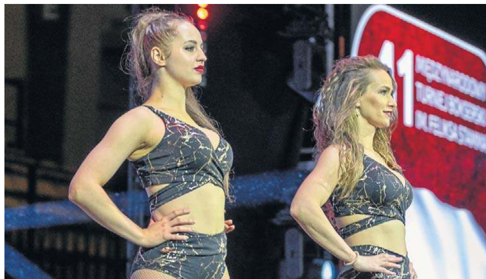
Nie mogło na radomskim ringu zabraknąć uroczych ring girls