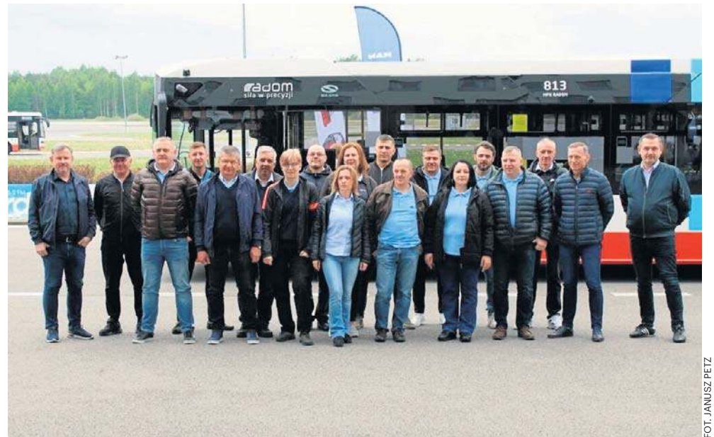
Kierowcy z Miejskiego Przedsiębiorstwa Komunikacyjnego w Radomiu uczestniczący w rywalizacji na Autodromie Jastrzęb.

W zawodach wzięło udział 30 kierowców - 15 reprezentujących Miejskie Przedsiębiorstwo Komunikacyjne Radom oraz 15 ze spółki Michalczewski. Uczestnicy zmierzyli się w pięciu widowiskowych konkurencjach, które sprawdzały ich umiejętności w ekstremalnych i wymagających warunkach. Było to coś więcej niż zwykła jazda autobusem - to pokaz najwyższego kunsztu zawodowego. Oprócz samej rywalizacji sportowej, celem im-