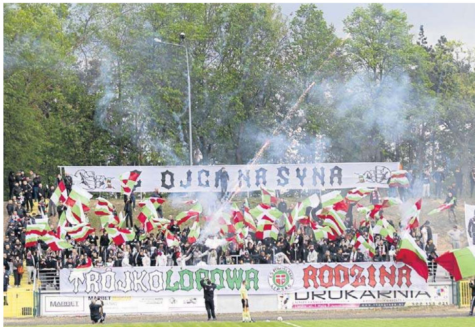
Tak w Lipsku kibice bawili się podczas meczu z Szydłowianką

Dobre spotkanie obejrzeni kibice w Wierzbicy, choć z remisem chyba żadna z drużyn nie była zadowolona. Centrum zdobyło gola w 64 minucie i było blisko wywiezienia kompletu punktów. Grający ambitnie gospodarze wyrównali w samej końcówce. Orzeł zremisował, ale tracił powoli