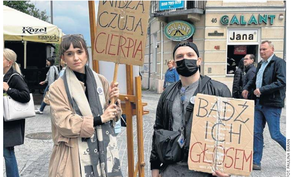
W sobotę przy mostku nad Silnicą w Kielcach odbył się protest przeciwko cierpieniu zwierząt. Uczestnicy zwracali uwagę na dramat bezdomnych psów oraz kotów

Organizatorzy podkreślali, że prawa zwierząt w Polsce