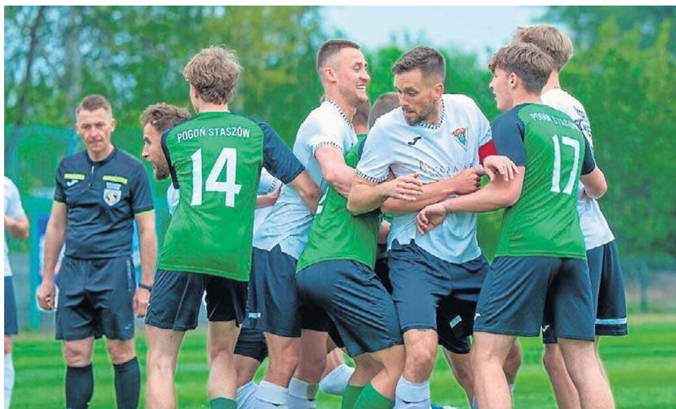
Olimpia Pogoń Staszów przegrała na własnym stadionie z Victorią 2015 Skalbierz