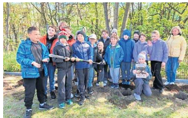
Podczas akcji sadzenia drzew w Grójcu.

Spółczesność szkolna posadziła 90 drzew, czyli po jednym