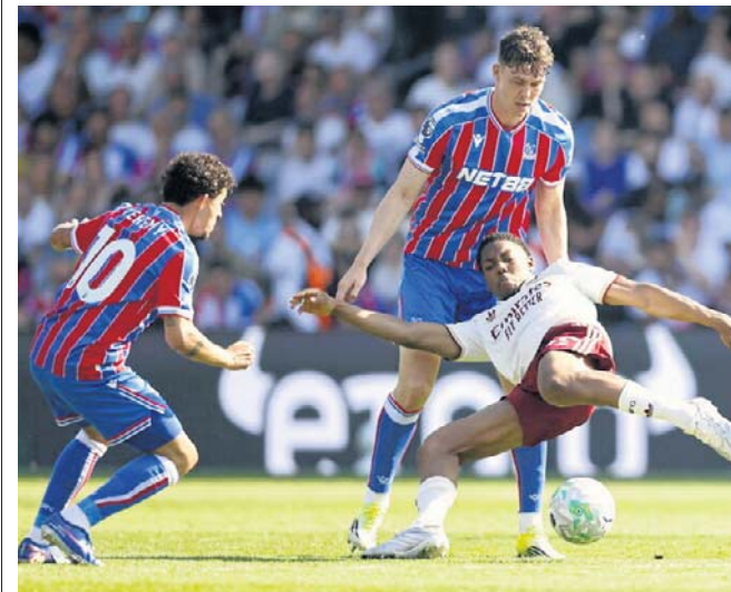
Crystal Palace miał próbę generalną z Arsenalem (1:2) w Premier League przed finałem Ligi Konferencji z Rayo

Transmisję finału przeprowadzi Polsat Sport Premium 1 oraz w serwisie streamingowym Polsat Box Go. ©©