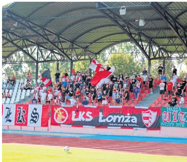
Doping kibiców ŁKS Łomża na meczu z Mławianką bardzo przydałby się Biało-Czerwonej drużynie

Jako Klub nie zgadzamy się z tą decyzją i dołożymy wszelkich starań, aby sobotnie spotkanie mogło odbyć się przy udziale naszych kibiców.