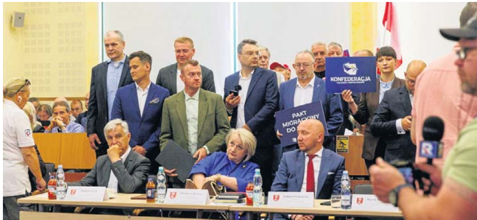
Wczorajsza sesja sejmiku wzbudziła spore emocje. Poszło o pakt migracyjny

Na konferencji przed budynkiem wystąpiła w otoczeniu wszystkich środowisk tworzących Konfederację. Bez mikrofonów. Tuż obok skupili się sympatycy PiS, którym przy wspar-