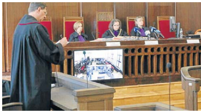
Sąd Okręgowy w Białymstoku skazał czterech Meksykanów na kary od 10 do 11 lat więzienia

Na gorącym uczynku zatrzymano trzech Meksykanów, a czwartego po krótkim posiedzeniu. Oskarżeni mają 42-50 lat, średnie, a jeden wyższe wykształcenie. Tylko jeden z nich był wcześniej karany. W USA odbywał karę sześciu lat więzienia za transport narkotyków. Cała czwórka jest aresztowana.