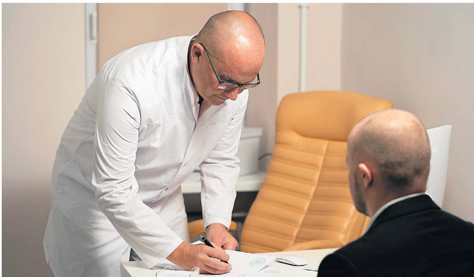
Nawracające obrzęki różnych części ciała mogą być mylnie interpretowane jako reakcja alergiczna

Silne bóle brzucha są częstym, lecz mylącym objawem HAE. Łatwo je pomylić z zatruciem, zapaleniem wyrostka robaczkowego lub innymi nagłymi stanami wymagającymi interwencji chirurgicznej. Z ko-