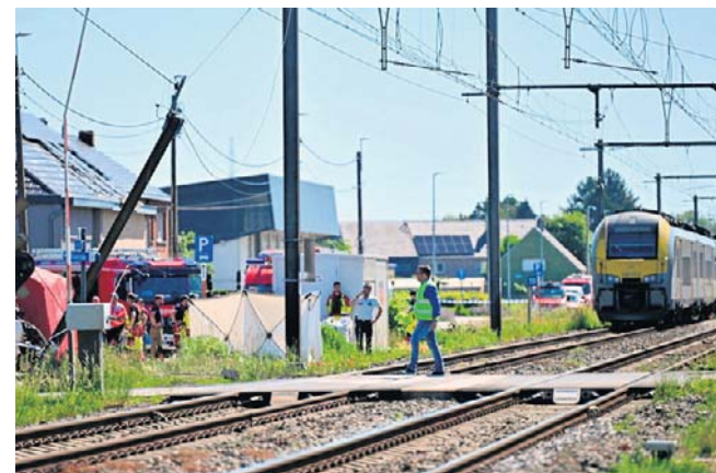
Belgia jest wstrząśnięta wypadkiem, do którego doszło na przejeździe kolejowym w mieście Buggenhout

Z pociągu ewakuowano około 100 pasażerów, jedna osoba ucierpiała z powodu szoku.