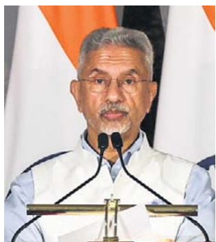
Subrahmanyam Jaishankar, indyjski minister spraw zagranicznych

Zapowiedział też współpracę w sferze infrastruktury portowej, „zwłaszcza w reakcji na niewystarczający potencjał