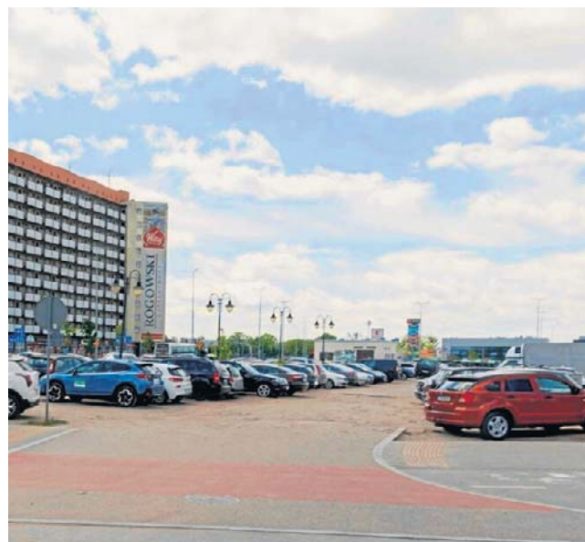
Dziki parking w miejscu Centrum Handlowego „Park”

Już po oddaniu do użytku przejścia pod torami oraz ulokowanych po sąsiedzku przystanków, z których korzystają pasażerowie BKM (to tzw. centrum przesiadkowe „Przydworcowe”) część osób zaczęła podnosić, że w miejscu CH „Park” można byłoby założyć park właśnie. Miasto wybrało jednak inną koncepcję. Postanowiło, że stworzy tu kolejny parking - choć duży parking funkcjonuje po drugiej stronie dworca PKS, przy istniejącym tam centrum handlowym.