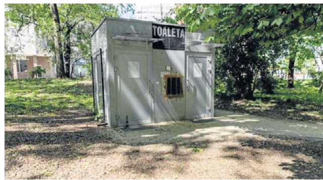
W szalecie na Plantach wandalę zniszczyli panel główny

Dał się poznać w całej Polsce. Teraz znów mogą o nim mówić wszyscy. Słynny, białostocki szalet z Plant jest nieczynny.