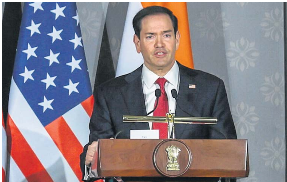
Według Rubio USA cały czas są gotowe do mediacji między Ukrainą i Rosją

Według Rubio Stany Zjednoczone pozostają też cały czas gotowe do mediacji między Ukrainą i Rosją. - USA są chętne zrobić wszystko, co w naszej mocy, aby ułatwić zakończenie tej wojny i mamy nadzieję, że