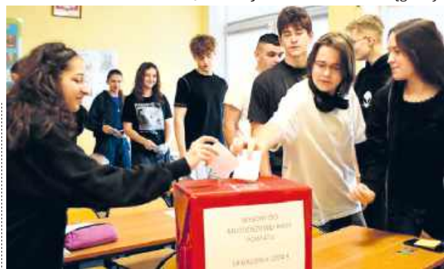
Starostwo Powiatowe w Krasnymstawie