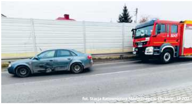
1333 fot. Stacja Ratownictwa Medycznego w Chełmie - SP 202

Skrzyżowanie, na którym doszło do zdarzenia, należy do tych, które po zmianie organiza-