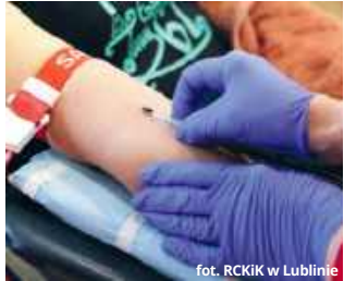
fol. RCKiK w Lublinie

Także w tym roku, w jedną niedzielę w miesiącu, będzie można oddać krew w oddziale RCKiK w Chełmie. Jego pracownicy zapraszają chętnych do podzielenia się tym cennym darem także we wszystkie pracujące dni w tygodniu.