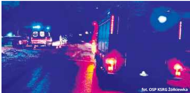
fol. OSP KSRG Żółkiewka