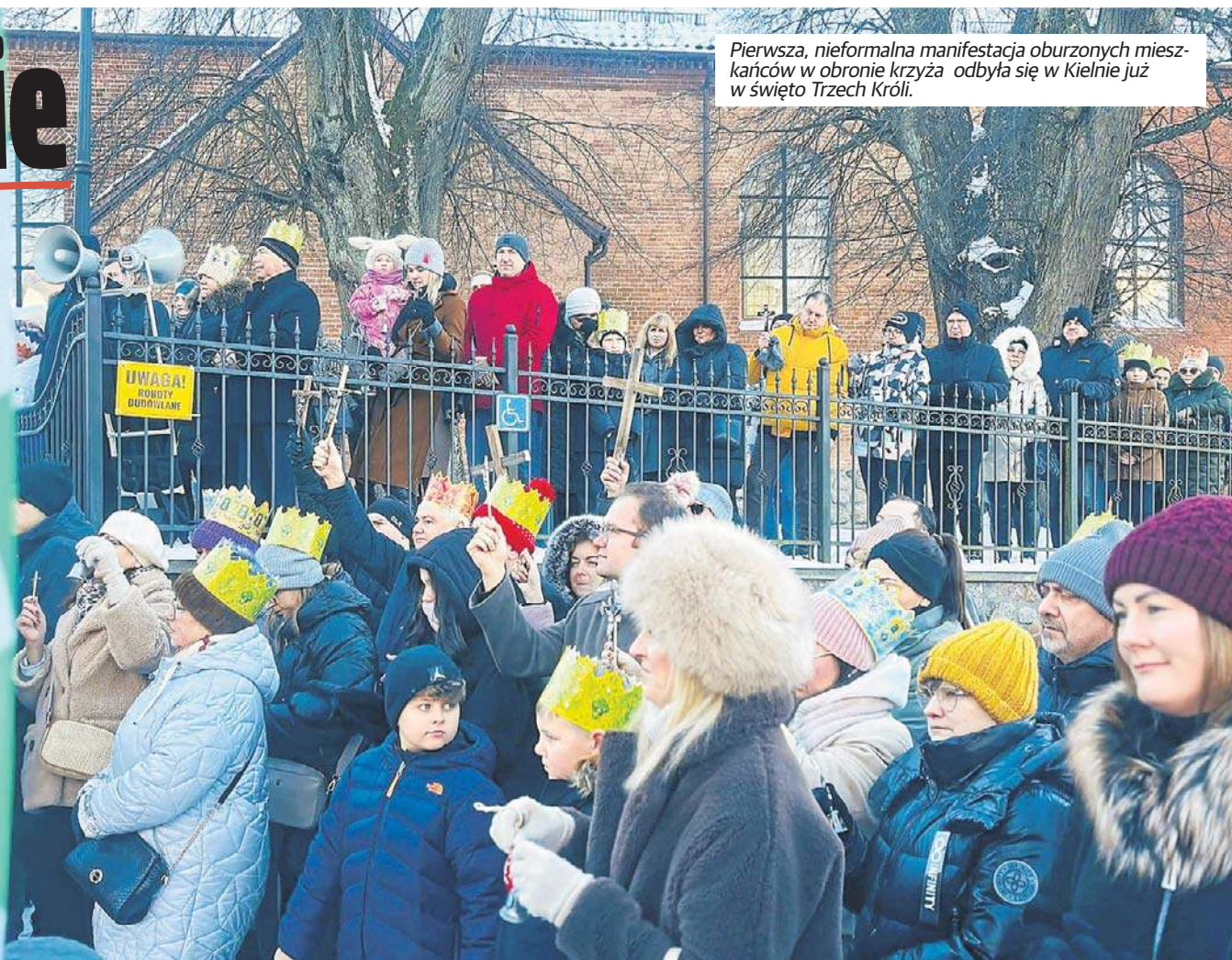
Pierwsza, nieformalna manifestacja oburzonych mieszkańców w obronie krzyża odbyła się w Kielnie już w święto Trzech Króli.

Choć z różnych stron słychać apele o wyciszenie emocji i zachowanie spokoju, sprawa krzyża w SP w Kielnie wciąż budzi emocje. W czwartek, 8 stycznia, pod szkołą zorganizowano manifestację, w której udział wzięli zarówno oburzeni mieszkańcy, jak i liczni przedstawiciele środowisk pracowniczych i politycy.