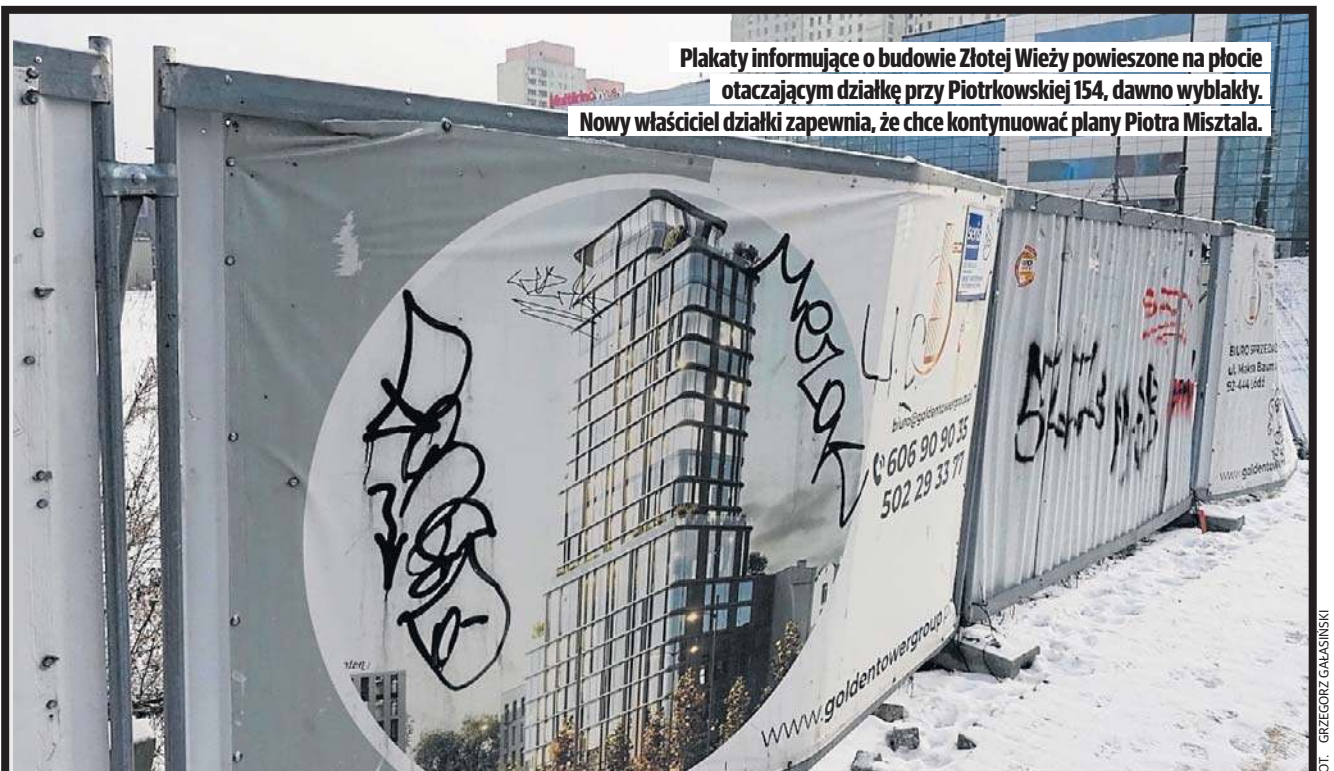
Plakaty informujące o budowie Złotej Wieży powieszone na płocie otaczającym działkę przy Piotrkowskiej 154, dawno wyblakły. Nowy właściciel działki zapewnia, że chce kontynuować plany Piotra Misztala.

Mimo zlicytowania działki przy ul. Piotrkowskiej 154 budowa wieży Golden Tower jest możliwa. Dla 72-metrowego apartamentowca wydano już pozwolenie na budowę. Wkrótce mają ruszyć rozmowy w tej sprawie.