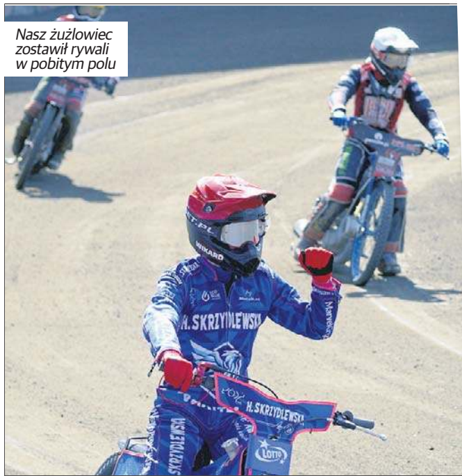
Nasz żużlowiec zostawił rywali w pobitym polu