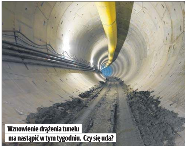
Wznowienie drążenia tunelu ma nastąpić w tym tygodniu. Czy się uda?

Niestety, od jakiegoś czasu iskrzy na styku inwestor - wykonawca, czyli PKP PLK oraz PBDiM Mińsk Mazowiecki. Dlatego nie jest pewne, czy wykonawca wznowi drążenie w wyznaczonym terminie 16 stycznia. Może to być przyczynkiem do próby zmiany wykonawcy. Wskazuje na taką ewentualność także pozostawiona w ustawie furtka, która pozwala inwestorowi na zachowanie sobie maszyny drążącej w razie rozwiązania umowy z dotychczasowym wykonawcą.