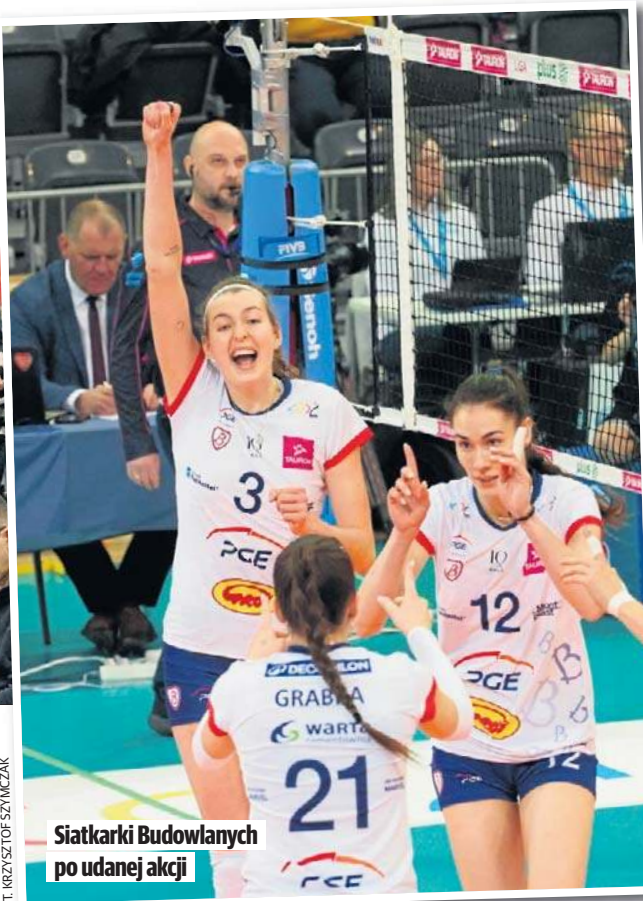
Siatkarki Budowlanych po udanej akcji