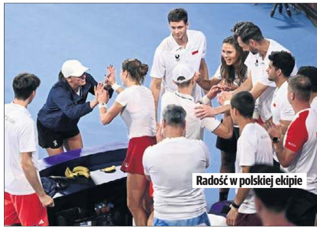
Radość w polskiej ekipie

United Cup jest sprawdzianem przed wielkoszlemowym Australian Open.