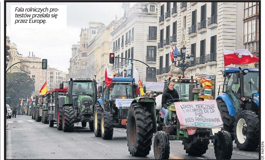
Fala rolniczych protestów przelała się przez Europę.

Porozumienie z Argentyną, Brazylią, Paragwajem i Urugwajem, które tworzą Mercosur, wprowadzi preferencje celne dla produktów rolnych, w tym produktów wrażliwych: wołowiny, drobiu, nabiału, cukru i etano-