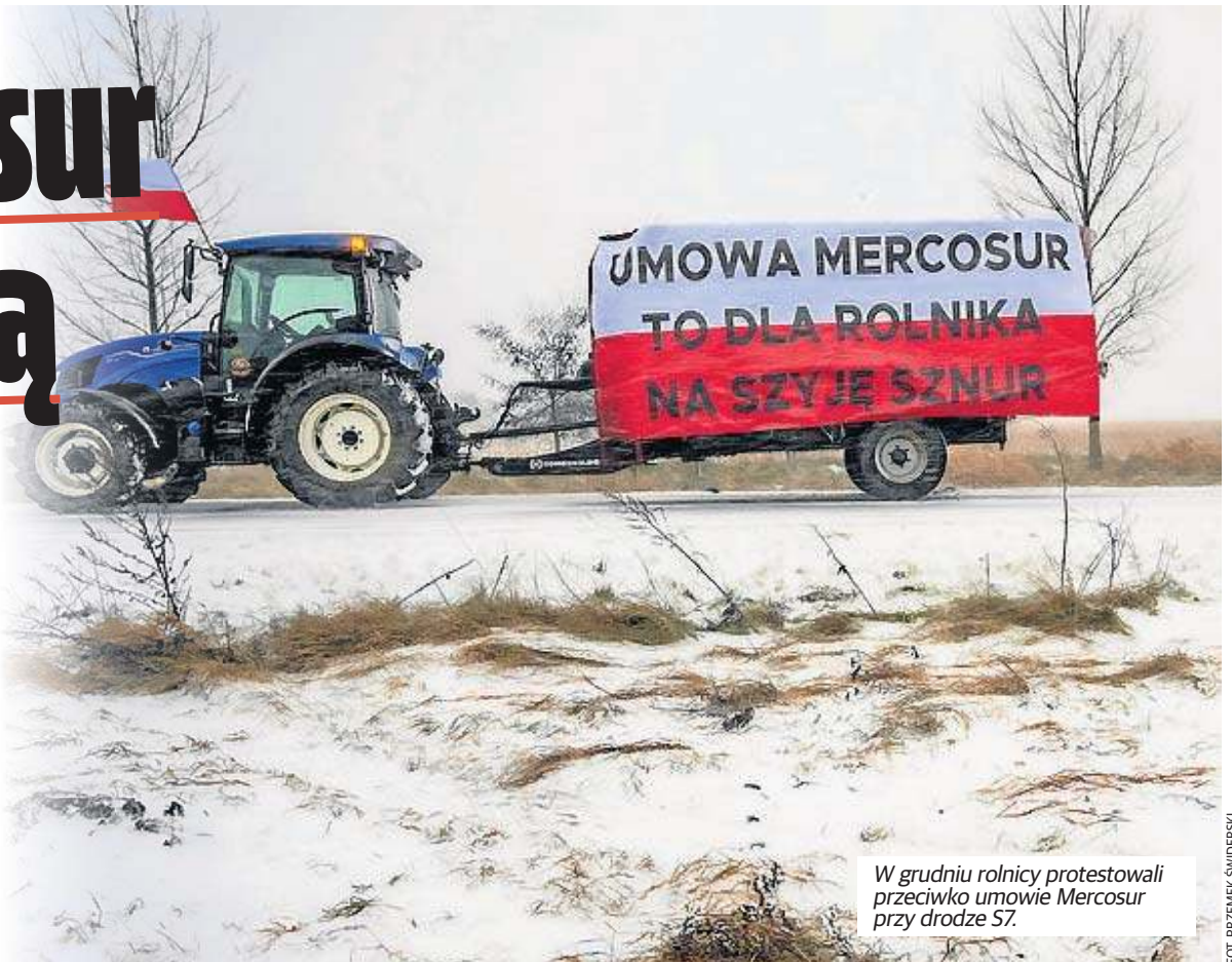
W grudniu rolnicy protestowali przeciwko umowie Mercosur przy drodze 57.