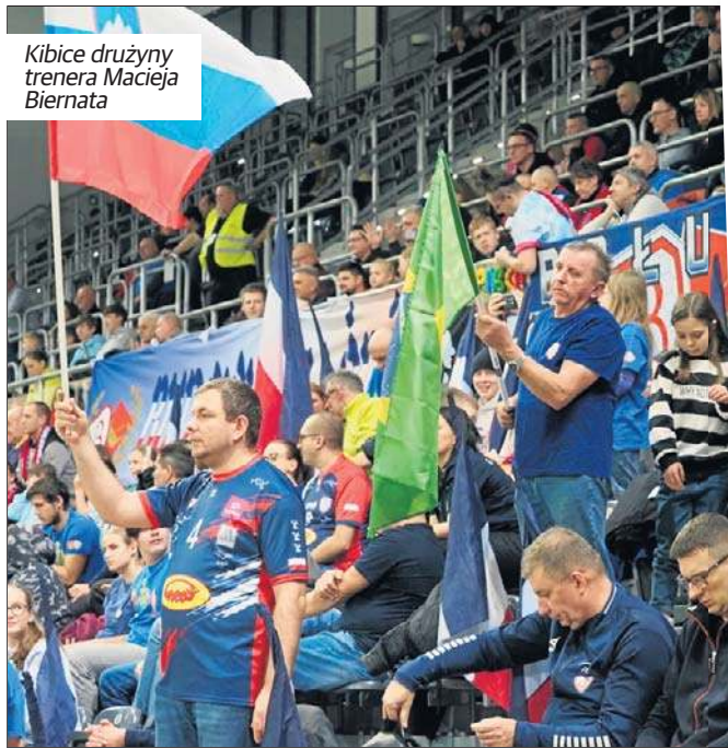
Kibice drużyny trenera Macieja Biernata