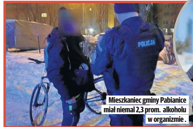
Mieszkaniec gminy Pabianice miał niemal 2,3 prom. alkoholu w organizmie.

Gdy podbiegła do 62-letniego cyklisty, wyczuła od niego woń