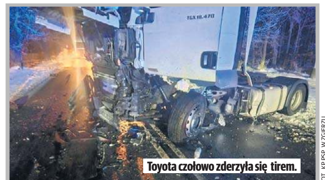
Toyota czołowo zderzyła się tirem.