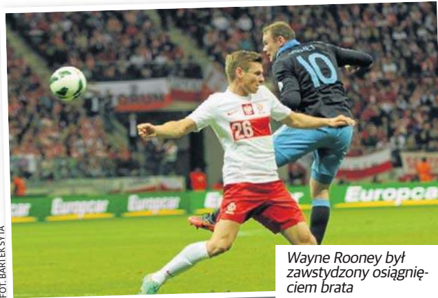
Wayne Rooney był zawstydzony osiągnięciem brata

Mecz został rozegrany na stadionie Moss Rose, gdzie wcześniej w sobotę odbył się