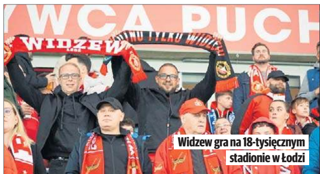
Widzew gra na 18-tysięcznym stadionie w Łodzi