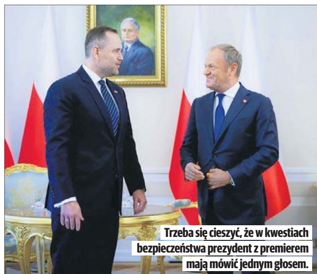
Trzeba się cieszyć, że w kwestiach bezpieczeństwa prezydent z premierem mają mówić jednym głosem.

- Ten format, który obejmuje bezpośrednie rozmowy z naszym sojusznikiem amerykańskim, z prezydentem Donaldem Trumpem to domena prezydenta Karola Nawrockiego. Natomiast udział w „koalicji chętnych”, rozmowy na poziomie europejskim to domena Donalda Tuska - przekazał.