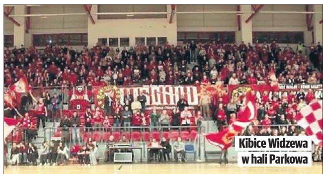
Kibice Widzewa w hali Parkowa