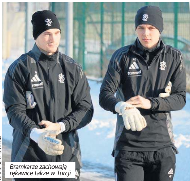
Bramkarze zachowają rękawice także w Turcji

W sobotę piłkarze pierwszoligowego ŁKS polecili na dwutygodniowe zgrupowanie do Turcji. W Side trenować będzie dwudziestu ośmiu zawodników.