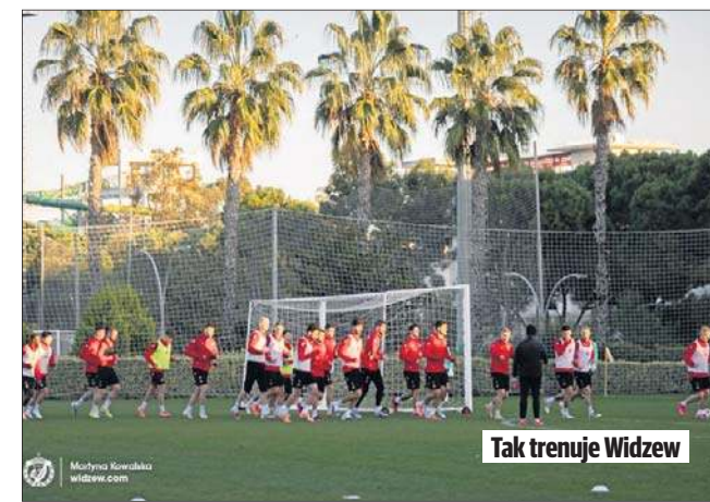
Tak trenuje Widzew