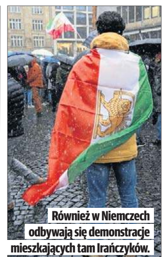
Również w Niemczech odbywają się demonstracje mieszkańców tam Irańczyków.

Według Iran International liczba zabitych jest jednak wie-