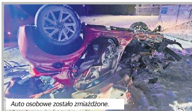
Auto osobowe zostało zmiążdżone.

Kierowca pojazdu ciężarowego był trzeźwy.