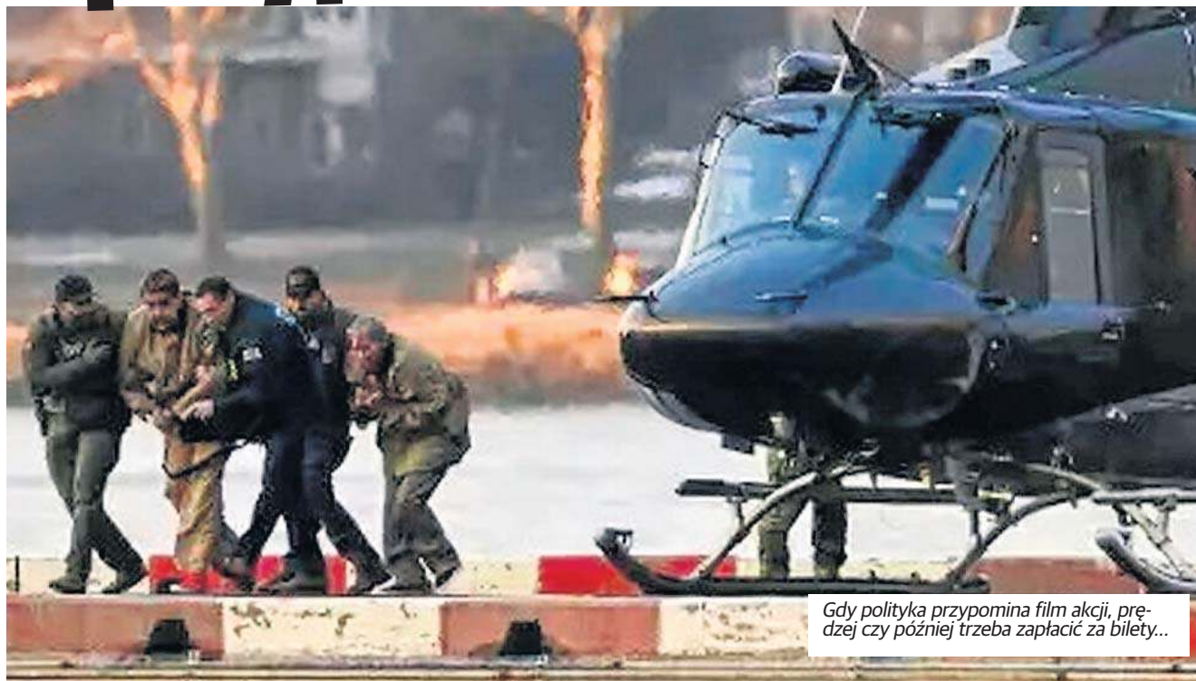
Gdy polityka przypomina film akcji, prędzej czy później trzeba zapłacić za bilety...

Dla Europy to test dojrzałości: czy potrafi mówić własnym głosem i bronić reguł, jednocześnie nie psując relacji z najważniejszym sojusznikiem. Dla Polski to przypomnienie, że geografia już nie chroni przed skutkami globalnych decyzji. Możemy być daleko od Caracas, ale nie jesteśmy daleko od cen energii, od sporów w Unii, od napięć między mocarstwami i od konsekwencji świata, w którym coraz częściej wygrywa ten, kto ma przewagę i nie ma skrupułów. A czy ta historia ma jeden prosty morał? Ma raczej ostrzeżenie: kiedy polityka zaczyna przypominać film akcji, zwykle widzowie na końcu płacą za bilety więcej, niż się spodziewali. I często nie dlatego, że film był dobry - tylko dlatego, że rachunek przyszedł w realnym życiu.