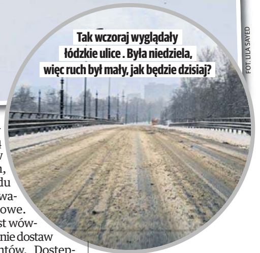
Tak wczoraj wyglądały łódzkie ulice. Była niedziela, więc ruch był mały, jak będzie dzisiaj?