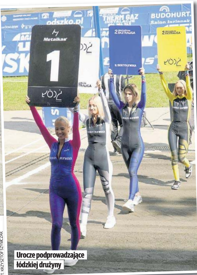
Uroczę podprowadzające łódzkiej drużyny