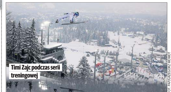
Timi Zajc podczas serii treningowej