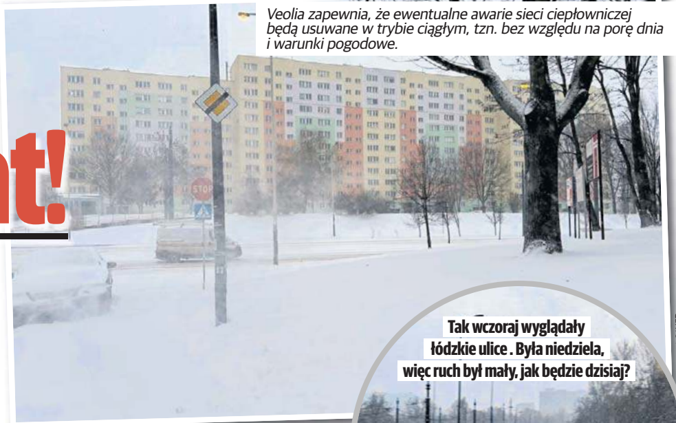
Veolia zapewnia, że ewentualne awarie sieci ciepłowniczej będą usuwane w trybie ciągłym, tzn. bez względu na porę dnia i warunki pogodowe.