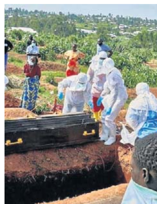
WHO ogłosiła epidemię w Kongo i Ugandzie

Lokalni lekarze twierdzą, że pacjent zero przybył do szpitala pod koniec stycznia i zmarł w lutym. „The Telegraph” donosi, że pacjent zaraził następ-