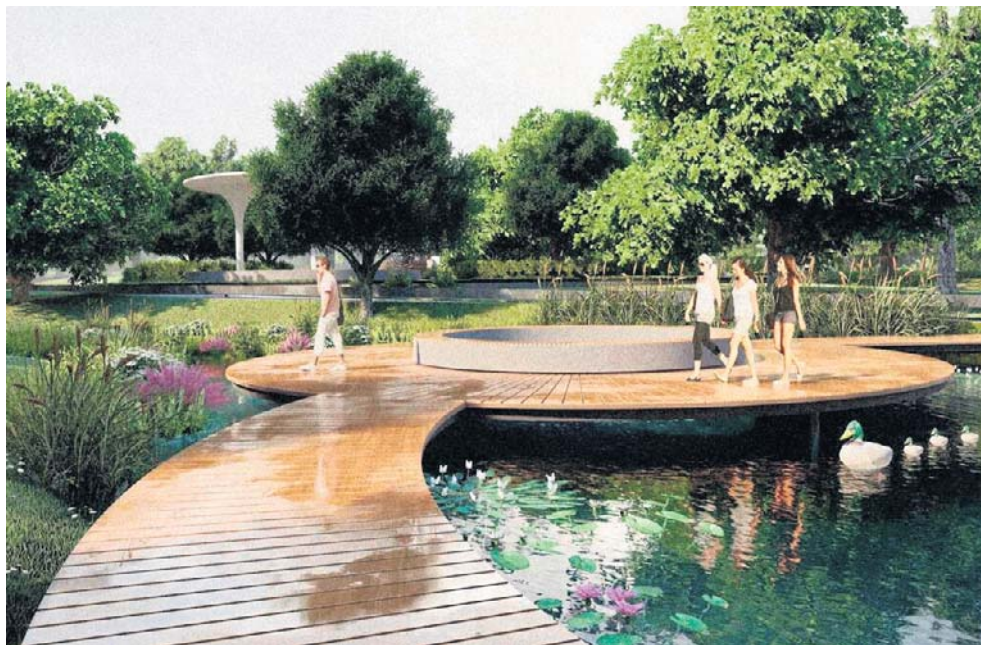
Częstochowska Promenada Niemena ma za sobą ponad 50-letnią historię. Powstała w dużej mierze dzięki pracy społecznej mieszkańców

- Promenada Czesława Niemena ma stać się miejscem dającym prawdziwy komfort - więcej zieleni, więcej cienia, więcej wody w przestrzeni publicznej - zapowiada pierwszy zastępca prezydenta Zdzisław Wolski. - Deszczówka będzie tu zatrzymywana i wykorzystywana do podlewania zieleni oraz zasilania elementów wod-