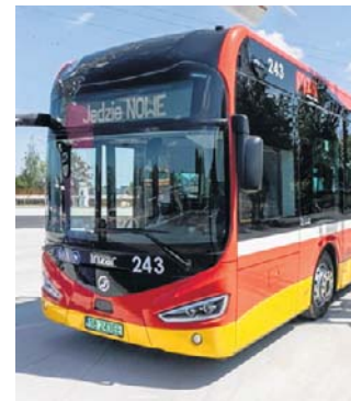
10 nowych pojazdów stoi już w zajezdni MZK

- Komunikacja miejska w naszym mieście z roku na rok przewozi coraz większą liczbę pasażerów. W 2025 roku było to 21.609.475 osób - poinformowała Emilia Klejmont z Wydziału Prawowego Urzędu Miejskiego w Bielsku-Białej.