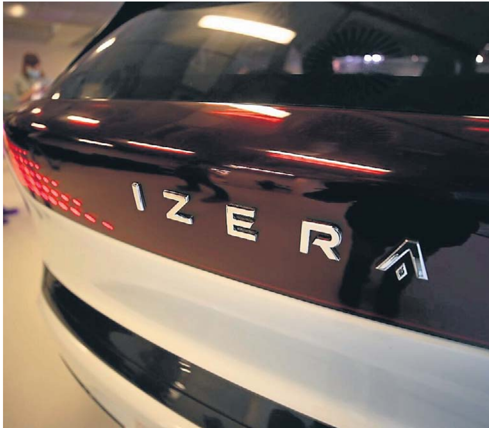
Dotychczasowa, rozpoznawalna marka pojazdu odchodzi w przeszłość

Równoległe wokół strefy przemysłowej toczą się ogromne roboty infrastrukturalne,