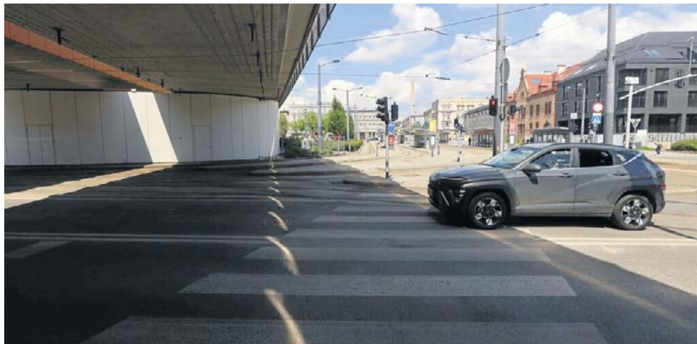
Prezydent Chorzowa uważa, że decyzja o zamknięciu obiektu była uzasadniona

Sprawie od początku towarzyszy wiele emocji i politycznych przepychanek. Estakada stała się również jednym z tematów zakończonej fiaskiem inicjatywy referendalnej w Chorzowie. W związku z infrastrukturalnym kryzysem momentami gorąco było także na linii Urząd