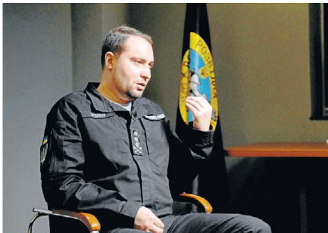
Kyrył Budanow powiedział, że Ukraina spodziewa się niebawem wizyty amerykańskiej delegacji w Kijowie

Budanow powiedział, że w najbliższym czasie może dojść do wymiany jeńców wojennych. Dodał przy tym, że trwają prace nad uwolnieniem wszystkich jeńców, w tym osób cywilnych. PAP