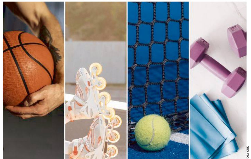
Będzie można nie tylko jeździć na rolkach, ale wybrać również inne aktywności