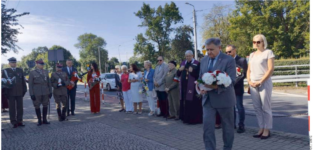
Przedstawiciele samorządowi, duchowieństwo i mieszkańcy złożyli kwiaty pod pomnikiem ofiar.