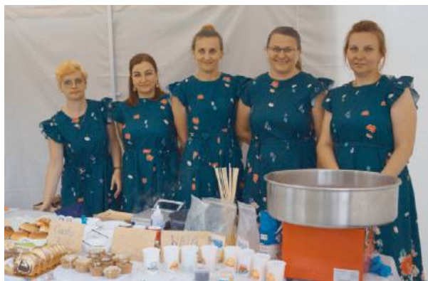
Koła gospodyń wiejskich serwowały regionalne przysmaki.

Gwiazdą wieczoru był Andrzej Rybiński, który zgromadził pod sceną głównie starszych uczestników wydarzenia. Zrobiło się koncertowo i nieco sentymentalnie... Zespół Modem zagrał z kolei covery hitów z gatunku muzyki pop-rock. Na deser usłyszeliśmy największe przeboje w wykonaniu grupy Masters. Wieczór zakończyła za-