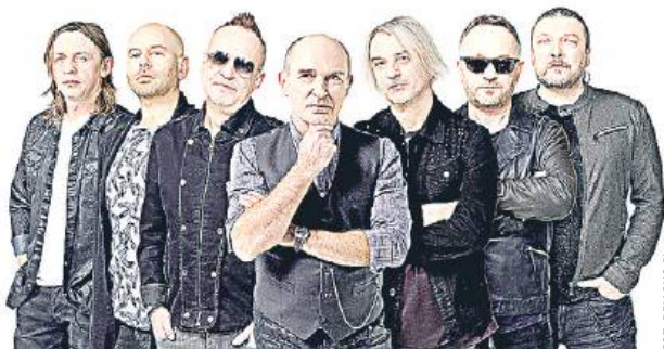
Zespół De Mono koncertuje już od 40 lat!

Na uczestników czekają liczne atrakcje m.in. jarmark produktów regionalnych, pokazy iluzjonisty, animacje taneczne, malowanie buziek, pelenie warkoczyków, konsultacje ekspertów, nauka pierwszej pomocy oraz opatrywania ran. Szczegóły i plakat na naszym portalu. PA