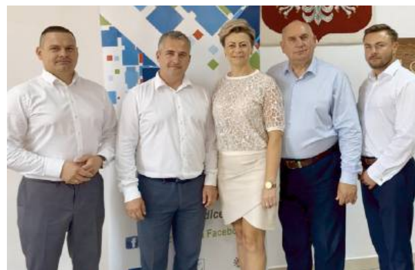
Wybory uzupełniające były ważnym punktem obrad.