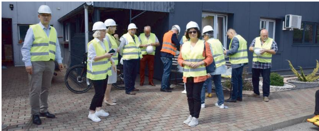
Rozmowy odbyły się przy inwestycjach związanych tematycznie ze spotkaniem

- Paliwo do napędu powyższej elektrociepłowni wytwarzane jest w biogazowni rolniczej w Grochowie. Jest nim biogaz, który po przetworzeniu w innowacyjnej i pierwszej w Polsce stacji oczyszczania, już jako biometan, tłoczony jest rurociągiem na teren elektrociepłowni przy ul. Piłsudskiego 8. Tam zasila on nowy system wytwarzania ciepła i energii elektrycznej. Biometan spalany jest w zespole kogeneracyjnym (silniku gazowym napędzającym generator z odzyskiem ciepła). Energia elektryczna i ciepło, które są wytwarzane w zespole kogeneracyjnym są zatem zaliczane