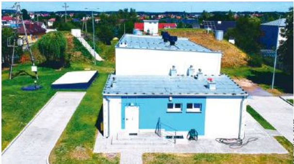
Zmodernizowane ujęcie wody w Łosicach na ul. Szkolnej.

4 lipca w Łosicach dokonano odbioru końcowego kluczowej inwestycji w infrastrukturę wodno-kanalizacyjną. Projekt, finansowany w dużej mierze z Rządowego Funduszu Polski Ład, znacząco poprawi w niedalekiej przyszłości jakość życia mieszkańców gminy.