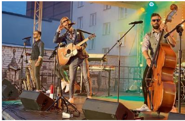
Artyści koncertują już od lat, zdobywając uznanie na całym świecie.

Orkiestra wjechała na scenę pod muralem na rowerze.