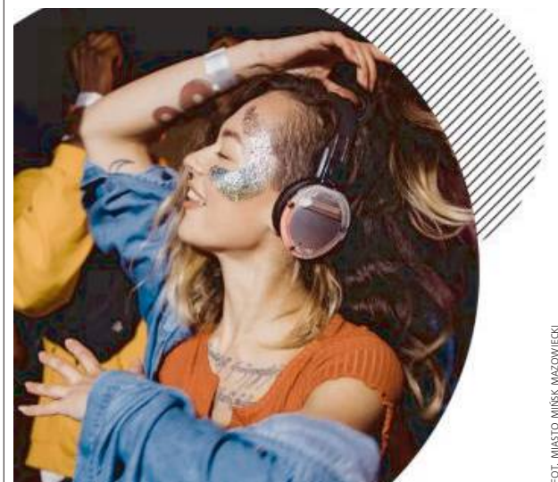
To Ty decydujesz co jakiej muzyki się bawisz...

3 kolory słuchawek, 3 kanały, to Ty wybierasz do jakiej muzyki zatańczysz! Wystąpi DJ Zmywak. Wstęp wolny. Taras MDK Mińsk Mazowiecki. Ważne! Trzeba mieć przy sobie dokument potwierdzający tożsamość.