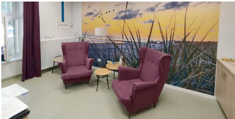
Odnowione wnętrza zostały zaprojektowane z myślą o stworzeniu przyjaznej i bezpiecznej atmosfery.

Odnowione wnętrza zostały zaprojektowane z myślą o stworzeniu przyjaznej i bezpiecznej atmosfery dla osób zmagających się z problemami natury psychologicznej. Pomieszczenia są przestronne, pełne przyjaznych kolorów i wyposażone w nowoczesne meble.