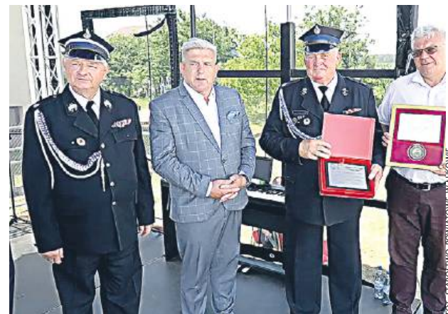
Niedzielnny jubileusz był okazją do uhonorowania wyróżniających się druhów oraz instytucjom i osobom, wspierającym OSP Turze Rogi.