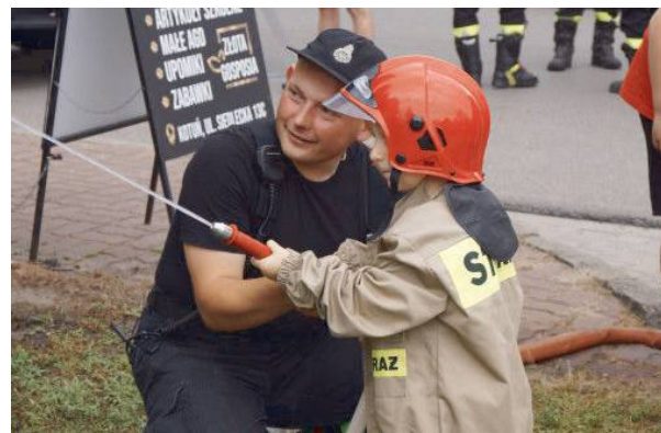
Najmłodszy gasił pożar i ratował misia!

W realizacji przedsięwzięcia Gminę Kotuń wspierała Gmina Biblioteka Publiczna w Kotuniu. Współorganizatorem wydarzenia był Samorząd Woj-