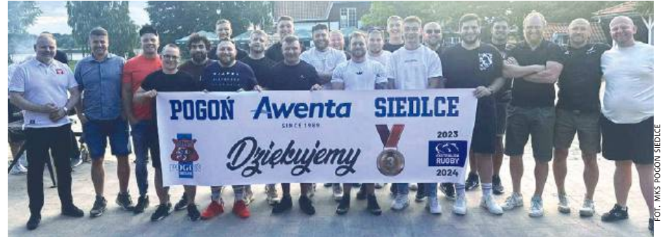
Brązowa Pogon Awenta Siedlce będzie miała liczną reprezentację w kadrze Polski.

Dzieci i młodzież z siedleckich klubów Pogon i Miejski Klub Rugby wróciła z obozu sportowego w Elku. Przez osiem dni grupa ponad osiemdziesięciu zawodniczek i zawodników w kategoriach mikrus, mini żak, żak, młodzik i kadet pod okiem ośmiu trenerów grała w rugby, rozwijała swoje umiejętności, bawiła się i wypoczywała. Do południa młodzi adepci rugby dzielnie trenowali, a po