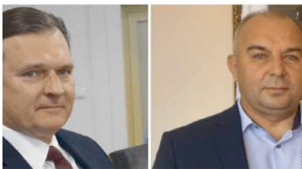
Neoficjalni kandydaci na stanowisko zastępcy prezydenta.

Pozostało nam jedynie zaczekać. Prawdopodobnie wszystko rozstrzygnie się koniec lipca, początek sierpnia. ID