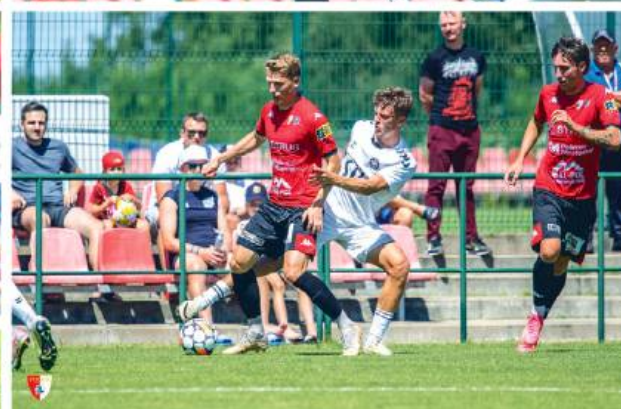
Po porażce w Łęcznej, Pogon w kolejnym sparingu minimalnie przegrała u siebie z Polonią. Trafiali dla siedlczan Pyrdół i Demianiuk.