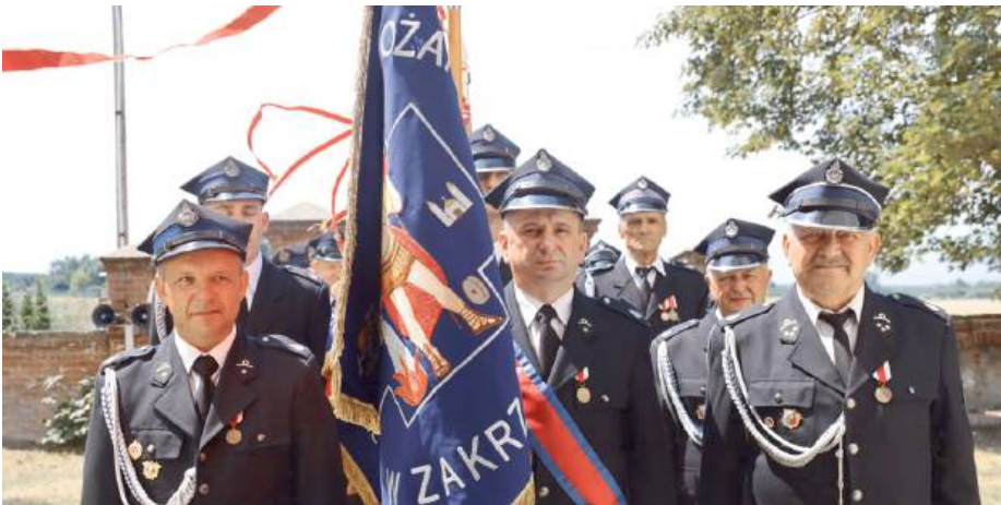
Poczet sztandarowy jubileuszowej OSP