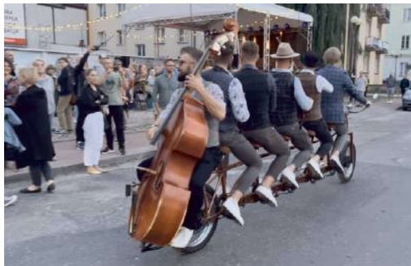
Orkiestra wjechała na scenę pod muralem na rowerze.