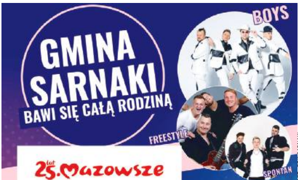
Niedziela 14 lipca zapowiada się w Sarnakach ciekawie.

Od samego rana organizatorzy przygotowali bogaty program dla dzieci. W planach są animacje, zabawy artystyczne oraz konkursy sprawności-