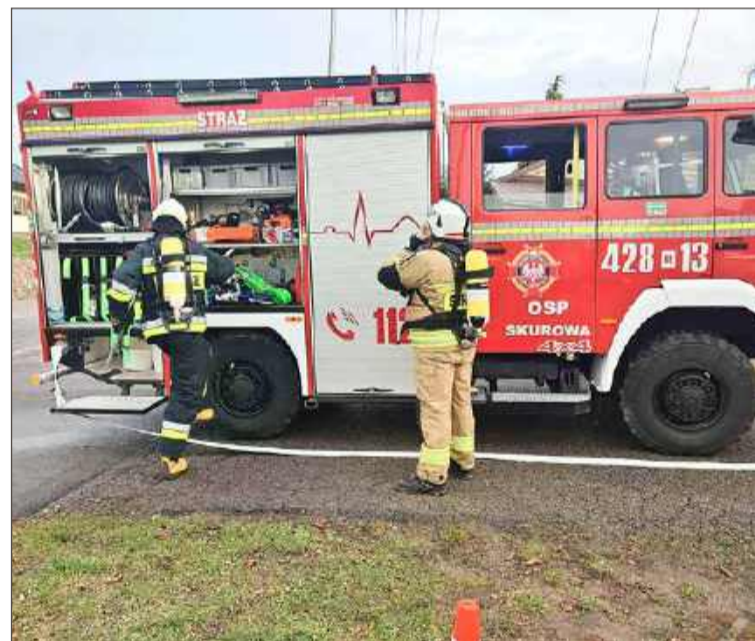
Do druhów trafił sprzęt o wartości blisko 20 tys. zł.