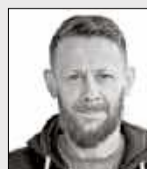
krol@ol.com.pl tel. 14 670 27 87