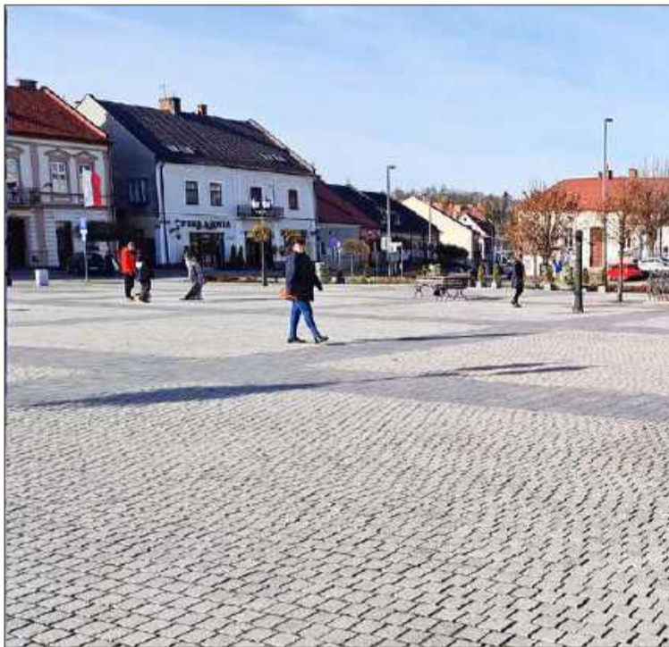
Obecnie Rynek w Pilźnie to przede wszystkim kostka.

Donice, jak również zapowiedział wóldarz, będzie można przенести