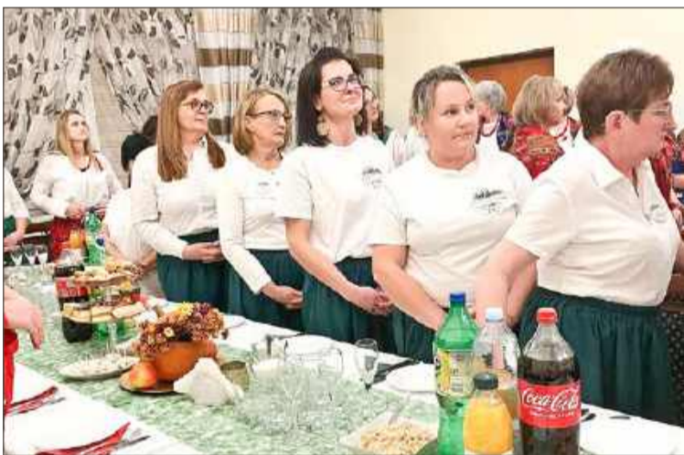
Członkinie KGW Aktywna Chotowa świętowały swój jubileusz.

Na pierwszych, szczególnie na kiermaszu wielkanocnym, zbierali jeszcze doświadczenie, bo wszystko było dla nich nowe. Ale z każdą następną imprezą prezentowali się coraz lepiej, także wizerunkowo, bo w międzyczasie dzięki pieniądząm pozyskanym z ARiMR udało się kupić jednakowe koszulki z logo Aktywnej Chotowej i spódnice dla pań.