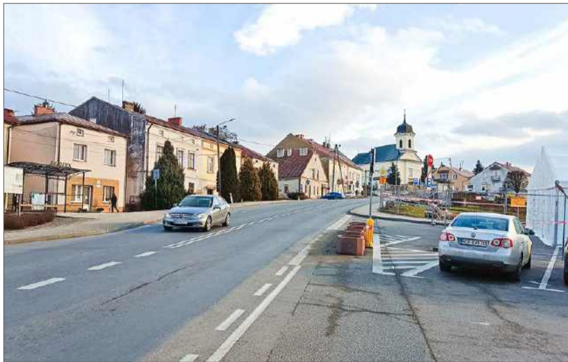
Wygląda na to, że na budowę obwodnicy mieszkańcy Brzostku poczekają dłużej, niż planowano.

Obwodnica ma być jedną z dwóch, które powstaną w ciągu drogi krajowej nr 73. Pierwsza prawdopodobnie gotowa będzie obwodnica Pilzna.