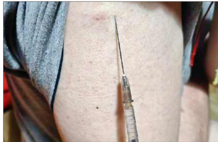
Wśród osób, które chętnie się szczepią, przeważają seniorzy.