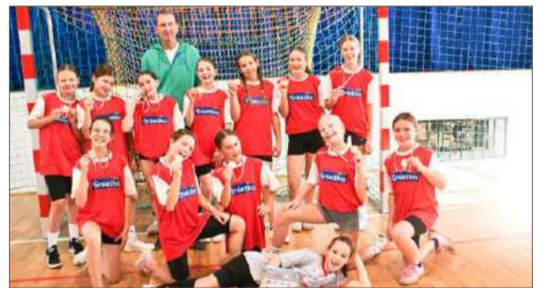
Dzięki zwycięstwu szczypiornistek SP 9 awansowała na drugie miejsce w klasyfikacji medalowej Dębickich Igrzysk Dzieci.