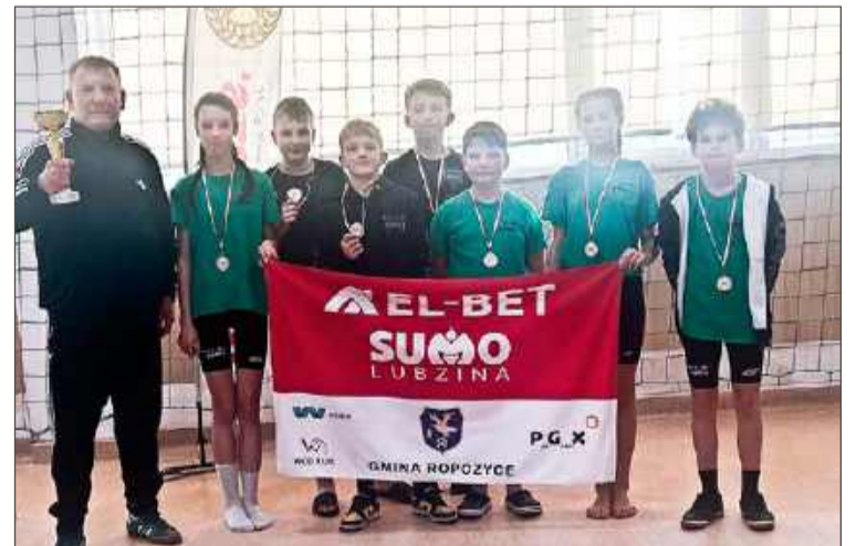
W Siedlcach piątklasiści z Lubziny spisali się na siedem medali.