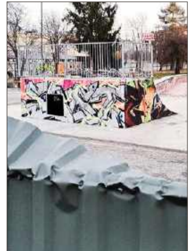
Na razie skatepark otoczony jest metalowym ogrodzeniem.

Choć właśnie na to pierwsze rozwiązanie liczyły osoby mieszkające obok skateparku.