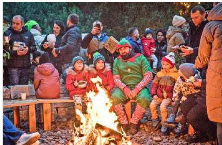
Te wydarzenia mają wyjątkową atmosferę. Warto uczestniczyć.