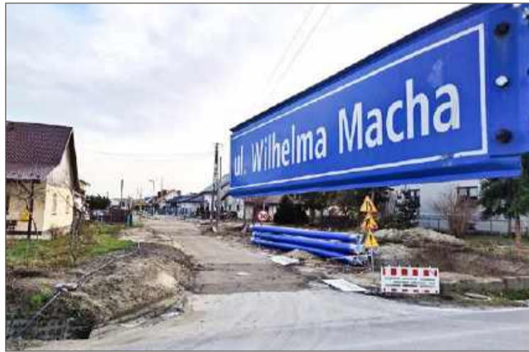
Ul. Macha podzielona jest na tych co mają kanalizację i tych co jej nie mają.

Tymczasem zgodnie z obowiązującymi zasadami budowa sieci kanalizacyjnej na obszarze aglomeracji, czyli obszarze składającym się z jednego większego miasta i otaczających go miejscowości, powinna być uzasadniona ekonomicznie i technicznie. Wskaźnik koncentracji nie może być mniejszy niż 120 stałych mieszkańców i osób czasowo tam przebywających na 1 km planowanej do budowy sieci. Dla terenów górzystych może to być 90 osób. Tymczasem na odcinku, o którym mowa, ten wskaźnik wynosi 35 osób, a koszt takiej inwestycji, według kosztorysu inwestorskiego z 2024 roku, to około 2,1 mln zł netto.