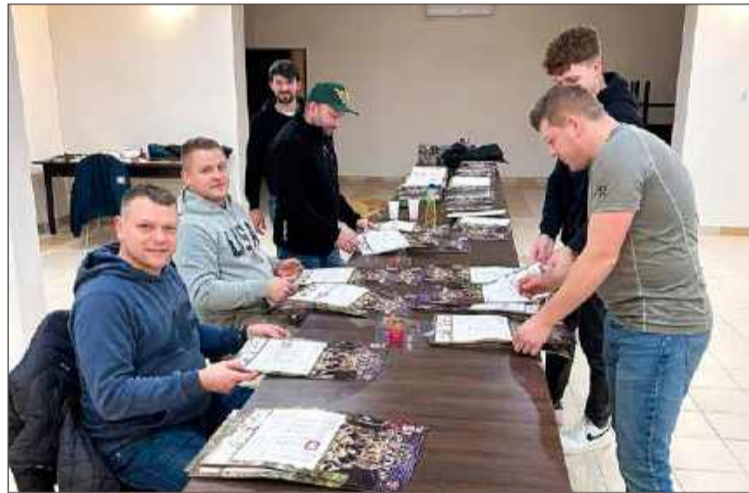
Strażacy z OSP KRSG Łęki Dolne tuż przed akcją kalendarzową.

Ale nie to, jak wygląda kalendarz, choć to także ważne, jest jednak najważniejsze. Największe znaczenie ma fakt, że za pieniądze z przepro-