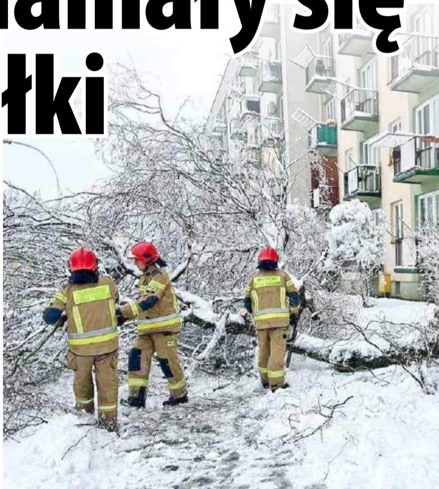
Dębica: drzewo przewróciło się na chodnik. Takich zgłoszeń strażacy mieli wiele.