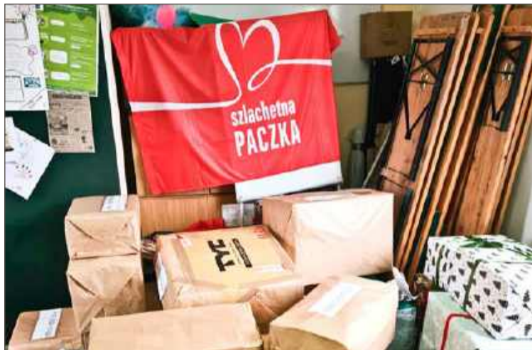
Kolejny raz w powiecie organizowana jest akcja Szlachetna Paczka.

Grzejnik olejowy, ciśnieniomierz OMRON i rotor do ćwiczeń chciałaby z kolei otrzymać 57-letnia pani