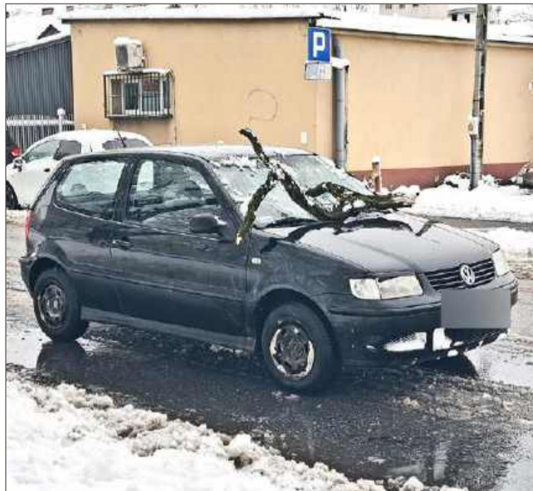
W Dębicy gałąź spadła na samochód, uszkodzony został kierowca.

Ten tydzień nie będzie rozpieszczał pogodą, synoptycy przewidują