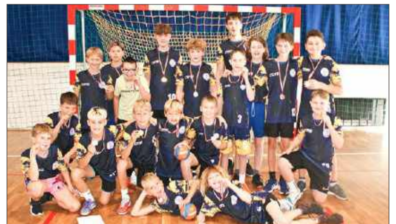
W rywalizacji chłopców najlepsi okazali się zawodnicy z Piątki.