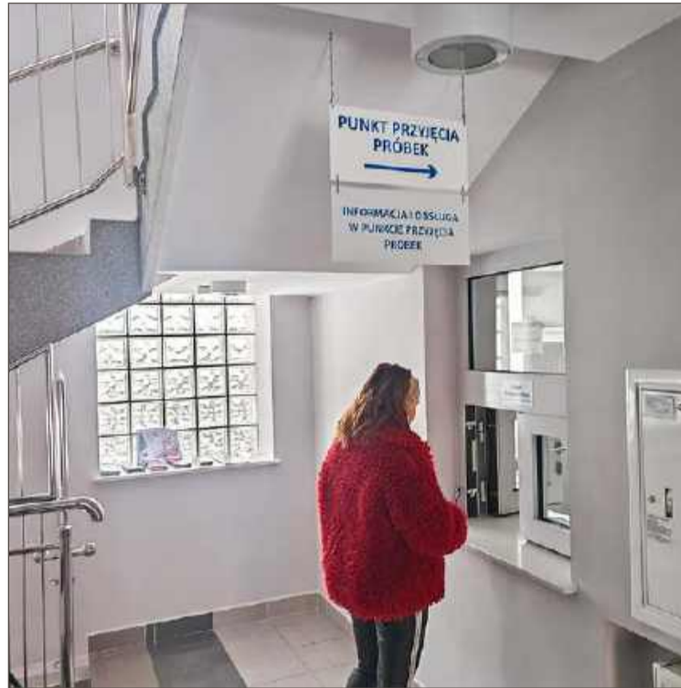
Sprawę trzeba zgłosić na dole, w punkcie przyjmowania próbek.