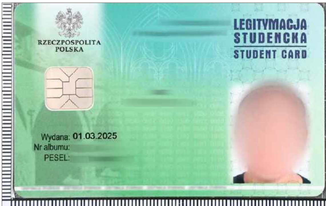
Taką legitymacją uczelni wyższej posługiwali się obywatel Kolumbii.

- Cudzoziemcy usłyszeli już zarzuty posłużenia się fałszywymi dokumentami. Mundurowi prowadzą w tej sprawie dalsze czynności - informuje Bieszczadzki Oddział Straży Granicznej.