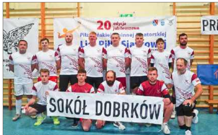
Liderem po trzech kolejkach jest ekipa Sokola Dobrków.