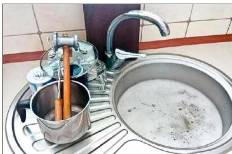
Już wkrótce płynne nieczystości z wielu domów w powiecie trafią nie do szamb, ale do przydomowych oczyszczalni ścieków.

Gmina Brzostek pomaga mieszkańcom w budowie przydomowych oczyszczalni ścieków dzięki dwóm projektom. W tym dofinansowanym z Europejskiego Funduszu Rozwoju Regionalnego deklaracje złożyło 298 osób. Zakwalifikowanych zostało 24 z Kamienicy Górnej i jedna w Woli Brzostockiej. Był on skierowany do mieszkańców, którzy mają domy na terenie Czarnorzecko-Strzyżowskiego Parku Krajobrazowego.