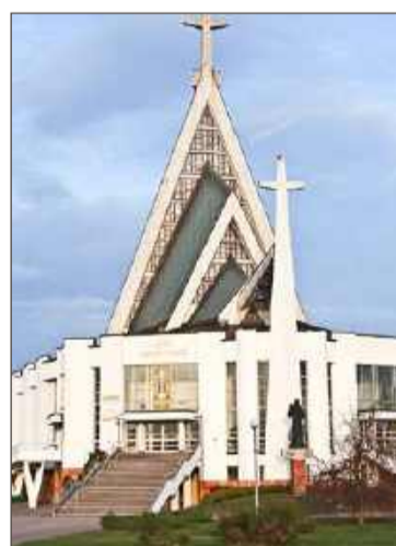
Prace w kościele ruszą, kiedy uda się zebrać całą potrzebną kwotę.

Korzystają z niej nie tylko zainteresowani z parafii Miłosierdzia Bożego, ale też z wielu miejscowości koło Dębicy. Żeby odświeżyć