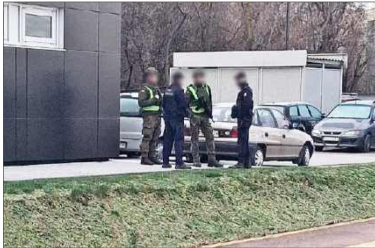
Przy dworcu PKP w Dębicy można natknąć się na żołnierzy z długą bronią.

Dodaje, że teren należący do spółki jest patrolowany przez funkcjonariuszy Straży Ochrony Kolei, żołnierzy WOT, policję oraz Straż