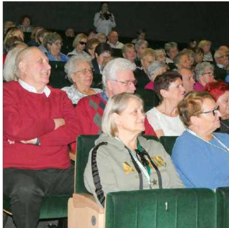
Podczas konferencji sala kinowa Śnieżki wypełniła się w całości.