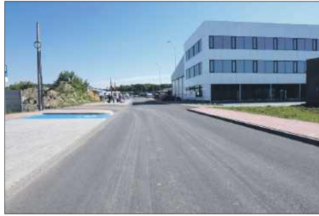
Ul. Raclawicka po remoncie.

– To inwestycja nie tylko estetyczna, ale przede wszystkim funkcjonalna i trwała, spełniająca nowoczesne standardy drogowe. Szczególnie cieszy fakt, że jest to kolejna inwestycja drogowa oddana w terminie od początku tej kadencji samorządu. Czas realizacji wyniósł 10 miesięcy co jest bardzo dobrym