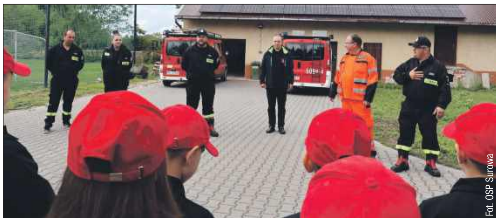
Szkolenie z pierwszej pomocy.