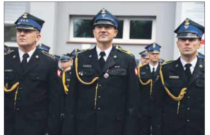
Kulminacyjnym momentem obchodów było wręczenie medali, odznaczeń oraz awansów.