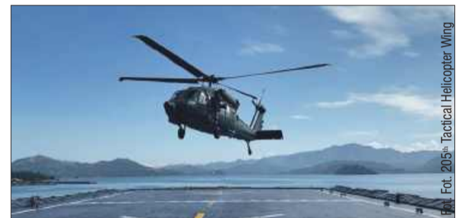
Black Hawk po raz pierwszy wylądował na pokładzie filipińskiego okrętu marynarki wojennej.

karpacia są z powodzeniem wykorzystywane na tak odległym i wymagającym obszarze, jakim są Filipiny, to ogromny powód do dumy dla całego zespołu PZL Mielec. Jak podkreślają przedstawiciele firmy, to nie tylko