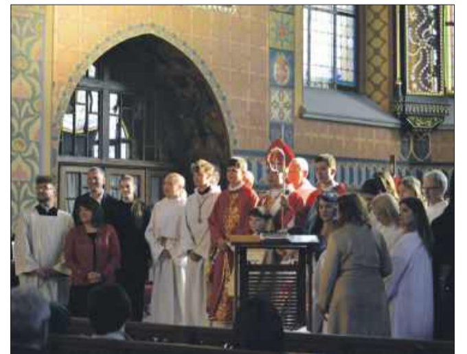
Z okazji Dnia Matki odbył się spektakl pt. „Tajemnica Eucharystii” w wykonaniu Parafialnej Grupy Teatralnej „Pomimo” z Szymbarku.