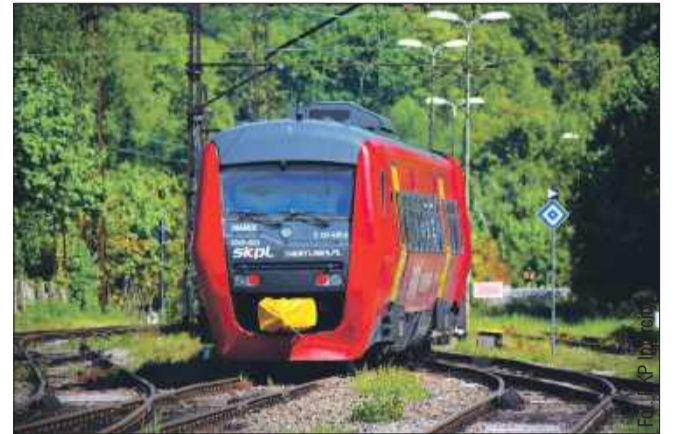
Od wakacji PKP Intercity uruchomi połączenie IC Kasztelan relacji Kraków Główny - Hrubieszów Miasto - Kraków Główny.

Od 15 czerwca 2025 roku na trasie Hrubieszów – Kraków pojawi się drugie codzienne połączenie kolejowe. PKP Intercity uruchomi nowy pociąg dalekobieżny IC Kasztelan, który połączy wschodnią część województwa lubelskiego z Małopolską. Połączenie będzie stałym elementem rozkładu jazdy i uzupełni dotychczasowy kurs pociągu IC Hetman.