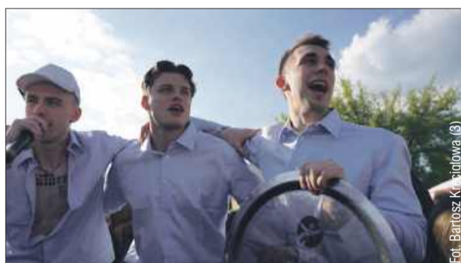
Zawodnicy celebrowa wraz z kibicami