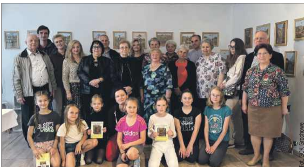
Florografy wzbudziły ogromne zainteresowanie i zachwyt odwiedzających.