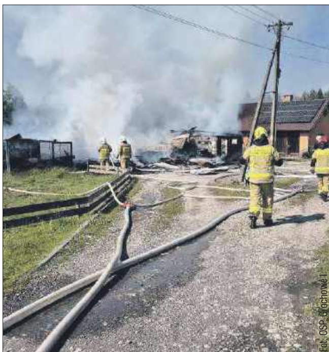
PK Splotnął duży budynek gospodarczy.

Na szczęście w zdarzeniu nikt nie odniósł obrażeń.