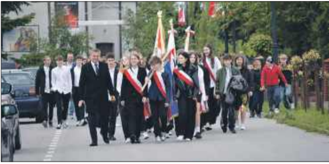
Po Mszy uczestnicy przemaszewali pod pomnik generała Władysława Sikorskiego.

20 maja uroczysto obchodzono 144. rocznicę urodzin patrona Szkoły Podstawowej w Tuszowie Narodowym – wybitnego Polaka, męża stanu i bohatera narodowego. Był to dzień pełen wzruszeń, dumy