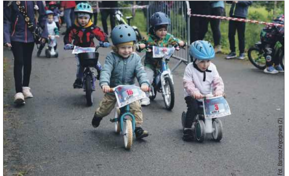
Rywalizacja młodych zawodników

Po najmłodszych przyszła kolej na starsze grupy wiekowe. Dla nich przygotowano dłuższe trasy – najpierw wokół górki, a dla najbardziej doświadczonych zawodników także trasa