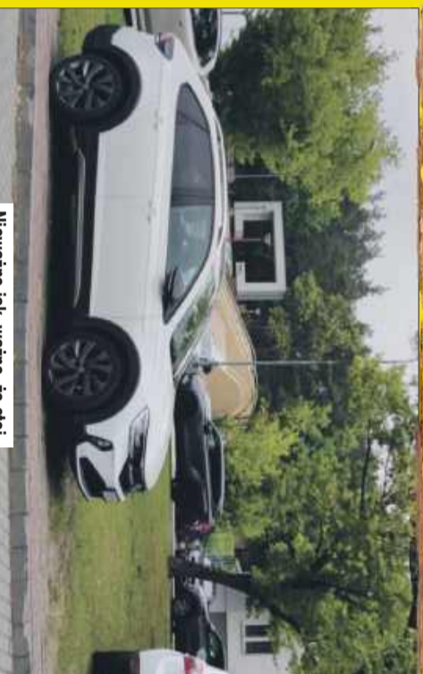
Nieważne jak, ważne, że stoi.