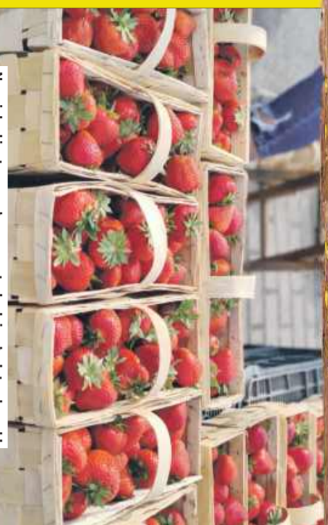
Na mieleckim targu pełno soczystych, dojrzałych truskawek!