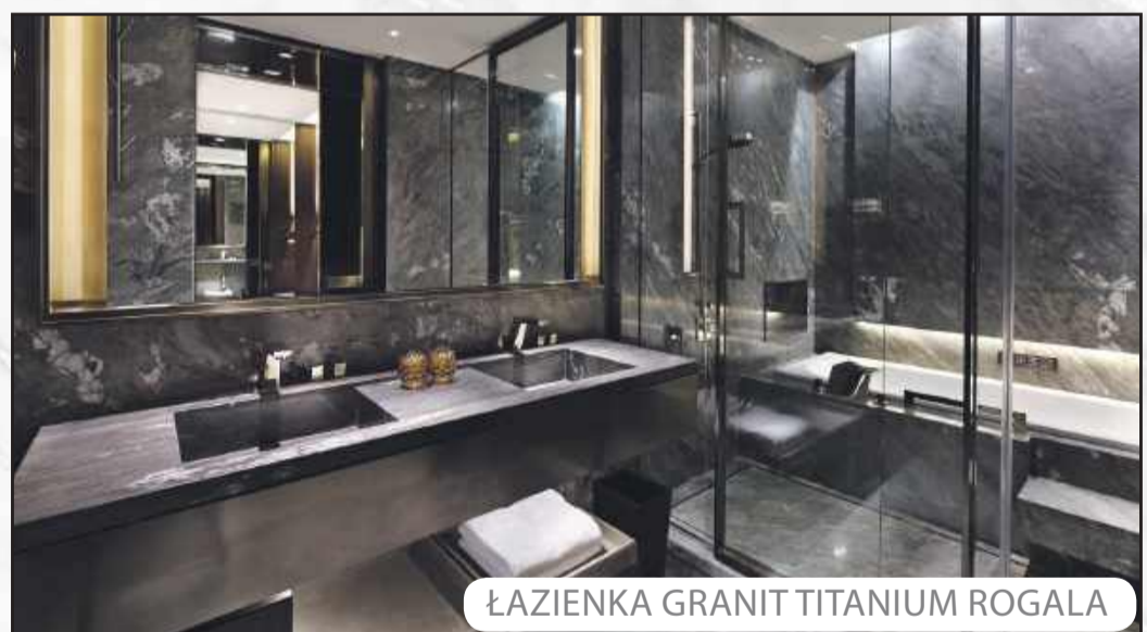
ŁAZIENKA GRANIT TITANIUM ROGALA

PŁYTKI GRANITOWE Z CAŁEGO ŚWIATA TANIEJ NIŻ MYŚLISZ!