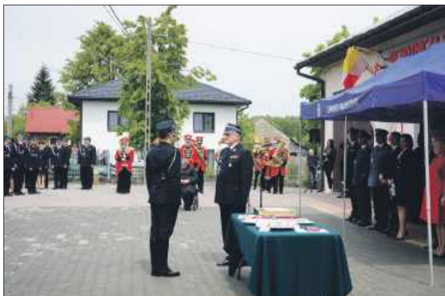
Uroczystości OSP Podole.