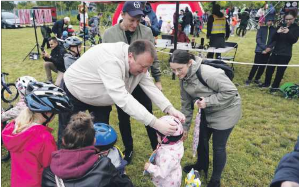
Wszyscy uczestnicy dostali pamiątkowe medale