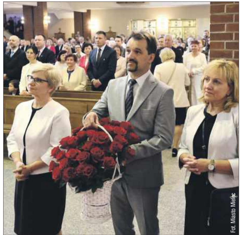
Wierni z mieleckiej parafii złożyli kapłanowi podziękowania za 40 lat posługi duszpasterskiej.