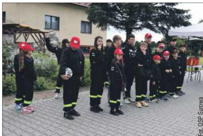
Uratuj życie - warsztaty MDP.

W sobotę 24 maja na terenie plebani w Górkach odbyły się wyjątkowe warsztaty z zakresu pierwszej pomocy dla Młodzieżowych Drużyn Pożarniczych, organizowane pod hasłem „MAJ – miesiącem tamowania krwotoków”. Udział wzięło 60 dzieci plus opiekunowie. Uczestnikami warsztatów były Młodzieżowe Drużyny Pożarnicze: MDP Surowa/Górki, MDP Gliny Małe, MDP Trzciana.