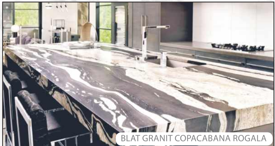
BLAT GRANIT COPACABANA ROGALA

NAJWIĘKSZY WYBÓR KAMIENIA NATURALNEGO W POLSCE PONAD 200 KOLORÓW NAJWYŻSZEJ JAKOŚCI