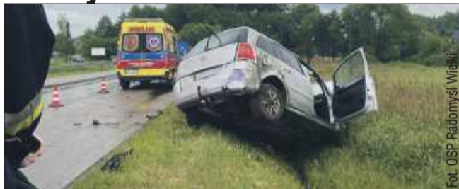
Na szczęście w zdarzeniu nikt nie odniósł poważnych obrażeń.

W środę po południu służby ratunkowe zostały zadysponowane do zdarzenia drogowego, które miało miejsce w Radomyślu Wielkim, przy ul. Armii Krajowej. Zgłoszenie dotyczyło wypadku z udziałem jednego pojazdu osobowego.