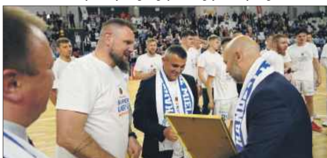
Handball Stal Mielec nagrodzona przez prezydenta

ping, wsparcie i niezłomna wiara odegrały ogromną rolę w tym sukcesie. Symboliczne „piątki” z trybunami to nie tylko gest – to