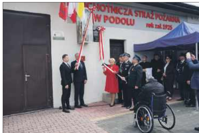
OSP Podole ma już 100 lat.

W sobotę, 24 maja, odbyła się ważna dla Ochotniczej Straży Pożarnej w Podolu uroczystość: 100-lecie istnienia jednostki.