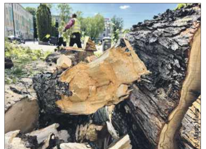
Drzewa były w bardzo złym stanie.

W trosce o bezpieczeństwo mieszkańców podjęto decyzję o usunięciu dwóch drzew rosnących na Placu Armii Krajowej w Mielcu. Ekspertyzy dendrologiczne i oględziny wykazały, że oba drzewa znajdowały się w bardzo złym stanie zdrowotnym – z licznymi ubytkami w pniach, oznakami rozkładu oraz uszkodzeniami systemu korzeniowego. Ich dalsze pozostawienie mogło stanowić poważne zagrożenie dla osób korzystających z przestrzeni placu, zwłaszcza w okresie silnych wiatrów i niekorzystnych warunków pogodowych. – Zapewnienie bezpieczeństwa mieszkańcom