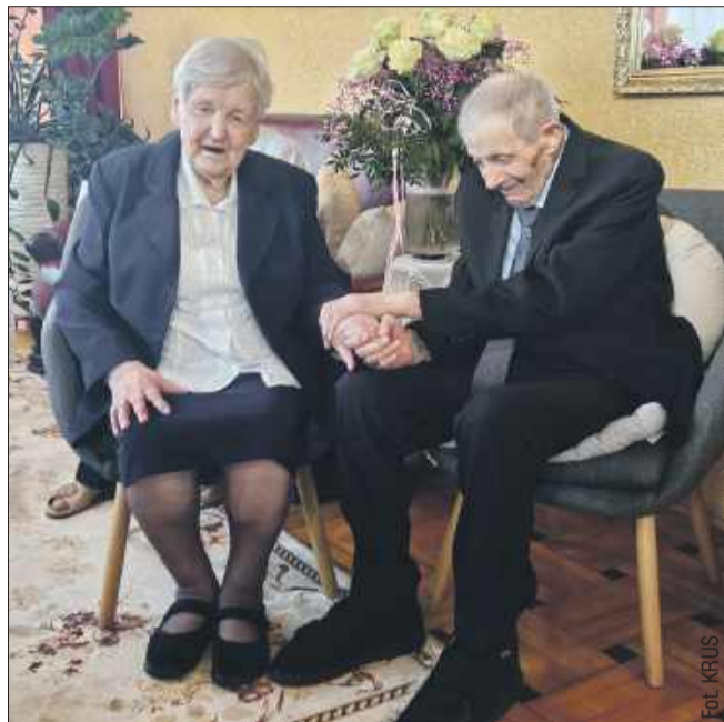
Małżonkowie przez całe życie mieszkali w Dębianach.

– Dziadkowie są pogodni, godzą się z niedogodnościami, jakie przyniosła im starość. Wychowałam się na opowieściach dziadków o wojnie, a potem ich