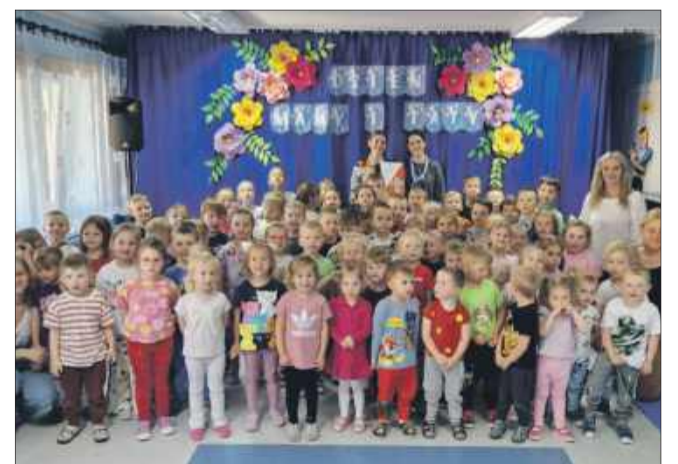
Harcerze z Hufca ZHP w Mielcu odwiedzili Przedszkole Miejskie nr 13 w Mielcu.

26 maja przedszkolaki z „Trzynastki” w Mielcu miały wyjątkowych gości – odwiedzili ich harcerze z Hufca ZHP Mielec.