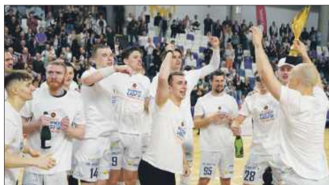
Za rok w Mielcu będziemy mogli oglądać rozgrywki Superligi

Po zakończeniu ceremonii zawodnicy poszli dziękować kibicom, którzy przez cały sezon stali murem za drużyną. Ich do-