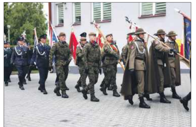
Uroczystości towarzyszyła imponująca oprawa ceremonialna.