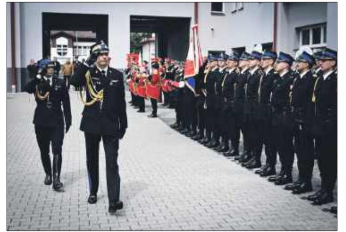
Obchody stały się również okazją do oficjalnego otwarcia i poświęcenia zmodernizowanej siedziby Komendy Powiatowej PSP w Mielcu

Uroczystości towarzyszyła imponująca oprawa ceremonialna: obecność pocztów sztandarowych i kompanii honorowych Państwowej Straży Pożarnej, Policji, Straży Granicznej, Wojska Polskiego, Służby Więziennej, Krajowej Administracji Skarbowej oraz Ochotniczych Straży Pożarnych. Całości dopełniła oprawa muzyczna w wykonaniu