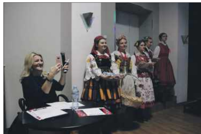
Przygotowania do występów.