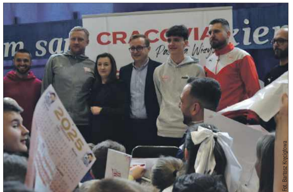
Wielokrotny reprezentant Polski - Kamil Glik