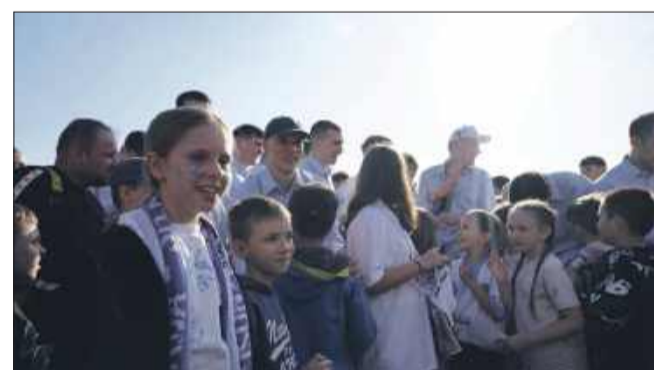
Młodzi kibice Stali

Handball Stal Mielec zakończyła sezon z przytupem. Po ostatnim meczu zawodnicy wraz z kibicami przenieśli się na błonia MOSiR, gdzie wspólnie świętowali udany sezon przy muzyce, dmuchańcach dla dzieci i dobrej atmosferze.