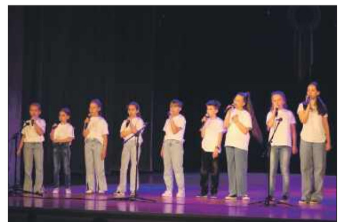
Młodzi artyści na scenie.