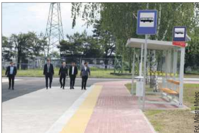
Zmodernizowana pętla przy Al. Ducha Świętego pełni funkcję przystanku początkowego i końcowego dla miejskich linii autobusowych.

Zmodernizowana pętla przy Al. Ducha Świętego pełni funkcję przystanku początkowego i końcowego dla miejskich linii autobusowych. Przestrzeń została zaprojektowana z myślą o nowoczesnej komunikacji zbiorowej – uwzględniając zarówno bezpieczeństwo kierowców, jak i komfort pasażerów. Nowa infrastruktura umożliwia sprawne zawracanie oraz wygodny postój autobusów.