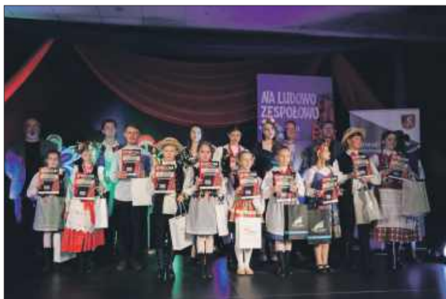
Zwycięzcy w kategoriach dziecięcych.