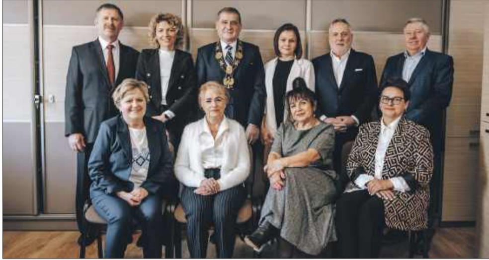
Zarząd i pracownicy Cechu Rzemiosł Różnych w Mielcu.

Kształcenie dualne to kluczowy element przygotowania młodych ludzi do realiów rynku pracy. Łączy teorię zdobytą w szkole z praktyką w zakładzie rzemieślniczym, co pozwala uczniom zdobyć niezbędne umiejętności i doświadczenie. Dzięki temu są dobrze przygotowani do wykonywania swojego zawodu. Nasze wydarzenie ma na celu podkreślić, że inwestycja w takie kształcenie to inwestycja w przyszłość zarówno młodzieży, jak i całego rzemiosła oraz lokalnej gospodarki. Firma i szkoła dzielą między siebie obowiązki związane z kształceniem uczniów. W szkole przekazywana jest wiedza teoretyczna, a przedsiębiorstwo przejmuje odpowiedzialność za kształcenie praktyczne. Uczniowie spędzają w firmie kilka dni w tygodniu. Uczą się i wykonują zadania podobne do tych, którymi będą zajmować się w przyszłości, gdy już zostaną pełnoprawnymi pracownikami firmy. Uczeń odbywający naukę w przedsiębiorstwie jest od samego początku traktowany jako część zespołu. Za swoją pracę otrzymuje wynagrodzenie, które w kolejnych latach nauki zwiększa się. Jest to związane między innymi z tym, że w każdym kolejnym roku uczeń zdobywa większe doświadczenie, a co za tym idzie swoją pracą w realny sposób wspiera firmę i pracuje na jej wynik. Dlatego kształcenie zawodowe powinno być traktowane nie jako koszt dla firmy, ale inwestycja, która z czasem procentuje. Dualne kształcenie zawodowe może stać się również ważnym elementem w polityce firmy i jest odpowiedzią