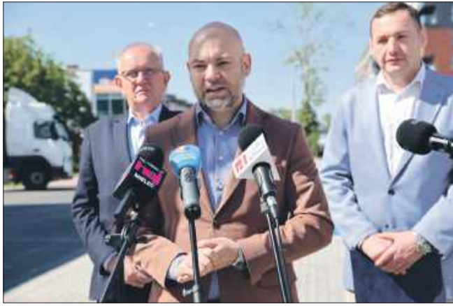
Konferencja prasowa dotycząca otwarcia ul. Raclawickiej.

Modernizacja objęła blisko 950-metrowy odcinek ulicy. Zakres robót był kompleksowy i obejmował m.in. przebudowę jezdni o szerokości 6 metrów, wykonanie nowych chodników po obu stronach ulicy, budowę około 100 miejsc parkingowych (w tym 6 dla osób z niepełnosprawnościami), a także modernizację oświetlenia, sieci wodociągowej, elektroenergetycznej,