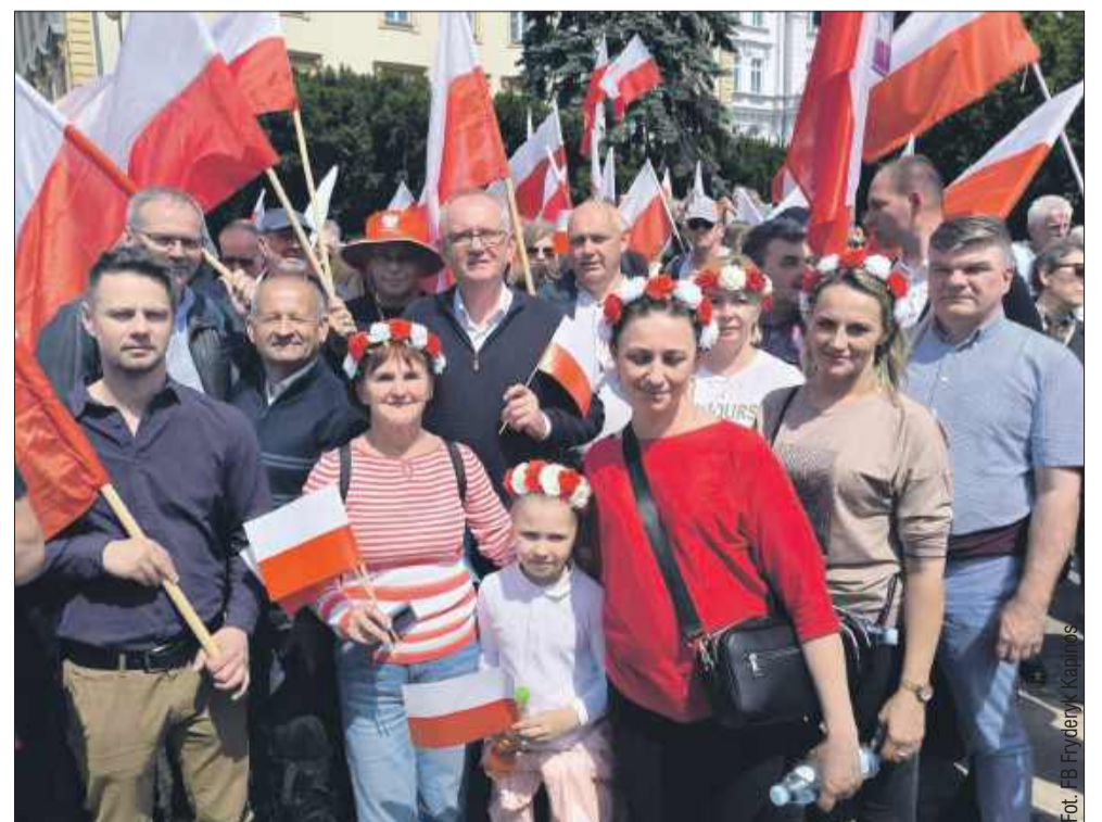
Mielczanie na marszu Karola Nawrockiego...