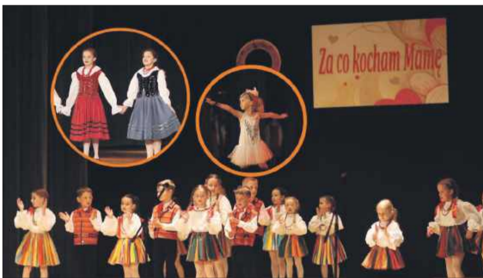
Za co kocham Mamę – koncert-popis zespołów Domu Kultury SCK w Mielcu

Na scenie zaprezentowali się „Mali Rzeszowiacy” – Zespół Pieśni i Tańca, który od lat pielęgnuje tradycję tańca ludowego.