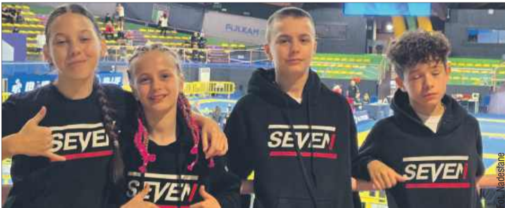
Po raz pierwszy w historii zawodnicy z Mielca wzięli udział w tym prestiżowym turnieju.