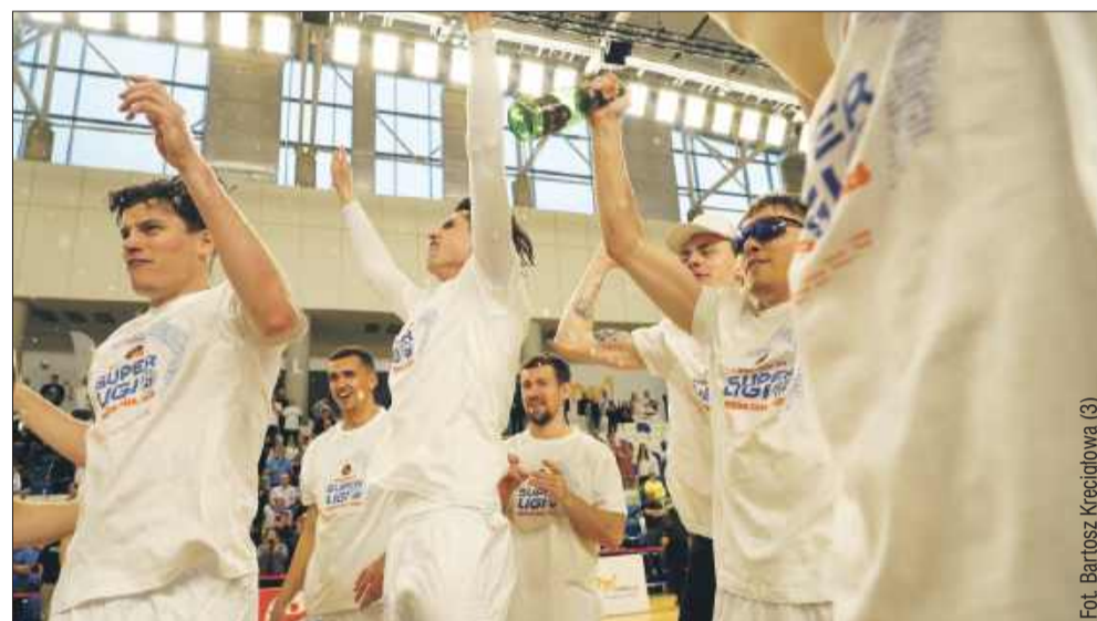
Handball Stal Mielec celebrowa awans