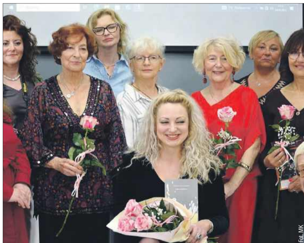
To był poruszający wieczór pełen poezji i emocji.