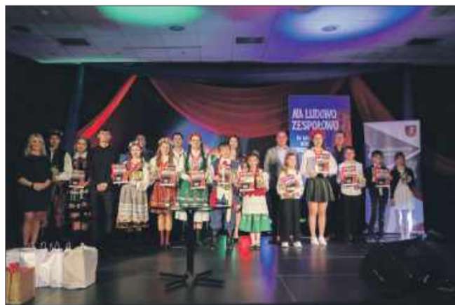
Uczestnicy zaprezentowali fantastyczny poziom.