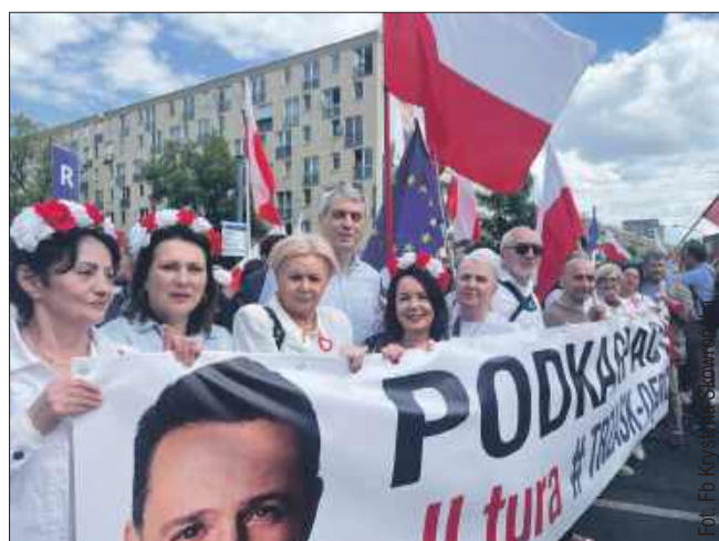
... i Rafała Trzaskowskiego.