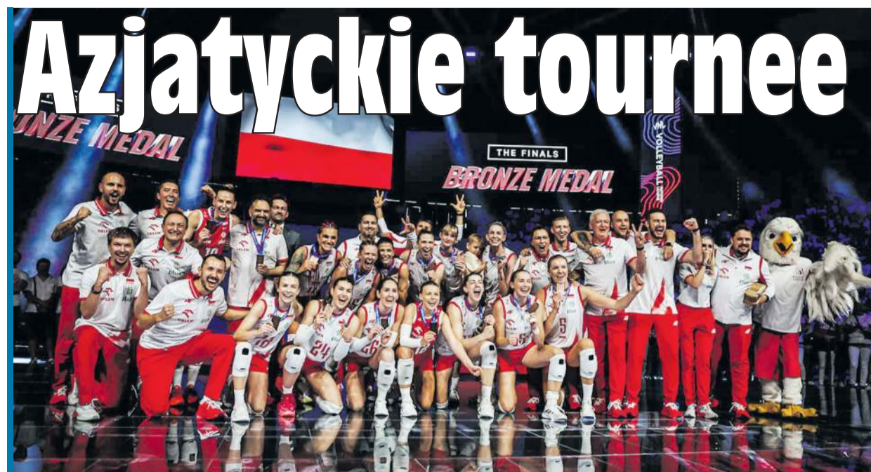
Polski zdomowili się na podium Ligi Narodów. Czy podtrzymają tę passę?