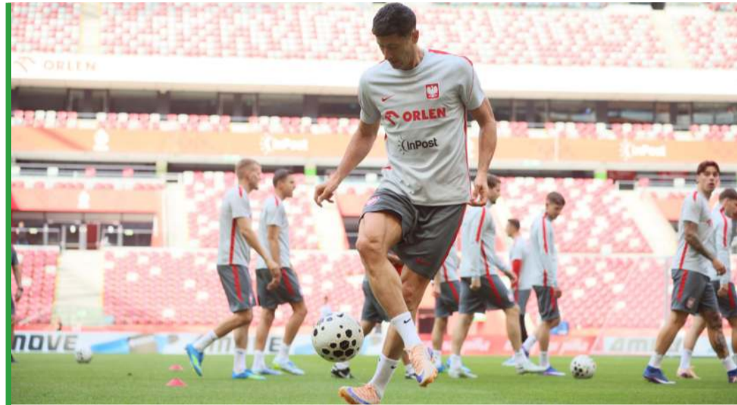
Robert Lewandowski przygotowujący się do meczu z Nigerią, który rozpocznie w pierwszym składzie.

Reprezentacja Polski skupia się jednak przede wszystkim na swoich wszystkich na swoich występach, a nie na rywalach. Najważniejsze podczas trwającego zgrupowania nie są wyniki, a przede wszystkim sprawdzenie różnych opcji na przyszłość. Już