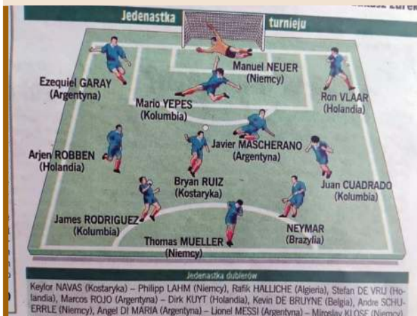
Jedenastka MŚ 2014 wg „Sportu”.