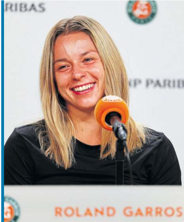
Oby w Paryżu uśmiech nie schodził z twarzy Polki!

– Gdyby ktoś powiedział mi dwa tygodnie temu, że