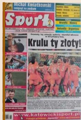
„Krulu ty złoty!” – kultowa okładka „Sportu” po wygranym meczu Holandii z Kostaryką po karnych w 1/4 finału MŚ 2014.

„Krulu ty złoty!” – pisał na pierwszej stronie „Sportu” w poniedziałek 7 lipca 2014 roku (gazeta kosztowała