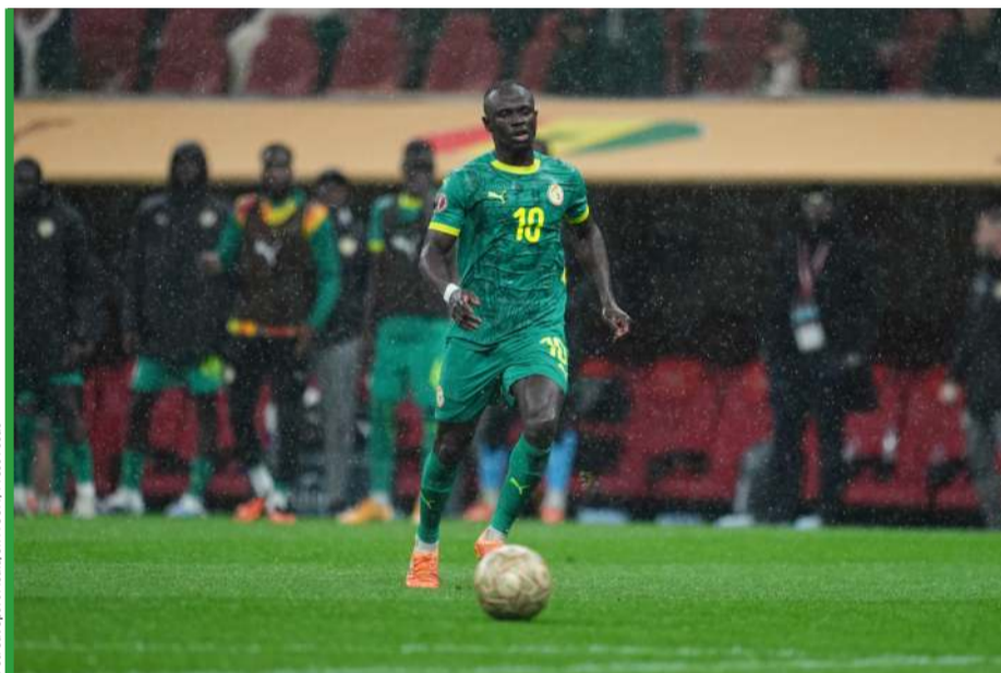
Sadio Mane ma już 55 bramek zdobytych dla senegalskich Lwów Terangi.