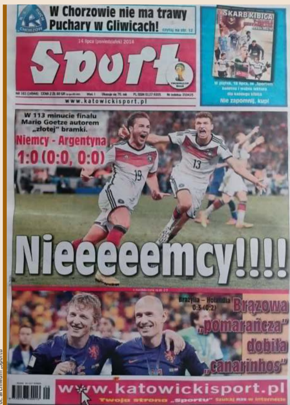
W finale brazylijskiego mundialu Niemcy pokonały Argentynę 1:0 po dogrywce.

Turniej w Brazylii był też jak dotąd jedynym w XXI wieku, na którym nie było wystannika „Sportu”. Taka sytuacja wydarzyła się po raz pierwszy od meksykańskiego Pucharu Rimeita, czyli mistrzostw świata