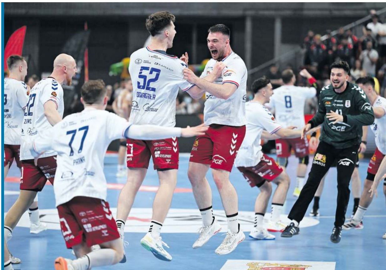
Szczęście i radość nie do opisanania stały się wczoraj udziałem Gdańszczan.