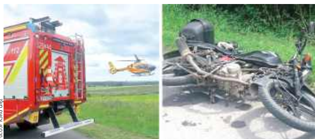
16 czerwca na drodze powiatowej w Ułężu doszło do wypadku z udziałem motocyklisty. Do akcji ratunkowej skierowano liczne służby, w tym śmigłowiec Lotniczego Pogotowia Ratunkowego

Ostatecznie w działaniach uczestniczyli strażacy z OSP KSRG Ułęż i OSP KSRG Baranów, dwa zastępy Państwowej Straży Pożarnej z Puław, zastęp PSP Ryki, zespół ratownictwa medycznego, patrol policji oraz