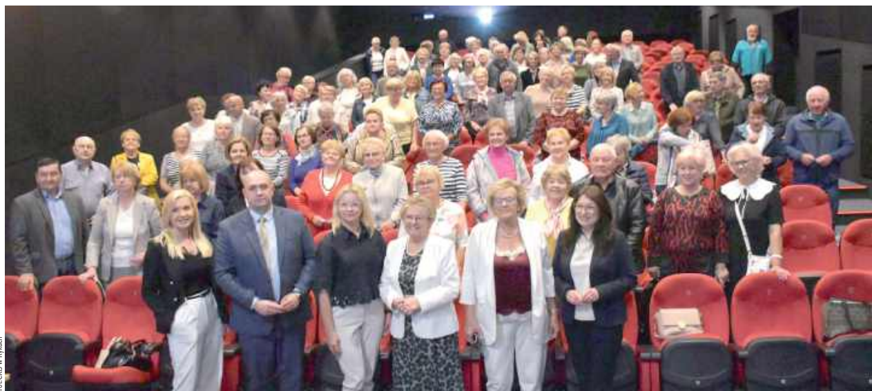
Spotkanie było okazją do podsumowania minionych miesięcy, podziękowań oraz wspomnień związanych z działalnością i wydarzeniami, które integrowały oraz aktywizowały słuchaczy

Zaproszeni goście zwracali uwagę na istotną rolę, jaką Uniwersytet Trzeciego Wieku pełni w życiu lokalnej społeczności seniorów.