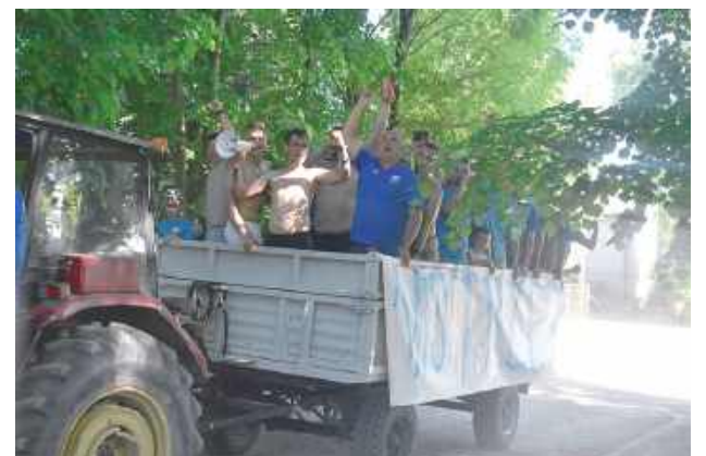
Szybka akcja, ale jak udana. Wesoła ekipa Amatora przejechała ulicami okolicy. Były śpiewy, litry napojów gazowanych. Po prostu wielka radość!