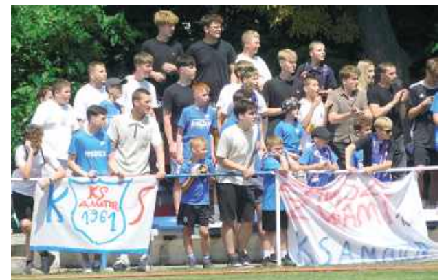
Kibice mieli powody do świętowania