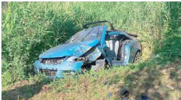
Samochód osobowy wypadł z jezdni. Dwie osoby zostały poszkodowane

Z przekazanych informacji wynika, że samochód osobowy wypadł z jezdni. Zdjęcia z miejsca zdarzenia pokazują, że pojazd został bardzo poważnie