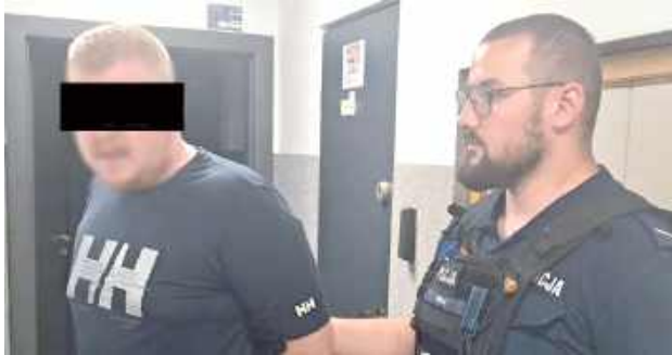
Zatrzymanym okazał się 28-letni mieszkaniec Poniatowej. Badanie wykazało, że miał w organizmie blisko 2 promile alkoholu