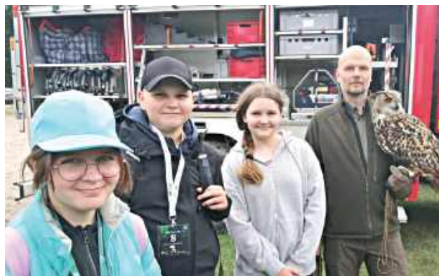
Uczniowie Szkoły Podstawowej w Goździe wzięli udział w konkursie przyrodniczym na leśnej ścieżce edukacyjnej w Hucie Garwolińskiej, łącząc rywalizację terenową z integracją i edukacją przyrodniczą

Po zakończeniu zmagania uczestnicy spotkali się z leśnikiem, który zaprezentował