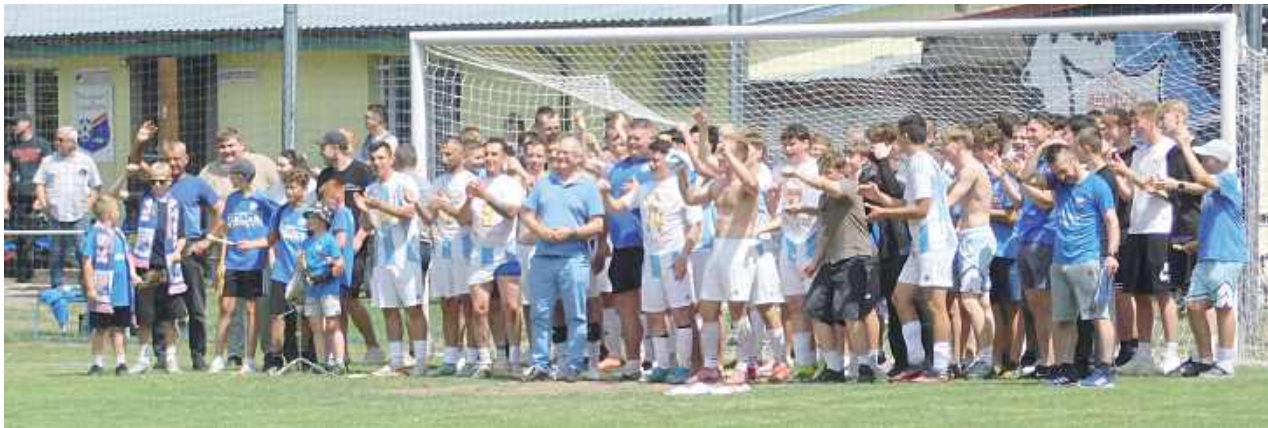
Piłkarze Amatora mają Klasę Okręgową!