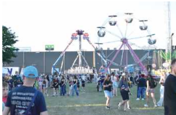
Dużym zainteresowaniem cieszyło się wesołe miasteczko. Najmłodszy korzystali z karuzel, dmuchańców i innych kolorowych atrakcji, podczas gdy starsze dzieci i młodzież wybierały bardziej ekstremalne urządzenia. Prawdziwym hitem okazał się ekstremalny młot, który niemal przez cały czas był oblegany przez młodych uczestników