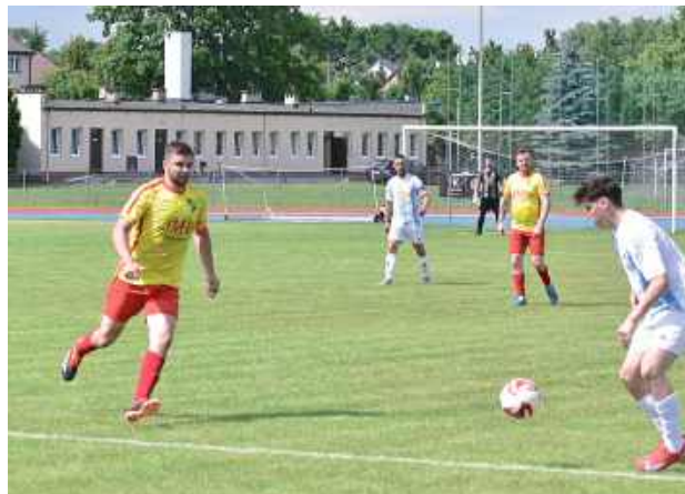
Gracze Mazowsza muszą uzbroić się w cierpliwość. Powinni zostać w Klasie A, ale na ostateczne rozstrzygnięcia trzeba jeszcze poczekać

dwie bramki. Pierwszą już beze mnie, a później graliśmy nawet w podwójnym osłabieniu. Chłopakom nie można odmówić zaangażowania - podkreślał szkolenowiec.