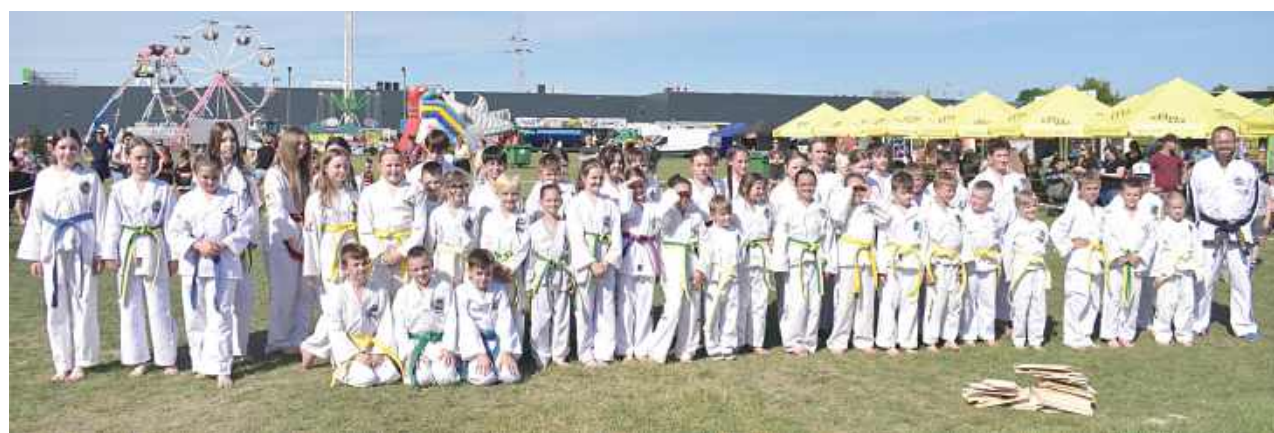
Ekipa Majster Team zapoczątkowała obchody Dni Dębłina

Pokaz taekwon-do w wykonaniu zawodników klubu Majster Team zainaugurował tegoroczne Dni Dębłina. Licznie zgromadzona publiczność mogła podziwiać zarówno podstawowe techniki, jak i widowiskowe rozbicia desek, dachówek oraz betonowych bloczków.