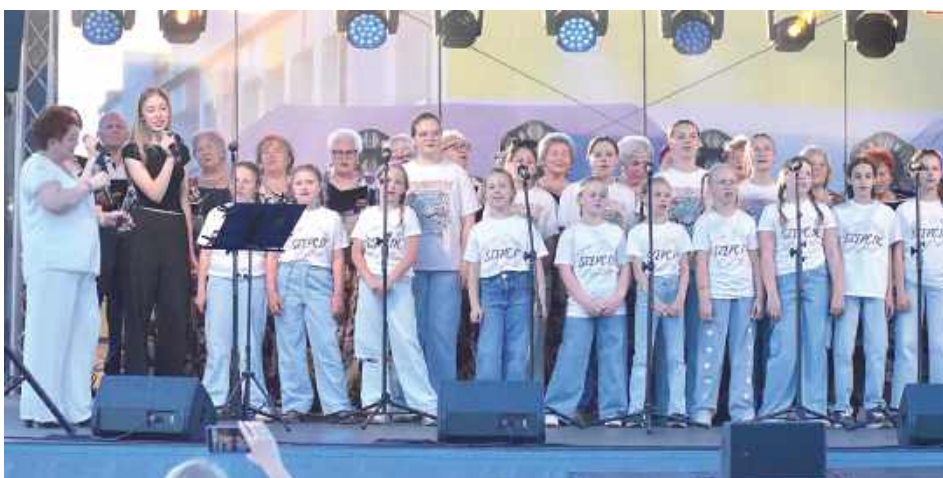
Drugiego dnia obchody przeniosły się nad Wisłę, gdzie mieszkańcy wspólnie świętowali jubileusz 50-lecia Miejskiego Domu Kultury w Dęblinie