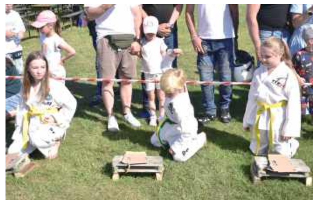
Element dachówki był, a za chwilę rozpadł się w drobny mak

- W tygodniu poprzedzającym pokaz dzieci próbowały rozbijać dachówki i deklarowały, ile sztuk chcą rozbicić podczas wy-