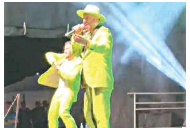
Gwiazdą wieczoru był legendarny zespół Boys

Domu Kultury w Dębnie. Przygotowano widowisko artystyczne, rozstrzygnięto konkurs plastyczny dla dorosłych, a wieczorem uczestnicy obejrzeli kino plenerowe. Nie zabrakło również miłośników aktywnego wypoczynku, którzy wzięli udział w rajdzie rowerowym oraz wydarzeniach związanych z Dniem Równoważonego Transportu.