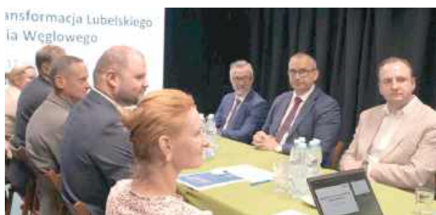
Samorządowcy i eksperci szukają alternatyw dla Bogdanki

Transformacja energetyczna regionów górniczych to jeden z najbardziej skomplikowanych procesów społeczno-gospodarczych, przed jakimi stają współczesne samorządy. Nagłe wygaszanie przemysłu ciężkiego bez wcześnie-