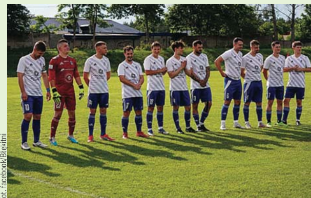
Błękitni Pasyw w roli gospodarza zagrają dzisiaj w Jedwabnie

Stomil Olsztyn nie wywalczył poprzez baraże awansu do III ligi, w efekcie z IV ligi spadły aż trzy zespoły. Na ostateczną liczbę spadkowiczów bezpośredni wpływ miał również spadek Znicza Biała Piska oraz GKS Wiekielec. W efekcie tych przetasowań, od nowego sezonu w okręgówce zagrają Mrągowa Mrągowo, Olimpia II Elbląg i GKS Stawiguda. Dzisiaj zostaną rozegrane pierwsze mecze barażowe, których stawką będzie awans do IV ligi oraz utrzymanie na poszczególnych szczeblach rozgrywek prowadzonych przez Warmińsko-Mazurski Związek Piłki Nożnej.