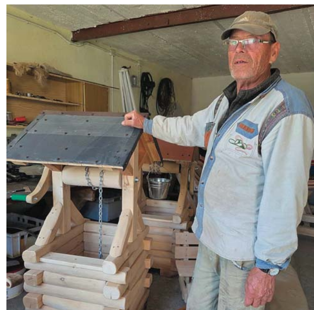
Stolarskie hobby towarzyszy pasjonatowi i pozwala podreperować emerycki budżet

— Po narybek przyjeżdżają ludzie z bardzo odległych miejsc. Miałem klientów z okolic Warszawy, a nawet z Niemiec. Wielu mieszkańców powiatów iławskiego, grudziądzkiego i nowomiejskiego regularnie zamawia moje ryby. Najczęściej transportujemy je w foliowych workach wypełnionych wodą. Trzeba jednak pamiętać o odpowiedniej liczbie ryb w każdym worku, aby nie zabrakło im tlenu podczas przewozu.