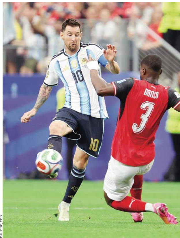
W meczu Argentyny z Austrią Lionel Messi zdobył dwie bramki

W latach 2009-12 Messi zdominował rywalizację o tytuł najlepszego zawodnika świata, odbierając