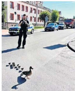
Kacza rodzinka bezpiecznie pokonała jezdnię

Kacza rodzina bezpiecznie kontynuowała swoją drogę, a cała sytuacja stała się miłym przykładem empatii i szybkiej reakcji służb.