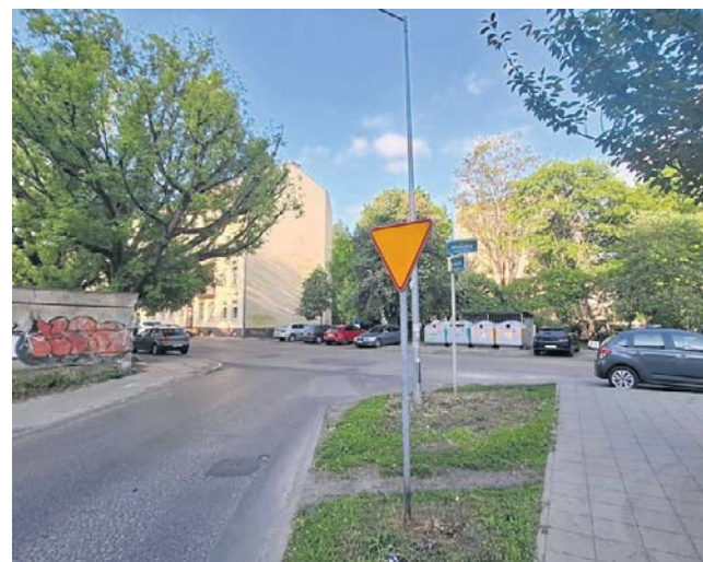
Ulica Miedziana przed skrzyżowaniem z uliczką osiedlową. To tu od dziś będzie prowadził objazd

- Na odcinku od ul. Miedzianej do ul. Firlika ruch będzie odbywał się tylko w jednym kierunku - w stronę ul. Firlika. Przejazd w przeciwnym kierunku poprowadzony zostanie objazdem przez ul. Miedzianą. Prace rozpoczną się od frezowania nawierzchni na odcinku od ul. Miedzianej do ul. Firlika. Następnie rozpoczną się roboty rozbiórkowe, a od 8 czerwca zaplanowano rozpoczęcie bu-