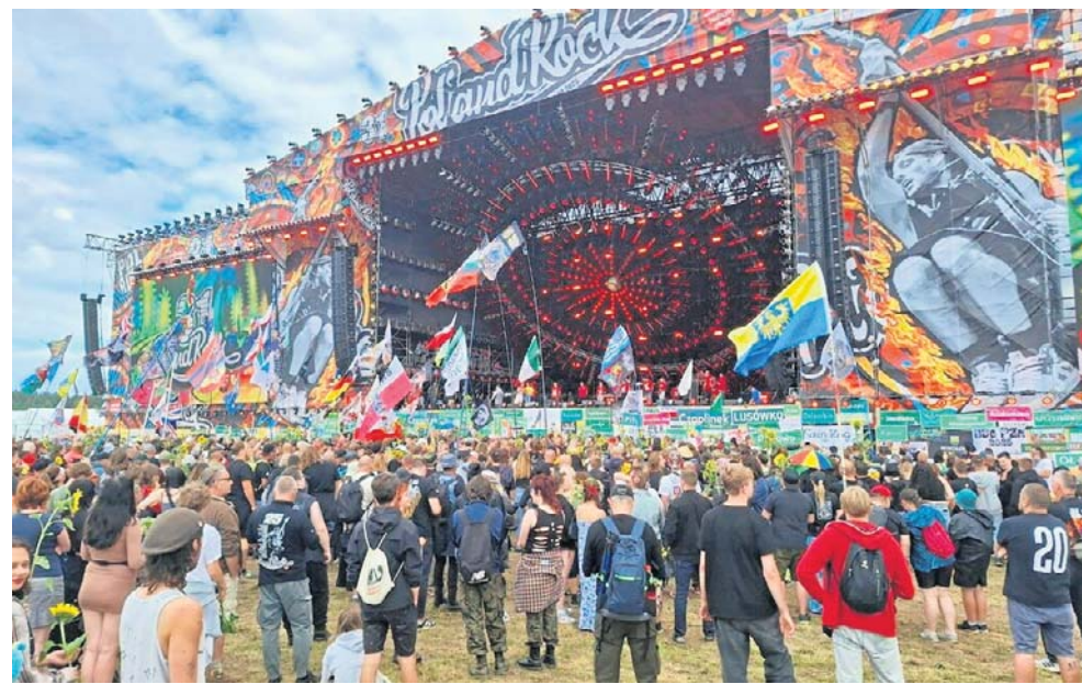
Na przełomie lipca i sierpnia w Broczynie koło Czaplinka odbędzie się Pol'and'Rock Festival. Więcej szczegółów dotyczących koncertów na gs24.pl

Wiemy już, kto do nich dołączy i pojawi się na festiwalu. Do Czaplinka powróci legenda polskiego rocka - zespół Lipali. To z pewnością wzbudzi największe emocje wśród fanów tego gatunku. Formacja po raz trzeci wystąpi na Pol'and'Rock