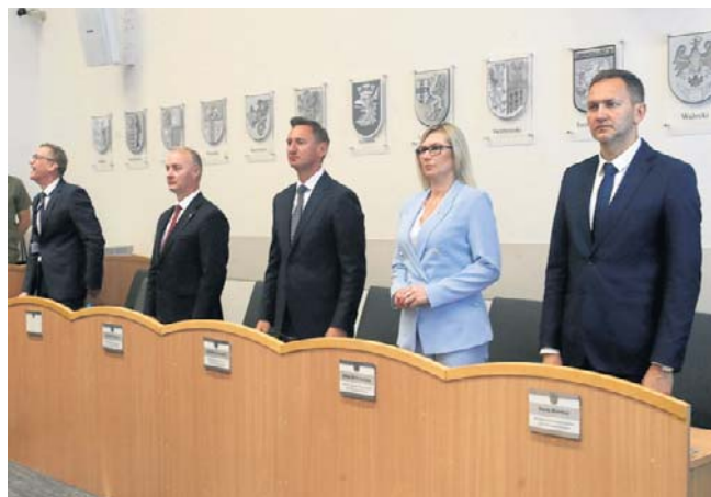
Zarząd województwa uznał ubiegły rok za udany

Władze samorządu województwa uzyskały wotum zaufania stosunkiem głosów 20 do 9. Podobnie radni zagłosowali nad uchwałą zatwierdzającą sprawozdanie finansowe oraz sprawozdanie z wykonania budżetu za 2025 r.