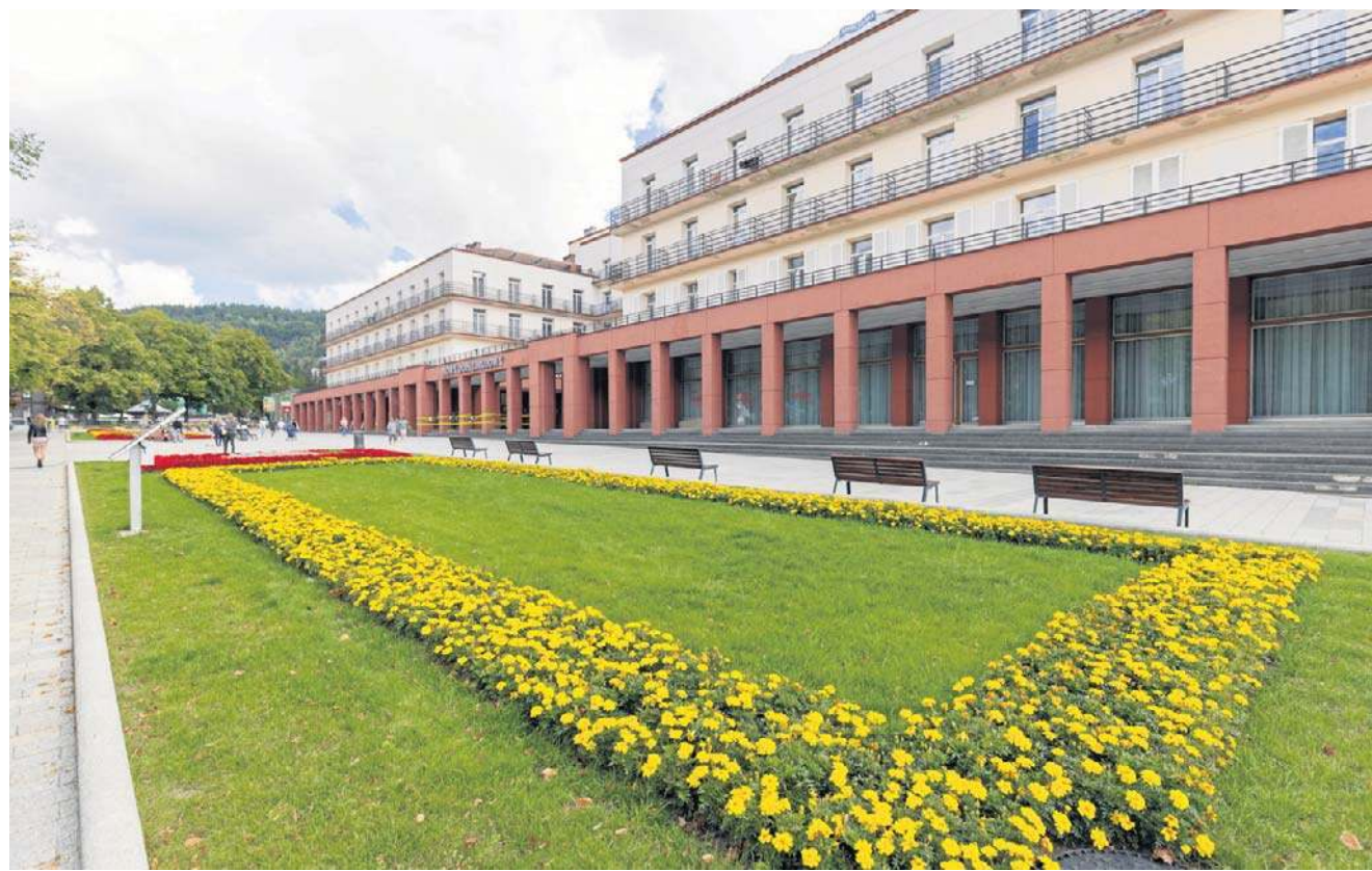
Sanatorium w Krynicy-Zdroju