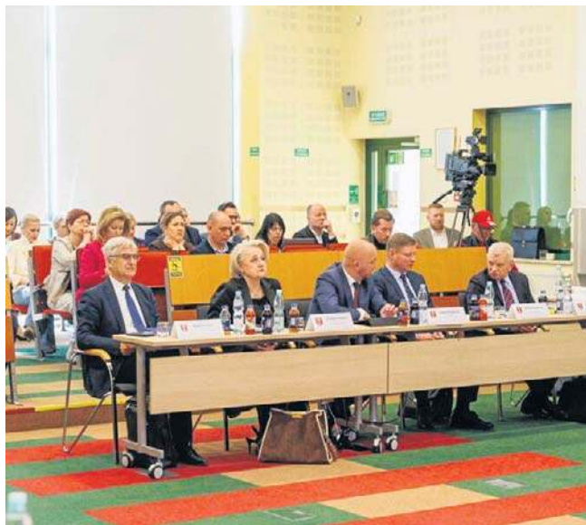
Ostatecznie radni zgodzili się większością głosów sejmikowej koalicji poręczyć kredyt