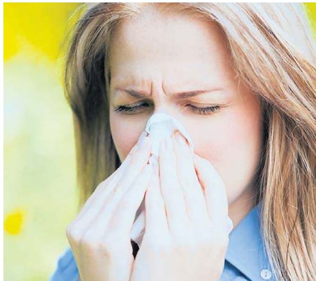
Wiosenna alergja może powodować u pacjentów także suchość w ustach