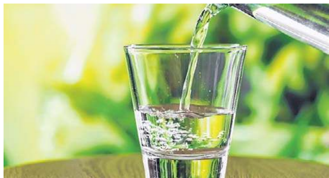
Picie wystarczającej ilości niegazowanej wody pomaga utrzymać nawilżenie śluzówek

Aby zrozumieć, co dokładnie wywołuje reakcję alergiczną, warto zerknąć w kalendarz pylenia. To on najprecyzyjniej podpowiada, co akurat krąży w powietrzu. Wiosną szczególnie dokuczliwe bywają pyłki drzew. Największe „uderzenie” zwykle przypada na okres kwitnienia brzozy, która zaczyna pylić pod koniec marca i potrafi męczyć alergików aż do maja. Wcześniej, bo już od lutego, aktywna jest olsza, a jej pyłek również potrafi wywołać silne objawy. W dalszej części wiosny największym problemem stają się trawy – to one należą do najsilniejszych alergenów i odpowiadają za większość sezonowych reakcji alergicznych. W tym czasie pyli też dąb, buk i jesion.