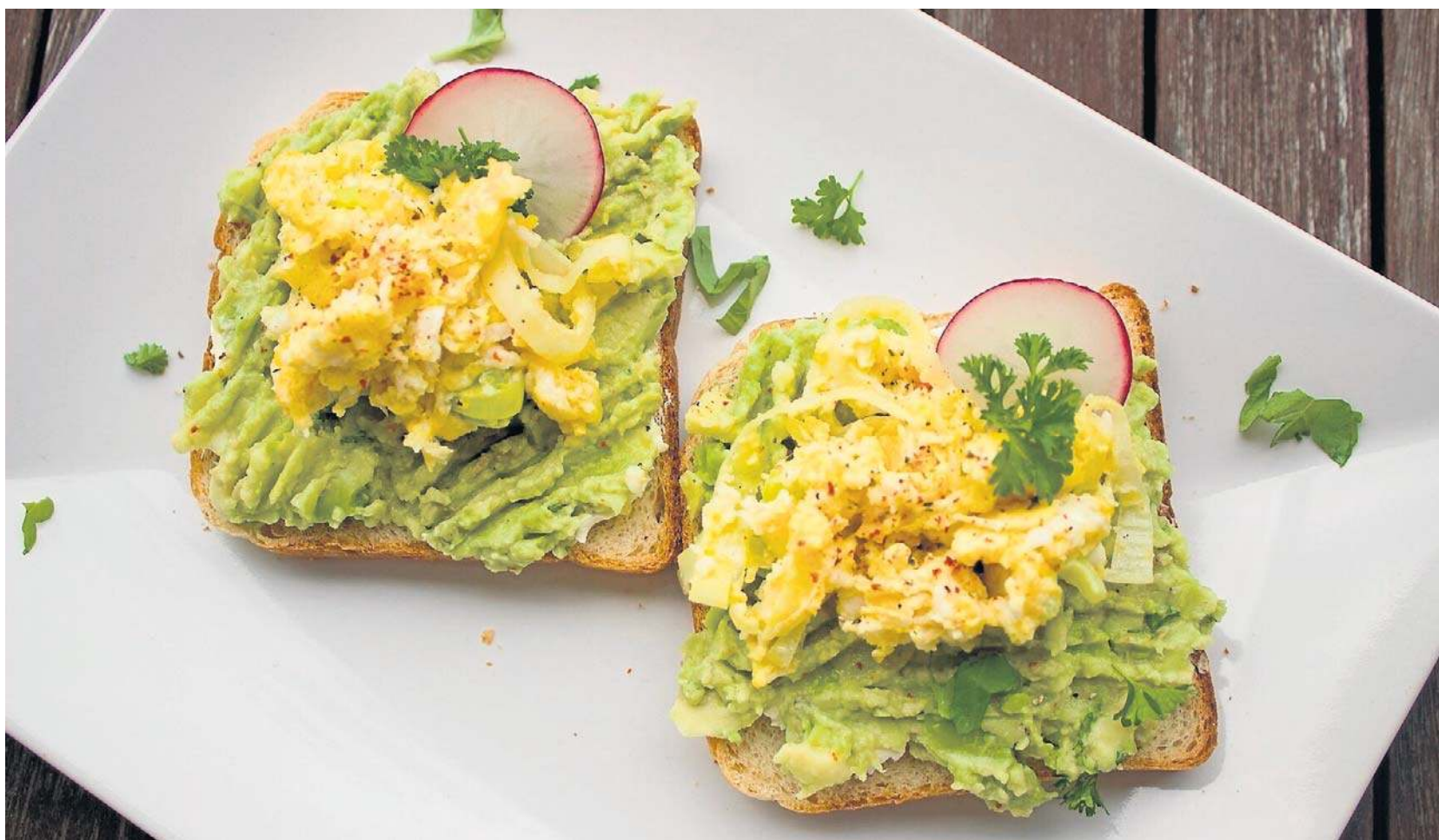
Kanapki to najpopularniejsza śniadaniowa opcja Polaków

Według badań taka eksploatacja tego narządu może trwać ponad 7 lat, zanim pojawią się objawy chorobowe. Dochodzi również do zaburzeń pracy trzustki, a konsekwencją jest m.in. insulinooporność, oty-