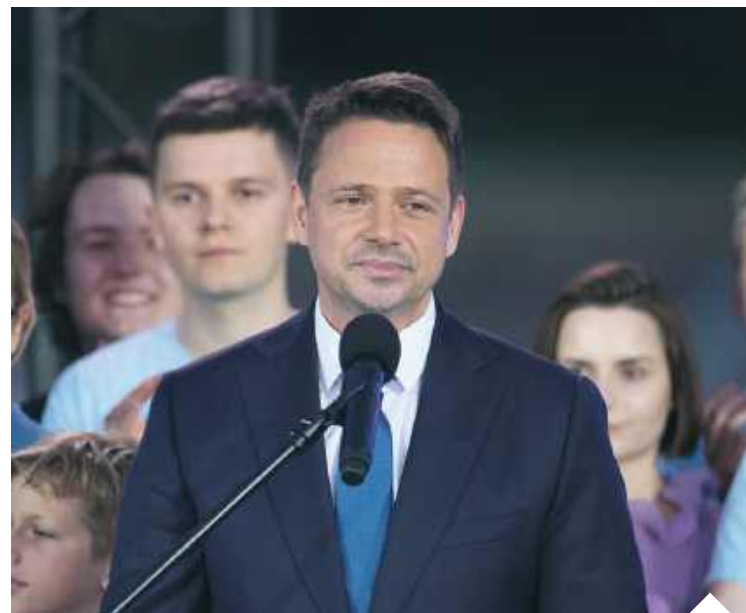
Z Rafała Trzaskowskiego, który ze złotego dziecka Platformy Obywatelskiej stał się „dwugodzinnym prezydentem”, jest coraz mniej pożytku dla partii Tuska

Przypomnijmy, że klauzula opt-out to zgoda pracownika na wykonywanie pracy powyżej przeciętnie 48 godzin tygodniowo w przyjętym okresie rozliczeniowym. W praktyce