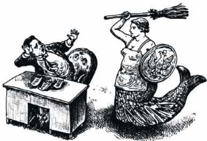
OGŁOSZENIE REDAKCYJNE DROBNE