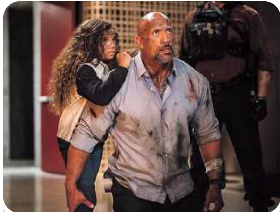
THRILLER SKYSCRAPER: DRAPACZ CHMUR WTOREK, 14.7, GODZ. 19.55, POLSAT

Dwayne Johnson wciela się w postać Willa Sawyera, byłego szefa jednostki FBI odpowiedzialnego za odbijanie zakładników, weterana wojennego amerykańskiej armii. Dziś Will zajmuje się ochroną wielkich wieżowców. Mieszka w Chinach, gdzie odpowiedzialny jest za bezpieczeństwo największego na świecie, uznawanego za najbezpieczniejszy, drapacza chmur o nazwie „The Pearl”. Kiedy 225-piętrowy wieżowiec staje nagle w ogniu, to właśnie Will zostaje wrobiony w odpowiedzialność za gigantyczny pożar. Wie, że jest ścigany, wie też, że musi oczyścić swoje imię, ale przede wszystkim uratować rodzinę zamkniętą w płonącym budynku. Z pewnością nie będzie to łatwe.