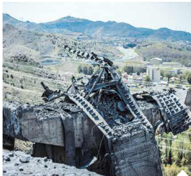
Amerykianie uderzyli w 90 irańskich celów, w tym w obronę przeciwlotniczą i wojskową infrastrukturę

To, dlaczego Iran znów atakuje statki, wydaje się jasne – i nie jest przypadkiem, że celem ataków padają te, które płyną korytarzem omijającym ich wody terytorialne. Teheran od dawna domaga się oddania Ormuzu – jednego z najważniejszych szlaków morskich na świecie – pod jego kontrolę,