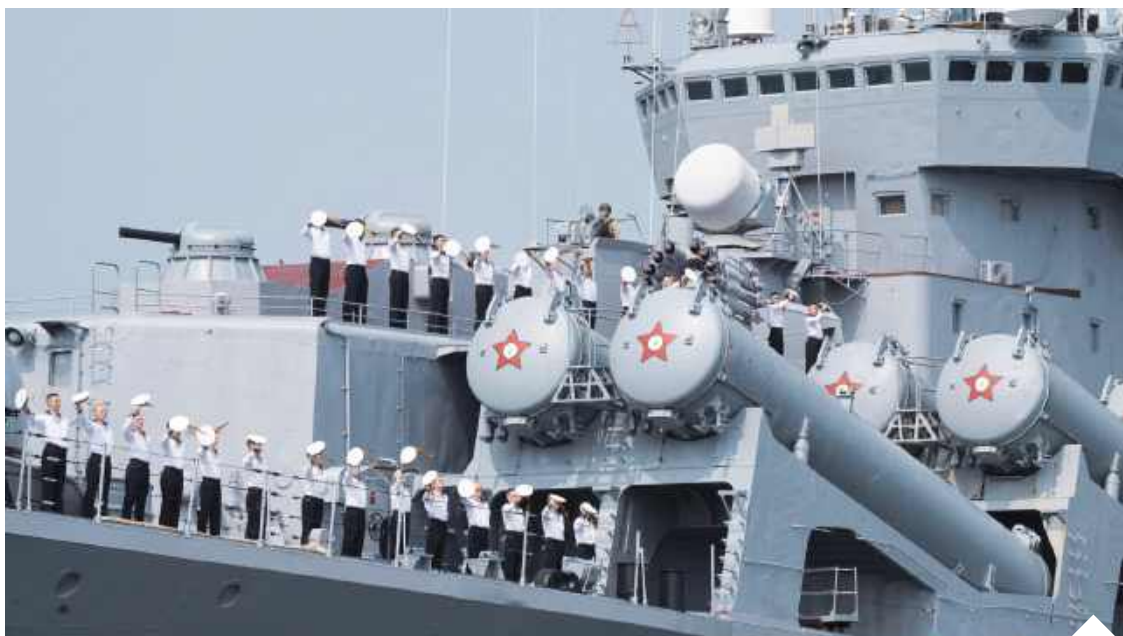
Program ćwiczeń obejmuje m.in. rozpoznanie, obronę przeciwlotniczą i przeciwrakietową oraz strzelania bojowe

Wymowy ćwiczeniom dodał poniedziałkowy test. Chiński strategiczny okręt podwodny wystrzelił rakietę balistyczną z ćwiczebną głowicą. Według Tajwanu był to pocisk JL-2, który przeleciał nad północnym wybrzeżem Luzonu, największej wyspy Filipin, i spadł na Pacyfiku między Nauru a Tonga.