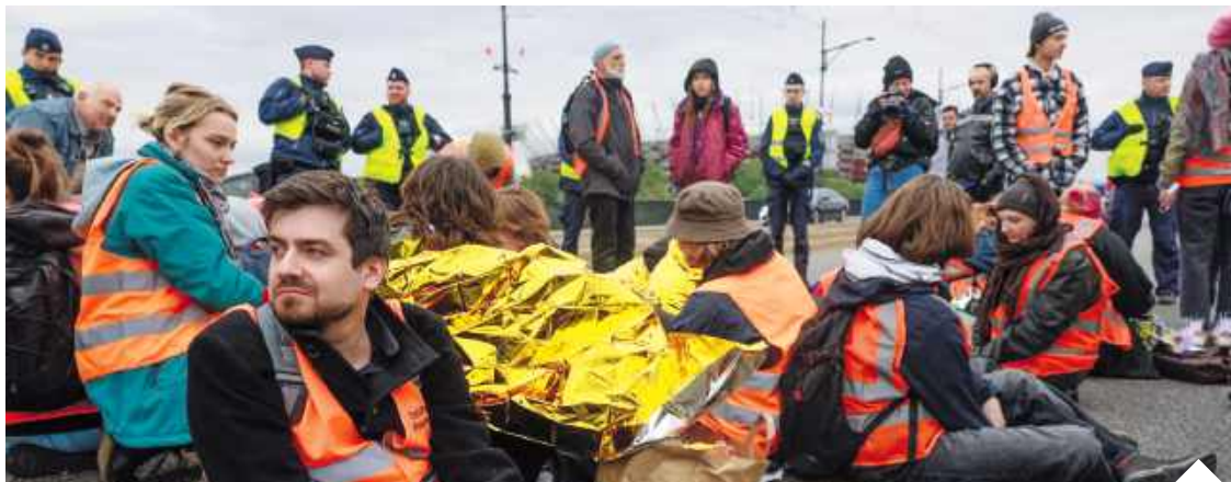
To, co zostanie wymyślone w Brukseli, ma potem dostać społeczne zaplecze, kampanie, ekspertyzy, nacisk medialny i „obywatelskie” wsparcie NGO

Teraz jednak pieniądze mają iść dużo szerszym strumieniem, a sama Komisja Europej-