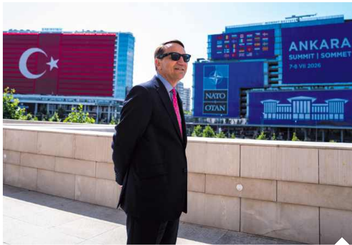
Lista zachowań kompromitujących wiceprzewodniczącego Koalicji Obywatelskiej Radosława Sikorskiego jest długa