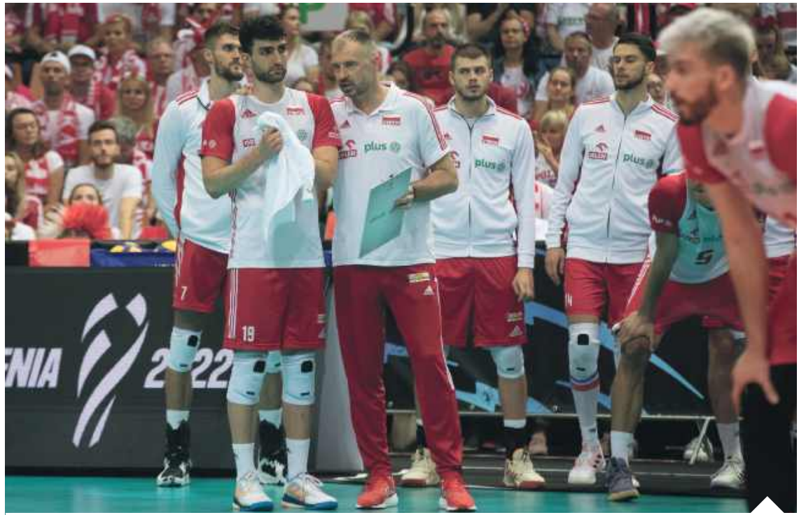
Już niedługo reprezentacja Polski siatkarzy może mierzyć się z Rosją

Przeciwko decyzji MKOI protestuje Ukraina. „Uważamy decyzję za przedwczesną, bezpodstawną i podjętą bez uwzględnienia obiektywnych okoliczności, które pozostają niezmiennie. Rosja kontynuuje zakrojoną na szeroką skalę agresję zbrojną przeciwko Ukrainie” – napisał w oświadczeniu Ukraiński Komitet Olimpijski.