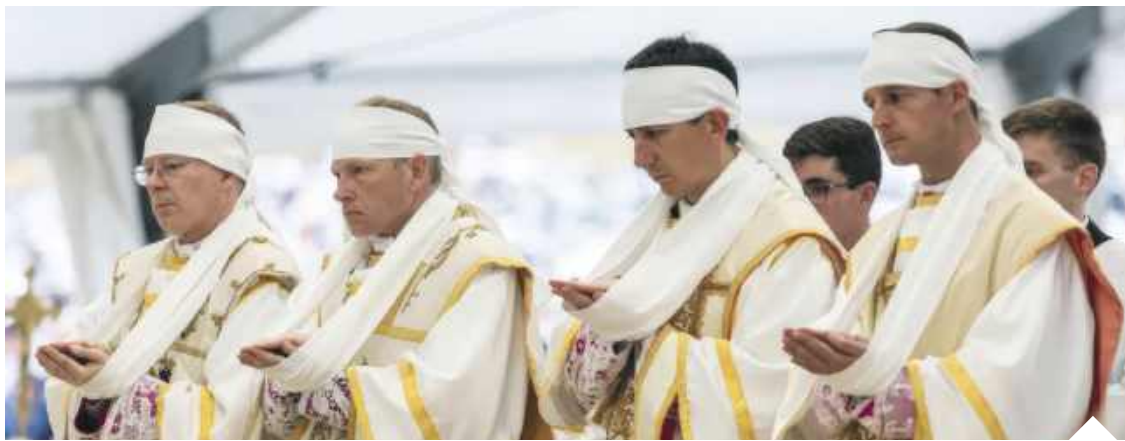
Lefebryści, bardzo aktywni i nadreprezentatywni w internecie, uważają się za jedynych dziedziców tradycji w Kościele, nadając sobie prawo do nadinterpretacji dokumentów Kościoła

Karol Wojtyła nałożył na Bractwo ekskomunikę, cofniętą dopiero w 2009 r. przez Benedykta XVI. Motu proprio tego drugiego papieża pozwoliło na łatwiejsze sprawowanie mszy trydenckiej w parafiach. Jednak papież Franciszek w 2021 r. zdecydował się na ograniczenie sprawowania tradycyjnych liturgii w diecezjach. Natomiast Leon XIV przyjął jeszcze bardziej surowy kurs. Po kolejnym wyświę-