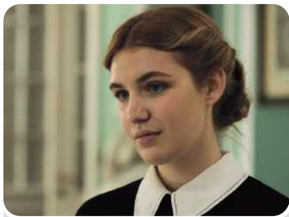
DRAMAT WOJENNY PRZYSIĘGA IRENY ŚRODA, 15.7, GODZ. 21.05, TVP KULTURA

Akcja filmu w reżyserii Louise Archambault rozgrywa się w okupowanej Polsce. 19-letnia Irena (Sophie Nélisse), po dramatycznych doświadczeniach wojennych, trafia do pracy w domu mjr. SS Rugemera (Dougray Scott). Gdy dowiaduje się o planowanej likwidacji getta, podejmuje decyzję o ukrywaniu Żydów w jego posiadłości. Każdy dzień staje się walką o życie – napięcie rośnie, a najmniejszy błąd może doprowadzić do tragedii. Reżyserka pokazuje brutalność okupacji bez upiększeń, oddając grozę tamtych wydarzeń i bezwzględność niemieckich oprawców. To przejmująca opowieść o odpowiedzialności, odwadze i wartości ludzkiego życia, która porusza i skłania do refleksji.