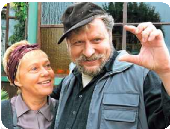
KOMEDIA ZRÓBMY SOBIE WNUKA ŚRODA, 15.7, GODZ. 21.25, POLSAT

Akcja filmu w reżyserii Louise Archambault rozgrywa się w okupowanej Polsce. 19-letnia Irena (Sophie Nélisse), po dramatycznych doświadczeniach wojennych, trafia do pracy w domu mjr. SS Rugemera (Dougray Scott). Gdy dowiaduje się o planowanej likwidacji getta, podejmuje decyzję o ukrywaniu Żydów w jego posiadłości. Każdy dzień staje się walką o życie – napięcie rośnie, a najmniejszy błąd może doprowadzić do tragedii. Reżyserka pokazuje brutalność okupacji bez upiększeń, oddając grozę tamtych wydarzeń i bezwzględność niemieckich oprawców. To przejmująca opowieść o odpowiedzialności, odwadze i wartości ludzkiego życia, która porusza i skłania do refleksji.