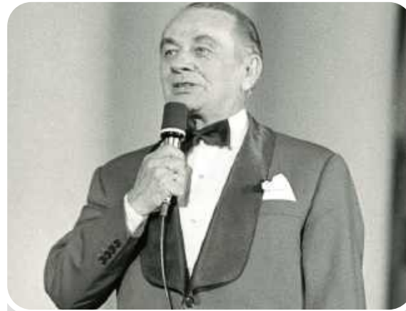
DOKUMENTALNY MUNDIAL. TEATR EMOCJI WTOREK, 14.7, GODZ. 23.30, TVP1

Tytułowy fałszerek to Raymond J. Cutter (John Travolta), genialny oszust, który nie ma sobie równych w przestępczym świecie. Przebywający za kratkami Raymond zawiera umowę z tajemniczym syndykatem zbrodni, aby uzyskać wcześniejsze zwolnienie z więzienia. W zamian musi podjąć się kradzieży i sfałszowania obrazu Claude'a Moneta, by następnie podmienić go z oryginałem w muzeum. Replika ma być tak doskonała, aby nikt nie zauważył różnicy. Napad wydaje się niemal niemożliwy do realizacji. Raymond przyparty do muru prosi o pomoc swojego ojca Josepha (Christopher Plummer) oraz syna Willa (Tye Sheridan) i wspólnie planują fałszerstwo wszech czasów.