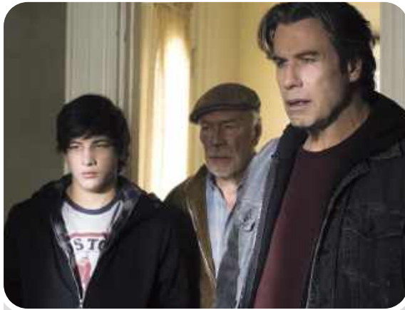
THRILLER FALSZERZ WTOREK, 14.7, GODZ. 20.00, STOPKLATKA

Dwayne Johnson wciela się w postać Willa Sawyera, byłego szefa jednostki FBI odpowiedzialnego za odbijanie zakładników, weterana wojennego amerykańskiej armii. Dziś Will zajmuje się ochroną wielkich wieżowców. Mieszka w Chinach, gdzie odpowiedzialny jest za bezpieczeństwo największego na świecie, uznawanego za najbezpieczniejszy, drapacza chmur o nazwie „The Pearl”. Kiedy 225-piętrowy wieżowiec staje nagle w ogniu, to właśnie Will zostaje wrobiony w odpowiedzialność za gigantyczny pożar. Wie, że jest ścigany, wie też, że musi oczyścić swoje imię, ale przede wszystkim uratować rodzinę zamkniętą w płonącym budynku. Z pewnością nie będzie to łatwe.