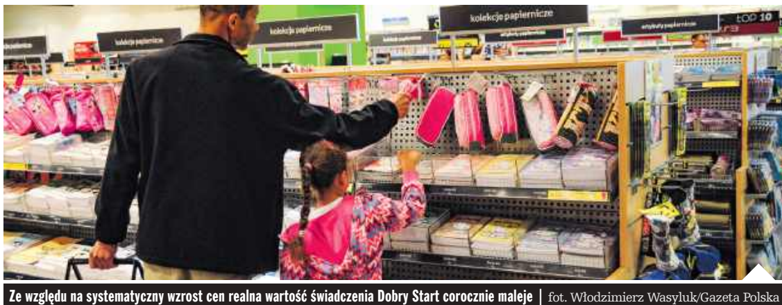
Ze względu na systematyczny wzrost cen realna wartość świadczenia Dobry Start corocznie maleje

Choć świadczenie nadal wynosi 300 zł na każde dziecko, jego realna wartość systematycznie maleje. Powodem jest utrzymujący się wzrost cen, który – mimo wyhamowania inflacji – wciąż przekłada się na wyższe koszty produkcji, transportu i sprzedaży towarów. Ekspertki szacują, że w tym roku ceny szkolnych wyprawek są średnio o 5–8 proc. wyższe niż przed