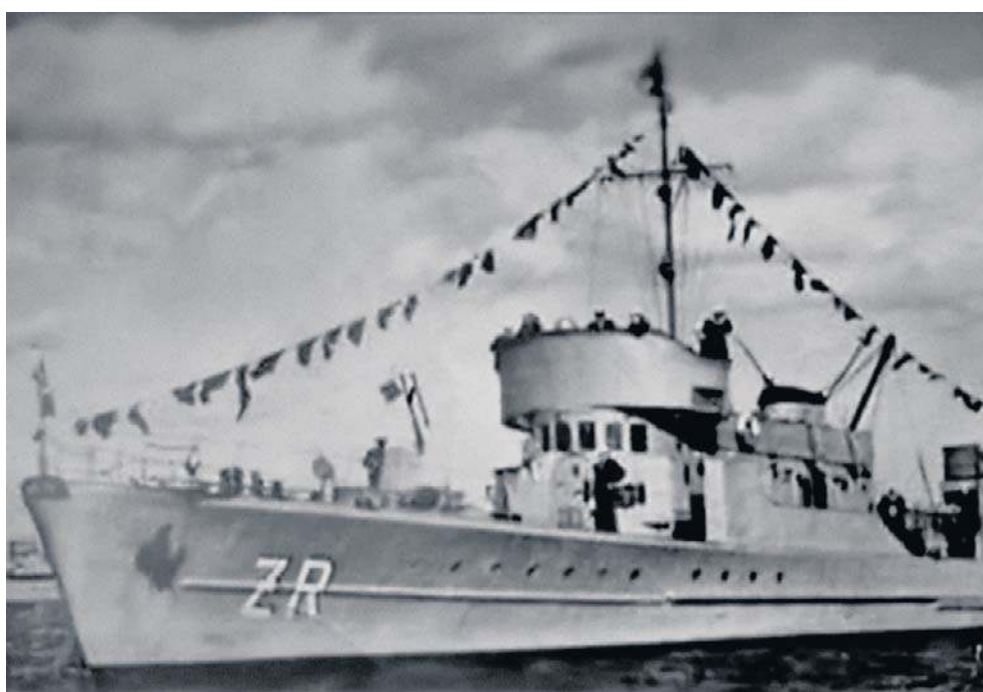
ORP „Żuraw”, który brał udział w opisywanych wydarzeniach. Został zezłomowany na początku lat 80.