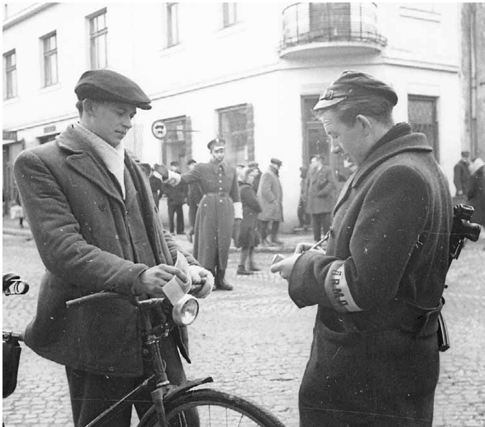
ORMO powstało w 1946 roku. W szczytowym okresie PRL-u liczyła 400 tys. ludzi. -- Rezerwę rozwiązano w 1989 r.

W instrukcjach dla kierownictwa formacji podkreślano, że ormowiec powinien dbać o sprawność fizyczną poprzez uprawianie sportów, turystyki i wyszkolenie wojskowe. Musiał złożyć przyrzeczenie o treści: „Ja... przyrzekam sumiennie i gorliwie wykonywać obowiązki członka ORMO, ze