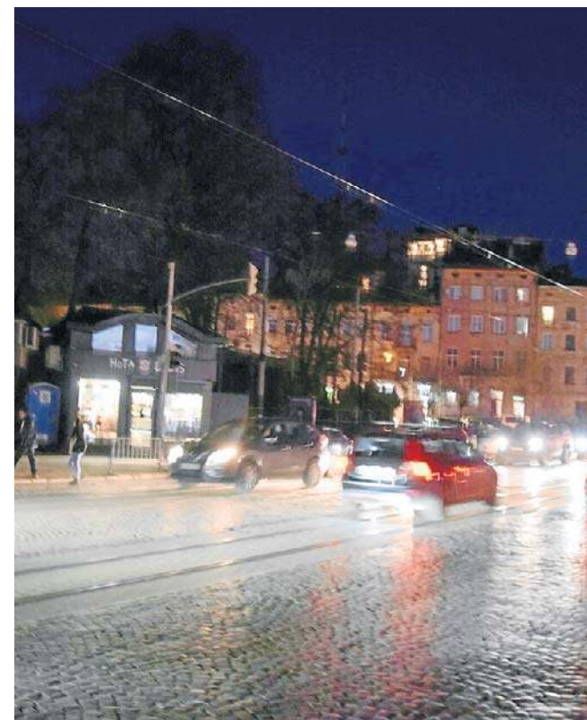
Ukraińskie miasta z reguły pogrążone są w ciemności. Utrapieniem dla Lwowa i mieszkańców wielu innych miejscowości są ciągłe przerwy w dostawie prądu, spowodowała atakami Rosjan na sieci energetyczne

Linia kolejowa 102 przebiega przez Polskę i Ukrainę, zaczyna się w Przemyśle. W ostatnich latach odnowiona po ukraińskiej i polskiej stronie. Jednak, choć obie strony deklarują maksymalną chęć do współpracy na rzecz obu narodów, sto dwójka jest pusta. Nie kursują po niej pociągi, które mogłyby