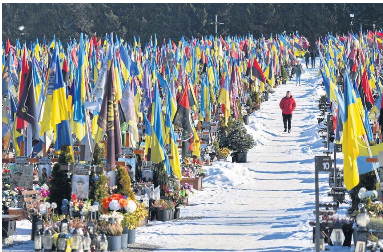
Cmentarz Łyczakowski we Lwowie. Na wszystkich cmentarzach Ukrainy kwatery wojskowe są olbrzymie

czasu i wszyscy są coraz bardziej przygnębieni. Myślą, że lepsze życie jest w innym kraju”.