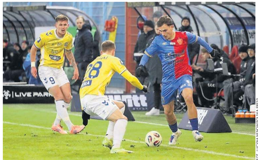
Ważne punkty w kontekście utrzymania Motor Lublin wywalczył w delegacji w Gliwicach