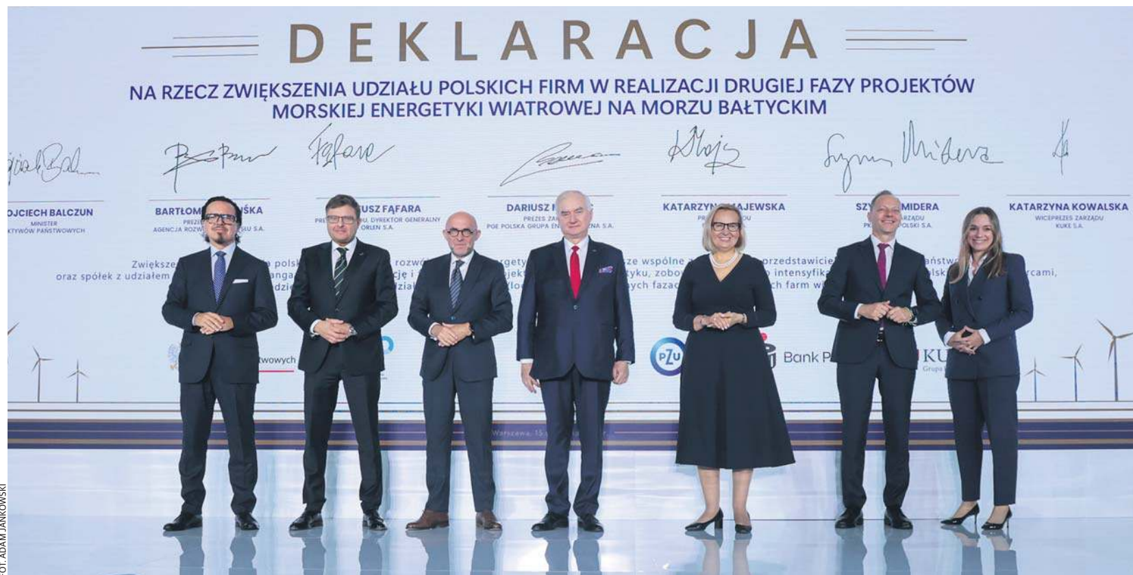
II edycja Forum „Energia z Polski”. Podpisanie deklaracji o udziale polskich firm w budowie morskich farm wiatrowych.

Wydarzenie odbywa się pod hasłem „Wind Factory of Europe” i jest adresowane szczególnie do sektora małych i średnich przedsiębiorstw (MŚP). Dzięki swojej elastyczności i innowacyjności to właśnie one mogą stać się strategicznymi