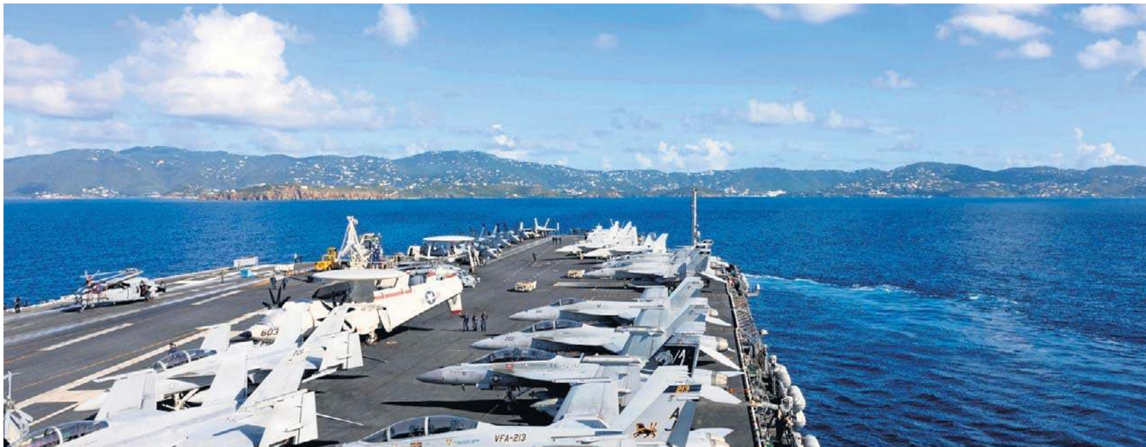
Lotniskowiec USS Gerald R. Ford wchodzi w skład amerykańskich sił szykujących się do ataku na Iran