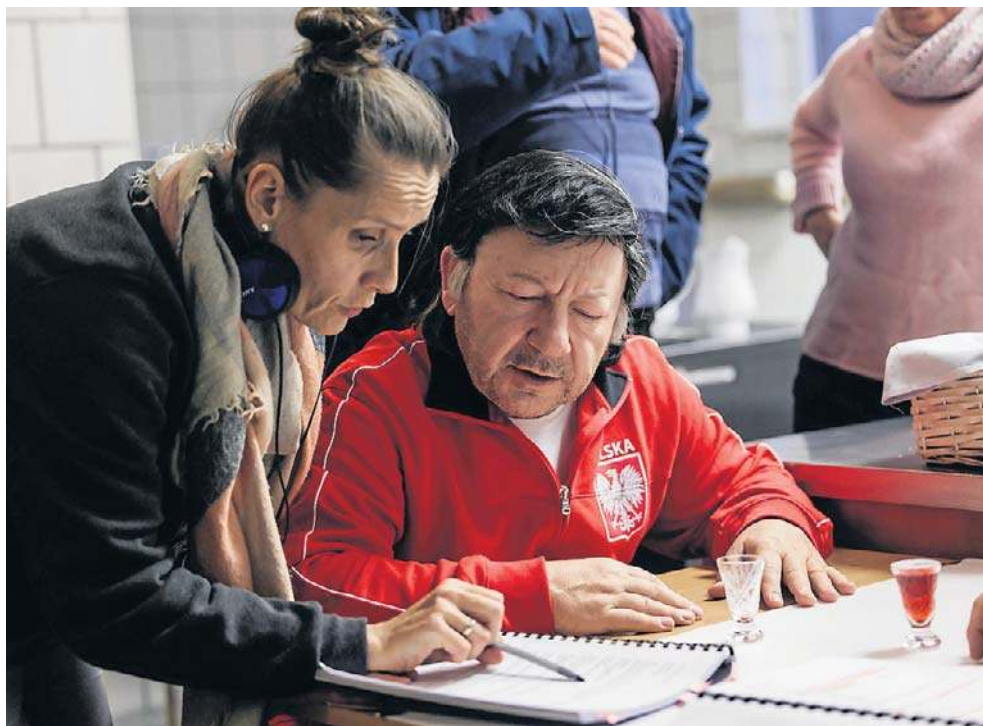
Jest rok 1974, Kazimierz Górski po raz pierwszy od 36 lat wprowadza Polskę do światowej piłkarskiej elity. Zbigniew Zamachowski w roli trenera Górskiego

- Z drzewa na stadionie Pogoni Lwów oglądałem jego popisy. Wspiąłem się na konar, żeby lepiej widzieć. Był niesamowity, potrafił przedryblować kilku rywali, położyć na murawie bramkarza i jeszcze tuż przed linią bramkową poczekać, aż wszyscy się pozbierają, po czym strzelał piętą do siatki. Miał przy tym szelmowski uśmiech na twarzy - wspominał w jednej ze swoich książek.