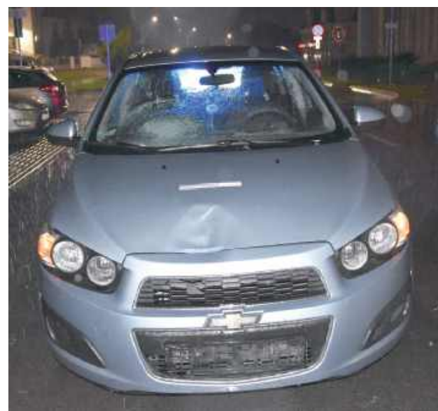
Oskarżona kierowała Chevroletem Aveo

- 17-letni pieszy, mieszkaniec Radzyna w wyniku po-