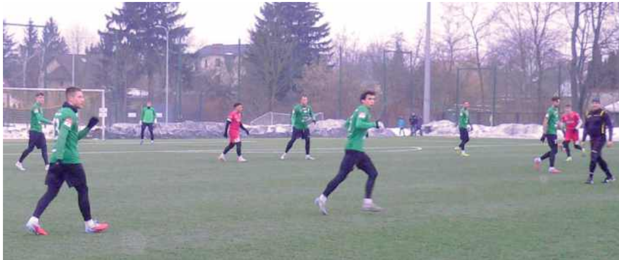
Zespół Podlasia zaliczył bezbramkowy remis z liderem IV ligi