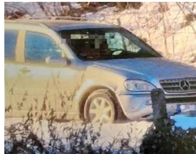
Zatrzymany usłyszał zarzut naruszenia zasad wykonywania polowania poprzez polowanie w okresie ochronnym oraz wejście w posiadanie tuszy zwierzyny

Funkcjonariusze, analizując zgromadzony materiał dowodowy oraz nagranie dołączone do zawiadomienia, w miniony weekend zatrzymali 48-latką.