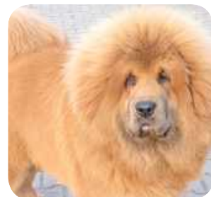
Brela, Sławomir Ziętek, Granice