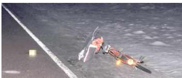
Oboje kierujący byli trzeźwi

Radzyń Podlaski: Policja wyjaśnia okoliczności wypadku drogowego na DK-19 w Kąkolewnicy. Ze wstępnych ustaleń wynika, że 88-latek, kierując samochodem marki Ford Fusion, potrącił rowerzystkę jadącą w tym samym kierunku.