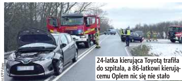
24-latka kierująca Toyotą trafiła do szpitala, a 86-latkowi kierującemu Oplem nic się nie stało

Nieustąpienie pierwszeństwa przejazdu było przyczyną kolizji, do jakiej doszło dziś rano na drodze wojewódzkiej 801 między Puławami a Dęblinem. Do szpitala trafiła młoda kobieta.