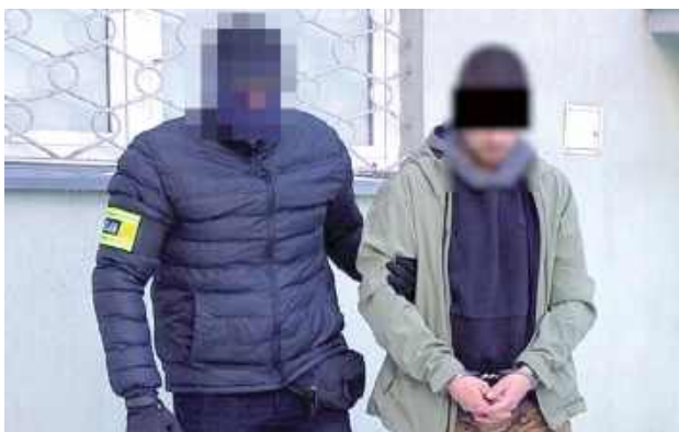
Trafił już do zakładu karnego

Biała Podlaska: Bialscy łowcy głów zatrzymali 28-latkę, który poszukiwany był listem gończym za przestępstwo narkotykowe. Ukrywał się od września ubiegłego roku. Próbował uniknąć wymierzonej kary, przebywając między innymi poza granicami Polski.