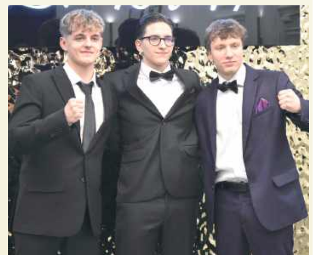
Panowie postawili na klasykę. Wyglądali niezwykle elegancko