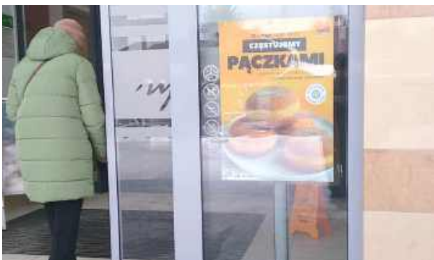
„Rywal” kusi łasuchów...