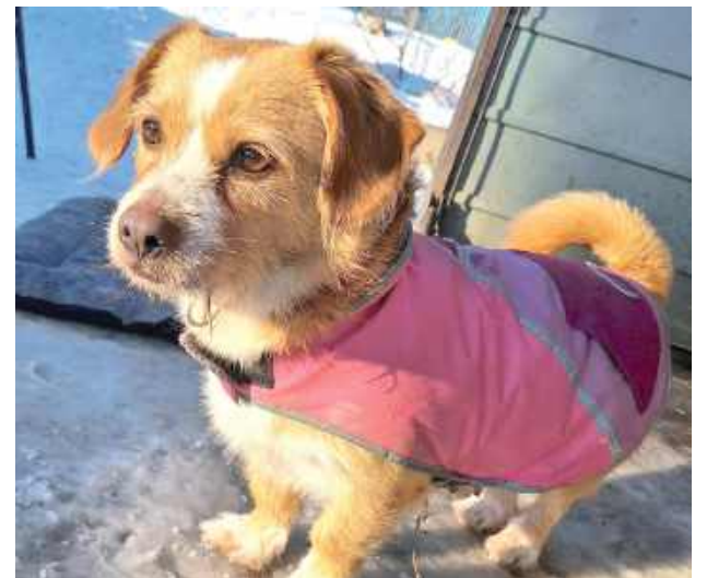
Misia szuka domu i nowej rodziny