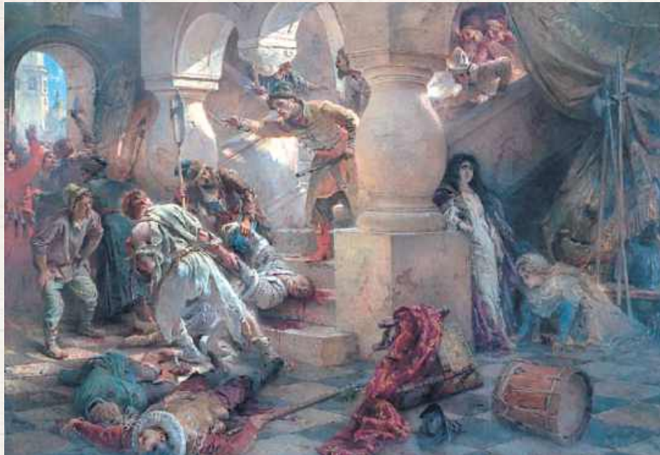
Śmierć Łędymitra. Obraz Konstantina Makovskyego

bystrzejszy z nich, Jerzy Mniszech zdiagnozował sytuację, było już za późno. Opozycja nie próżnowała. Na jej czele stał Wasyl Szujski, jeden z najsprawniejszych polityków kraju. Początkowo wspierał Samozwańca, potem popadł z nim w konflikt i został skazany na karę śmierci. Wyrok zamieniono na wygnanie, a nawet po chwili i to odwołano. Szujski wrócił do Moskwy i natychmiast stworzył, umiejętnie grając na kilku - politycznej, społecznej, religijnej - bałajkach spisek. 27 maja nad ranem bunt eksplodował. Dobrze przygotowane grupy wdarły się do carskich komnat. Na temat okoliczności zabójstwa Dymitra mamy kilka relacji, nie ulega wątpliwości, że od początku jego los był przesadzony. Marynie udaje się wymknąć: niewysoka, bez szat, biżuterii, makijażu, wyzbyta carskiego majestatu, wymknęła się nierozpoznana między damami dworu, ponoć ukrywając się pod suknią najtejszej z nich. Potem zaboboni