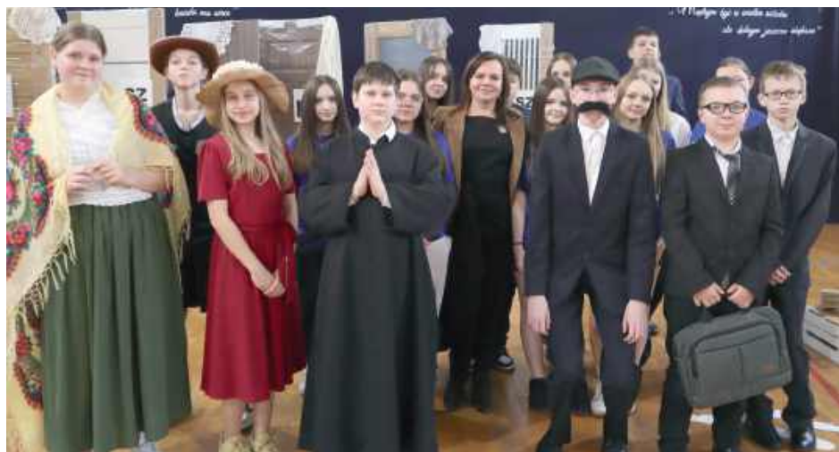
Centralnym punktem uroczystości była autorska inscenizacja przygotowana przez uczniów klasy VII, oparta na powieści Kornela Makuszyńskiego pt. „Szatan z siódmej klasy”

W Publicznej Szkole Podstawowej w Rzeczy 28 stycznia odbyły się uroczyste obchody Dnia Patrona Szkoły – Kornela Makuszyńskiego.