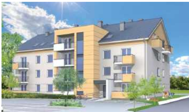
Wizualizacja zaplanowanego bloku socjalnego przy ul. Łomaskiej

Grupa mieszkańców budynków przy białskiej ul. Łomaskiej protestuje przeciw budowie budynku komunalnego. Złożyła w Urzędzie Miasta petycję w obronie jeży i ptaków w niewielkim zadrzewieniu, które częściowo zajmuje przygotowywany plac budowy.