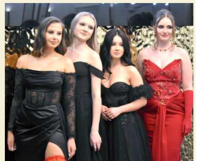
Panie prezentowały się olśniewająco