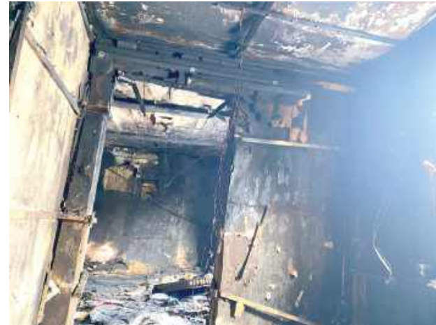
Dom został poważnie uszkodzony i w obecnym stanie nie nadaje się do zamieszkania. W jednej chwili jego mieszkańcy stracili dach nad głową, cały dobytek i poczucie bezpieczeństwa, które buduje się latami

Ogień pojawił się nagle i w krótkim czasie objął część budyn-