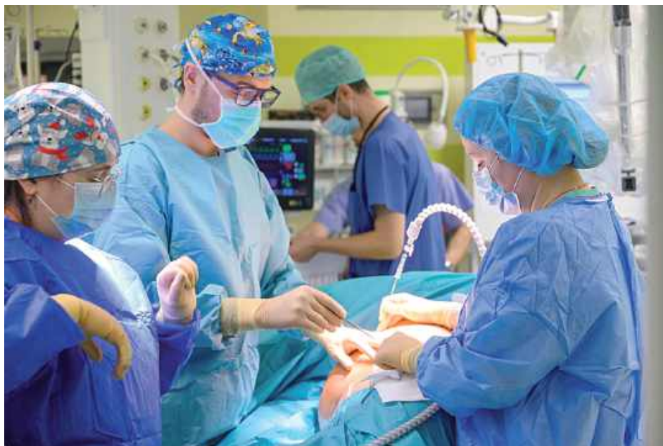
W II Oddziale Chirurgii Onkologicznej Centrum Onkologii Ziemi Lubelskiej im. św. Jana z Dukli robot da Vinci od dwóch lat wykorzystywany jest do operacji raka jelita grubego

usunięto guz chromochłonny nadnercza o średnicy 8 cm. Zmiana ta, czynna hormonalnie, powodowała u pacjenta niebezpieczne skoki ciśnienia tętniczego.