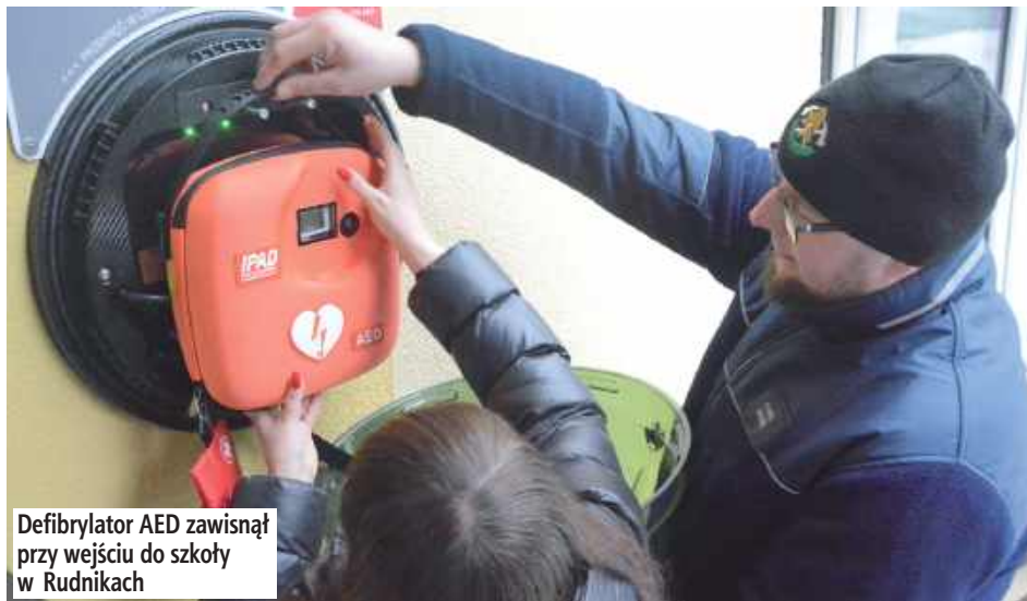
Defibrylator AED zawieszony przy wejściu do szkoły w Rudnikach

Po zamontowaniu urządzenia AED w sali gimnastycznej odbyło się spotkanie edukacyjne ze strażakami OSP Żerocin. Podczas prezentacji omówiono zasady działania defibrylatora oraz pod-