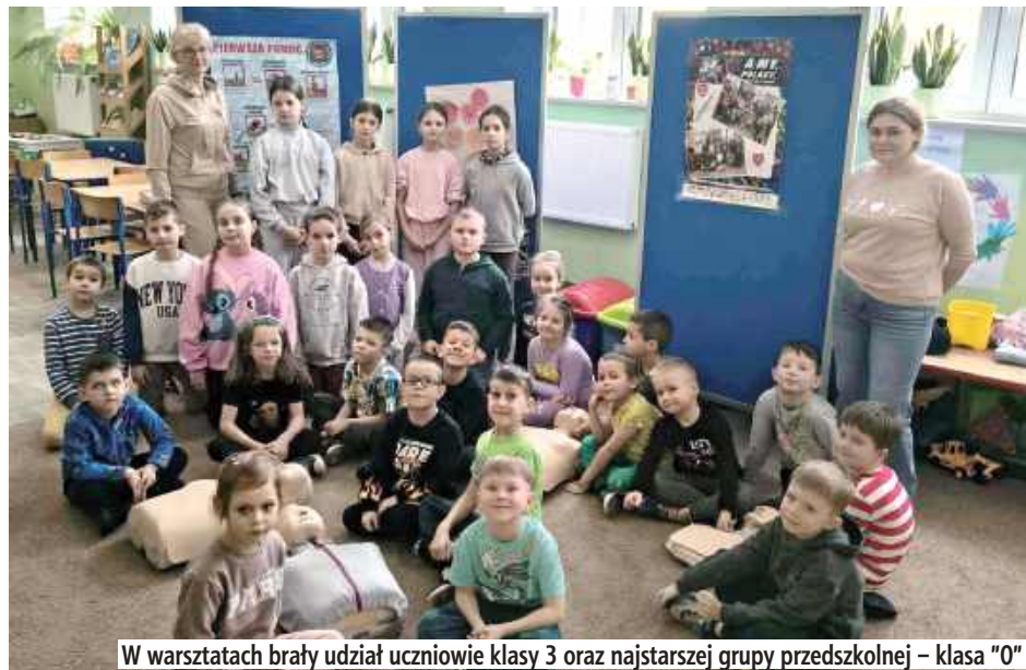
W warsztatach brały udział uczniowie klasy 3 oraz najstarszej grupy przedszkolnej – klasa „0”

Starsze dzieci zaprezentowały młodszym kolegom i koleżankom wiedzę oraz umie-