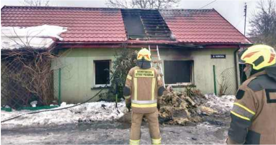
Na miejscu pracowały liczne zastępy straży pożarnej. Strażacy robili wszystko, by opanować sytuację, nie dopuścić do rozprzestrzenienia się ognia i zabezpieczyć teren