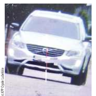
Mężczyzna pędził o 87 km/h za szybko...

- Za niestosowanie się do ograniczeń prędkości mężczyzna został ukarany mandatem