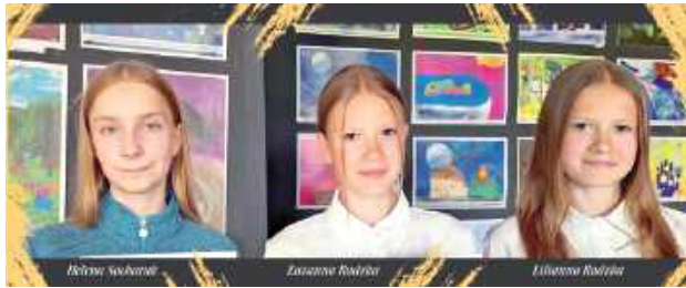
Młode artystki z Pracowni Grafiki Komputerowej „Piksel”

Działająca przy Białym Centrum Kultury Pracownia Grafiki Komputerowej „Piksel” staje się wizytówką Białej Podlaskiej.