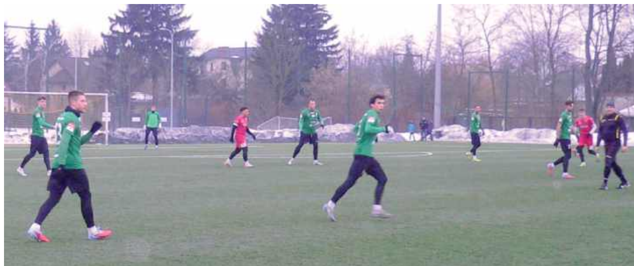
Zespół Podlasia zaliczył bezbramkowy remis z liderem IV ligi