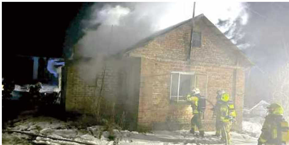
Do działań zadysponowano łącznie osiem zastępów jednostek ochrony przeciwpożarowej

Do działań zadysponowano łącznie osiem zastępów jednostek ochrony przeciwpo-