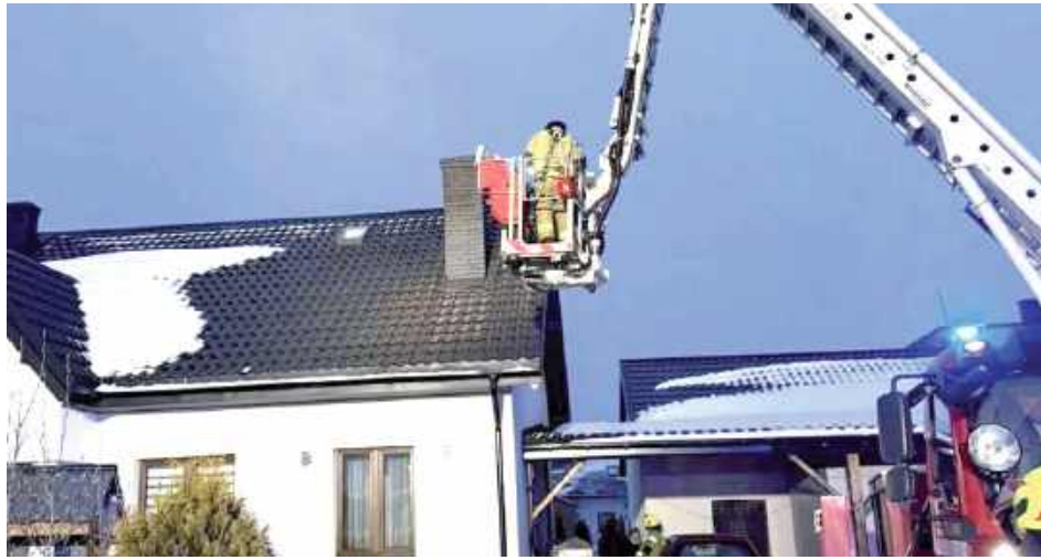
W akcji uczestniczyły jednostki OSP KSRG Krzywda, OSP Podosie oraz dwa zastępy JRG Łuków

Strażacy z Krzywdy podzielili się również praktycznym