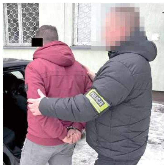
Zgodnie z obowiązującymi przepisami grozi mu kara do pięciu lat pozbawienia wolności

- Na miejscu okazało się, że 33-latek wszczął awanturę, podczas której zaatakował swoją partnerkę. W trakcie zdarzenia agresor wyzywał kobietę, bił i dusił ją oraz groził pozbawieniem życia. Z ustaleń funkcjonariuszy wynikało, że nie jest to pierwsze takie zdarzenie,