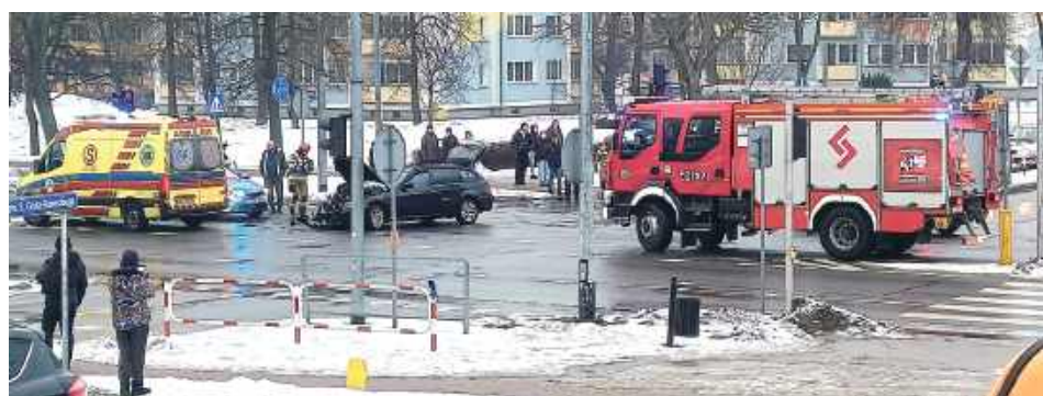
To nie jest pierwsza kolizja na tym skrzyżowaniu. Po jego przebudowie, gdy wykonano zjazd z ul. Lubelskiej w Norwida (na zdjęciu za pojazdem straży pożarnej), bardzo często dochodzi tu do tego typu sytuacji

Do groźnie wyglądającego zdarzenia doszło we wtorek popołudnie 10 lutego tuż po godz. 15. Jak wynika z ustaleń policji, 21-latek z gminy Puławy jechał ul. Lubelską od centrum w stronę Końskowoli. Chąc skręcić w lewo w ul. Norwida, nie ustąpił pierwszeństwa przejazdu jadącemu z naprzeciwka Audi, którym kierował 42-letni mieszkaniec gminy Kurów. Doszło do zderzenia obu pojazdów, w wyniku czego BMW obróciło się i uderzyło w stojącą za nim Skodę, za kierownicą której sie-