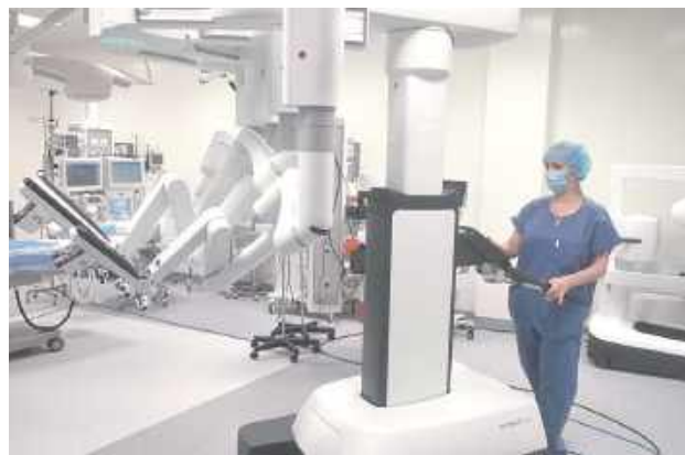
Robot chirurgiczny da Vinci 5 najnowszej generacji w Wojewódzkim Szpitalu Specjalistycznym im. Stefana Kardynała Wyszyńskiego w Lublinie

- Niektórzy piszą, że ten szpital jest najbardziej zadłużony. To prawda. Tylko że restrukturyzacja, którą prowadzi pan dyrektor, doprowadziła w 2025 roku do tego, że gdyby nie odsetki z poprzednich lat zaciągniętych