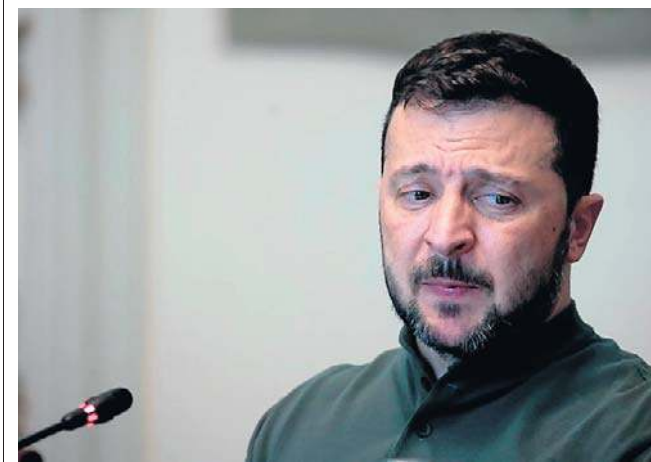
Prezydent Zełenski zaproponował podzielenie się doświadczeniem w walce z dronami

Ukraiński przywódca odwiedził w ciągu ostatnich dwóch miesięcy kilka państw Bliskiego Wschodu, w tym dwukrotnie Arabię Saudyjską, Zjednoczone Emiraty Arabskie, Katar czy Syrię. Zełenski informował wcześniej, że Ukraina rozpoczęła współpracę z państwami tej części świata, dzieląc się z nimi doświadczeniem w walce z irańskimi dronami. PAP