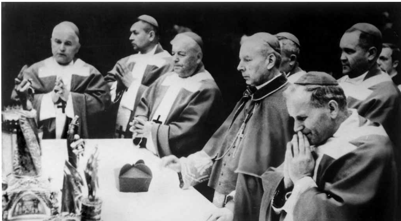
Kard. Stefan Wyszyński i kard. Karol Wojtyła w czasie uroczystej Mszy św. na Skałce 8 maja 1966 r.

Krakowskie uroczystości zaplanowano na trzy dni, od 6 do 8 maja, łącząc je z tradycyjną procesją ku czci św. Stanisława z Wawelu na Skałkę. Obchodom towarzyszyły dodatkowe wydarzenia, m.in. konferencje naukowe. Strona kościelna uzgadniała z władzami terenowymi ko-