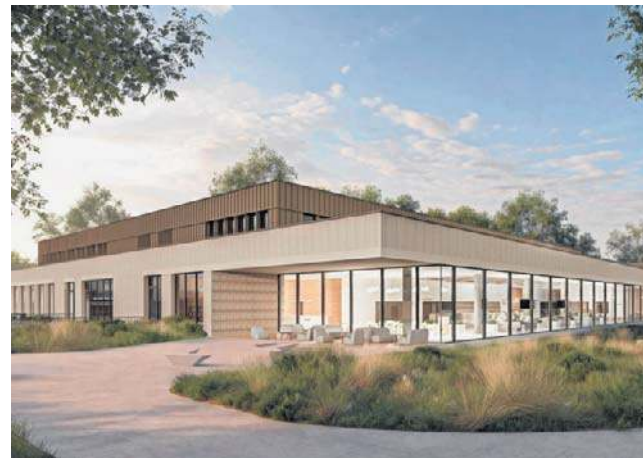
Wizualizacja obiektu sportowo-rekreacyjnego w Plewiskach. W jego skład wejdzie m.in. pływalnia

- Po analizie wszystkich propozycji wybrano koncepcję, która zdobyła największą liczbę punktów i najlepiej spełniła wymagania - informuje gmina Komorniki. - Wykonawcy mieli za zadanie przygotować koncepcję obejmującą m.in.: pływalnię z basenem sportowym i rekreacyjnym, wielofunkcyjną salę, salę sportów walki, strzelnicę i miejsce doraźnego schronienia (MDS).