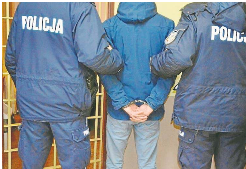
Policjanci zatrzymali 15-latkę rok po śmierci 13-letniej Wiktorie spod Lwówka

- 13-letnia Wiktorie została zamordowana, a samobójstwo upozorowane. Podejrzany o to jest 15-latek. To ustalenia naszego śledztwa. Samobójstwo dziewczynki wzbudzało podejrzenia. Sprawę przejęli policjanci z KWP w Poznaniu. Śledztwo prowadził prokurator z Prokuratury Okręgowej w Poznaniu. Zostały zdobyte materiały dowodowe, które okazały się kluczowe do wyjaśnienia śmierci dziewczynki. 24 marca