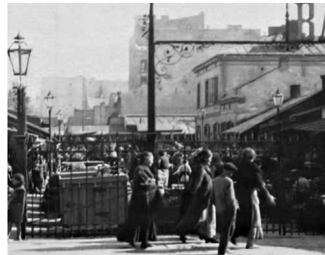
Bazar Różycyckiego w latach 30. To tutaj konfuzji ze strony niewiasty doznał Hersz Polinowicz