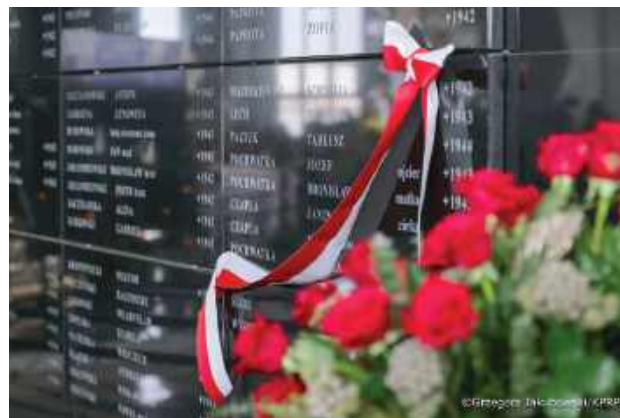
Podczas uroczystości w Toruniu odsłonięto także kolejne nazwiska Polaków zamordowanych za pomoc Żydom