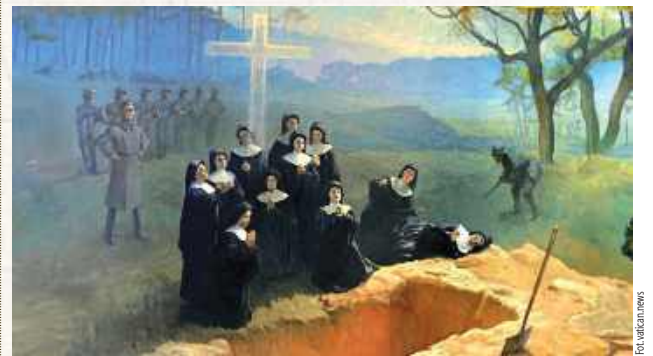
Męczenie Jedenaście Nazaretanek z Nowogródka na obrazie Adama Styki (1948)

Błogosławiona męczennica spod Kocka (cz. III) Wraz z siostrami dobrowolnie oddała życie za mieszkańców