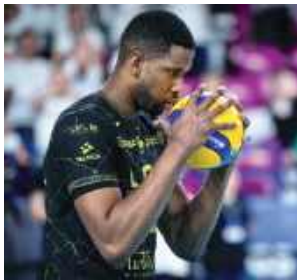
W lidze poszło im lepiej niż w pucharach

W minionym tygodniu dwa mecze rozegrali siatkarze Bogdanki LUK Lublin. Świetnie poszło im na krajowym podwórku, ale z rywalami z PlusLigi nie poradzili sobie w rozgrywkach Ligi Mistrzów.