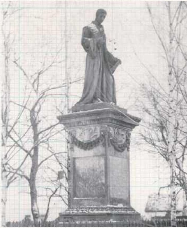
Pomnik księdza Kluka w Ciechanowcu, dłuta Jakuba Tatarkiewicza, 1850 rok

Dobra łukowska szkoła dała młodemu, zdolnemu, ciekawemu świata i piekielnie pracowitemu młodzieńcowi na tyle silne fundamenty rozwoju, że dalszą drogę przeszedł niemal samodzielnie. Ani własne finanse, ani mecenat możnych nie predystynowały go do odbycia studiów zagranicznych. Przyjął święcenia kapłańskie w zakonie misjonarzy, po czym pełnił funkcję kapelana u Tomasza Ossolińskiego, wreszcie osiadł na probostwie w rodzinnym Ciechanowcu i tam też prowadząc, w dużej części w plebańskim ogrodzie, badania botaniczne. Nie wiemy też o jego podróżach wewnątrz kraju, więc jego obserwacje są ograniczone do flory i fauny Podlasia, Mazowsza i Lubelszczyzny. Jako badacz był