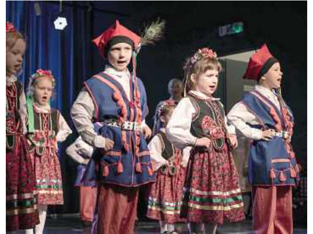
Dzieci w strojach krakowskich