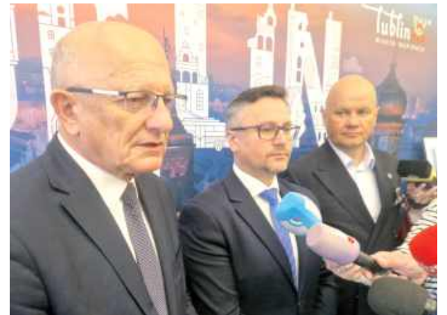
Prezydent Krzysztof Żuk (pierwszy z lewej) ogłasza rozpoczęcie procedury wyłonienia wykonawcy przebudowy stadionu żużlowego w Lublinie

Termin składania ofert w postępowaniu upływa 6 maja. Po rozstrzygnięciu przetargu