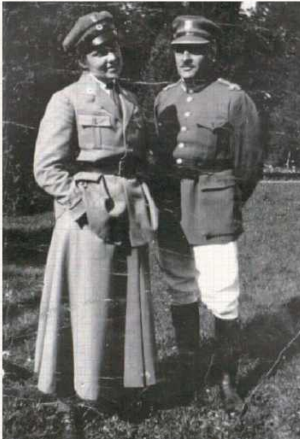
W 1920 roku szpital hrabiny został wcielony do wojska i towarzyszył oddziałowi Piłsudskiego walczącym na wschodzie. W sierpniu 1920 roku stanowił bezpośrednie medyczne zaplecze kontrofensywy nad Wieprza