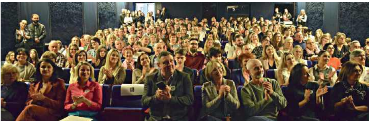
Publiczność szczelnie wypełniła widowie

Jestem absolwentką II LO i od dwóch lat uczestniczę w spektaklach jako pomoc. Myślę, że Scena 44 bardzo dużo dała mi w aspekcie radzenia sobie ze stresem i współpracy z ludźmi. W Scenie 44 jesteśmy grupą i nie wolno o tym zapominać. To najważniejszy aspekt, który pomógł mi wdrożyć się w dorosłe życie. Najbardziej pamiętne przedstawienie to „Wojna nie ma w sobie nic z teatru”. Był to spektakl organizowany nie tylko przez nas, ale także przez grupę z Węgier, ponieważ uczestniczyliśmy w wymianie polsko - węgierskiej. To zapadło mi w pamięć, bo to był najbardziej liczny spektakl Sceny 44, na scenie było ponad 30 osób.