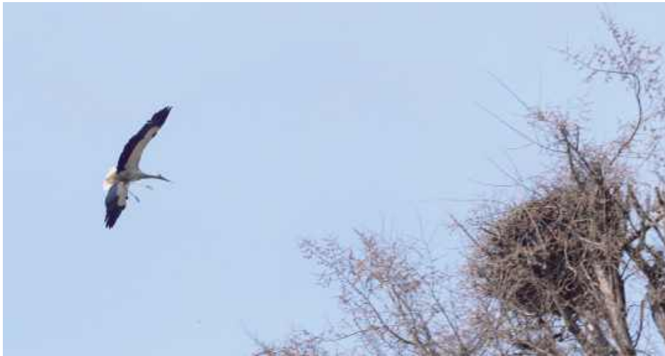
Bocian wraca do swojego gniazda w Lisowie

- Zrobiłem je w 2016 r. Założyłem rurę, potem obręcz. Resztę bociany zrobiły same. Od 2017 r. przylatują co roku. Zawsze mają młode. Nie było jeszcze takiego