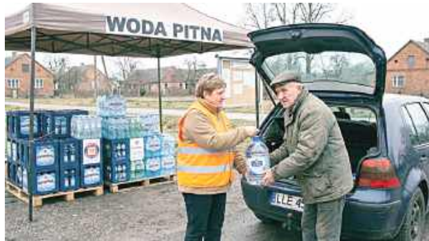
Bakterie coli w kranach. Sanepid zakazuje picia wody

Wyniki badań jakości wody w miejscowości Świerszczów doprowadziły do natychmiastowego zamknięcia tamtejszej stacji uzdatniania. Inspektorzy sanitarni wykryli skażenie bakteriami grupy coli, co stwarza bezpośrednie zagrożenie dla zdrowia mieszkańców.