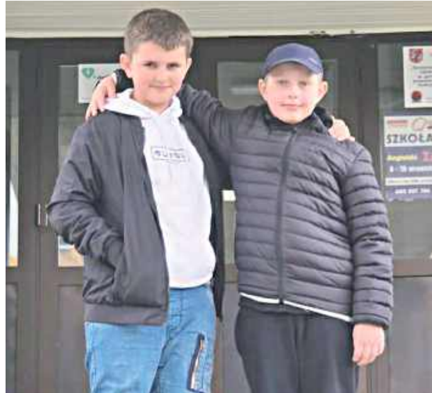
Piątoklasiści ruszyli na ratunek koledze, który przewrócił się na trybunach na boisku i poranił sobie twarz

- Na podkreślenie zasługuje fakt, że chłopcy, mimo padającego deszczu, byli przy poszko-