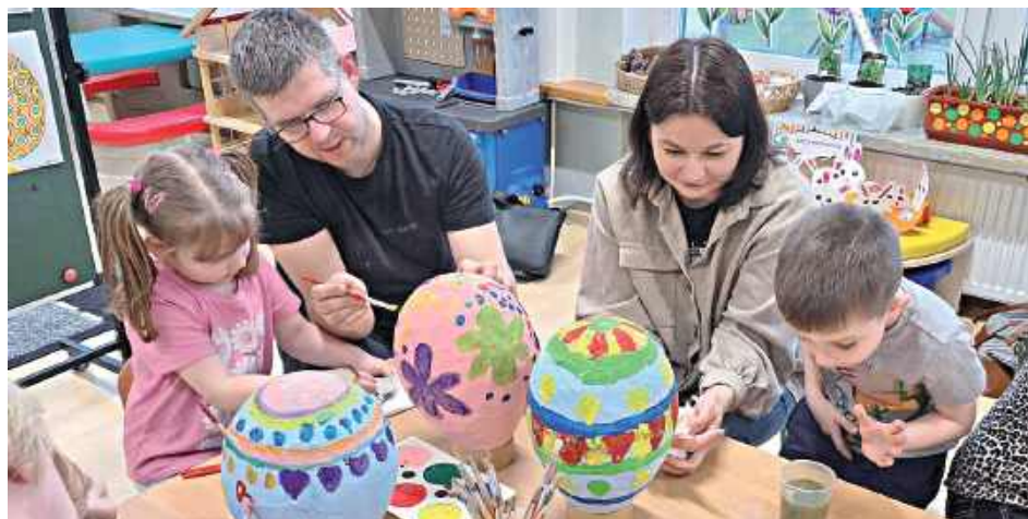
Wspólna praca przy pisankach