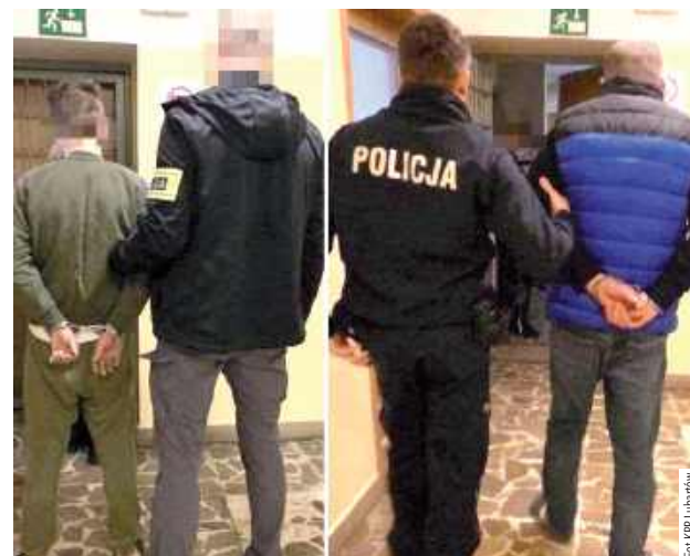
Sąd zastosował wobec obu podejrzanych środek zapobiegawczy w postaci trzymiesięcznego tymczasowego aresztowania

Sejf z pieniędzmi oraz sprzęt elektroniczny padł łupem włamywaczy w powiecie parczewskim. Złodzieje nie cieszyli się długo wolnością.