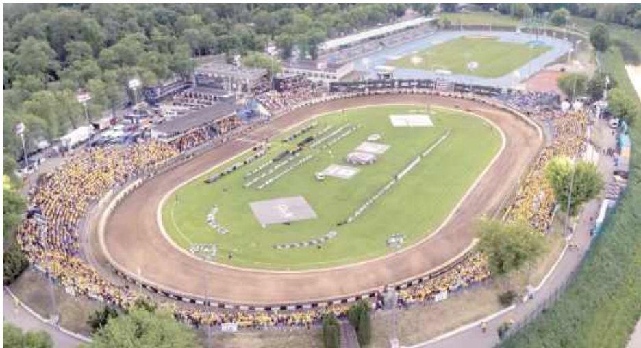
Jeśli tym razem się uda, ten obrazek stanie się pocztówką z przeszłości

Jednym z elementów inwestycji będzie budowa kładki przez Bystrzycę, która umożliwi komunikację stadionu z drugim brzegiem rzeki – zaznaczył prezydent Żuk. To