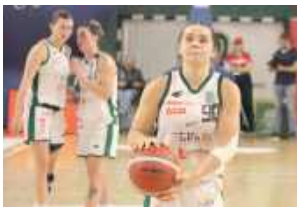
Lotto AZS UMCS Lublin jest bliski wywalczenia medalu mistrzostw Polski w obecnym sezonie

Koszykarki Lotto AZS UMCS Lublin awansowały do półfinałów Orlen Basket Ligi Kobiet. W pierwszej rundzie fazy play-off akademicki wyeliminowały Wisłę Kraków.