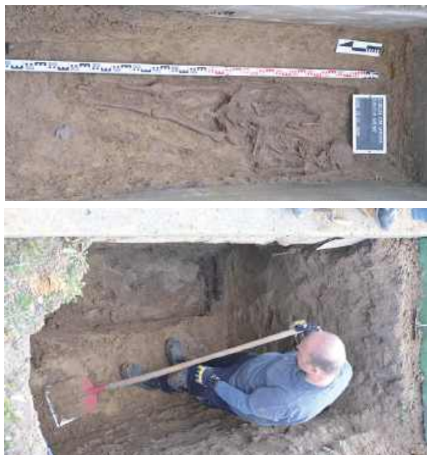
Szczątki przewieziono do Katedry i Zakładu Medycyny Sądowej UM w Lublinie, gdzie zostaną poddane szczegółowym badaniom medycznym oraz próbie identyfikacji genetycznej

- Dodatkowo na tym samym poziomie ujawniono szczątki przekazane na cmentarz z zakładu anatomii. Typowanie miejsca umożliwiły m.in. informacje zawarte w karcie grobu, gdzie w pierwszym pokładzie odnotowano zapis „Zamek”, bez podania personaliów ofiary. Jest to jeden z niewielu przypadków, gdy w dokumentacji cmentarnej zawarto in-