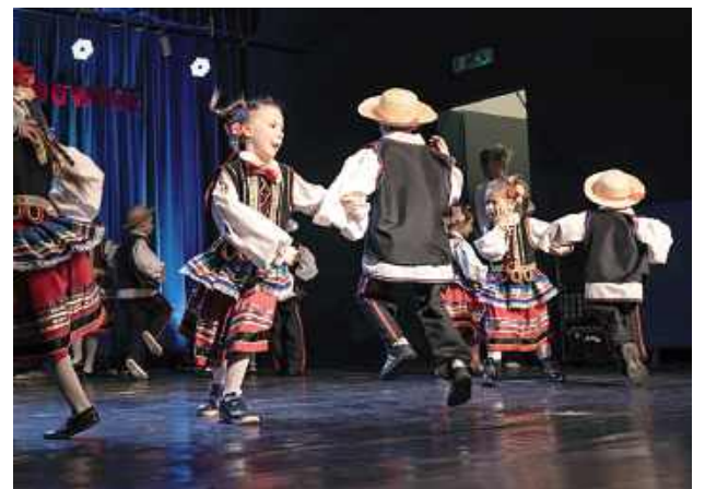
Dzieci zaprezentowały różne tańce