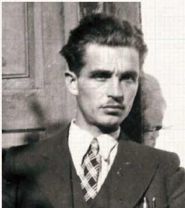
Mimo że szkołę podchorążych ukończył z jednym z lepszych wyników na roku, nie wiązał swojej przyszłości z wojskiem. Podjął pracę na poczcie. Po ucieczce z sowieckiej niewoli szybko stał się jedną z wiodących postaci w konspiracji ZWZ i AK w okolicach Ryk