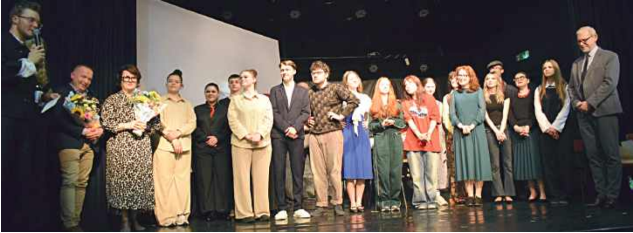
Artyści Sceny 44 na scenie