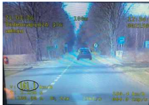
Kierowca BMW przekroczył prędkość o 91 km/h

- 22-latek został ukarany mandatem karnym łącznie w wysokości 4000 złotych i 30 punktów