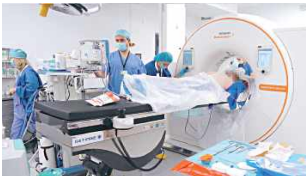
Modernizacja pracowni poprawiła nie tylko możliwości terapeutyczne, ale także ergonomię pracy zespołu medycznego i komfort pacjentów

LUBLIN: Nowoczesna, precyzyjna i bezpieczniejsza terapia nowotworów to efekt doposażenia Pracowni Brachyterapii w Centrum Onkologii Ziemi Lubelskiej.