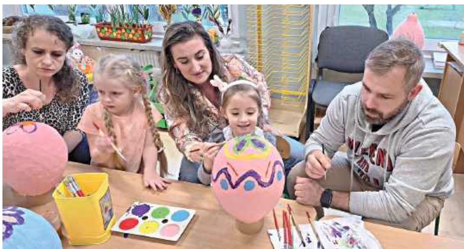
Wielkanocne jaja pięknie się udały dzieciom i ich rodzicom