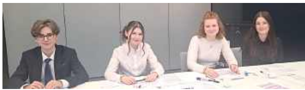
Ekipa z ZS 2

Finałowy Turniej Ligi Debat Europejskich w Urban Lab Lublin odbył się 20 marca. Zamykał cały cykl debat i warsztatów. Do finału dostało się 5 drużyn.