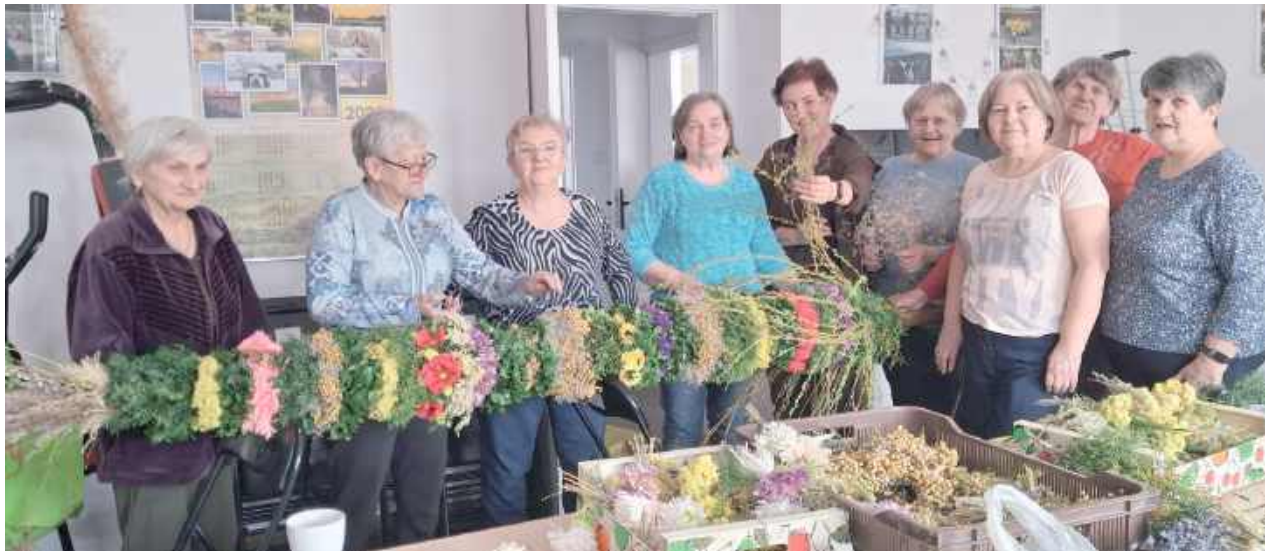
Seniorzy z baranowskiego koła nr 3 emerytów i rencistów nigdy się nie nudzą, bo podejmują różnorakie inicjatywy. Ostatnio uwili palmę o długości ponad 3 metrów

Baranowscy seniorzy zawsze są w pogotowiu. Pomagają m.in. ugościć pielgrzymów, którzy latem przechodzą przez teren gminy.