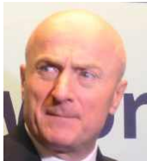
Jarosław Stawiarski marszałek województwa lubelskiego

- Staram się po prostu wykonywać jak najlepiej swoje obowiązki. Mam satysfakcję, że Biała pierwsza wychyciła błędy w systemie. Minister udawał, że nic się nie stało. A kursanci nie byli świadomi, że zostali kozłami ofiarnymi błędów ministra i jego urzędników. Ten problem dotyczy kandydatów na wszystkie kategorie prawa jazdy. Trwa analizowanie, w ilu przypadkach wylosowane błędne pytania miały wpływ na wyniki egzaminu. Trafiliśmy w Białej Podlaskiej na osobę, która uzyskała wynik negatywny, a zostało jej wylosowane pytanie z błędem. W tym przypadku także będziemy wnioskować o unieważnienie egzaminu i jeśli do tego dojdzie, osoba dostanie zwrot pieniędzy. Działamy najszybciej w Polsce.