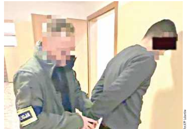
26-latek usłyszał zarzuty w związku z posiadaniem znacznych ilości narkotyków, jak i kierowaniem gróźb karalnych

Do lubartowskiej komendy zgłosił się mężczyzna, który zawiadomił policjantów, że syn grozi mu uszkodzeniem ciała, a nawet pozbawieniem życia. Takich zachowań dopuszczał się już niejednokrotnie, ojciec obawiał się, że syn je spełni. Funkcjonariusze pojechali na miejsce. W czasie interwencji znaleźli amfetaminę, tabletki ekstazy i marihuanę.