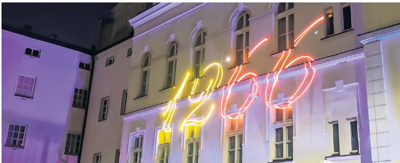
Muzeum w Koszalinie zaprosiło mieszkańców na wyjątkowy pokaz laserów pt. „Koszalin 1266 - 2026, osiem wieków światła, historii i ludzi”. Wieczne pokazy spotkały się ze sporym zainteresowaniem