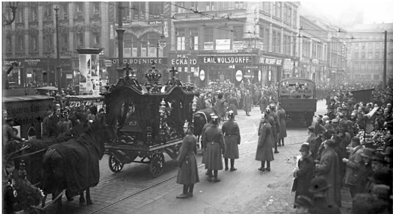
W pogrzebie Horsta Wessela wzięło udział 30 tys. ludzi. Dziś wykonywanie jego pieśni w Niemczech jest całkowicie zakazane i grożą za to kary

Brytyjski historyk Roger Moorhouse w tomie „Trzecia