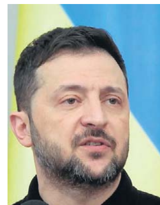
Zełenski sprzeciwia się niemieckiej propozycji

List został skierowany w piątek do przewodniczącego Rady Europejskiej Antonia Costy, przewodniczącej Komisji Europejskiej Ursuli von der Leyen i pre-