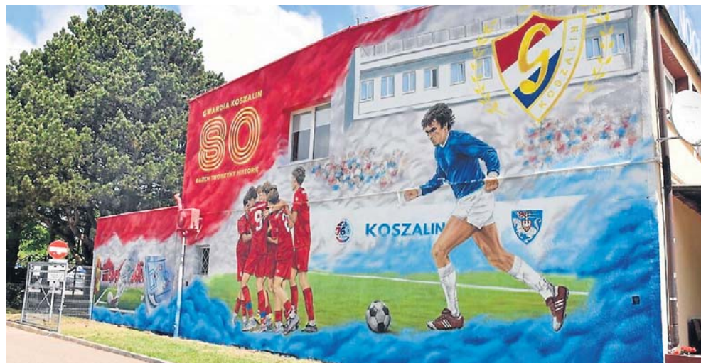
Równocześnie z urodzinami Koszalina swoje 80. urodziny świętował klub sportowy Gwardia Koszalin. Przy stadionie Gwardii powstał okolicznościowy mural