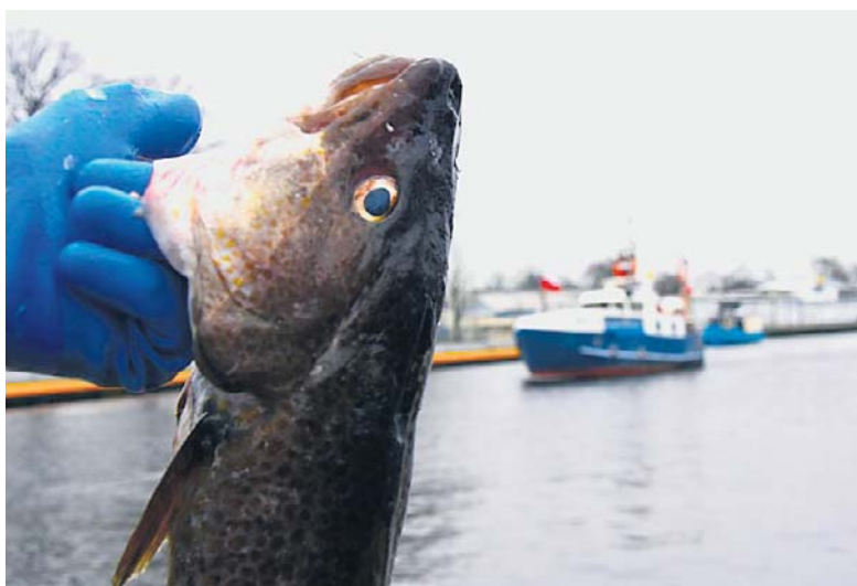
W Darłowie za smażonego dorsza trzeba zapłacić 17 zł za 100 gramów ryby. Niewiele tańsza jest tuszka z flądry - 15 zł za 100 g

- Trzeba tu zdecydowanie podkreślić, że dorsz był tą rybą w rybołów-