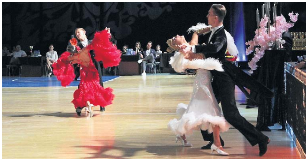
Pasja Cup 2026. W turnieju Puchar Polski Par Dorosłych i Młodzieży Starszej Pasja Cup udział wzięły najlepsze pary taneczne z Polski z różnych grup wiekowych