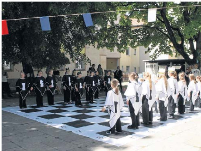
W ramach Dni Koszalina Pałac Młodzieży zaprosił dzieci i młodzież na turniej szachowy

Na naszej stronie internetowej GK24.pl znajdziecie zdjęcia i relacje z wielu tych wydarzeń. ©