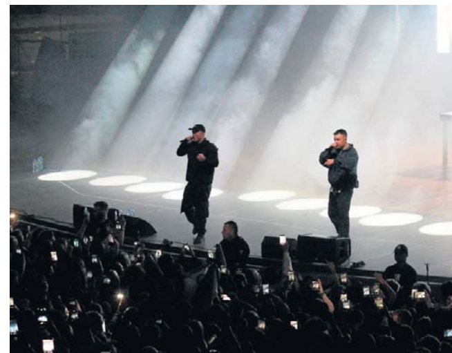
W piątek w koszalińskim amfiteatrze odbył się koncert zespołu hip-hopowego PROBL3M