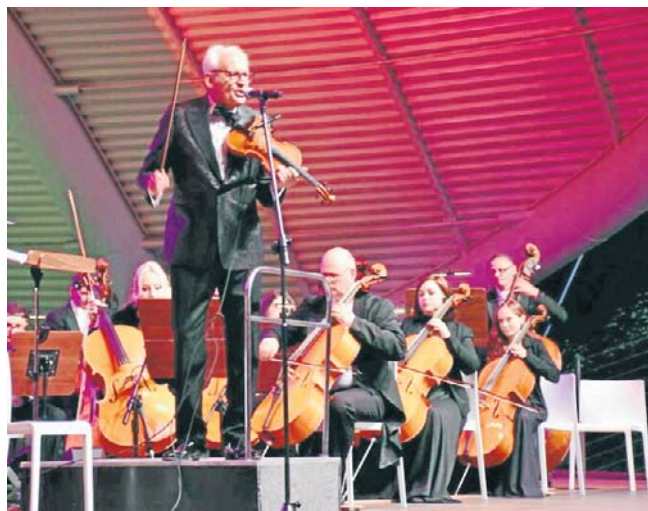
Koncert muzyki filmowej Krzesimira Dębskiego w koszalińskim amfiteatrze zgromadził sporą publiczność