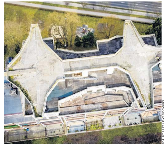
FOT. ROBERT LEWANDOWSKI

Po głośnych pracach z 2024 roku, na zewnątrz zapanowała cisza, co wzbudziło pytania o to, czy spółdzielnia nie zabrakło funduszy na dokończenie operacji. Z najnowszych doku-