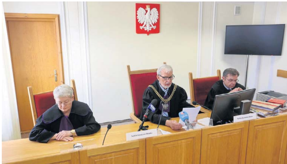
Sąd Apelacyjny w Rzeszowie potwierdził ustalenia i stanowisko Sądu Okręgowego w Tarnobrzegu, podtrzymując wyrok 5 lat pozbawienia wolności