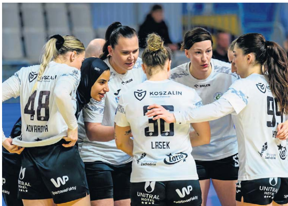
Koszalinianki zakończyły Orlen Superligę na 6. miejscu

Mistrzem Polski został zespół Zagłębia Lubin, który w decydującym spotkaniu pokonał osłabioną kadrowo drużynę MKS Lublin 29:26. © ©