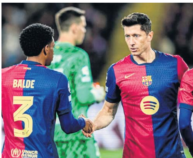
- Świetny piłkarz pożegnał się z ligą hiszpańską tak jak chciał, czyli strzelając ostatniego gola - napisał „Sport”

Zupełnie inaczej ostatnią kolejkę ligowych rozgrywek będzie wspominał Zieliński. Inter