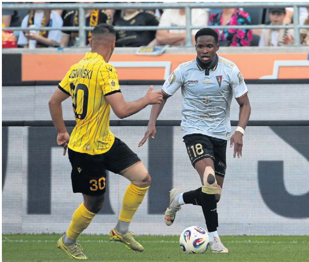
W Lubinie Pogoń więcej zainwestowała od gospodarzy, by wygrać ten mecz