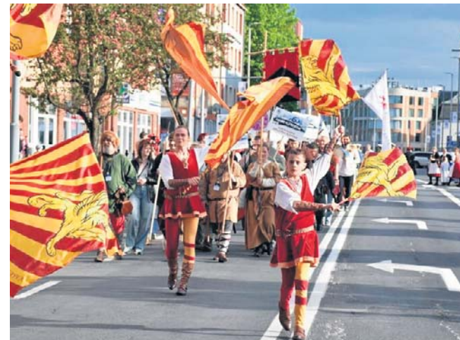
Obchody Dni Koszalina rozpoczęła w miniony czwartek parada historyczna, która przeszła ulicami miasta