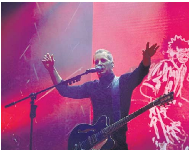
Koszalin Spring Festival. Na scenie Katarzyna Nosowska, Monika Brodka i Krzysztof Zalewski