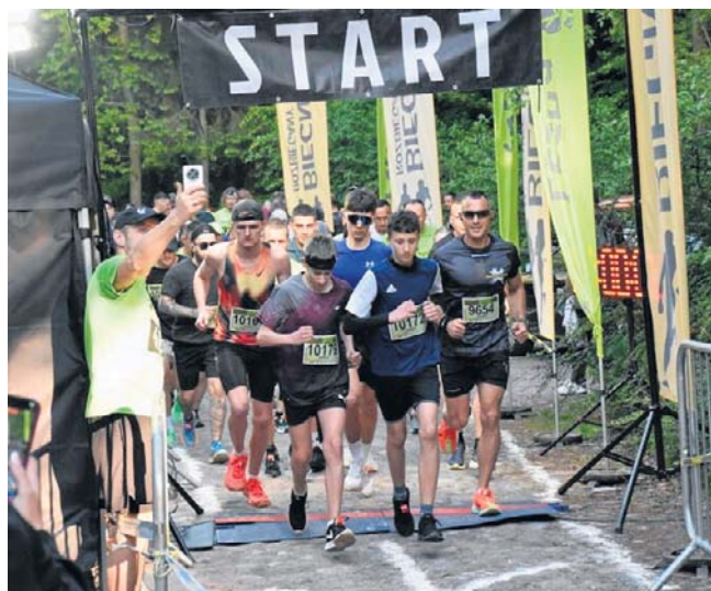
W programie Dni Koszalina znalazły się też sportowe inicjatywy, takie jak bieg Leśnej Piątki na... dyche.