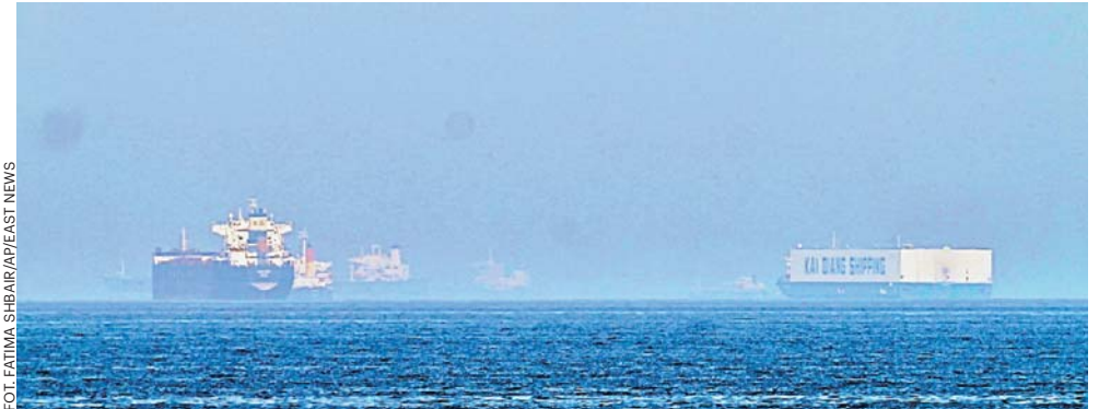
W ciągu 30 dni od osiągnięcia wstępnego porozumienia liczba statków przepływających przez Ormuz może wzrosnąć do poziomu sprzed wybuchu wojny

W sobotę prezydent USA Donald Trump oznajmił, że porozumienie z Iranem zostało