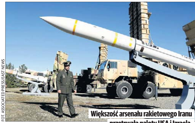
Większość arsenału raketowego Iranu przetrwała naloty USA i Izraela.

Okręt podwodny wyruszył na wschód z rejonu Gibraltaru we wtorek, po krótkim postoju w pobliżu tej brytyjskiej bazy (przyplłynął tam w sobotę). Powszechnie uważa się, że to USS Alaska, atomowy okręt podwodny klasy Ohio wyposażony w pociski balistyczne. Te jednostki typu SSBN stanowią jeden z podstawowych elementów amerykańskiej triady nuklearnej.