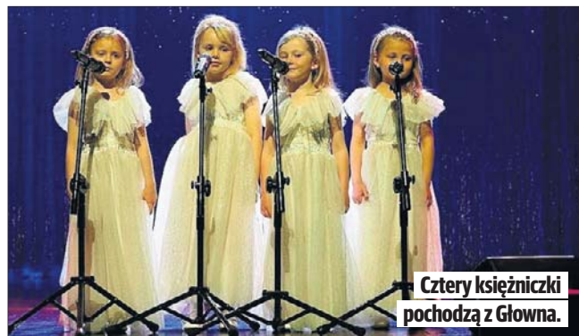
Cztery księżniczki pochodzą z Głowna.