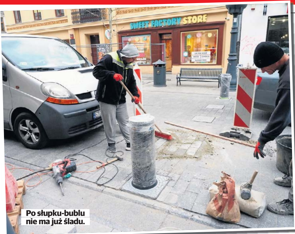
Po słupku-bublu nie ma już śladu.

• Lubiana aktorka i piosenkarka miała 79 lat STR. 13