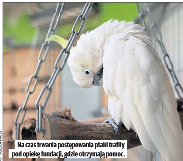
Na czas trwania postępowania ptaki trafiły pod opiekę fundacji, gdzie otrzymają pomoc.

- Obecnie prowadzone będą kolejne czynności procesowe, w tym sporządzenie dalszej opinii biegłego, dotyczącej wszystkich zabezpieczonych ptaków. Dalsze decyzje w tej sprawie zostaną podjęte po zgromadzeniu całości ma-