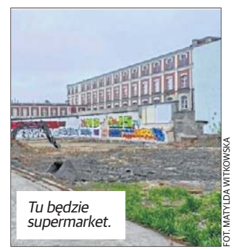
Tu będzie supermarket.

I podkreśla w okolicy działają już Lidl, Biedronka i Netto.