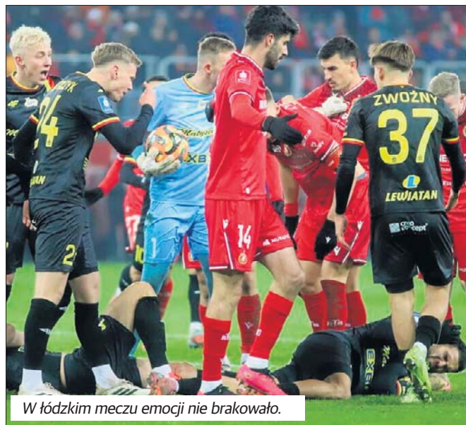
W łódzkim meczu emocji nie brakowało.

W przedostatnim spotkaniu sezonu piłkarskiej ekstraklasy, Widzew zmierzy się w Kielcach z Koroną. Piątkowe spotkanie jest szalenie ważne dla obydwu drużyn.