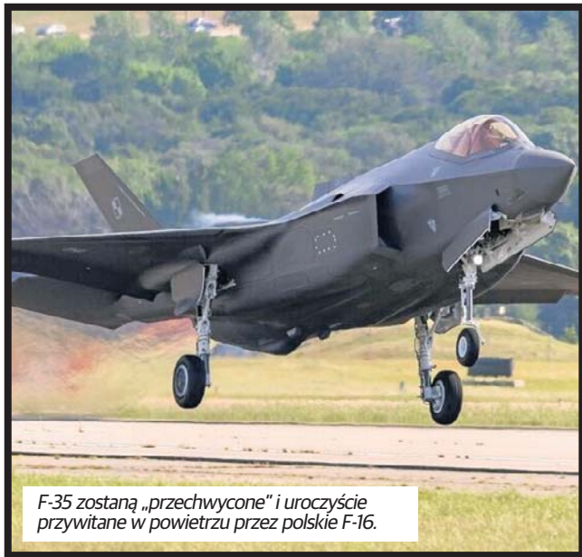
F-35 zostaną „przechwycone” i uroczyście przywitane w powietrzu przez polskie F-16.

Kluczem do przewagi F-35 nie jest jednak tylko trudnowykrywalność, ale rola „podniebnego centrum dowodzenia”. Maszyna posiada zaawansowane sensory i systemy fuzji danych, które pozwalają pilotowi widzieć wszystko, co dzieje się w promieniu setek kilometrów, i dzielić się tymi informacjami z innymi jednostkami na ziemi, morzu i w powietrzu. Polska zamówiła łącznie 32 takie maszyny. Zostaną one wyposażone w najnowocześniejsze oprogramowanie i systemy uzbrojenia, stając się fundamentem odstra-