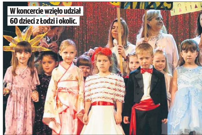
W koncercie wzięło udział 60 dzieci z Łodzi i okolic.