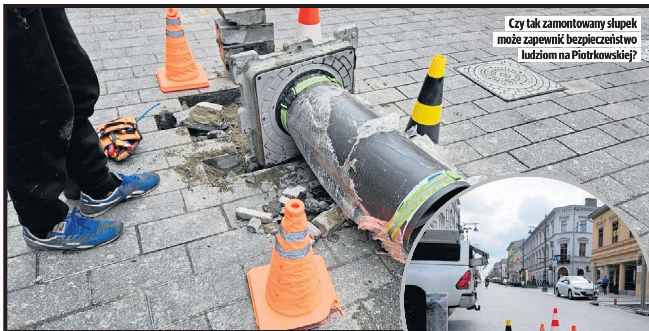
Czy tak zamontowany słupek może zapewnić bezpieczeństwo ludziom na Piotrkowskiej?