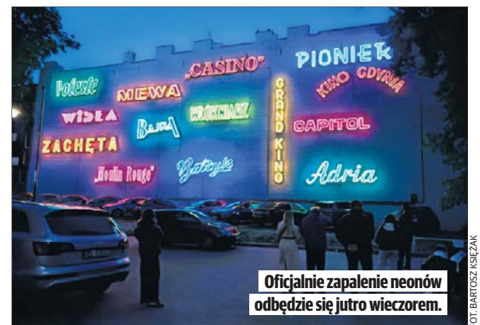
Oficjalnie zapalenie neonów odbędzie się jutro wieczorem.

Jej oficjalne otwarcie zaplanowano o godz. 20 w piątek 15 maja. A o godz. 21.15 odbędzie się pokaz filmu „Ucieczka z kina Wolność” w Fabryce Aktywności Miejskiej przy ul. Tuwima 10, w hallu na trzecim piętrze.