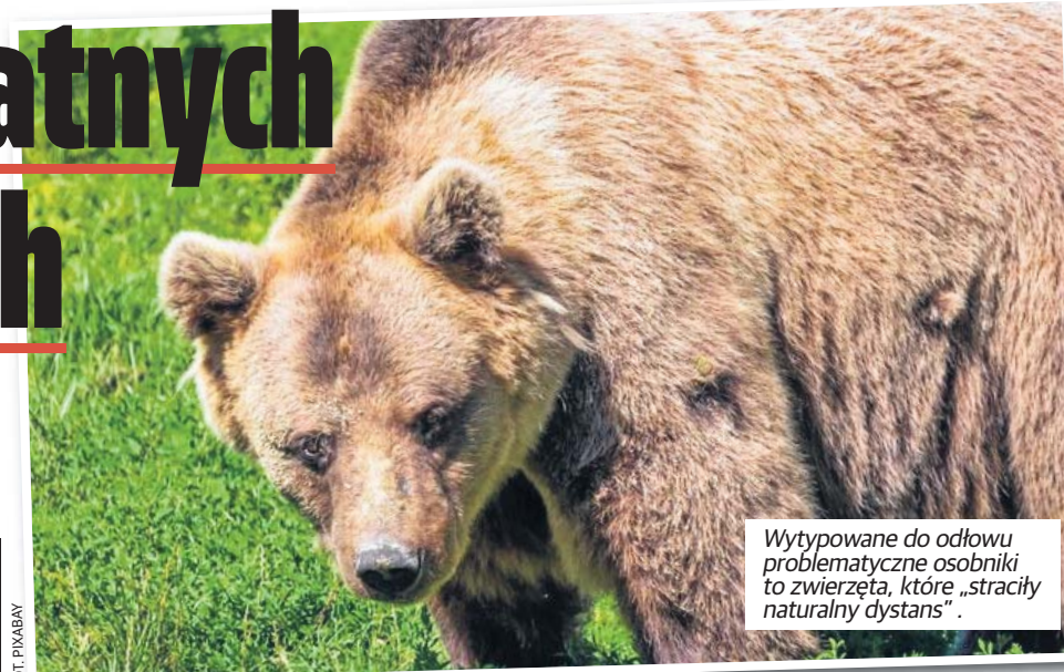
Wytypowane do odłowu problematyczne osobniki to zwierzęta, które „straciły naturalny dystans”.

Działania są odpowiedzią na sygnały płynące od mieszkańców i samorządów, które informują o coraz śmielszym zachowaniu niedźwiedzi. Dyrekcja w Rzeszowie odnotowuje 1-2 przypadki bezpośred-