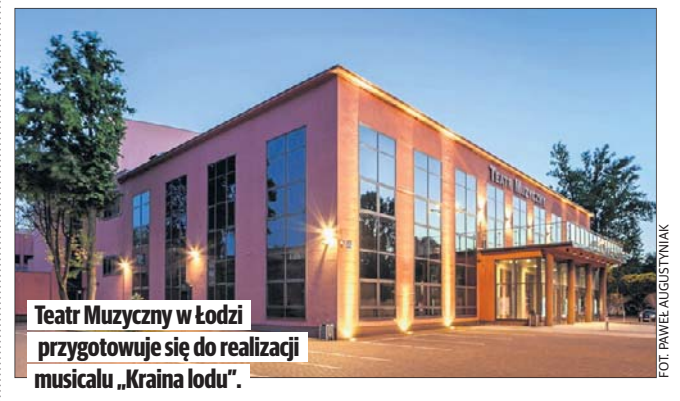
Teatr Muzyczny w Łodzi przygotowuje się do realizacji musicalu „Kraina lodu”.

„Kraina lodu” to jedna z najbardziej znanych animacji ze świata Disneya. Musical przeniesie widzów do królestwa Arendelle, gdzie dorastają księżniczki Anna i Elsa. Kiedy Elsa zostaje koronowana na królową, jej magiczne moce przejmują nad nią kontrolę, sprowadzając na krainę wieczną zimę. Anna wyrusza w podróż, by odnaleźć siostrę i sprowadzić ją do domu.