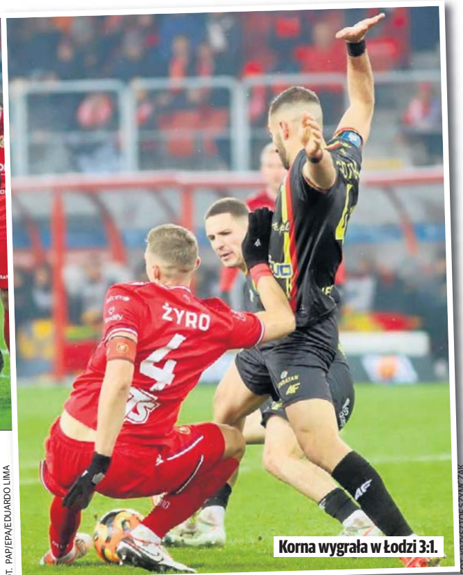
Kornia wygrała w Łodzi 3:1.