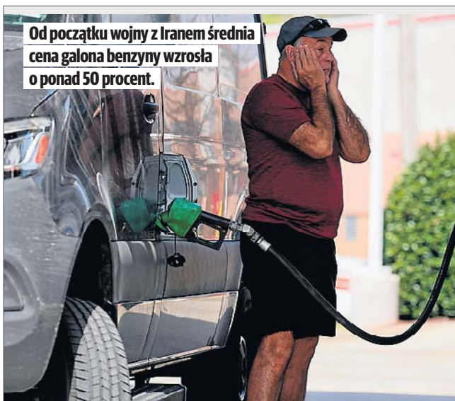
Od początku wojny z Iranem średnia cena galona benzyny wzrosła o ponad 50 procent.

- Jedynie, co ma znaczenie, gdy mówię o Iranie, to to, że nie mogą oni posiadać broni jądrowej - powiedział Trump przed opuszczeniem Białego Domu, gdy wyruszał w podróż do Chin. „Nie myślę o sytuacji finansowej Amerykanów. Nie myślę o nikim. Myślę o jednej rzeczy: nie możemy pozwolić Iranowi na posiadanie broni jądrowej. To wszystko. To jedyna rzecz, która mnie motywuje”.