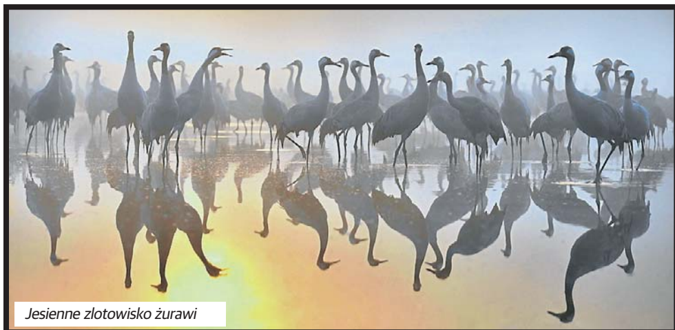
Jesienne zlotowisko żurawi