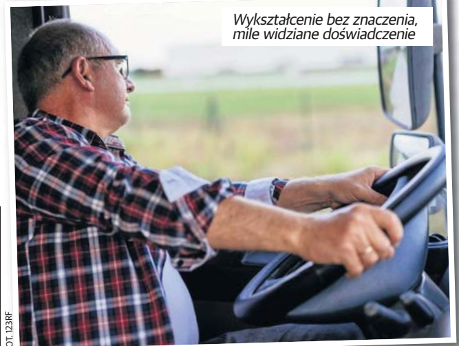
Wykształcenie bez znaczenia, mile widziane doświadczenie

- Te 10 tys. zł to żałosne wynagrodzenie, przeliczając to na warunki pracy oraz odpowiedzialność. Dla porównania kierowca we Włoszech ma zapewnioną 13. oraz 14. pensję. Kiedyś w Polsce zawód kierowcy samochodu ciężarowego był zawodem wykonywanym w szczególnie trudnych warunkach i była możliwość przejścia na wcześniejszą emeryturę. Jeżeli systemowo