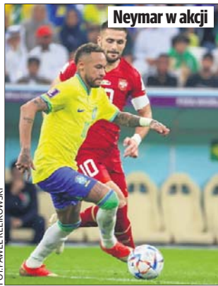
Neymar w akcji

Po odejściu z Paris Saint-Germain, Neymar przez półtora roku był zawodnikiem Al-Hilal Rijad. Był jednak chronicznie kontuzjowany i rzadko grał w saudyjskim klubie. W styczniu 2025 roku przeszedł do Santosu, którego jest wychowankiem i odbudowuje swoją formę. W tym roku strzelił sześć goli i zaliczył trzy