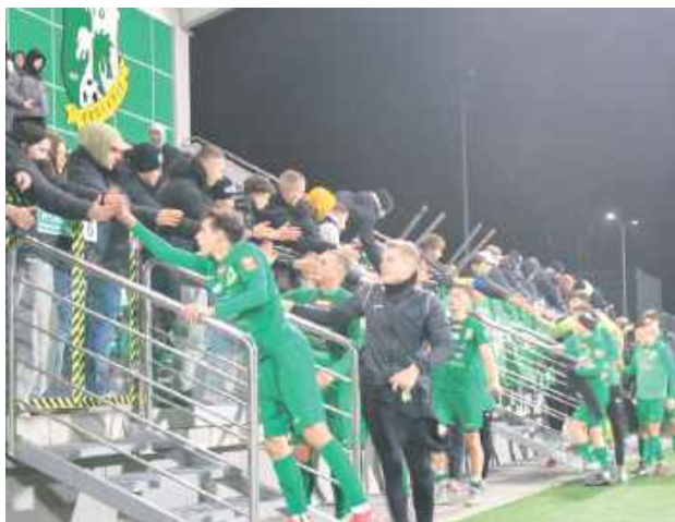
Podlasie rozprawiło się ze Starem!

Pierwszy gol dla gospodarzy padł w 23. minucie. Po serii nieudanych prób Mroza i Mikołajewskiego piłka trafiła do Piotra Urbańskiego, który uderzeniem z półwoleja nie dał szans Pawłowi Lipcowi. Stadion eksplodo-