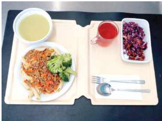
Dieta podstawowa z 6 listopada: Szpinakowa z ziemniakami 350 ml (MLE, SEL), makaron pełnoziarnisty 180 g (GLU), sos boloński z mięsem wieprzowym 200 g (GLU, SEL), surówka wielowarzynowa z kapusty białej i czerwonej z olejem 150 g (SEL), brokuł gotowany 100 g, kompot owocowy z cukrem 250 ml (cytat z jadłospisu szpitala)

Pod tym postem w ciągu dziesięciu dni pojawiło się prawie 600 lajków i 137 ko-