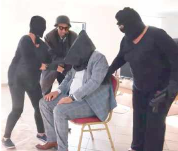
Pierwszy spektakl opowiada o porwaniu wójta przez seniorską szajkę

Cykl nosi tytuł „Cała prawda o Południowym Podlasiu w oczach mieszkańców”, ponieważ jego twórcy – wśród których znaleźli się także wójt, radni i działacze społeczni – opowiadają o swoim regionie z perspektywy codziennego doświadczenia. To historia o ziemi, tradycjach i wartościach, które