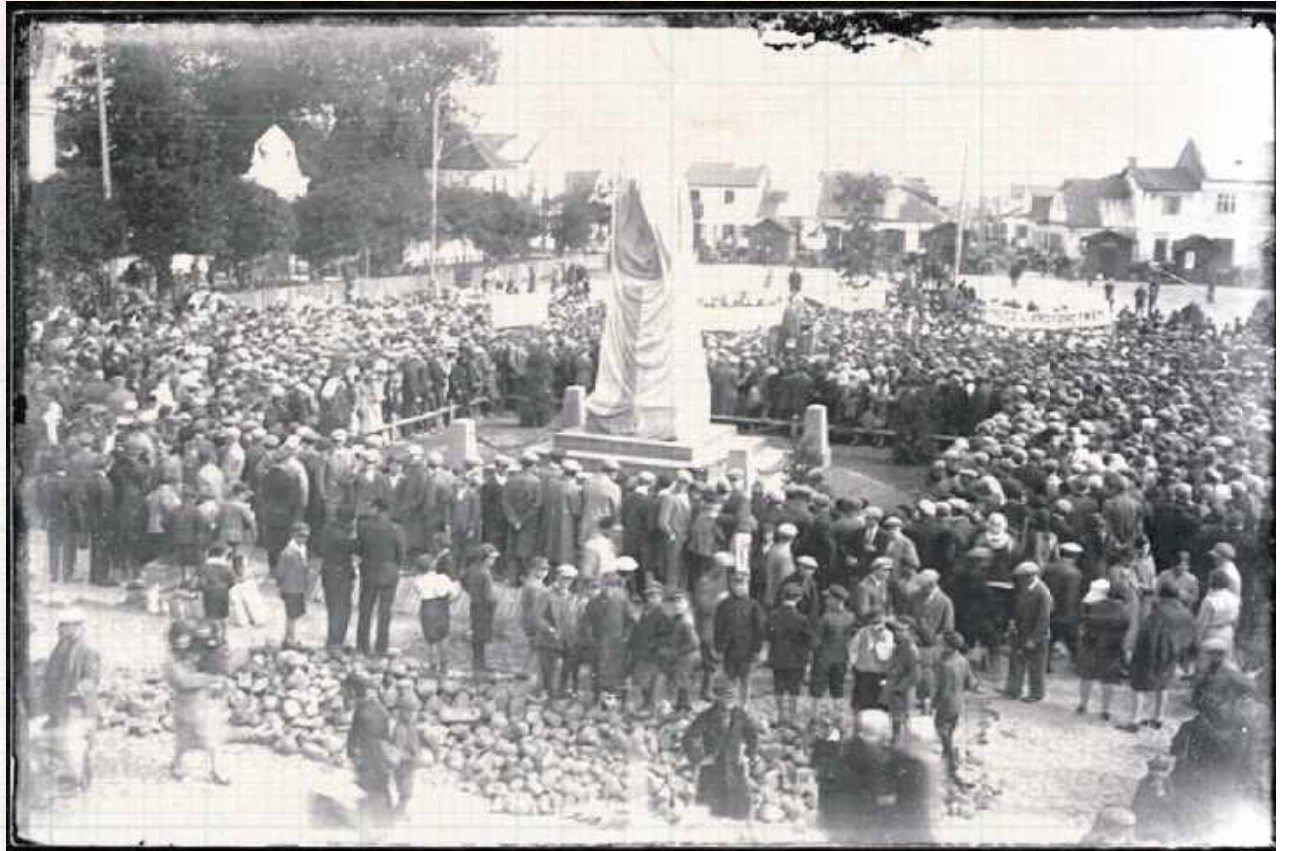
Odsunięcie pomnika ofiar Krwawych Dni Międzyrzecza w 1931 roku

Żeby rozbroić zaborców nie trzeba było wielkich sił. Czytamy w raporcie Komen-