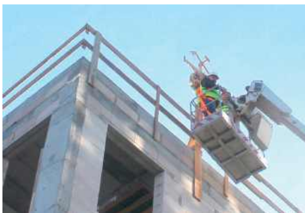
Starosta i prezes zawiesili wiechę na szczycie budynku starostwa w stanie surowym