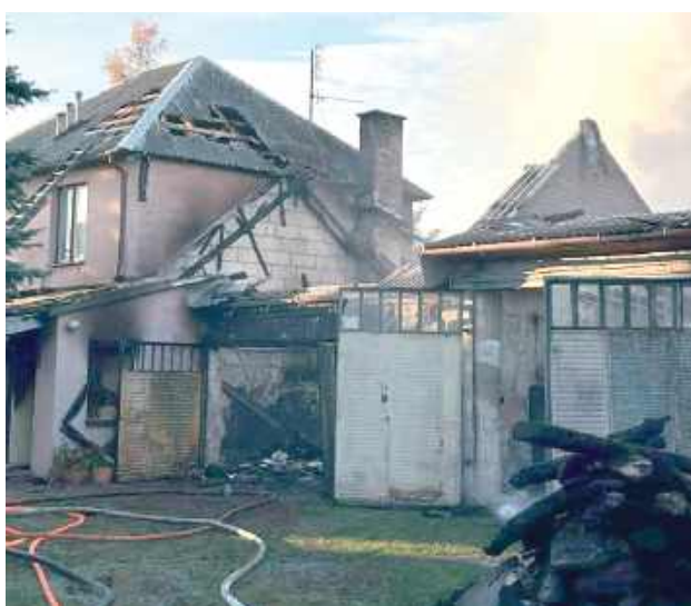
Według wstępnych szacunków straty sięgają ćwierć miliona złotych

Według wstępnych szacunków straty sięgają 250 tys. zł, natomiast wartość uratowanego mienia oceniono na 400-450 tys. zł.