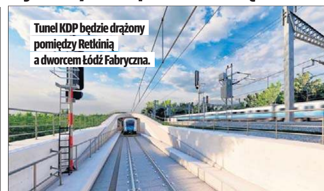
Tunel KDP będzie drążony pomiędzy Retkinią a dworcem Łódź Fabryczna.

Jako najbliższe zaplanowane zostało spotkanie dla miesz-