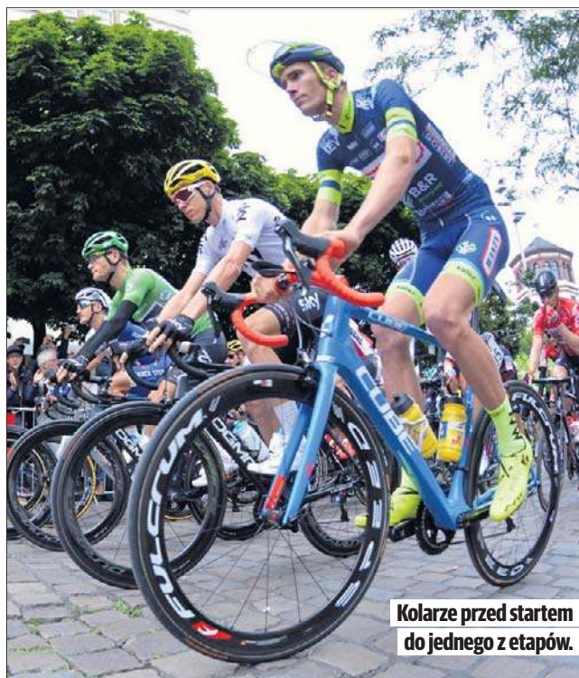
Kolarze przed startem do jednego z etapów.

W tym roku ściganie zacznie się 4 lipca w Barcelonie drużynową jazdą na czas.