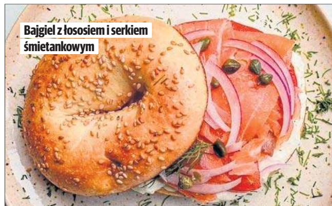
Bajgiel z łososiem i serkiem śmietankowym