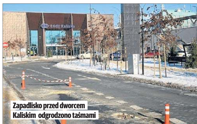
Zapadisko przed dworcem Kaliskim odgrodzono taśmami