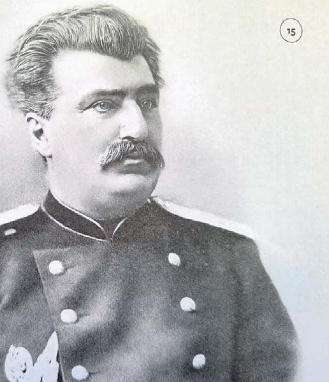
Mikołaj Przewalski był słynnym odkrywcą nowej rasy koni nazwanych jego nazwiskiem.

KUPIĘ ciągniki, przyczepy, maszyny rolne. Tel. 535135507.