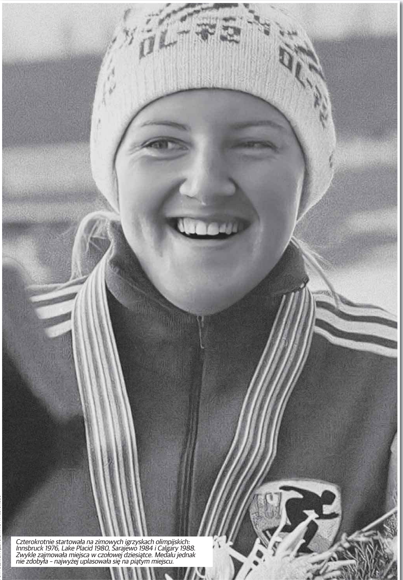
Czterokrotnie startowała na zimowych igrzyskach olimpijskich: Innsbruck 1976, Lake Placid 1980, Sarajewo 1984 i Calgary 1988. Zwykle zajmowała miejsca w czołowej dziesiątce. Medalu jednak nie zdobyła - najwyżej uplasowała się na piątym miejscu.

Zmarła w wieku 67 lat, 20 kwietnia 2022 roku, po długiej i ciężkiej chorobie. Pochowana w Alei Zasłużonych Cmentarza Wojskowego na Powązkach w Warszawie.