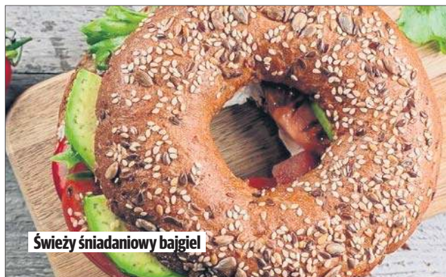
Świeży śniadaniowy bajgiel

Przekrój bajgla na pół i lekko go podpiecz w tosterze lub na suchej patelni - powinien być chrupiący na zewnątrz, a miękki w środku. Posmaruj obie połówki bajgla serkiem śmietankowym. Ułóż łososa równomiernie na jednej lub obu połówkach. Dodaj czerwoną cebulę - jeśli jest bardzo ostra, możesz ją wcześniej na 5 minut zalać zimną wodą. Posyp kaparami, dodaj koperek i odrobinę pieprzu. Skrop delikatnie sokiem z cytryny (opcjonalnie). Złóż bajgla lub jedz otwarte połówki.