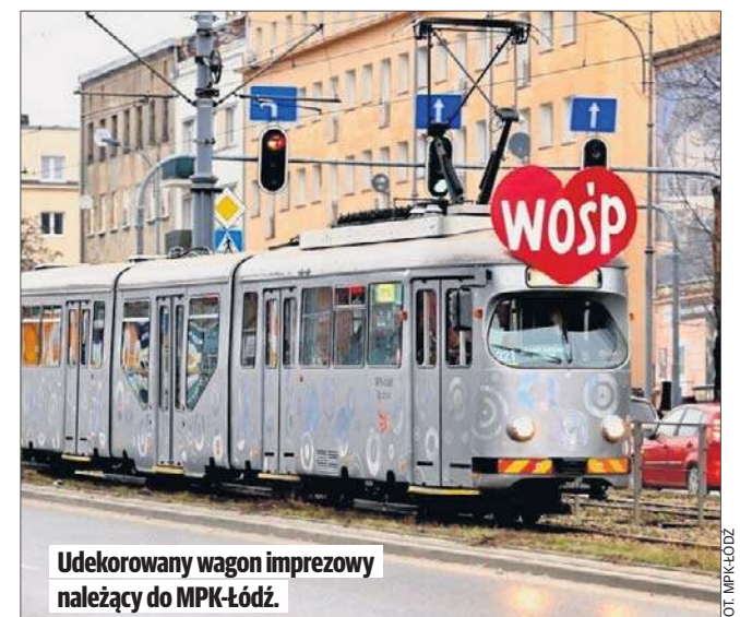
Udekorowany wagon imprezowy należący do MPK-Łódź.