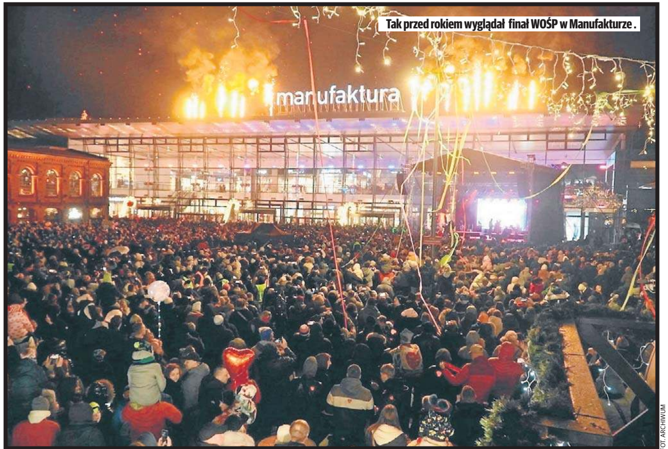
Tak przed rokiem wyglądał finał WOŚP w Manufakturze.

O godz. 20 zaplanowano ciche Świątełko do Nieba, a