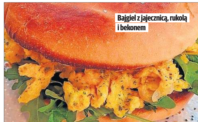
Bajgiel z jajeczną, rukolą i bekonem