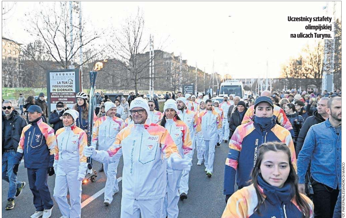
Uczestnicy sztafety olimpijskiej na ulicach Turynu.

Kolejną nowością podczas zimowych igrzysk będzie oparty na AI system śledzenia po-