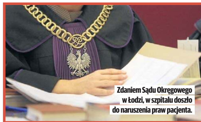
Zdaniem Sądu Okręgowego w Łodzi, w szpitalu doszło do naruszenia praw pacjenta.

Pacjentka po operacji nie miała czucia w nogach i nie mogła nimi poruszać. Lekarze wykonali reoperację i usunęli wodniaka śródrzeniowego, który powstałego w operowanym miejscu. Stan pacjentki jednak się nie poprawił. Niedowład nóg pozostał pomimo wielomiesięcznej rehabilitacji. Zdaniem biegłych sądowych, uszczerbek na zdrowiu jakiego doznała pacjentka, wynosi 100 proc. Kobieta nie porusza się samodzielnie, wymaga opieki.