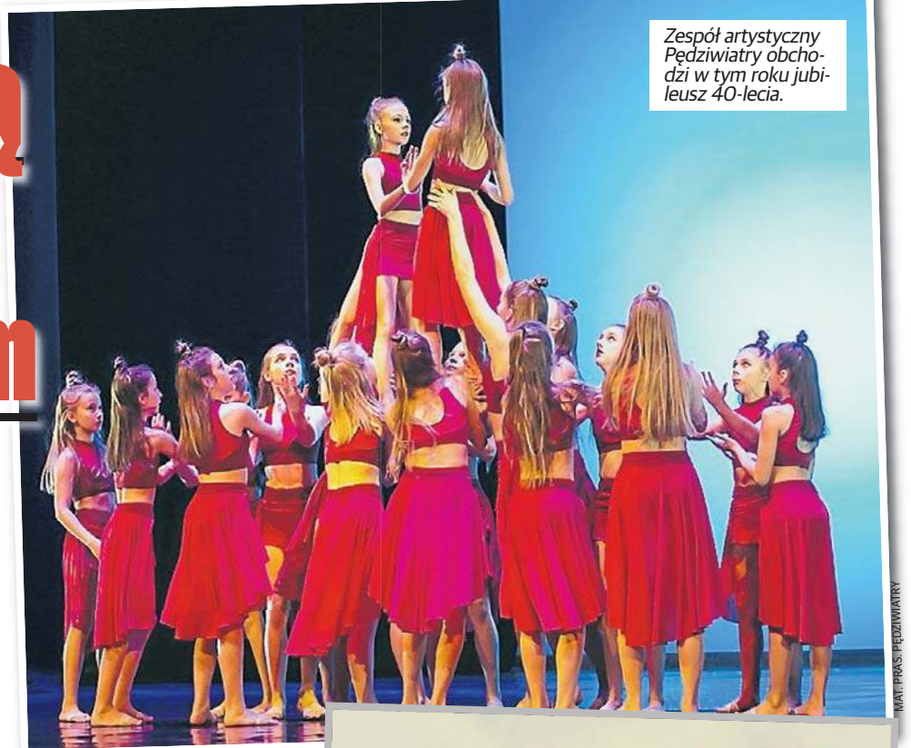
Zespół artystyczny Pędziwiatry obchodzi w tym roku jubileusz 40-lecia.

Na co dzień siedzibą Pędziwiałów jest Szkoła Podstawowa nr 34 przy ul. Cwiklińskiej w Łodzi.