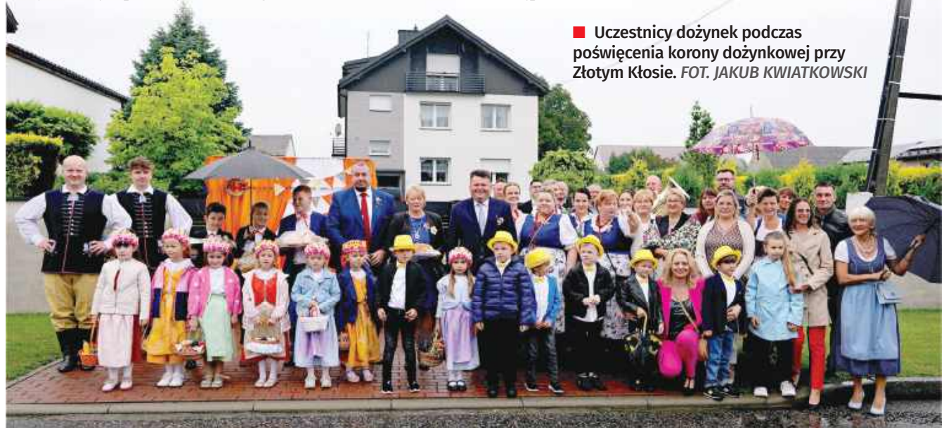
■ Uczestnicy dożynek podczas poświęcenia korony dożynkowej przy Złotym Kłose.