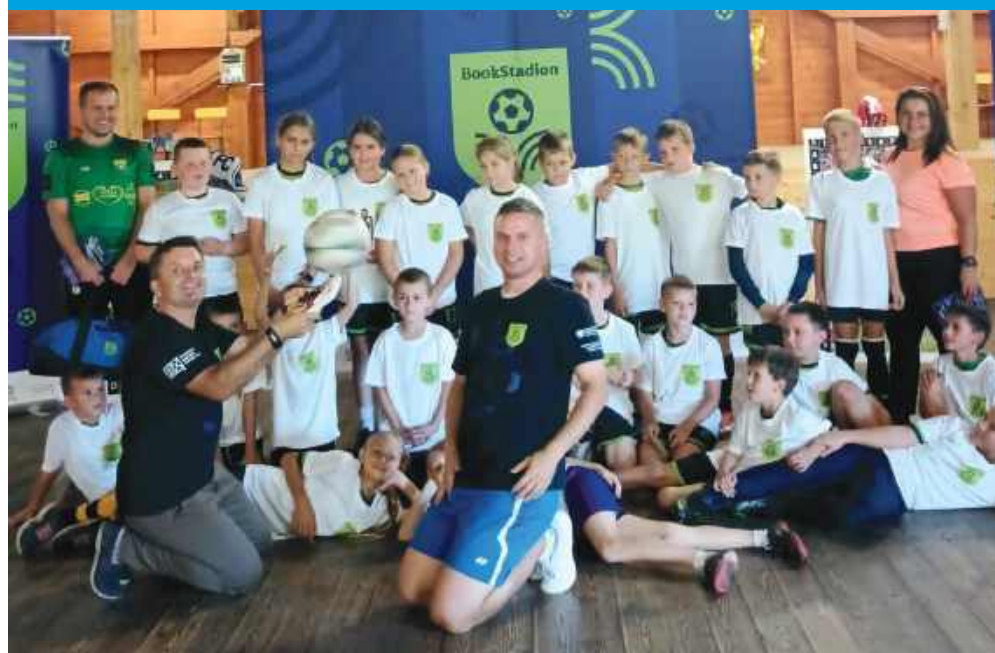
■ Młodzi fani futbolu odkryli, że sport i czytanie idą w parze. FOT. BIBLIOTEKA W RUDACH

Na boisku i w bibliotece młodzi fani futbolu przekonali się, że piłka i książki mogą tworzyć świetny duet. BookStadion połączył sportowe emocje z literackimi inspiracjami.