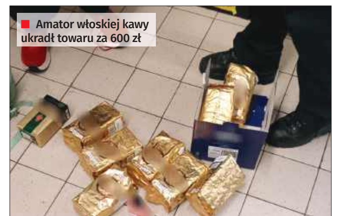
■ Amator włoskiej kawy ukradł towaru za 600 zł

Ekspedientka powiadomiła policję, a funkcjonariusze z komisariatu w Radlinie