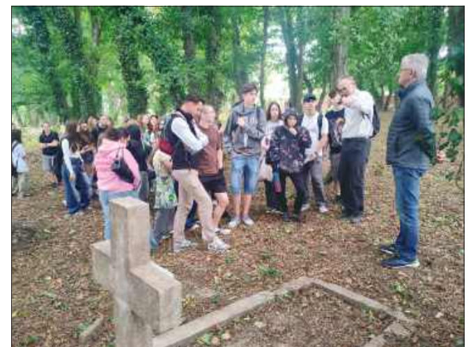
■ Uczniowie mogą zobaczyć groby młodych ludzi, którzy stali się ofiarami obu wojen