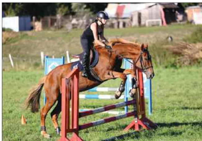
■ Skoki przez przeszkody zwińczyły część sportową Hubertusa