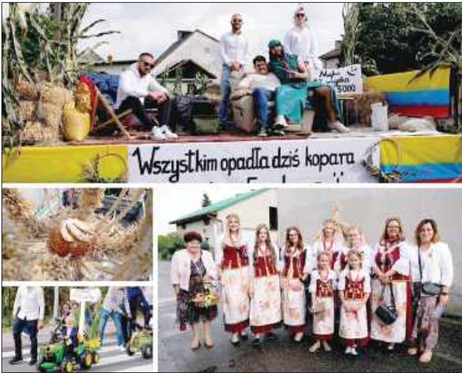
■ Barwny korowód w Zabetkowie podczas niedzielnych dożynek.

W niedzielę, 13 i 14 września, mieszkańcy Zabetkowa bawili się na dożynkach. Wzorem wielu innych miejscowości w powiecie raciborskim, również tutaj zorganizowano okolicznościowy korowód.