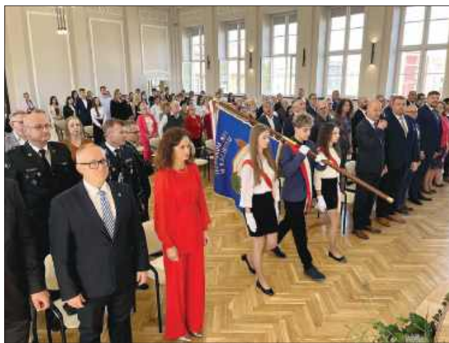
■ Ekonomik przygotował uroczystą galę z okazji swych urodzin

Oczywiście niezmiennie w centrum uwagi jest młody człowiek, uczeń. Z nim od 8 dekad wspólnie pracu-