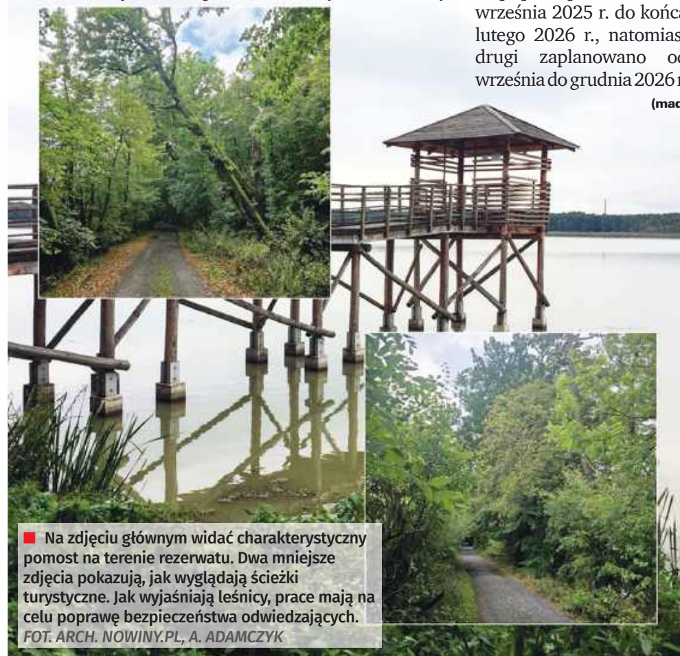
■ Na zdjęciu głównym widać charakterystyczny pomost na terenie rezerwatu. Dwa mniejsze zdjęcia pokazują, jak wyglądają ścieżki turystyczne. Jak wyjaśniają leśnicy, prace mają na celu poprawę bezpieczeństwa odwiedzających.