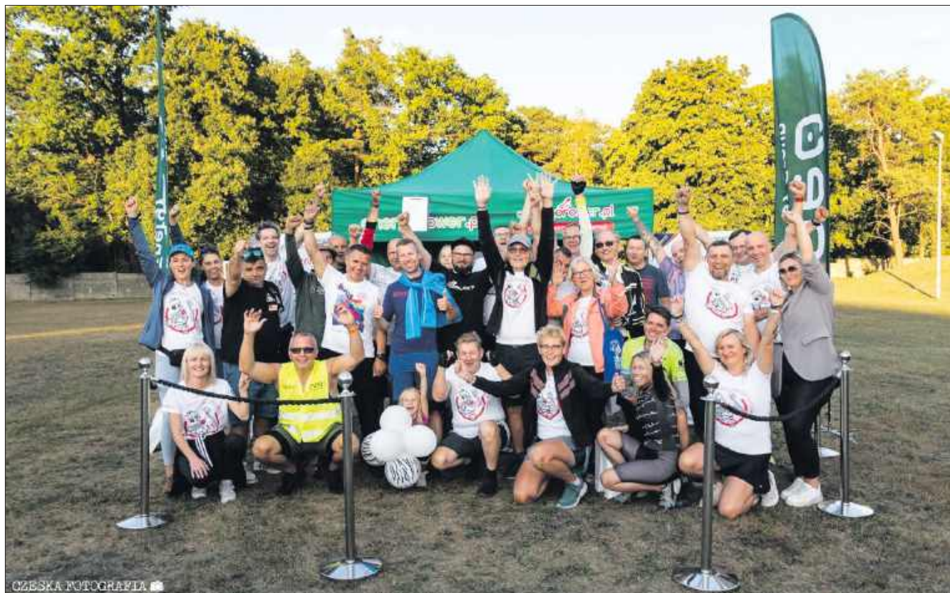
■ Uczestnicy bicia Rekordu Polski RowerON 2025