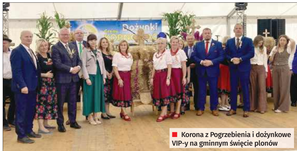
■ Korona z Pogrzebienia i dożynkowe VIP-y na gminnym święcie plonów

Drodzy mieszkańcy, szanowni goście. Bardzo cieszę się, że możemy się spotkać dzisiaj w Pogrzebieniu i udało się nam z pogodą. Jak widzicie korowód przejechaliśmy w pięknym słoneczku. Dożynki to święto, które łączy tradycje z terażniejszością. Z jednej strony kłaniamy się rolnikom, którzy swoją ciężką pracą dbają o to, żeby nie zabrakło chleba i owoców i pracy. Z drugiej strony patrzymy na naszą gminę jako wspólnotę, do której każdy wnosi coś ważnego, niezależnie od tego, gdzie pracuje. W tym momencie bardzo chciałem podziękować gospodarzowi tego miejsca, sołtysowi wraz z radą sołecką za przygotowanie tych dożynek. Bardzo serdecznie dziękuję. Oczywiście koło gospodyń wiejskich pomagało. Ochotnicza straż pożarna – widziałem wszyscy się angażowali. Bardzo serdecznie dziękuję wszystkim, którzy przystroili swoje posesje i uczestniczyli w korowodzie. Brawa dla nich. Słowa podziękowania kieruję również dla pracowników urzędu oraz wszystkich osób, instytucji, którzy włożyli swoją pracę i serce w przygotowanie dzisiejszego wydarzenia. Życzę, aby ten dzień przyniósł nam wiele radości, dobrych wspomnień. Świętujmy, aby wzmocnić więzi sąsiedzkie i jeszcze bardziej poczuć, że jesteśmy razem jedną wspólną gminą.