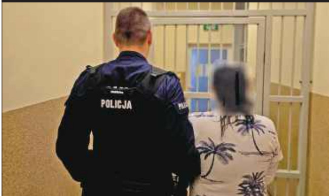
■ Agresywna kobieta trafiła na miesiąc do aresztu

Policjanci z Kuźni Raciborskiej interweniowali w gminie Nędza. 48-letnia kobieta złamała sądowy zakaz zbliżania się do byłego partnera i dzieci. Podczas niedzielnej interwencji groziła ich życiu.