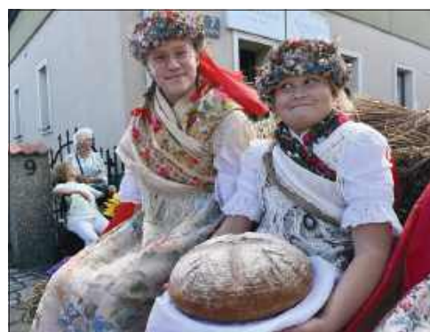
■ Dożynkowy chleb w dziewczęcych dłoniach