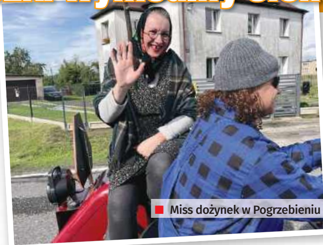
■ Miss dożynek w Pogrzebieniu