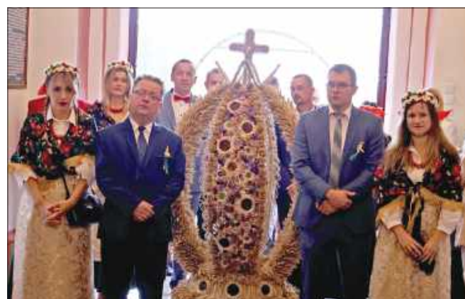
■ Tradycyjny korowód dożynkowy w Łubowicach nie odbył się z powodu deszczu.