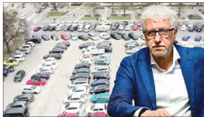
■ Jacek Wojciechowicz prezydent Raciborza zapowiada dwukondygnacyjny parking podziemny na placu Długosza

– Jeśli plac Długosza zostanie zagospodarowany i zostanie wybudowany parking podziemny, to na pewno będzie konieczność jakiegoś uregulowania sta-