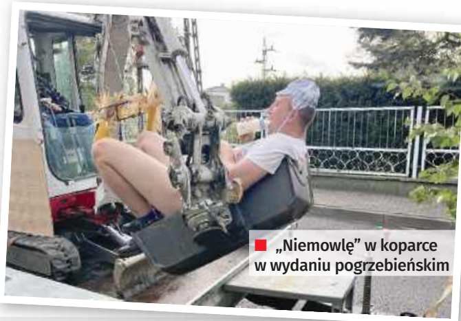
■ „Niemowlę” w koparce w wydaniu pogrzebińskim