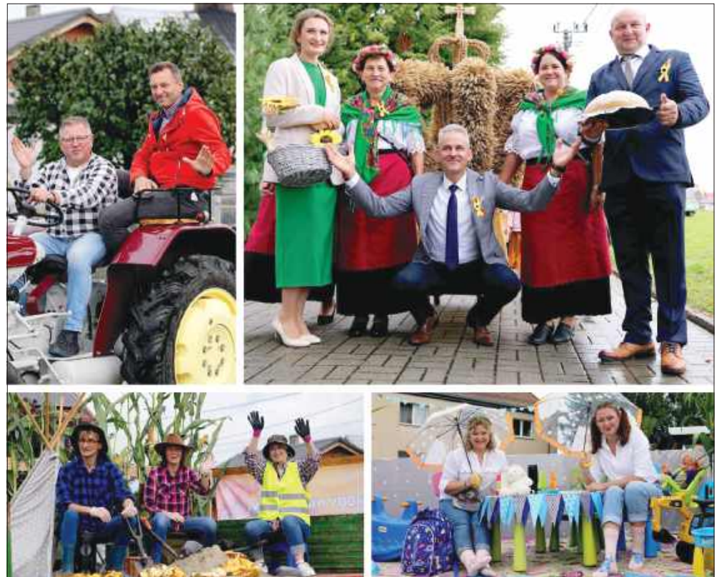
■ Mieszkańcy Samborowic podczas korowodu dożynkowego.