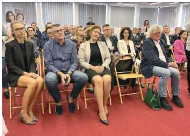
■ W wydarzeniu wzięli udział po raz pierwszy także pracownicy centrum

– Pani dyrektorka dostała misję od Ministerstwa Zdrowia by RCKiK poprawiło swą sytuację finansową. Bo merytorycznie to wy sobie dajecie radę, ale potrzebujecie nie tylko zastrzyku krwi, ale i zastrzyku pieniędzy.