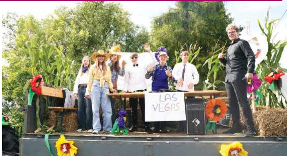
■ W tym roku najliczniejszą grupą okazała się młodzież, która z przyczepy nawoływała do wspólnej zabawy.

Tradycji stała się zadość i ulicami Bienkowic kolejny rok z rzędu przeszedł korowód dożynkowy, by swój pokaz zakończyć na boisku sportowym. W tym roku najliczniejszą grupą okazała się młodzież, która z przyczepy nawoływała do wspólnej zabawy.