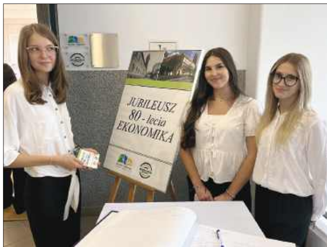
■ Gości witały uczennice zachęcając do wpisu w pamiątkową księgę

jemy. Efektem tego są liczne sukcesy dydaktyczne, sportowe i artystyczne. Jesteśmy solidnym i rzetelnym ośrodkiem egzaminacyjnym dla