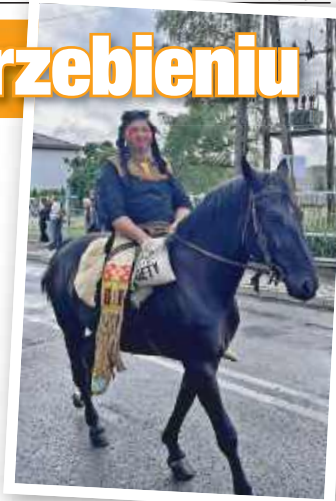
■ Gmina Kornowac pełna jest miłośników koni, ale obecność Indian zaskoczyła

tak, żeby nikomu go nie zabrakło. Chleb ten jest symbolem urodzaju, dostatku i szacunku dla ciężkiej pracy rolnika na Śląsku to także znak gościnności. Dziękując się nim z drugim człowiekiem, okazujemy serce, życzliwość i wdzięczność, życząc by nigdy go nie zabrakło na naszych stołach – powiedziała zebrany pani Agnieszka. (ma.w)