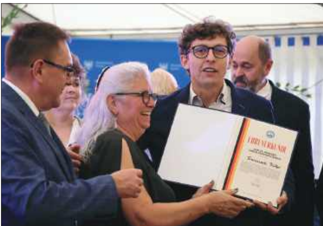
■ Impreza mniejszości niemieckiej w Łubowicach.

13 września w Łubowicach, miejscu nierozdzielnie związanym z poetą romantyzmu Josephem von Eichendorffem, odbył się Dzień Kultury Niemieckiej.