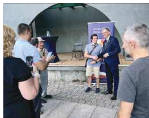
■ Spotkanie z posełem Romanem Fritzem odbyło się w parku miejskim w Raciborzu. Na koniec uczestnicy robili sobie zdjęcia z politykiem Konfederacji Korony Polskiej

Parlamentarzysta wskazał na posłankę Monikę Rosę z Koalicji Obywatelskiej, z Nowoczesnej. – Rodem z Czeladzi. Prezentuje jako taka topowa Ślązaczka, taka aktywistka w Sejmie.