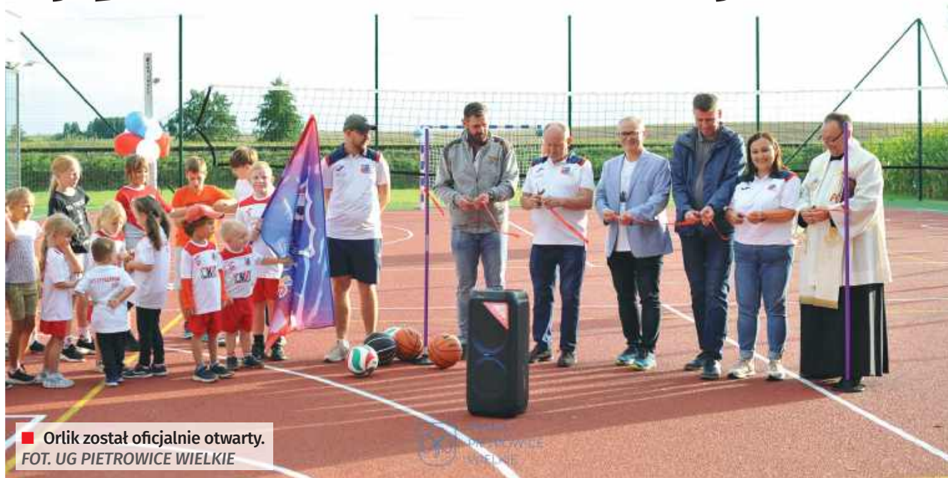
■ Orlik został oficjalnie otwarty.

W Cyprzanowie zakończono budowę boiska typu Orlik. Obiekt znajduje się przy kompleksie sportowym przy ulicy Młyńskiej. Nowa infrastruktura umożliwi rozgrywkę