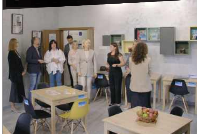
■ Centrum Aktywności powstało w Domu Kultury w Borucinie.

Gminne Centrum Biblioteczno-Kulturalne w Krzanowicach poinformowało o uroczystym otwarciu Centrum Aktywności w Borucinie, które odbyło się 16 września w tamtejszym domu kultury. To miejsce ma służyć mieszkańcom jako przestrzeń integracji, warsztatów i wspólnych działań.