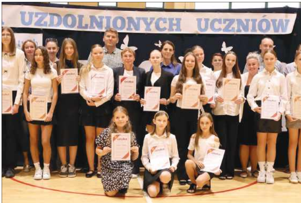
■ Gala Uzdolnionych Uczniów Gminy Rudnik.

Za wysokie wyniki w nauce, przy spełnieniu łącznie dwóch warunków tj. uzyskaniu na świadectwie szkolnym średniej ocen co najmniej 4,90 i uzyskaniu min. 75% punktów z przed-