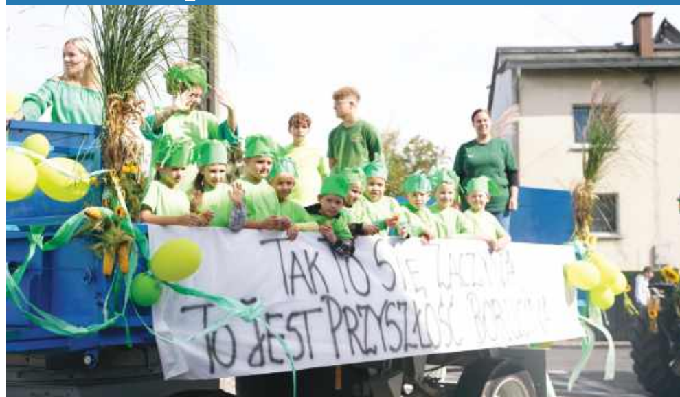
■ Przedszkolaki oraz uczniowie ZSP w Borucinie dodali wydarzeniu koloru i radości.

Sołectwo Borucin od lat słynie z dobrej i hucznej zabawy. Doskonałym przykładem zaangażowania mieszkańców we wspólne świętowanie są coroczne dożynki. W tym roku ulicami Borucina przeszedł