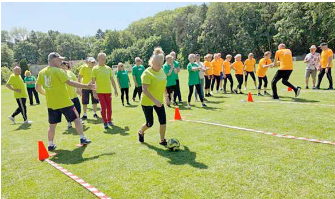
Rywalizacja sportowa na stadionie odbywała się przy znakomitej pogodzie