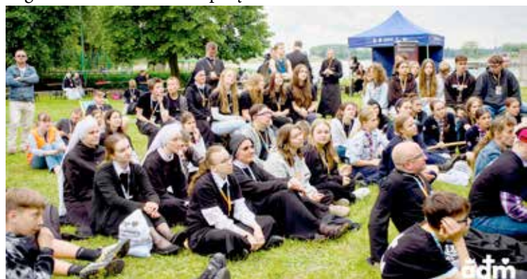
Pod sceną przy Placu Szarych Szeregów