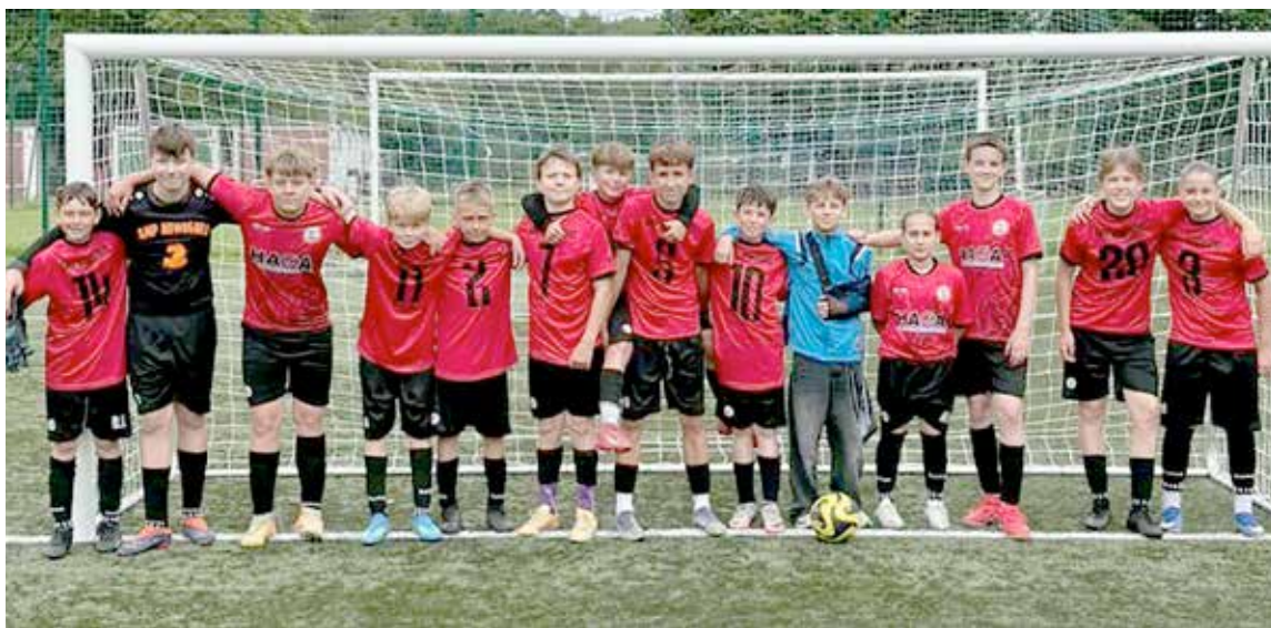
Skład zespołu w meczu z Iną Goleniów