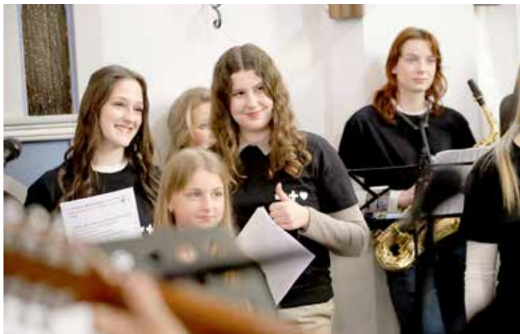
W trakcie Mszy św