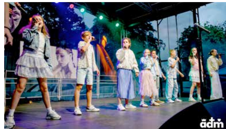
Na zakończenie koncert Małe TGD