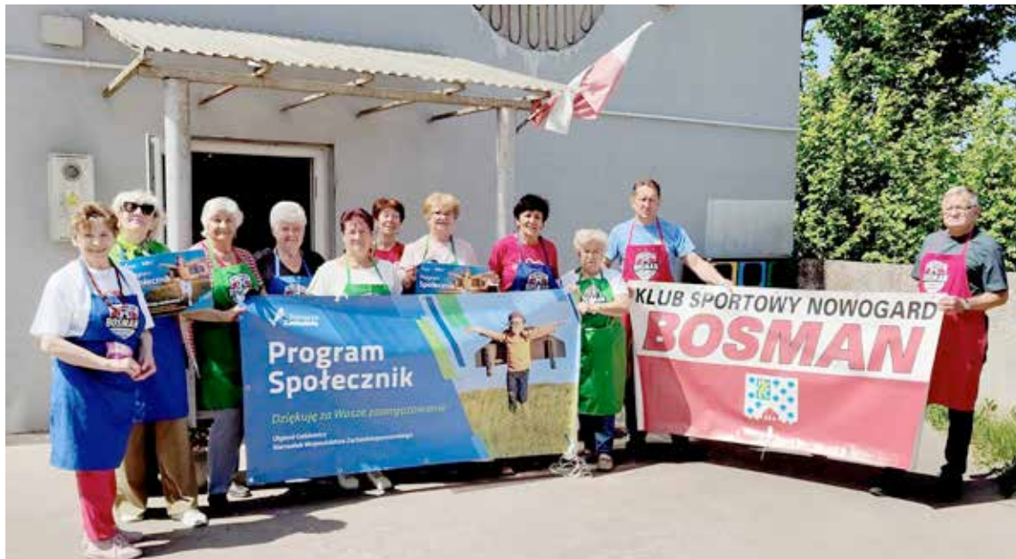
Do spotkania grupy kulinarnej doszło tym razem w świetlicy w Strzelewie