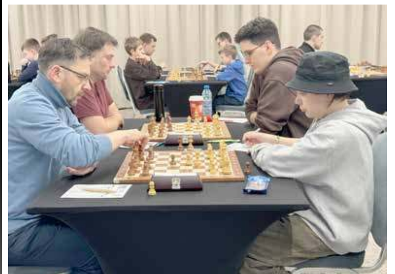
Pojedynek taty z synem (na pierwszym planie) zakończony remisem

Mimo tego panowie Lewkowie, świetnie sobie poradzili, uzyskując najlepsze wyniki w całej stawce rywali. Zgromadzili po 7,5 punktu w turnieju, a o kolejności na podium zadecydowała punktacja pomocnicza (tzw. punktacja Buchholza), w której tata wyprzedził syna najmniejszą z możliwych różnic (porównując sytuację na przykład do zawodów biegaczy można powiedzieć, że różnica wyniosła 1 setną sekundy). DJ