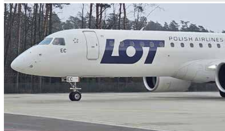
Przywrócone zostają loty do Egiptu

Po kilkunastu latach przerwy do sieci połączeń z goleniowskiego lotniska przywrócone zostają bezpośrednio loty czarterowe do Egiptu. Samoloty wylatywać będą głównie w okresie wakacyjnym.