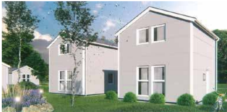
Tak będą mogły wyglądać domy

Umowa na ten cel została już podpisana przez Burmistrza Gminy Stepnica Andrzeja Wyganowskiego oraz Skarbnik Gminy Beatę Rogalską. Opiewa ona na kwotę 2 809 262,68 zł. Jest to 80% kosztów całej inwestycji. Łączny koszt budowy dziesięciu budynków jest szacowany na 3 511 578,35 zł. Jeżeli w trakcie postępowania przetargowego na realizację inwestycji okaże się, że będzie ona jednak droższa, istnieje możliwość zwiększenia dofinansowania.