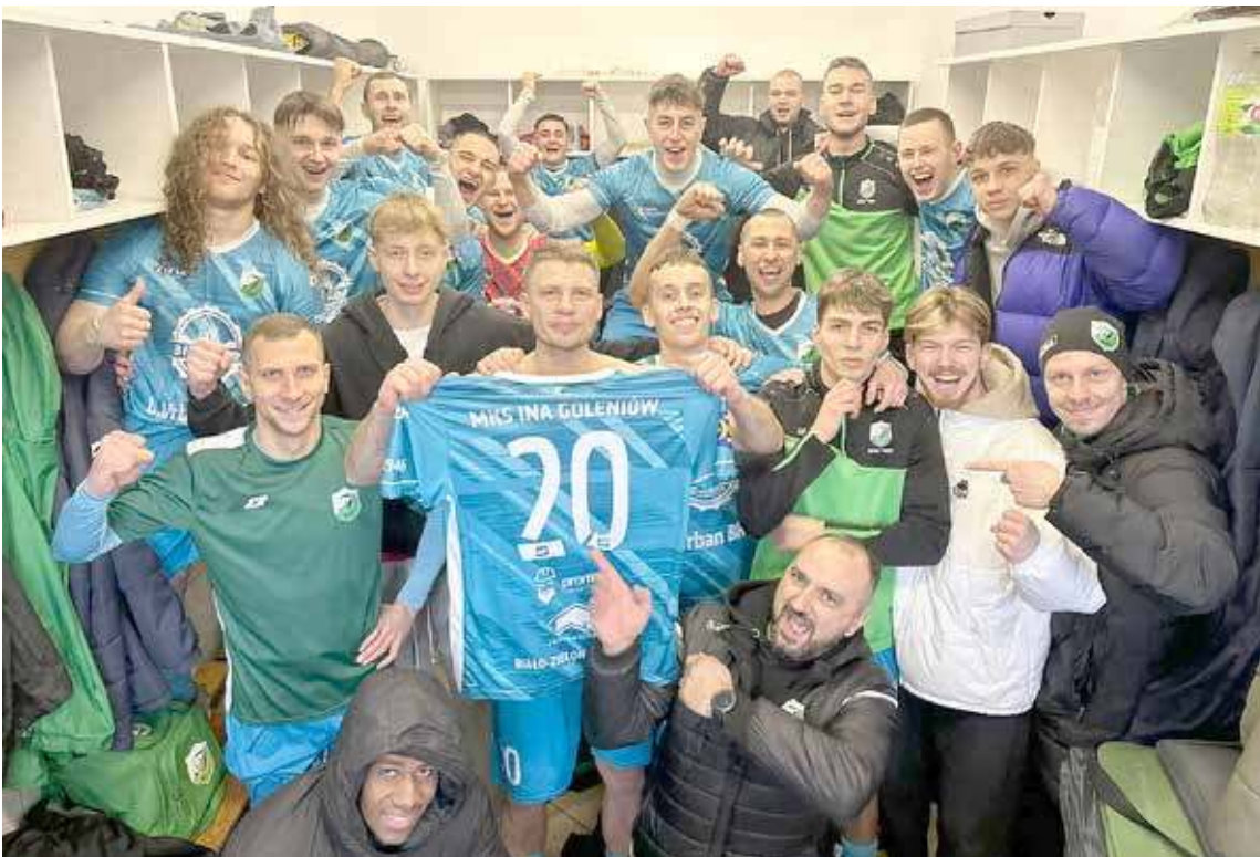
Piłkarze Iny dokonali w sobotę wydawałoby się niemożliwego. Koszulka numer 20 i wszystko jasne