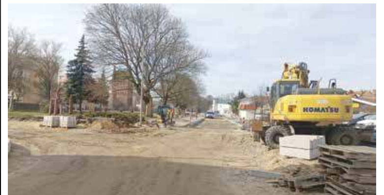
Ulica jeszcze jest rozkopana i nieprzejezdna, lecz możliwe że na wakacje się to zmieni

Przebudowa ulic Puszkina i Witosa w Goleniowie trwa już od blisko roku. Jej zakończenie było już kilkakrotnie przekładane. Tym razem poznaliśmy konkretną datę jej zakończenia.