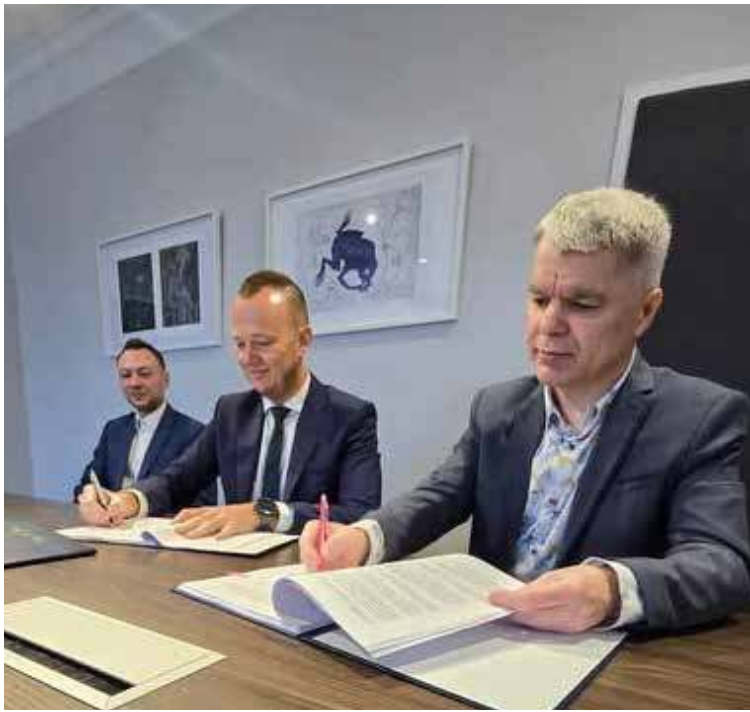
Umowa na odbiór odpadów została podpisana

Podpisanie tej umowy jest efektem prowadzonego w ostatnich tygodniach postępowania przetargowego. W jego trakcie została złożona tylko jedna oferta – właśnie PGK.