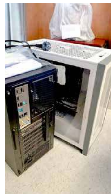
Zabezpieczony został również materiał dowodowy

Ustalono również, że pokrzywdzonych zostało około tysiąc osób. Straty spowodowane działalnością przestępczą pięciu mieszkańców powiatu goleniowskiego oszacowano zaś na kwotę przekraczającą 100 tysięcy zło-