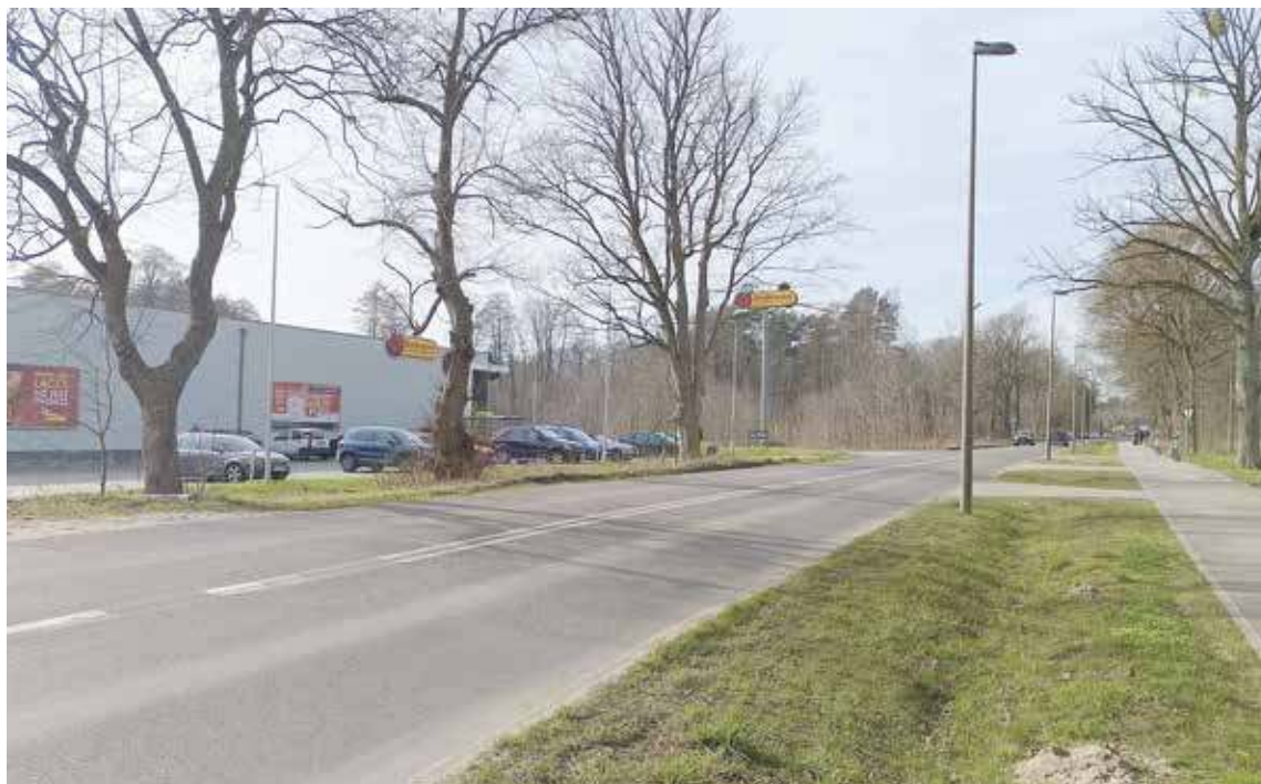
Przy Biedronce ma powstać przejście dla pieszych

Możliwe więc, że tamtejsza sytuacja nieco się poprawi. Padło również pytanie o to kiedy została wydana zgoda na budowę, pomimo tak drastycznego niedopatrzenia. Wedle słów Burmistrza została ona wydana jeszcze w trakcie trwania poprzedniej kadencji.