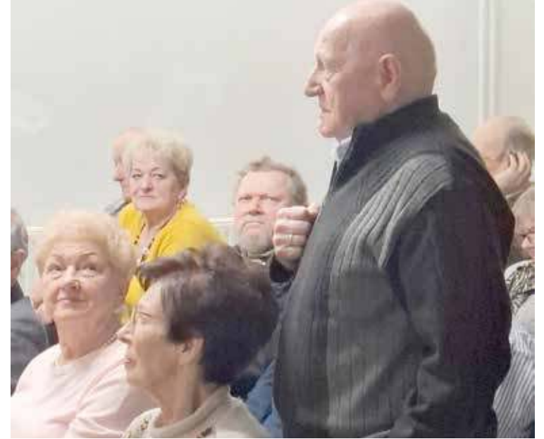
Uczestnicy spotkania zadawali wiele pytań