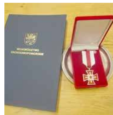
Srebrny Gryf Zachodniopomorski