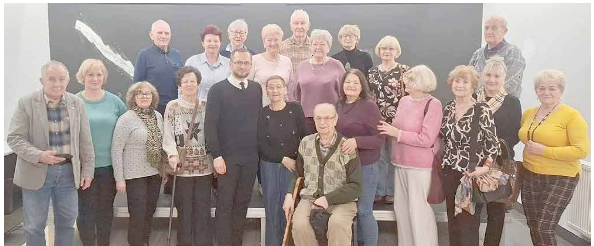
Spotkanie cieszyło się zainteresowaniem ze strony słuchaczy Koła Historycznego UTW Goleniów