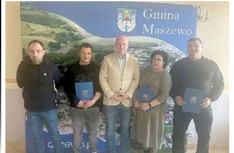
Maszewskie kluby sportowe otrzymały dotacje