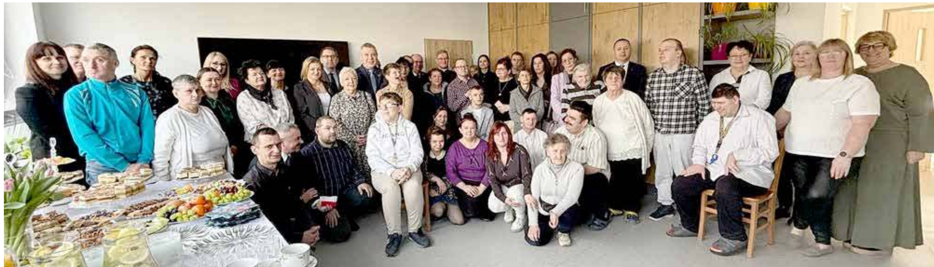
Skorzystają na tym osoby ze specjalnymi potrzebami

Zakończyła się adaptacja pomieszczeń na potrzeby Środowiskowego Domu Samopomocy w Przybiernowie. Dzięki temu osoby ze specjalnymi potrzebami będą miały miejsce, w którym będą mogły korzystać z terapii i wspierających ich działań.