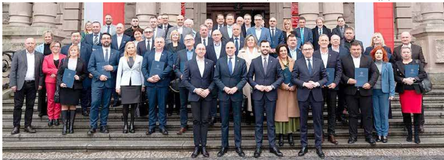
Samorzady podpisały umowy