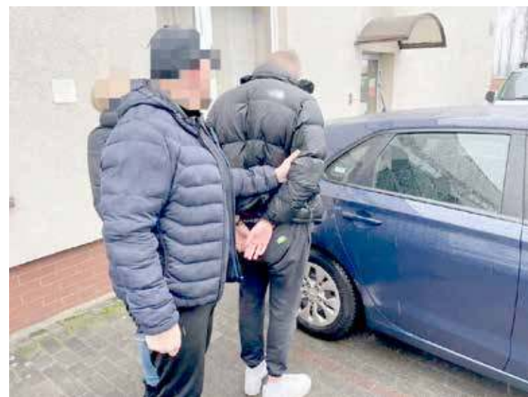
Podejrzani zostali zatrzymani