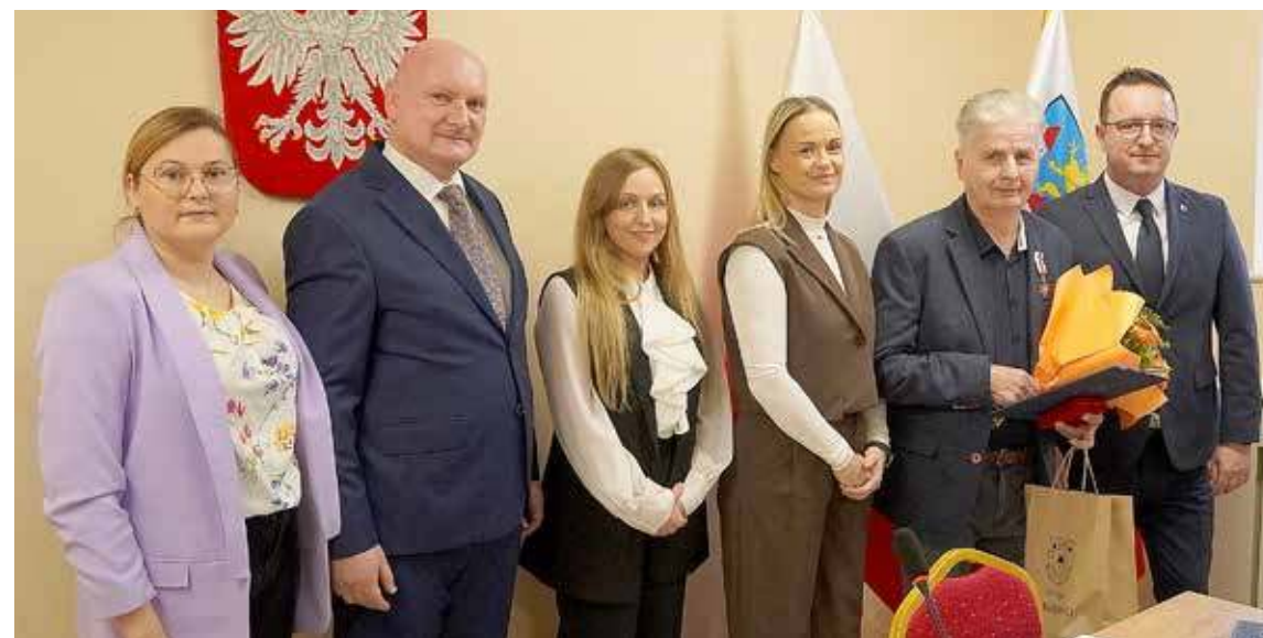
Uroczystość odbyła się w trakcie sesji Rady Miejskiej