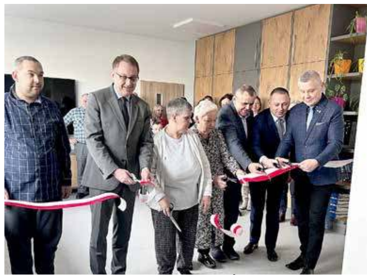
DD Pomieszczenia zostały otwarte i przekazane Środowiskowemu Domu Samopomocy

Środowiskowy Dom Samopomocy w Przybiernowie to miejsce, które będzie służyć osobom najbardziej potrzebującym wsparcia, zapewniając im bezpieczeństwo, komfort i możliwość rozwoju.