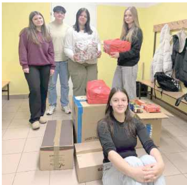
Z zebranych środków przygotowano świąteczne upominki dla sześciu seniorów z DPS-ów

Dzięki zaangażowaniu uczniów, nauczycieli oraz pracowników szkoły udało się zebrać 1310 zł. Z zebranych środków przygotowano świąteczne upominki dla