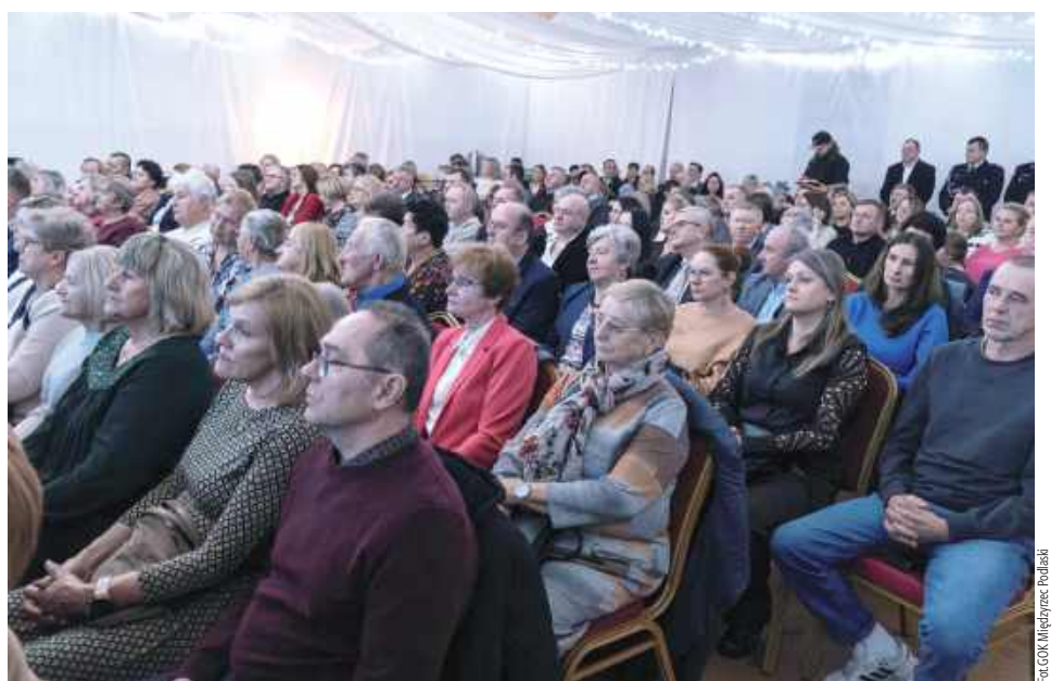
Główna część spotkania miała miejsce w Tuliowie i przyciągnęła wielu mieszkańców oraz osób związanych z gminą Międzyrzec Podlaski

Szczególnym punktem programu był klimatyczny koncert kołed w wykonaniu znanego wo-