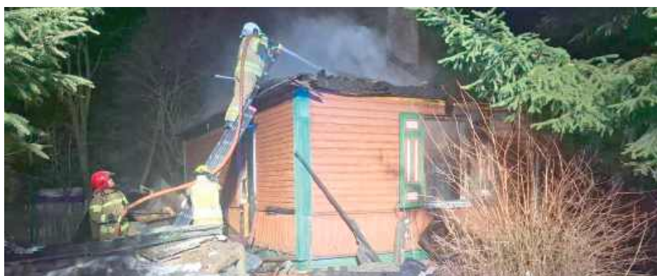
Drewniany dom spłonął doszczętnie. Czego nie strawił ogień, zostało zalane wodą podczas akcji gaśniczej

Po przybyciu na miejsce zdarzenia strażacy zastali pożar domu jednorodzinnego drewnianego, jednokondygnacyjnego. W pożarze poszkodowana została właścicielka, która doznała poparzeń przy próbie samodzielnego gaszenia pożaru - informuje bryg. Emil Głogowski, rzecznik prasowy Komendy Powiatowej Państwowej Straży Pożarnej w Puławach.