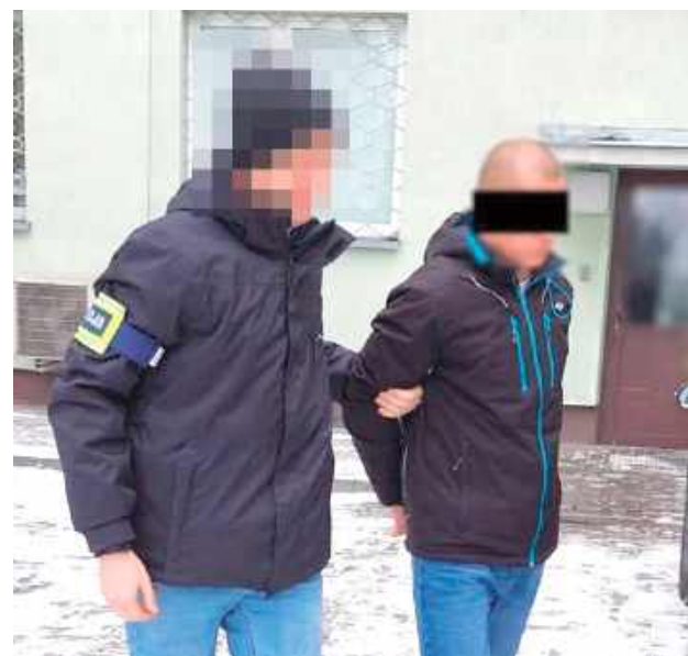
Za popełnione czyny grozi kara pozbawienia wolności na czas nie krótszy od lat 3

- Pokrzywdzony w obawie o swoje zdrowie wybiegł z mieszkania oraz zawiadomił policję. Powrócił do niego w obecności mundurowych. Wówczas okazało się, że agresor opuścił już miejsce zamieszkania pokrzywdzonego. Na miejsce wezwana została załoga karetki pogotowia, która udzieliła