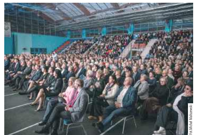
Trzygodzinny koncert zakończył się owacjami na stojąco, potwierdzając rangę wydarzenia w kalendarzu kulturalnym regionu