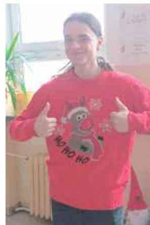
Świąteczne sweterki prezentowano z dumą