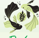
Ryby (19 II – 20 III)

Rok 2026 przyniesie Ci kreatywność w podejściu do sportu. Wiosną spróbuj nietypowych dyscyplin - taniec, wspinaczka czy sporty wodne pozwolą Ci wyrazić energię. Lato sprzyja aktywności grupowej. Gry drużynowe i zajęcia fitness będą źródłem radości. Twoja oryginalność i pomysłowość pozwolą wprowadzać innowacje do treningów. Jesień to czas eksperymentów - nowe techniki i dyscypliny przyniosą świeżą motywację. Uważaj na stawy i mięśnie podczas dynamicznych ćwiczeń. Zimą znajdziesz równowagę w sportach halowych i ćwiczeniach relaksacyjnych. Twoja niezależność pozwoli trenować w swoim tempie i czerpać radość z ruchu. Pod koniec roku poczujesz dumę z kreatywności i własnych osiągnięć. Motywację znajdziesz w inspiracji innymi i dzieleniu się pasją. Twoja energia będzie zaraźliwa dla otoczenia. 2026 zakończysz pełen nowych doświadczeń i sportowych przygód.