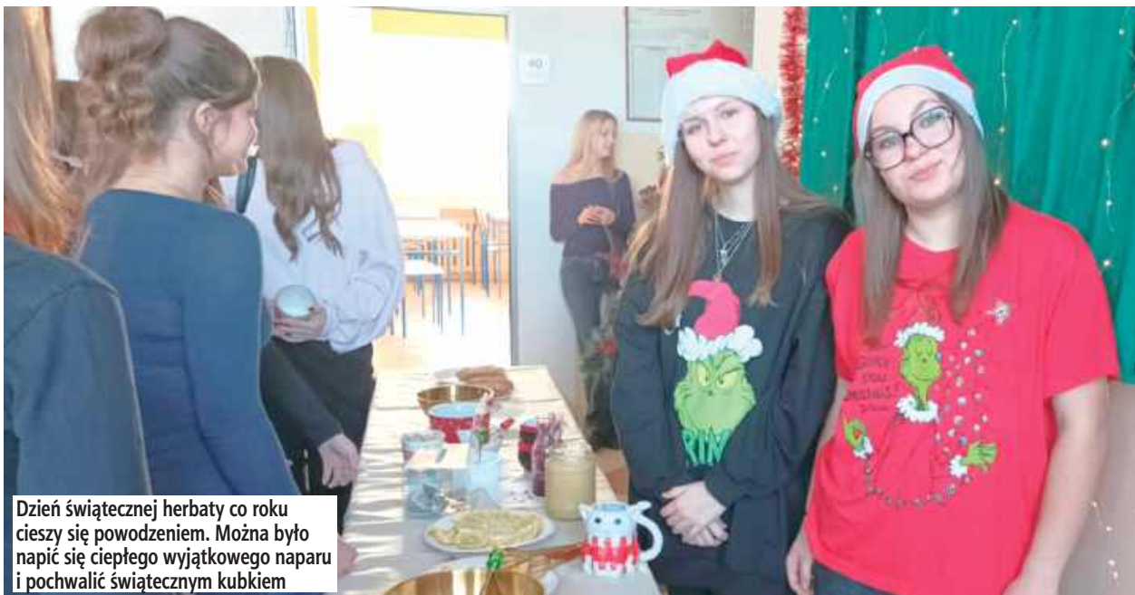
Dzień świątecznej herbaty co roku cieszy się powodzeniem. Można było napić się ciepłego wyjątkowego naparu i pochwalić świątecznym kubkiem

Ostatni tydzień przed przerwą świąteczną był wyjątkowy - pełen radości i świątecznej atmosfery. Rozpoczął się dniem świątecznej sweterka, podczas którego wszyscy założyli zabawne i kolorowe swetry. Kolejnego dnia obchodziliśmy dzień świątecznej czapki i herbaty, który wprowadził ciepły, zimowy klimat. Nie brakło też maratonu filmowego z ulubionymi świątecznymi filmami. Na zakończenie odbył się dzień świątecznej piosenki, wypełniony kolędami i świątecznymi hitami, który idealnie podsumował cały tydzień