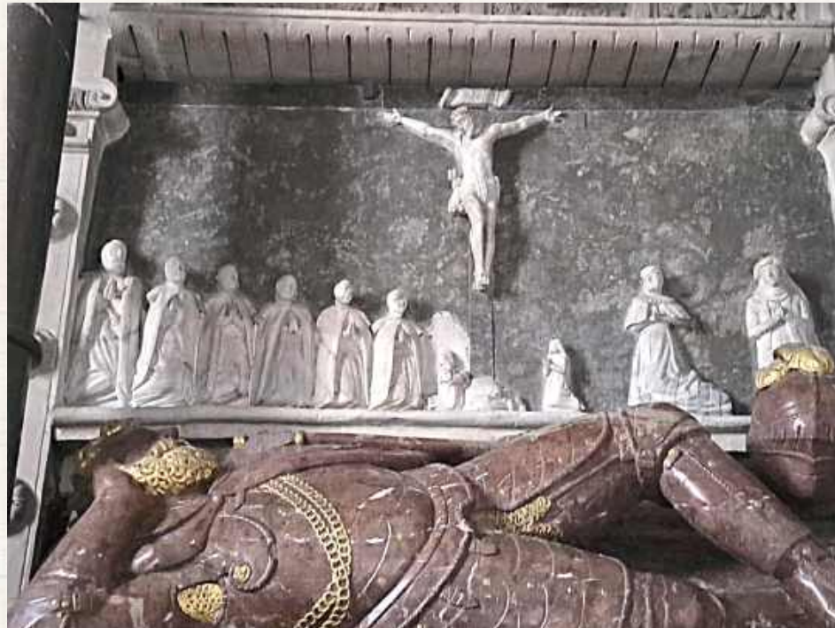
Jednym z najciekawszych zabytków regionu jest nagrobek Mikołaja Mniszcha (młodsze) w kościele Świętej Trójcy w Radzynie Podlaskim. Nad leżącym rycerzem mamy scenę pokazującą innych członków rodu

i czopowego, wykup młynów, doszła mu w r. 1540 dzierżawa królewskiego miasteczka Kozirynka (Radzyna Podlaska) wraz z należącymi doń wsiami. Dn. 1 VIII 1548 Zygmunt August połączył zapisy Mniszcha na Łukowie i Kozimryнку w ogólną sumę 6 462 złp. wliczając w nią gratyfikację z tytułu nakładów poniesionych przez Mniszcha po pożarze miasta i dworu oraz z racji wydatków na lokowanie nowych wsi z folwarkami, a w kilka dni później nadanie to zostało umocnione przyznaniem Mniszchowi oraz jego żonie i najstarszemu synowi dożywocia”. Za nadaniami tymi staje w dużej części świetna relacja z Boną. W 1537 roku królowa wykupiła dobra wokół Łukowa i Radzyna od rodziny Kaznowskich i przekazała je Mikołajowi, co było zresztą niemałym skandalem. Kolejnym jego patronem został Zygmunt August, po którego stronie stanął w czasie konfliktów z matką po śmierci jego ojca. Potrafił też zadbać