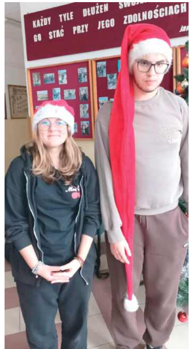
Uczniowie z przyjemnością założyli świąteczne czapki