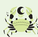
Rak (21 VI – 22 VII)

Twoja wszechstronność zaprowadzi Cię w 2026 roku do wielu dyscyplin sportowych. Wiosna sprzyja aktywności na świeżym powietrzu. Biegi, rower i rolki będą Twoimi żywiołami. Lato przyniesie okazję do udziału w drużynowych grach, gdzie błyskawiczna reakcja okaże się kluczem do sukcesu. Uważaj na rozproszenie - skupienie na jednym celu przyniesie lepsze efekty. Jesień będzie czasem nauki nowych sportów, np. wspinaczki lub pływania. Twoja elastyczność i zręczność pomogą w unikaniu kontuzji. Motywację znajdziesz w rywalizacji z przyjaciółmi. Z nimi każdy trening stanie się zabawą. Zimą spróbuj sportów halowych lub zajęć grupowych. Energia zespołu doda Ci sił. W 2026 roku Twoje wyniki mogą zaskoczyć nawet Ciebie. Pamiętaj o regeneracji. Sen i odpowiednia dieta będą niezbędne. Pod koniec roku poczujesz dumę z różnorodnych osiągnięć sportowych. Twoja ciekawość i aktywność sprawią, że 2026 będzie pełen ruchu i przygód.