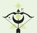
Strzelec (22 XI – 21 XII)

2026 rok przyniesie Ci intensywność i pasję w sporcie. Wiosną spróbuj sportów wymagających siły i determinacji. Sztuki walki czy treningi siłowe będą odpowiednie. Lato sprzyja wytrzymałości. Biegi długodystansowe lub rowerowe wycieczki pozwolą Ci sprawdzić granice możliwości. Twoja silna wola pomoże pokonać słabości i wytrwać w treningach. Jesień będzie czasem eksperymentów. Sporty wodne lub wspinaczka mogą przynieść nowe doświadczenia. Uważaj na przeciążenia pleców i stawów. Zimą znajdziesz siłę w treningach w domu i ćwiczeniach relaksacyjnych. Motywację znajdziesz w rywalizacji i wyzwaniach, które sam sobie wyznaczysz. Twoja intensywność i determinacja przyniosą widoczne efekty. Pod koniec roku poczujesz dumę z własnej siły i wytrwałości. Twoja energia będzie zaraźliwa dla bliskich i znajomych. 2026 zakończysz silniejszy, pewniejszy siebie i gotowy na nowe sportowe przygody.