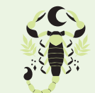
Skorpion (23 X – 21 XI)

Rok 2026 sprzyja równowadze między aktywnością a regeneracją. Wiosną warto postawić na grupowe zajęcia fitness lub sporty drużynowe. Energia zespołu doda Ci sił. Lato będzie czasem wyjazdów i aktywności na świeżym powietrzu. Spacer, bieg czy jazda na rowerze przyniosą Ci radość. Jesień sprzyja uważności. Ćwiczenia relaksacyjne i stretching pomogą zrównoważyć ciało i umysł. Twoja naturalna potrzeba harmonii sprawi, że trening stanie się przyjemnością. Uważaj na przeciążenia nóg i stawów biodrowych. Zimą spróbuj sportów halowych lub pływania pozwolą utrzymać formę i poprawią nastrój. Twoje wyniki będą stopniowo rosły, co doda Ci pewności siebie. Motywację znajdziesz w otoczeniu i wsparciu bliskich. Pod koniec roku poczujesz dumę z utrzymanej dyscypliny. Twoja lekkość i elegancja w ruchu będą przyciągać uwagę. 2026 zakończysz w pełnej harmonii ciała i ducha.