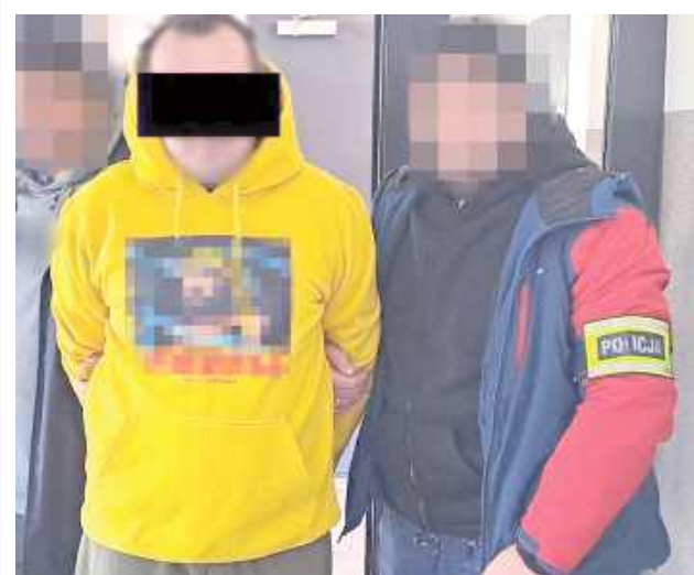
Grozi mu kara do 5 lat pozbawienia wolności

Opole Lubelskie: Policjanci zatrzymali 36-letniego mieszkańca Poniatowej, który będąc pod wpływem alkoholu, groził swoim rodzicom pozbawienia ich życia. Odpowiadał już za przestępstwo znęcania się nad rodzicami, a teraz dodatkowo zlekceważył wydany przez sąd zakaz zbliżania się i kontaktowania się z bliskimi.