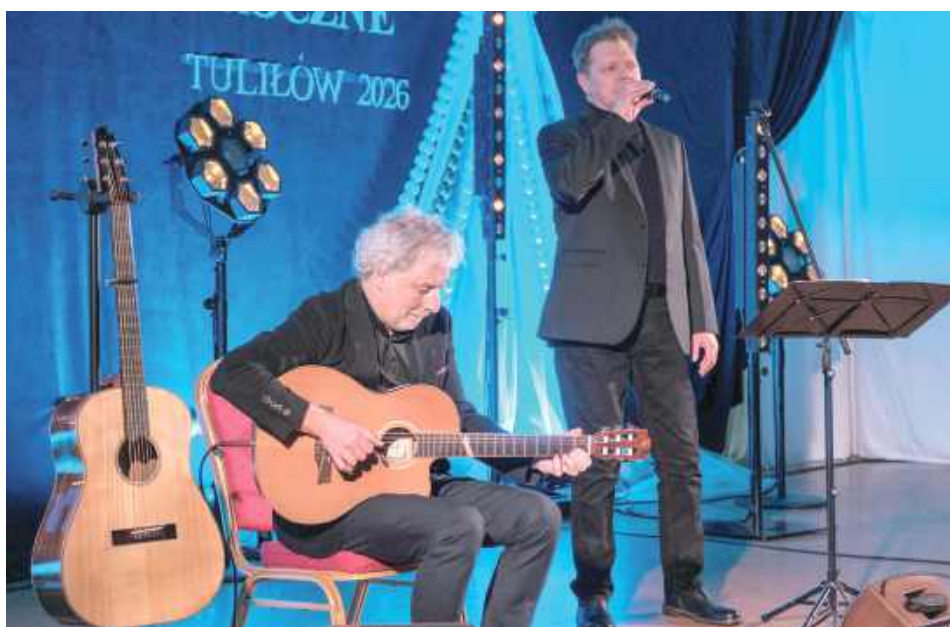
Szczególnym punktem programu był klimatyczny koncert kołed w wykonaniu znanego wokalisty Krzysztofa Kijańskiego, któremu na gitarze towarzyszył znakomity muzyk Witold Cisko

Tuliów stał się miejscem pełnego ciepła i wspólnoty spotkania mieszkańców gminy Międzyrzec Podlaski. 6 stycznia, w Święto Trzech Króli, odbyło się tradycyjne spotkanie opłatkowo-noworoczne, które zgromadziło licznie przybyłych mieszkańców oraz zaproszonych gości.