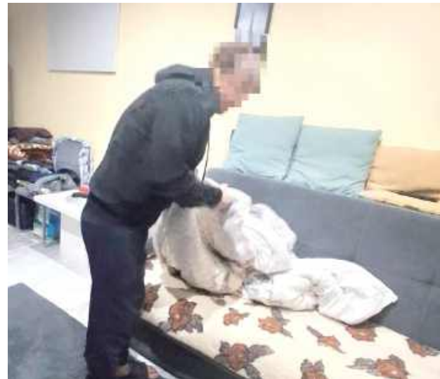
Mężczyzna trafił na 8 miesięcy do zakładu karnego w związku z przestępstwem niealimentacji

Mężczyzna poszukiwany był dwiema podstawami prawnymi. Pierwsza z nich to list gończy wydany przez Sąd Rejonowy w Radzynie Podlaskim dotyczący przestępstwa przeciwko rodzinie i opiece, a konkretnie niealimentacji, gdzie wydano postanowienie o zatrzymaniu i osadzeniu w zakładzie karnym na okres