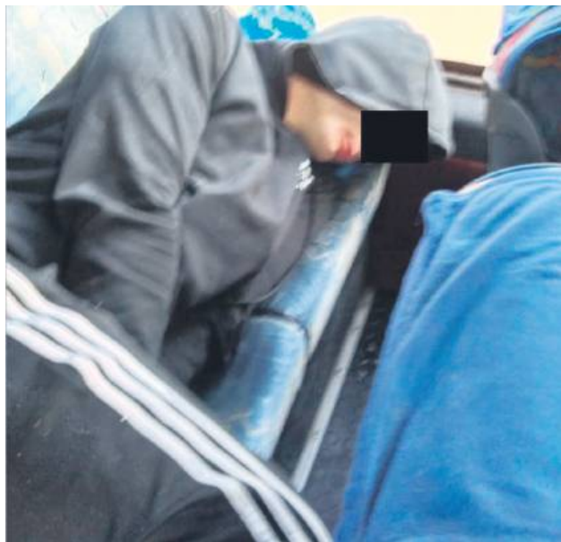
28-latek włamał się do busa i w nim zasnął. Rano znalazł go kierowca i wezwał policjantów.