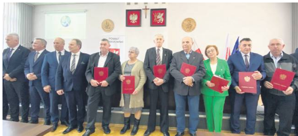
Powiatowy Dzień Sołtysa był okazją do nagrodzenia sołtysów, którzy są szczególnie aktywni społecznie.