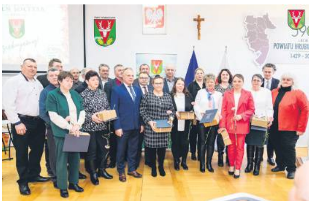
Wszyscy sołtysi otrzymali pisemne podziękowanie za dotychczasowe pełnienie mandatu oraz drobne upominki.