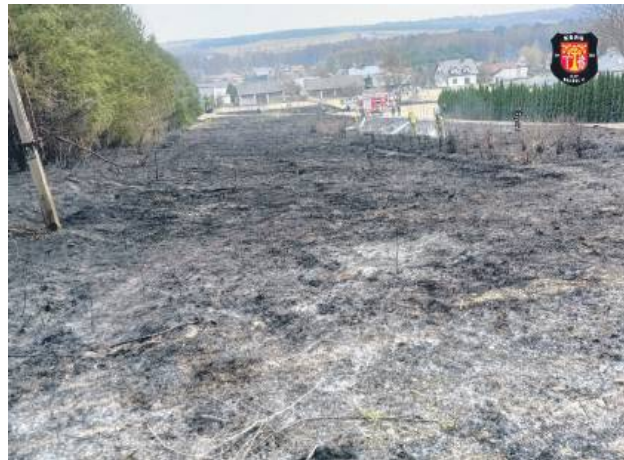
Pożaru suchych traw i młódzika w pobliżu lasu, przy ul. Wrzosowej w Bełczu. Ogień był bardzo blisko zabudowy rodzinnej.

Niszczony są miejsca lęgowe wielu gatunków gnieźdzących się na ziemi i w krzewach. Pałą się również gniazda już zasiedlone,