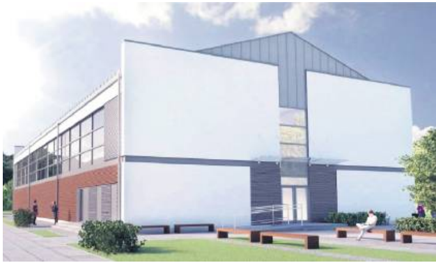
Planowana hala widowiskowo-sportowa ma mieć ponad 1 tysiąc mkw. powierzchni użytkowej.

– Wcześniej prowadzone były w tej sprawie konsultacje,