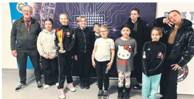
Reprezentanci Klubu Karate Tradycyjnego Tomaszów Lubelski w Krakowie.