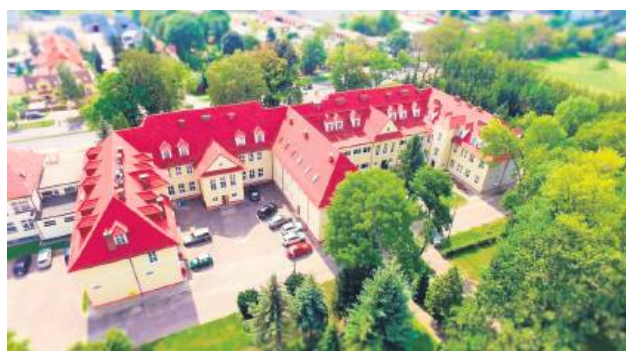
W ciągu swojej 100-letniej działalności mury szkoły opuściło kilka tysięcy absolwentów.

Obchody jubileuszu ZSP nr 5 (poprzednia nazwa szkoły: Zespół Szkół Rolniczych w Zamościu) rozpoczną się 20 czerwca o godz. 11 od mszy