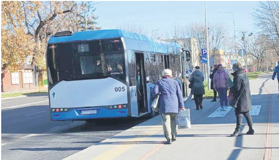
Flota przedsiębiorstwa liczy obecnie 40 autobusów (elektryczne, spalinowe i CNG). Spółka zatrudnia 103 pracowników.

O tym, że autobusy zamojskiego MZK jeżdżą nie tylko po mieście, ale i po okolicznych gminach, wiadomo nie od dziś. Niebawem podmiejskie ruszą jeszcze dalej. Z początkiem kwietnia powinna wystartować linia nr 18, która połączy Wólkę Orłowską oraz Izbicę w powiecie krasnostawskim z Zamościem. – Jak się sprawdzi, będziemy zabiegali o kolejną – zdradza burmistrz miasteczka.