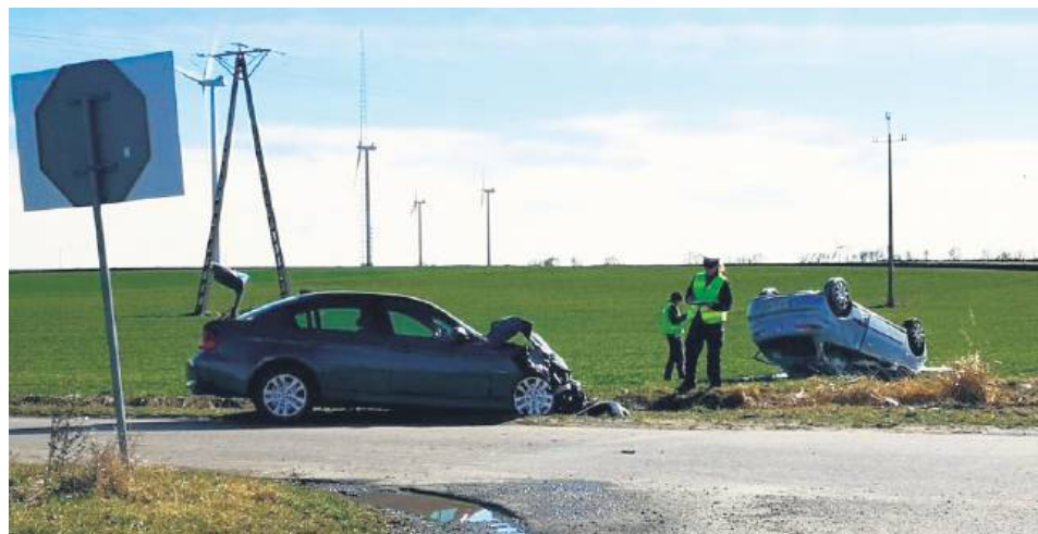
Wypadek w Tyszowcach.

Ze wstępnych ustaleń policjantów pracujących na miejscu zdarzenia wynika, że 47-latek, kierując seatem, nie zatrzymał się przed znakiem STOP i nie ustąpił pierwszeństwa 49-letniemu kierującemu bmw, który jechał drogą z pierwszeństwem. W wyniku zderzenia pojazd marki Seat dachował, jego kierowca trafił do szpitala w Tomaszowie Lubelskim, a 25-letni pasażer został przetransportowa-