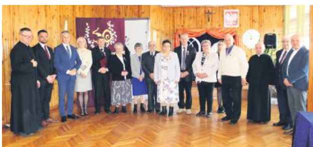
Pary świętowały 50 lat wspólnego życia.

Złote Gody to symbol miłości i wierności małżonków, których przed laty połączyło sakramentalne „tak”. Tak długoletnim stażem mogą pochwalić się pary, dla których trud i poświęcenie, wytrwałość i cierpliwość, a także troska i zaufanie nie są pustymi hasłami.