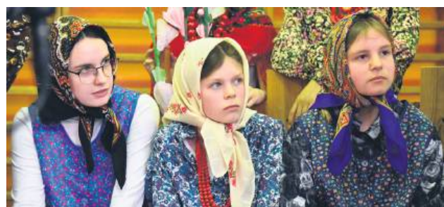
Najlepsi będą reprezentować gminę w zmaganiach powiatowych.

Wszystkie teatrzyki otrzymały dyplomy i nagrody finansowe za udział w Konfrontacjach. ez