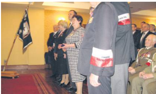
Zamojska Rodzina Katyńska organizuje co roku w kwietniu uroczystości rocznicowe.

Biblioteczne Spotkania z Historią są organizowane w zamojskiej bibliotece od kilku lat, ale zazwyczaj w sierpniu – przy okazji Zamojskiego Festiwalu Filmowego „Spotkania z historią”. Tym razem, z uwagi na poruszaną tematykę, realizacja wydarzenia rozpoczęła się 5 marca i potrwa do 13 kwietnia (5 marca 1940 r. zapadła decyzja o rozstrzelaniu oficerów m.in. wojska i policji, więzionych w obozach w Kozielsku, Starobielsku i Ostaszkowie,