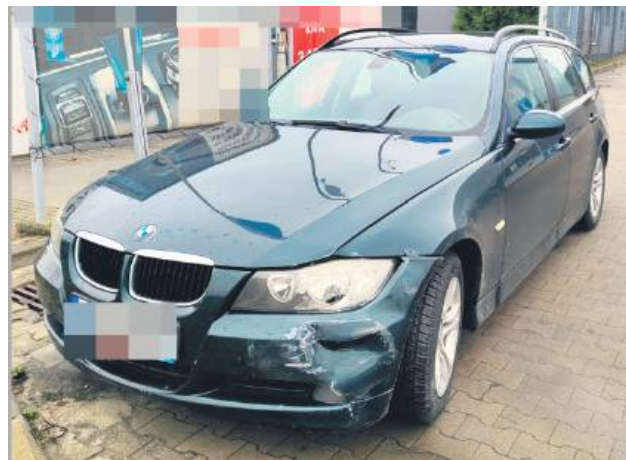
Obywatele zatrzymali pijanego kierowcę bmw.

ul. Rolniczą, zignorował znak „nakaz jazdy z prawej strony znaku”, poruszał się po jego lewej stronie, następnie wjechał na pas zieleni i skręcił na parking. Podczas jazdy po parkingu uszkodził wyjeżdżający z niego