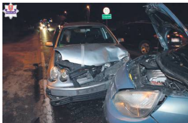
40-latek miał ponad 3 promile alkoholu. W takim stanie kierował renault i doprowadził do kolizji.

– Policjanci wstępnie ustalili, że kierujący volkswagenem jechał drogą K74 w kierunku Zamościa od strony Hrubieszowa. Kiedy znajdował się na wysokości skrzyżowania Szopinek – Kalinowice, z drogi podporządkowanej, nie zatrzymując się przed znakiem „Stop”, z dużą prędkością