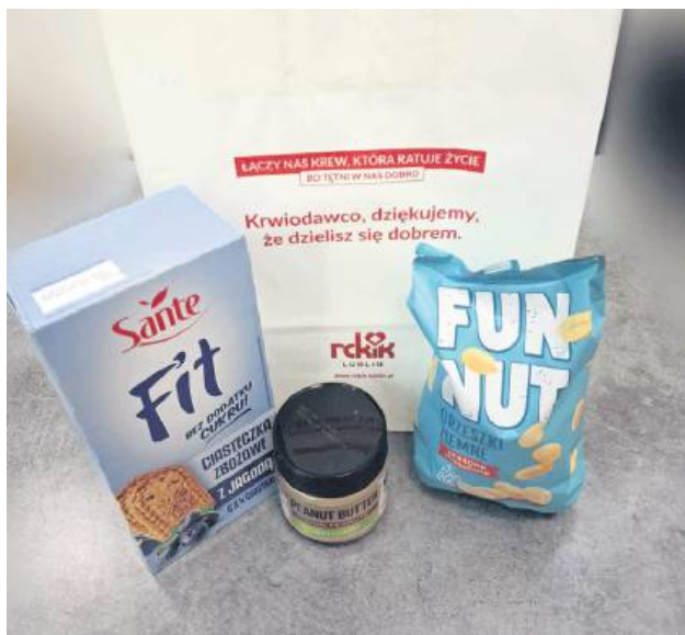
Tak wygląda pakiet regeneracyjny dla osób oddających krew w oddziałach RCKiK w Lublinie. W całej Polsce posiłki są pakowane w papierowe torby z logo danego oddziału i napisem „Krwiodawco, dziękujemy, że dzielił się dobrem”.

Kakao podrożało, więc czekolada też. Regionalne Centrum Krwiodawstwa i Krwiolecznictwa, ze względu na koszty, były zmuszone szukać alternatywy dla dziewięciu tabliczek czekolady. Uwzględniając opinię krwiodawców, zmieniły składy posiłków regeneracyjnych przysługujących dawcom. W lubelskim oddziale nowy pakiet zawiera masło orzechowe, orzeszki i ciastka zbożowe.