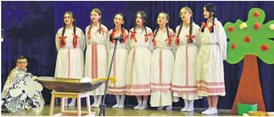
Na scenie zaprezentowało się blisko 150 młodych aktorów.

W Szkole Podstawowej w Smólsku odbyły się XV Międzyszkolne Konfrontacje Teatralne. Święto teatru, zorganizowane 11 marca przez GOK w Biłgoraju we współpracy ze SP w Smólsku, zgromadziło dziewięć szkolnych teatrzyków z terenu gminy Biłgoraj.