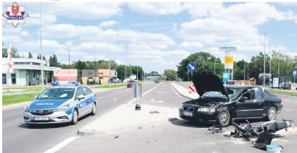
Wypadek na ulicy Dzieci Zamojszczyzny w Zamościu.

wykrywalności w powyższych kategoriach, to najwyższy odnotowano przy bójkach lub pobiściach (93,75 proc.), a najniższy w kategorii uszkodzenie mienia (64,71 proc.).