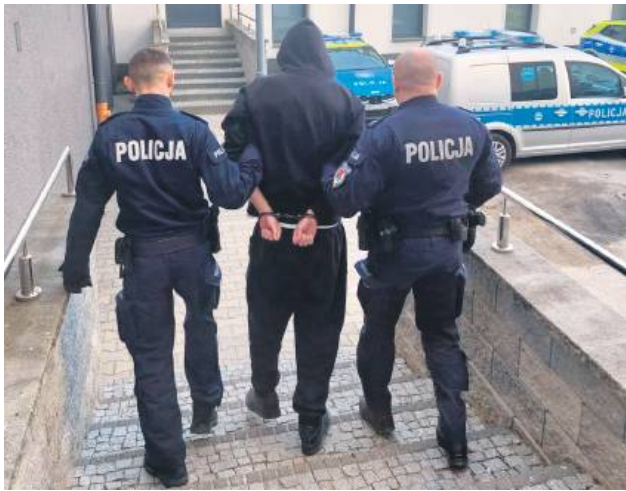
20-latek został tymczasowo aresztowany.

Znalezione przedmioty, susz roślinny, białą substancję oraz gotówkę kryminalni przewieźli do komendy.