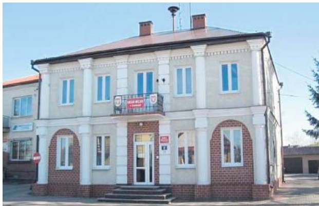
Wciąż nie wiadomo co stanie się z pocztą w Tyszowcach. O los swojej poczty obawiają się także mieszkańcy gminy Lubycza.

S tarzejemy się jako społeczeństwo i za chwilę możemy się rozczarować brakiem opiekuńczej placówki w naszej gminie. Wyszliśmy już teraz na przeciw tym potrzebom osób chorych i niepełnosprawnych. Ważne jest też zwiększenie szans na pozostanie w środowisku zamieszkania i opóźnienie momentu, w którym konieczne będzie