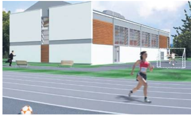
W nowej hali mają powstać boiska do wielu gier zespołowych, m.in. koszykówki i siatkówki. Będzie można również grać i trenować badminton, uprawiać judo, gimnastykę i akrobatykę.

– Przed pracami nad projektem budowy dyrekcja Zespołu