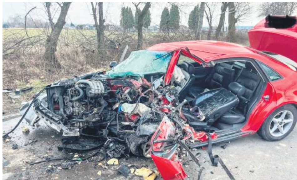
Audi kierował 22-latek z gminy Łaszczów. Nie przeżył.

Audi kierował 22-latek z gminy Łaszczów. Nieprzytomnego mężczyznę załoga karetki przewiozła do szpitala. Niestety, mimo podjętej reanimacji, 22-latek