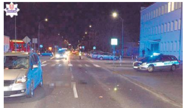
Na ul. Kilińskiego nie odnotowano w zeszłym roku wypadku. Było 14 kolizji.

W omawianym okresie odnotowano 587 kolizji, z czego najwięcej na ul. Wyszyńskiego (53). Na terenie miasta i powiatu zamojskiego ujawniono 714 kierujących pod wpływem alkoholu, a więc o 219 więcej niż w 2023 r. Mundurowi zatrzymali 114 praw jazdy za przekroczenie dozwolonej prędkości powyżej 50 km/h w terenie zabudowanym (o 21 więcej).