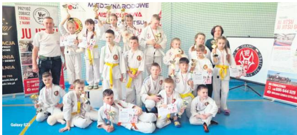
Zawodnicy Bushido Szczepreszyn triumfują na Mistrzostwach Polski Jiu-Jitsu w Grapplingu.