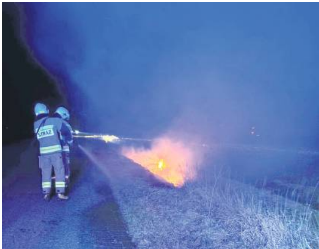
Pożar traw w przydrożnym rowie w miejscowości Rokitno.

– Na terenie całego powiatu od 22 lutego do 13 marca doszło do 31 pożarów. W większości były to pożary suchych traw, pięć pożarów było zlokalizowanych na obszarach leśnych – wylicza st. kpt. mgr inż. Artur Kaczkowski, rzecznik komendanta Powiatowej PSP w Tomaszowie Lubelskim.