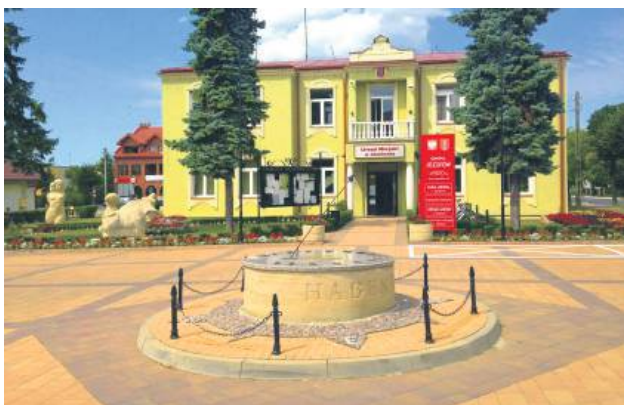
Obchody jubileuszu będą wyjątkowo dostojne.

Józefowscy radni przyjęli uchwałę w sprawie ogłoszenia 2025 roku Rokiem Jubileuszu 300-lecia Józefowa. W okolicznościowym dokumencie radni wyrazili szacunek wszystkim, którzy przyczynili się do rozwoju miasta. Chodzi m.in. o założycieli i dawnych właścicieli miasta, partyzantów i kombatantów, by-