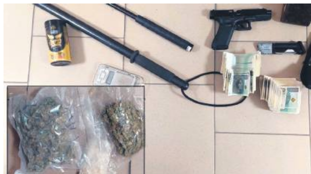
W mieszkaniu miał narkotyki, pistolet i sporo gotówki. Policja zabezpieczyła wszystkie dowody.

W miniony weekend 20-latek usłyszał zarzuty posiadania znacznej ilości środków odurzających w postaci ziela konopi innych niż włókniste oraz mefedronu, a także