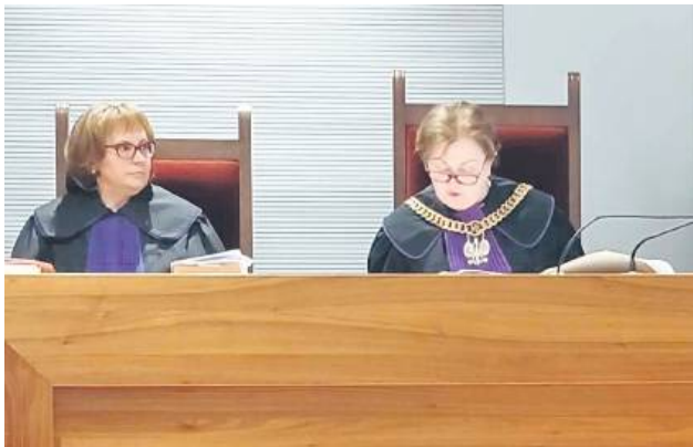
Oskarżony nie pojawił się na ogłoszeniu wyroku przed Sądem Okręgowym w Zamościu.

W związku z tym, że nie pomogły ostrzeżenia, jeden z policjantów wyciągnął broń służbową, a następnie oddał w kierunku napastnika pięć strzałów, celując w nogi. Sprawca upadł i został obezwładniony. Karetka zabrała go do szpitala.