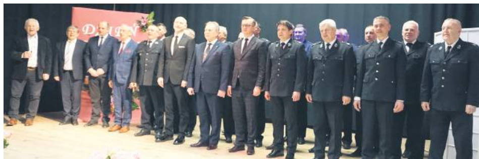
Mężczyźni zaśpiewali paniom „Sto lat”.

Potem wszyscy zebrani obejrzeli prezentację multimedialną