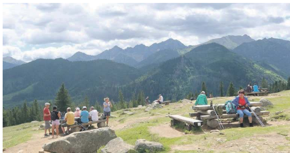
Rusinowa Polana gwarantuje piękne widoki