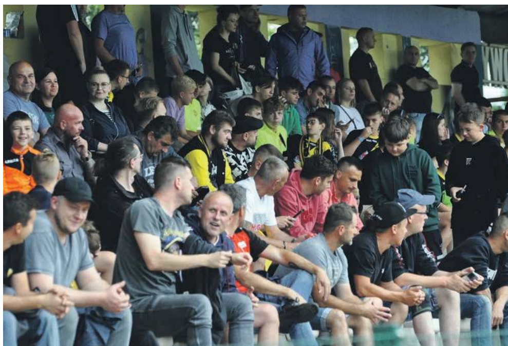
W 2022 r. podczas meczu z Wieczystą Kraków stadion w Trzebini był wypełniony po brzegi