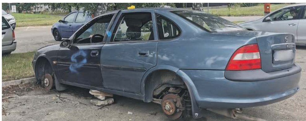
Jeden z samochodów pozostawionych na parkingu w rejonie ul. Wyszyńskiego w Chrzanowie

CHRZANÓW. Samochody bez kół zalegają na miejskich parkingach. Zdaniem Czytelnika, to już istna plaga.