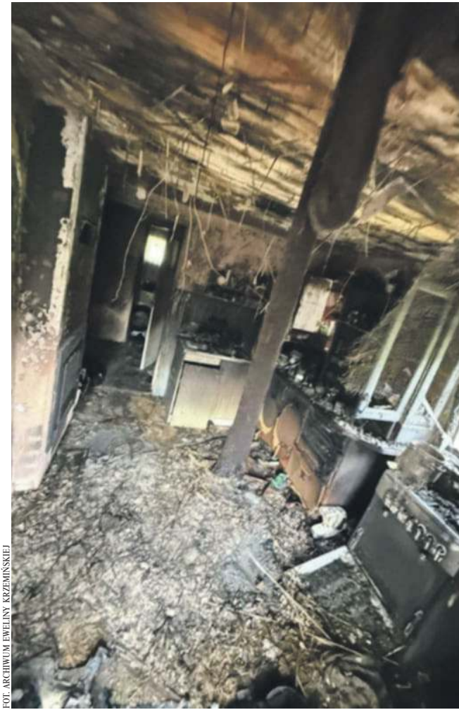
Zgliszczona, jakie zostały po pożarze