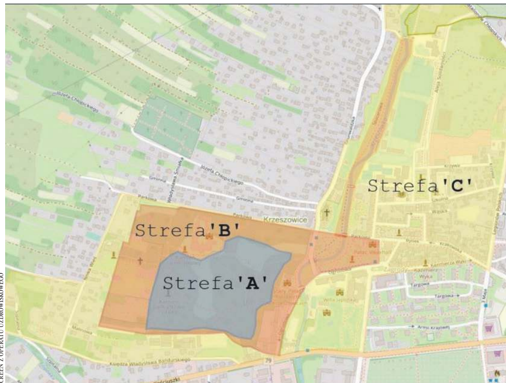
Centrum Krzeszowice podzielone na strefy uzdrowiskowe. Screen z operatu uzdrowiskowego

Ograniczenia w strefie „A” dotyczą m.in.: budowy zakładów przemysłowych, budynków mieszkalnych jednorodzinnych i wielorodzinnych, garaży wolnostojących, obiektów handlowych o powierzchni użytkowania większej niż 400 mkw., stacji paliw oraz punktów dystrybucji produktów naftowych, autostrad i dróg ekspresowych,