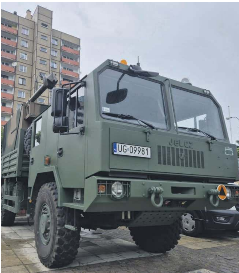
Wóz służący do odbierania i przesyłania sygnałów cyfrowych wojskowej sieci łączności