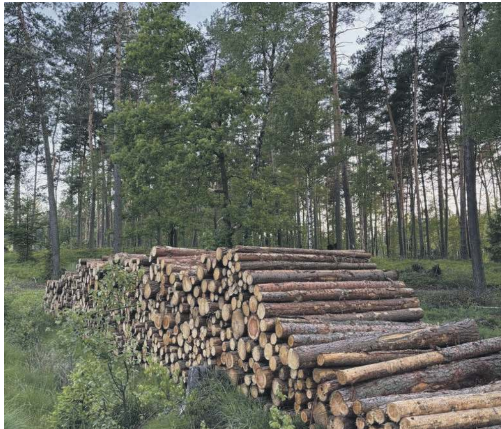
Takie obrazki często widzą odwiedzający Puszcę Dulowską