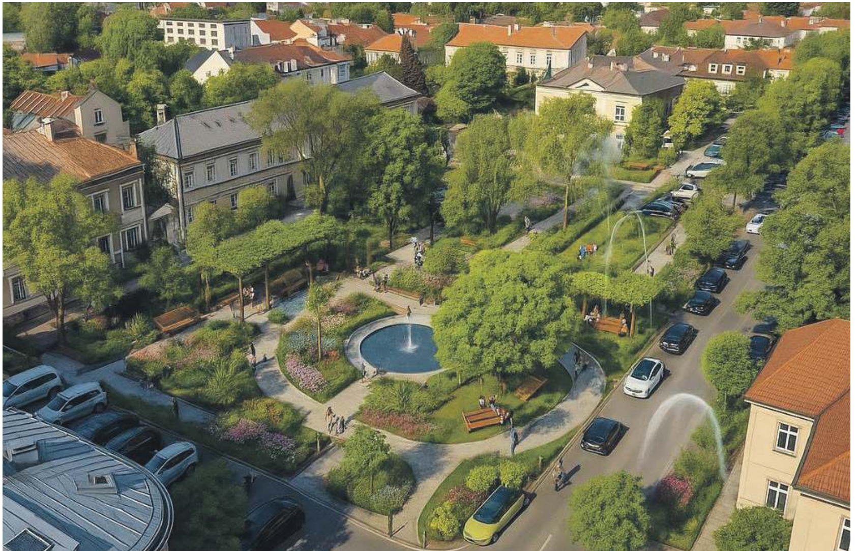
Zielony Rynek w Krzeszowicach - zdjęcie wygenerowane przez AI i opublikowane na FB Rzetelna Gmina Krzeszowice

W piśmie wskazali m.in.: potrzebę przekształcenia prze-