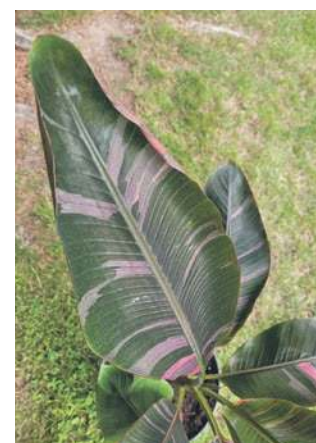
Liść bananowca z różowym przebarwieniem