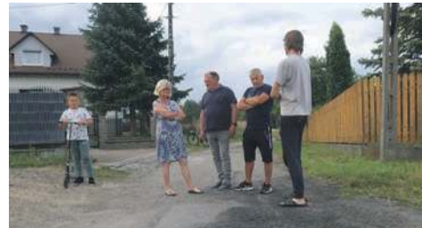
Mieszkańcy ulicy Lubomira w Żarkach czekają na remont drogi

- Droga powstała za czasów burmistrza Kazimierza Poznańskiego. I od ponad 30 lat nie była