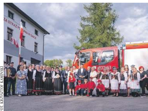
OSP Sanka ma nowy samochód

Na krzeszowickim Rynku stanął pierwszy publiczny źródło wody pitnej. Można już z niego korzystać.