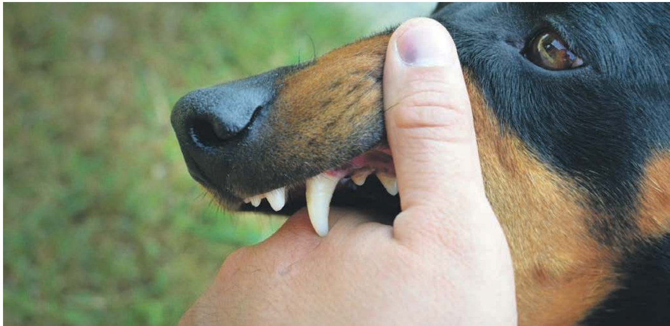
Psy odpowiadają za 70 procent pogryzień w powiecie chrzanowskim

- Szczególnym przypadkiem są pokąsania przez zwierzęta nieznanego lub takiego, w przypadku których niemożliwe jest przeprowadzenie obserwacji lekarsko-weterynaryjnej w kierunku wykluczenia podejrzenia wścieklizny. W takiej sytuacji konieczna jest wizyta w poradni chorób zakaźnych - dodaje przedstawicielka sanepidu.