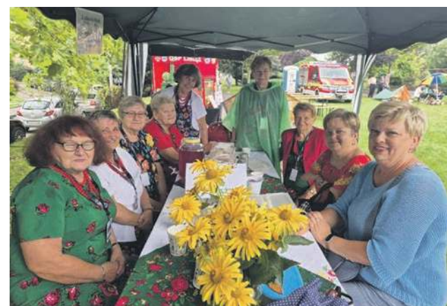
Na pikniku nie zabrakło pań z koła gospodyń wiejskich