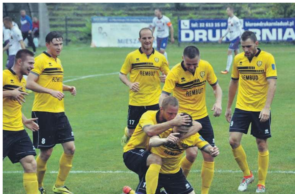
Piłkarze MKS świętują po strzeleniu pierwszego gola Motorowi Lublin w zwycięskim 3-1 meczu rozegranym we wrześniu 2016 r.

Na trzecioligowym froncie „żółto-czarni” utrzymali się przez dwa sezony. Ostatni mecz na tym poziomie rozegrali 16 czerwca 2018 r. Przegrali wówczas 0-2 na wyjeździe z Wisłą Sandomierz. Obecnie trzebinianie rywalizują w czwartej lidze, ale o awansie nikt w MKS-ie na