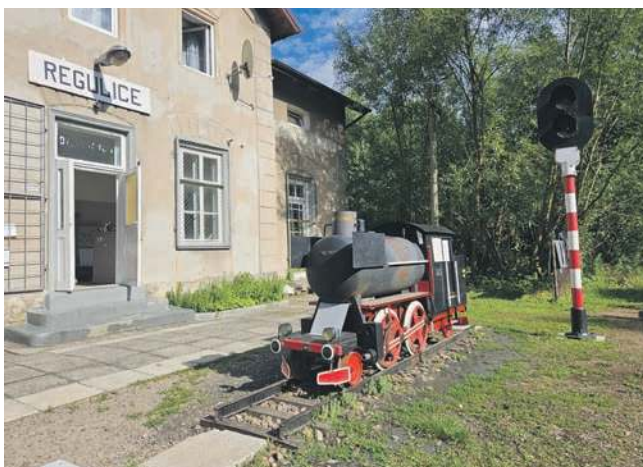
Dworzec w Regulicach. Przed wejściem lokomotywa-grill, wykonana przez Michała Ścianę