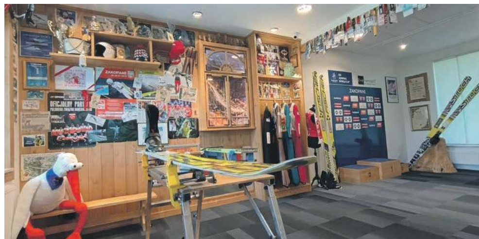
Pierwsza sala do zwiedzania w „Kamilandzie” to Service Room

Bilet wstępu kosztuje 20 zł (ulgowy 10 zł), a dzieci do lat 6 wchodzą za darmo. To miejsce, obowiązkowe nie tylko dla fanów skoków, znajduje się przy trasie prowadzącej do Wielkiej Krokwi, niedaleko od Krupówek.