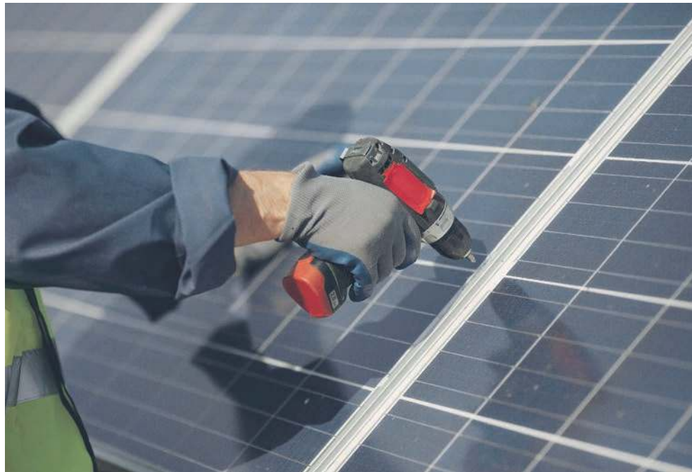
Dynamicznie rozwijają się zwłaszcza firmy związane z fotowoltaiką

„Uwzględniając dane udostępnione w Banku Danych Lokalnych dotyczące liczby osób fizycznych prowadzących działalność gospodarczą na terenie gminy Chrzanów, gdzie za rok 2022 było to 3 938, za rok 2023 - 3 989, a za rok 2024 to liczba 4101, stwierdzić należy stały wzrost liczby osób fizycznych prowadzących działalność gospodarczą. W ciągu trzech lat z 380 do 408 wzrosła także liczba spółek handlowych” – czytamy w „Raporcie o stanie gminy Chrzanów” za 2024 rok.