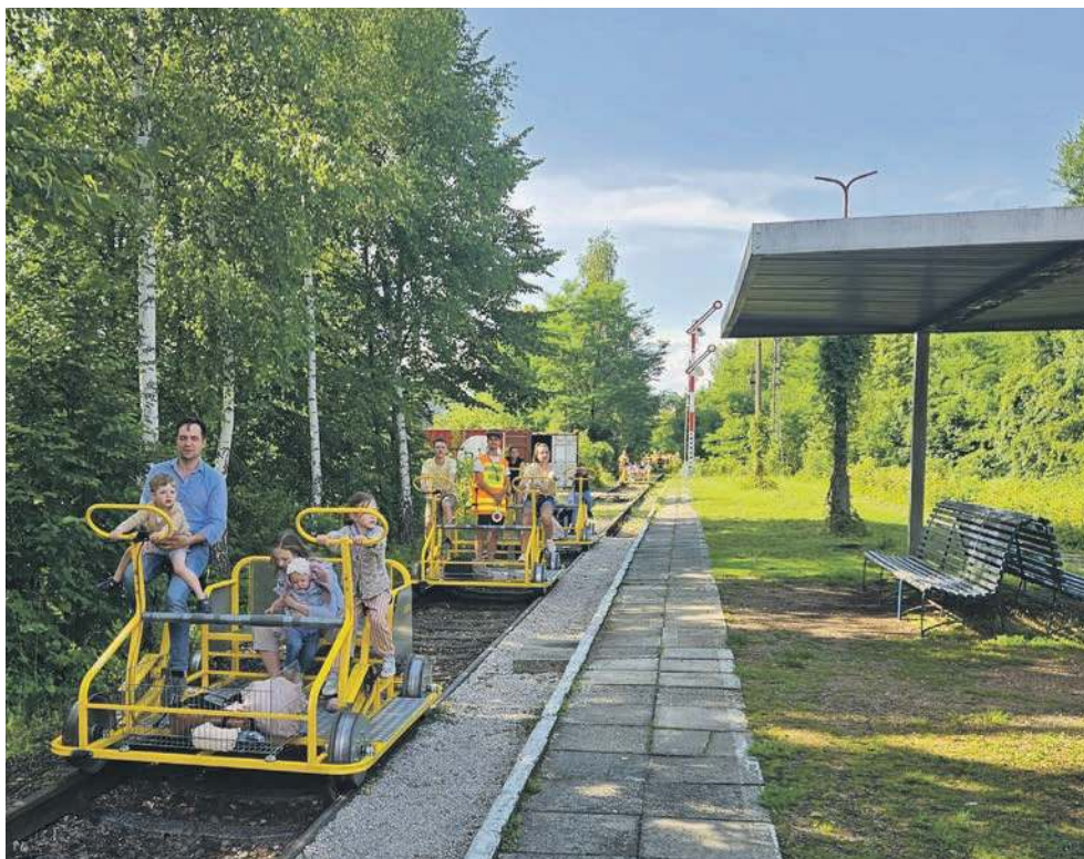
Drezyny na stacji w Regulicach. Tu zaczyna się i kończy każda przejażdżka drezyną