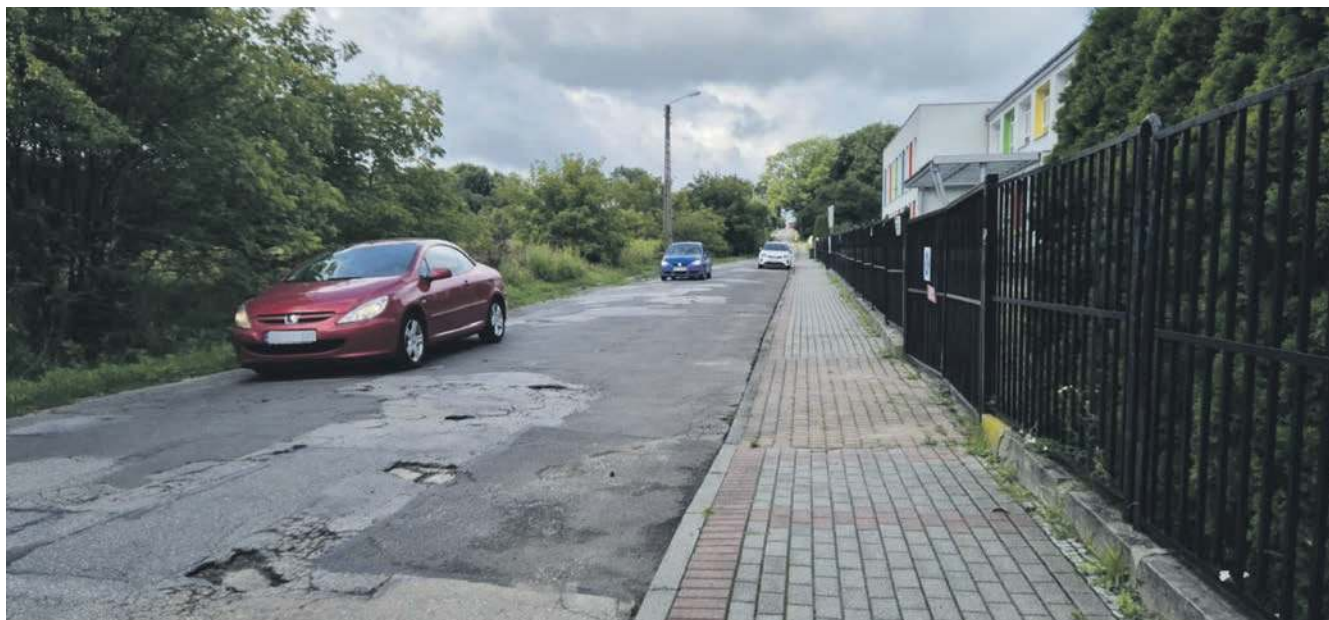
Podziurawiona droga czeka na remont

CHRZANÓW. Pod koniec sierpnia powinny się zacząć roboty budowlane przy ul. Dworskiej. Niewiele czasu zostanie na jej przebudowę.