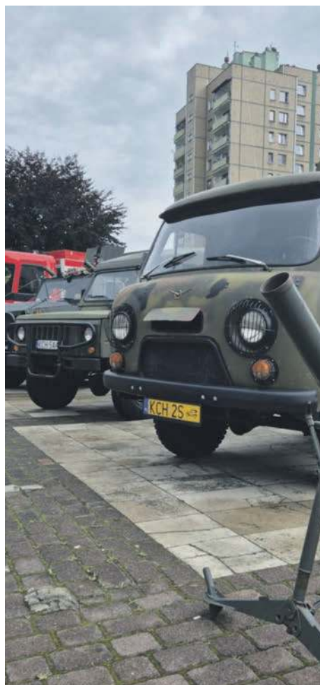
Wojskowe pojazdy stały na Placu Słonecznym