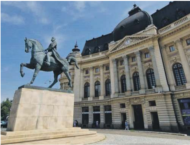
Konny pomnik Karola I przed Pałacem Królewskim