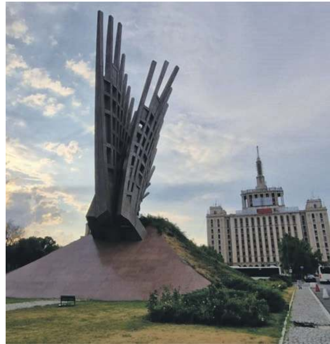
Pomnik Skrzydeł, a w tle Dom Wolnej Prasy