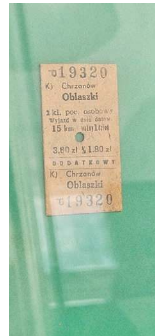
Obiekt pożądania wielu kolekcjonerów - bilet kolejowy ze stacji Chrzanów-Oblaszki, zlikwidowanej w 1959 roku. Do obejrzenia na dworcu w Regulicach

Linia kolejowa nr 103 została otwarta 15 sierpnia 1899 roku z inicjatywy hrabiego Andrzeja Potockiego z Krzeszowic. Łączyła przemysłową Trzebinę ze Skawcami. W latach 70. XX wieku trasą przejeżdżał nawet ekspres „Tatry” - z Warszawy do Zakopanego, omijający Kraków. W 1988 roku zamknięto odcinek Wadowice-Skawce. W 2002 zawieszono ruch pasażerski Trzebinia-Wadowice, a od 2012 roku tylko fragment Spytkowice-Okleśna funkcjonuje dla ruchu towarowego. Drezyny wróciły na część trasy w lipcu 2017 roku. Położono wtedy 1400 metrów torów od nowa - rękami pasjonatów.