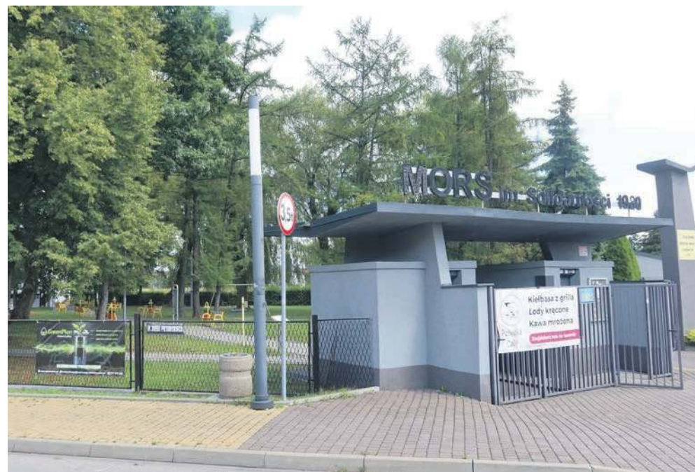
Wejście do Miejskiego Ośrodka Rekreacyjno-Sportowego przy ulicy Pilsudskiego w Libiążu