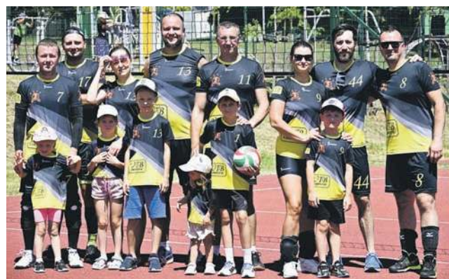
UTB Team Myślachowice

Na terenie rekreacyjno-sportowym przy ulicy Parkowej odbył się tradycyjny Turniej Piłki Siatkowej.