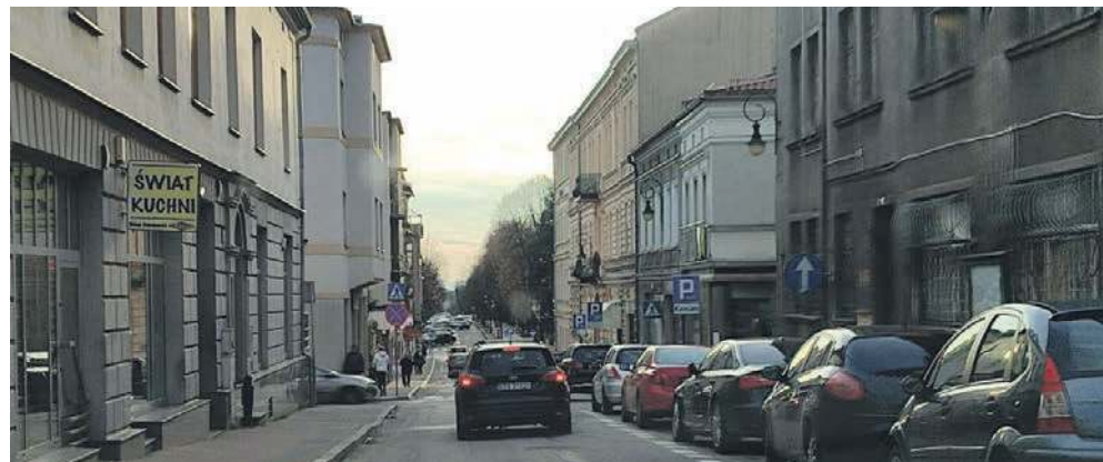
Czy kiedyś jeszcze przy alei Henryka w Chrzanowie będzie tłoczno?

Mniej więcej tyle, że do centrum wprowadzani są nowi, bogatsi mieszkańcy, inwestujący w remonty komunalnych niegdyś kamienic, gdy