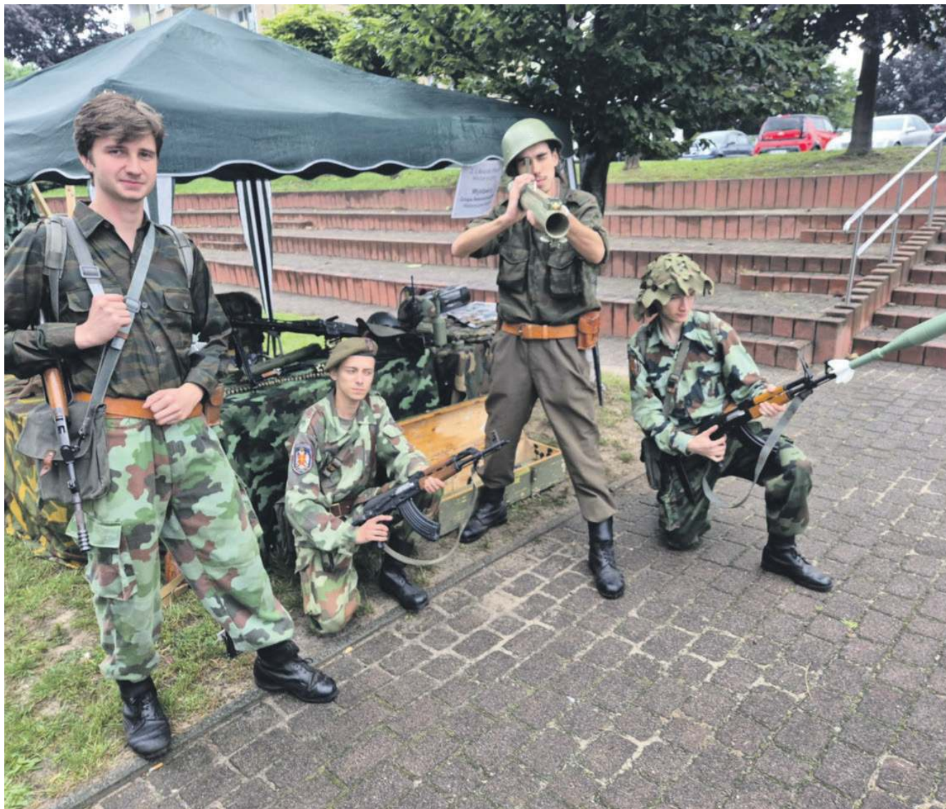
Członkowie grupy rekonstrukcji historycznej Krajina, mającej siedzibę w Luszowicach