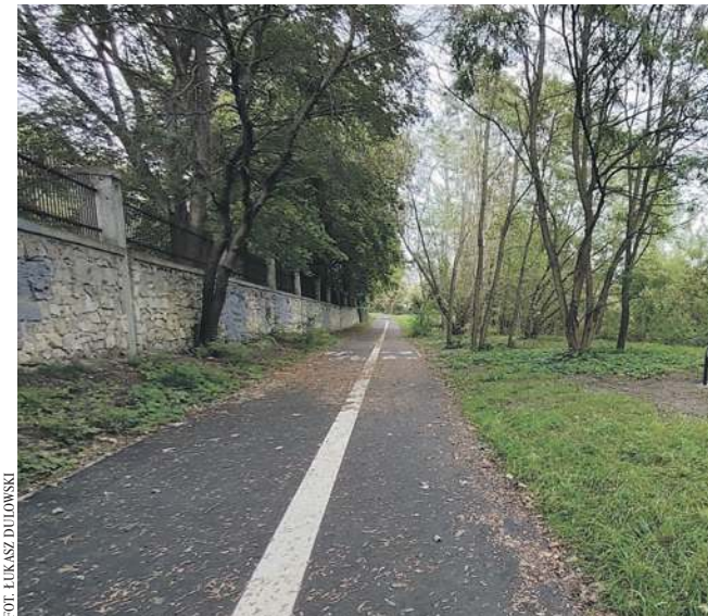
(EA) Fragment Chechłostrady biegnący wzdłuż muru cmentarza żydowskiego

Planuje, żeby do końca tej kadencji, czyli do 2029 r., było gotowe 7,5 kilometra Chechło- strady.