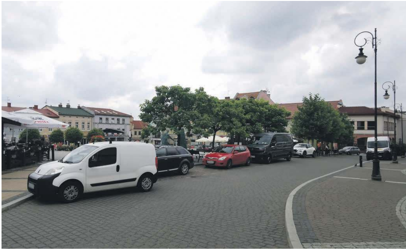
Auta zaparkowane na Rynku w Chrzanowie