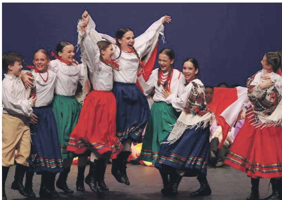
Grupa Children Small Group National and Folklore.

Historyczny sukces tancerzy z powiatu chrzanowskiego i gminy Krzeszowice podczas Dance World Cup 2025.