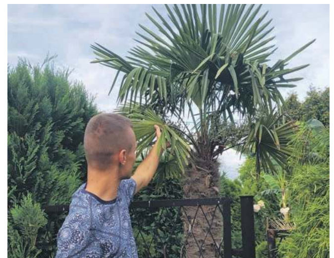
Palma zniesie mrozy, ale warto ją na zimę osłonić