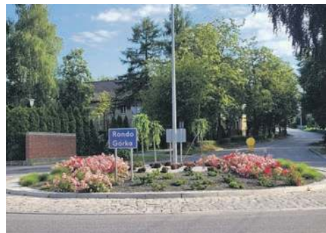
Rondo u zbiegu dróg powiatowych w Górce

„Ze względu na zły stan techniczny, kładka nad torami przy ul. Dworskiej w Trzebini została wyłączona z użytkowania. Zamiast kosztownego remontu przestarzałej konstrukcji, która