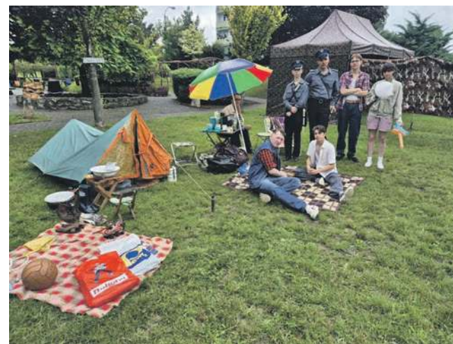
Grupa rekonstrukcyjno-historyczna Szrank z ekspozycją z lat 80.