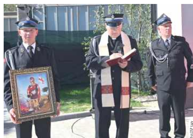
Obraz patrona strażaków św. Floriana zawiśnie w strażnicy

Druhowie z OSP Łazy składają podziękowanie na ręce wójta gminy Łuków oraz Rady Gminy Łuków za rozbudowę strażnicy.