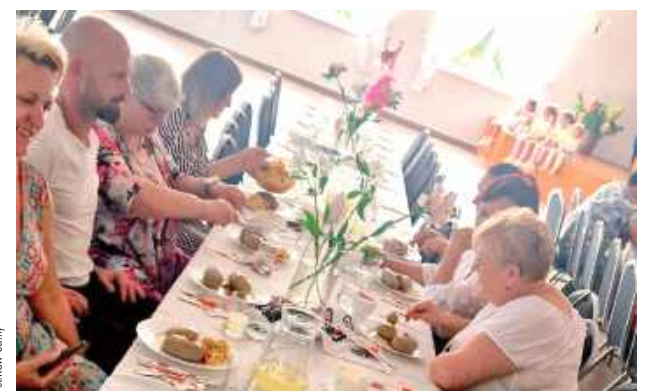
Po gotowaniu przyszedł czas na degustację pyszności