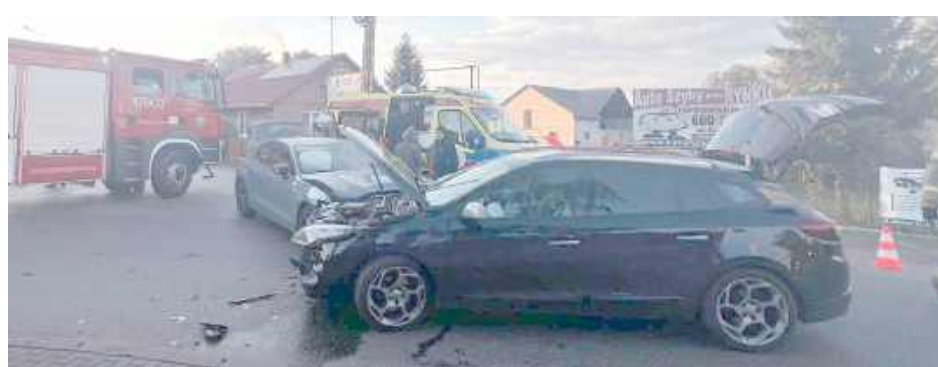
W działaniach uczestniczyły jednostki KSRG OSP Serokomla, JRG Łuków, zespół ratownictwa medycznego oraz policja

Na miejsce szybko dotarły służby ratunkowe, które udzieliły poszkodowanym pierwszej pomocy oraz zabezpieczyły teren zdarzenia.