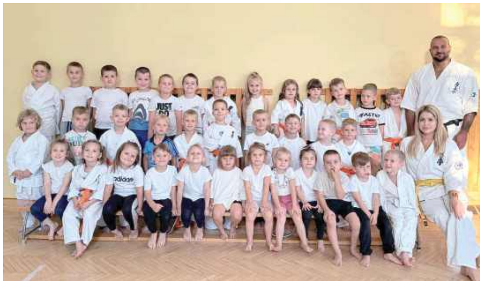
Grupa dzieci początkująca 4-6 lat