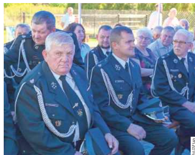
Na uroczystość przybyli druhowie z zaprzyjaźnionych jednostek OSP