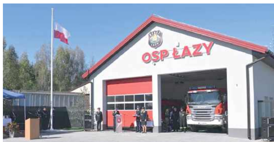
Nowa strażnica i garaż OSP Łazy