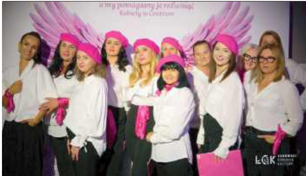
Koncert „Paris Paris” został promowany przez LOK jako wieczór muzyki francuskiej z wystawą malarską i zapachami Prowansji