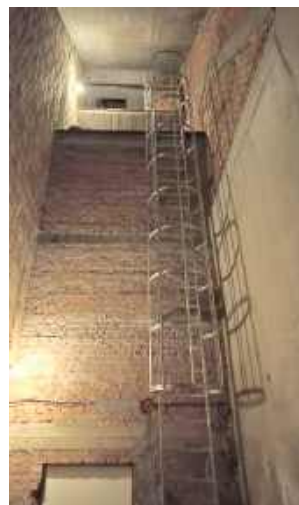
Prace miały na celu wyeliminowanie problemu z zawilgoceniem i zagrzybieniem