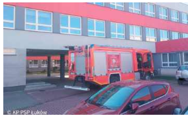
W budynku Szkoły Podstawowej nr 5 im. gen. Władysława Sikorskiego w Łukowie doszło do pożaru w szybie windy

Jak poinformował st.kpt. Paweł Szyszowski z KP PSP w Łukowie, na miejsce zdarzenia zadysponowano cztery zastępy z Jednostki Ratowniczo-Gaśniczej w Łukowie. W chwili