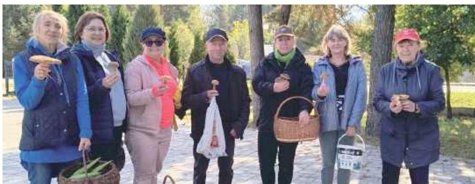
Seniorzy skorzystali z bliskości lasu i pięknej pogody

Nie zabrakło też wyjątkowych wrażeń – uczestnicy