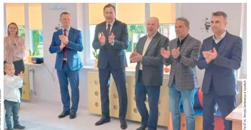
W wydarzeniu wzięli udział wójt gminy Stoczek Łukowski, przedstawiciele władz samorządowych, rodzice oraz mieszkańcy miejscowości

W środę, 1 października odbyło się uroczyste otwarcie przedszkola w Szyszkach po gruntownym remoncie.