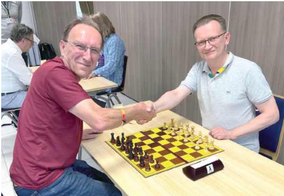
Radca prawny oraz członek Stowarzyszenia Szachistów Szachpol w Łukowie potwierdził swoją doskonałą formę, zdobywając aż cztery złote medale

Radca prawny oraz członek Stowarzyszenia Szachistów Szachpol w Łukowie potwierdził swoją doskonałą formę, zdobywając aż cztery złote medale. Triumfował zarówno w klasyfikacji indywidualnej, jak i drużynowej. Zwyciężył w szachach szybkich, szachach błyskawicznych, dwuboju (łącznie klasyfikacja obu odmian gry), a także poprowadził swoją drużynę do pierwszego miejsca.