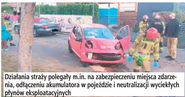
Działania straży polegały m.in. na zabezpieczeniu miejsca zdarzenia, odłączeniu akumulatora w pojeździe i neutralizacji wyciekłych płynów eksploatacyjnych

Jak poinformowała KP PSP w Łukowie, jedna osoba została poszkodowana. Na miejscu interweniowały: trzy samochody