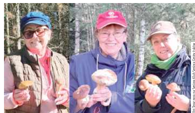
Dumne grzybiarki ze swoimi trofeami. Gratulacje!

– Świeże powietrze, miłe towarzystwo i piękna przyroda – lepszej terapii nie trzeba! – pod-