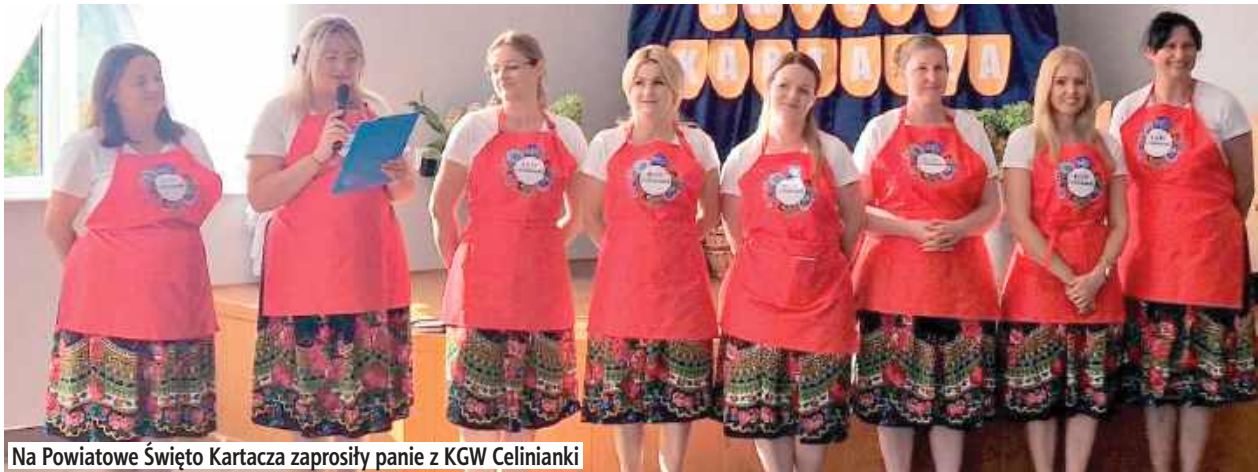
Na Powiatowe Święto Kartacza zaprosiły panie z KGW Celinianki

GMINA TRZEBIESZÓW: Powiatowe Święto Kartacza w Celinach zgromadziło mieszkańców i miłośników regionalnej kuchni przy stołach pełnych tradycyjnych przysmaków.