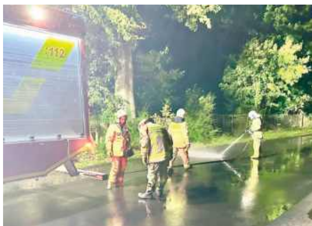
Strażacy interweniowali o godzinie 19.31

We wtorek, 30 września o godzinie 19.31 strażacy zostali wezwani do zdarzenia na drodze powiatowej. Zgłoszenie dotyczyło rozlanej substancji ropopochodnej na drodze między Tuchowiczem a Anoninem.