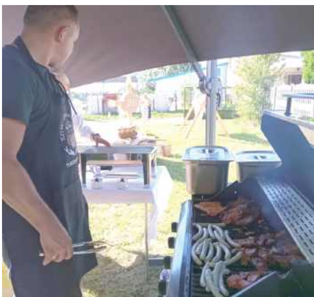
mo Seniorzy zjadali się pysznymi kiełbaskami z grilla