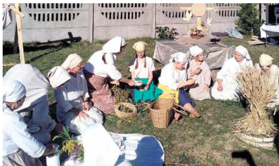
Podczas wydarzenia panie z koła zaprezentowały widowisko, w którym przypomniły dawne obrzędy związane ze zniwami