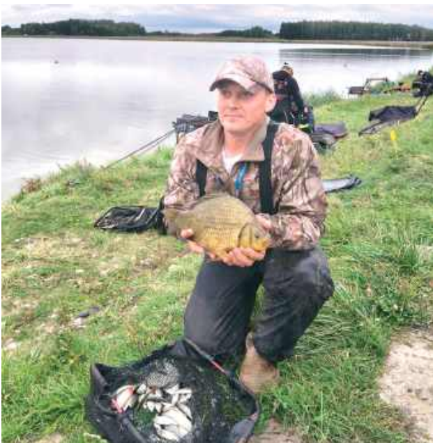
Ale ryby! Gratulacje!

Blisko 90 zawodników stanęło do rywalizacji podczas dwudniowych zawodów wędkarskich zorganizowanych przez Koło Polskiego Związku Wędkarskiego Łuków Miasto w kategorii spławikowej i feederowej nad Jeziorem Dratów.