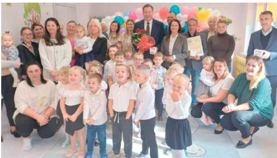
Teraz dzieci mogą korzystać z odnowionych sal, bezpiecznych korytarzy oraz nowoczesnego wyposażenia