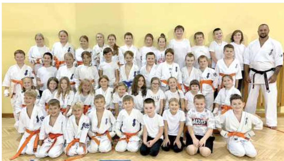
Grupa dzieci początkująca 8-12 lat