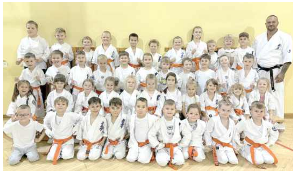
Grupa dzieci średniozaawansowana 7-8 lat