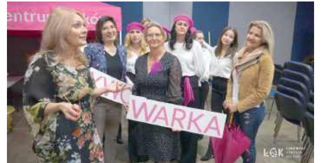
Muzyka francuska – zarówno klasyczne pieśni Edith Piaf, Charlesa Aznavoura, jak i utwory współczesne – nabrała nowego wymiaru w łukowskim wykonaniu

W piątek, 26 września w Łukowskim Ośrodku Kultury odbył się koncert pod tytułem „Paris, Paris – wieczór piosenki francuskiej w Łukowie”, przygotowany przez Stowarzyszenie Kobiety w Centrum – Łuków.