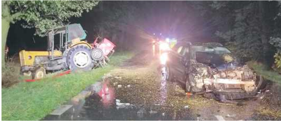
W miejscowości Władysławów na drodze powiatowej doszło do kolizji traktora i auta osobowego

Na miejsce wezwano służby ratunkowe: zespół ratownictwa medycznego, straż pożarną i policję. Kierujący renault po zderzeniu uskarżał się na dolegliwości i został zabrany karetką pogotowia do szpitala. Jak