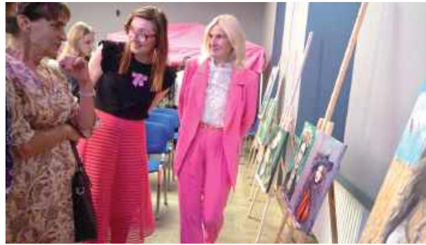
Tego wieczoru Łuków stał się sceną dla połączenia dźwięku, obrazu i smaku we wspólnej opowieści