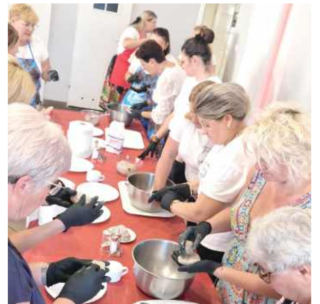
Gospodynie zręcznie lepily kartacze