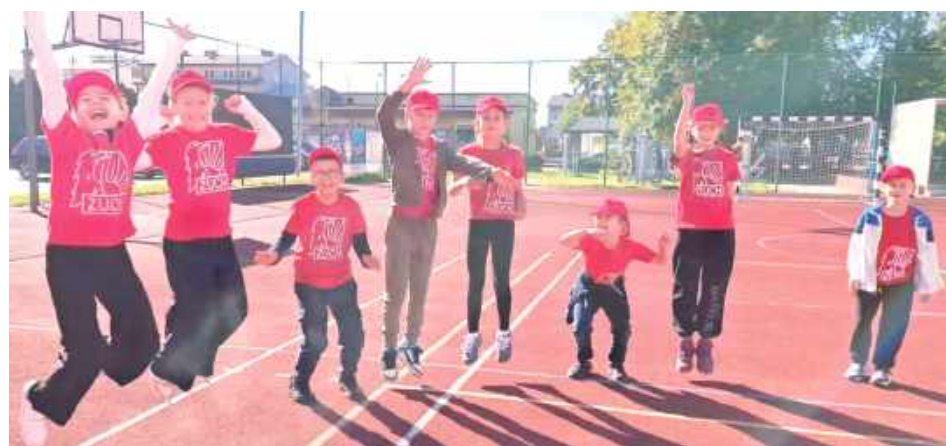
Zuchowy Turniej pokazał najmłodszym aktywne sposoby spędzania wolnego czasu

Turniej zakończono wręczeniem nagród dla drużyn i wspólnymi fotografiami oraz płasami zuchowymi.