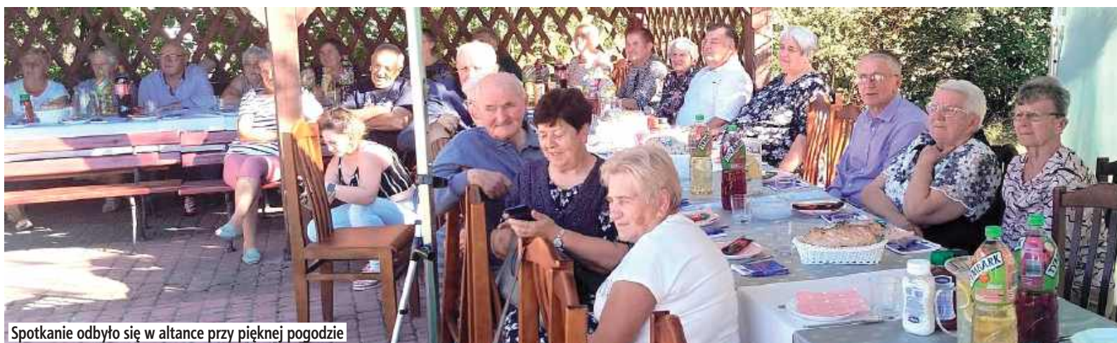
Spotkanie odbyło się w altance przy pięknej pogodzie

Kolejne spotkanie już 18 października. Tym razem tematem przewodnim będą jesienne przysmaki, będą także dodatkowe atrakcje.