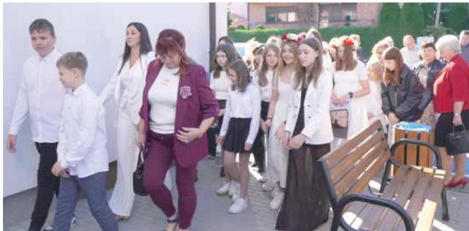
Młodzież licznie przybyła na otwarcie. Biblioteka od lat ma dla młodych mieszkańców ciekawe zajęcia i projekty

mieszkańców regionu oraz podejmowanie wielu cennych inicjatyw.