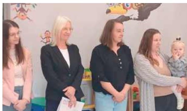
W czasie uroczystości podziękowano wszystkim, którzy przyczynili się do powstania pięknego i potrzebnego miejsca dla małych mieszkańców gminy

W czasie uroczystości podziękowano wszystkim, którzy przyczynili się do powstania pięknego i potrzebnego miejsca dla małych mieszkańców gminy.