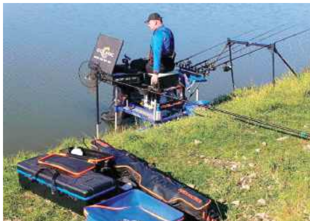
Współcześni wędkarze dysponują nowoczesnym sprzętem