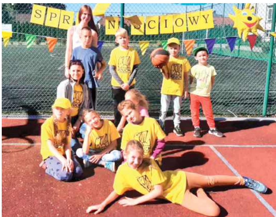
Zuchy chętnie brały udział w konkurencjach sportowych

Zuchowy Turniej Sprawnościowy Hufca ZHP Łuków im. Bohaterów Ziemi Łukowskiej rozegrany został 28 września w Adamowie. Pogoda dopisała i umożliwiła wiele konkurencji na świeżym powietrzu.