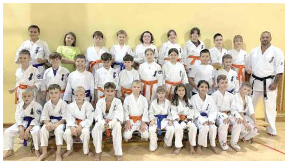
Grupa dzieci średniozaawansowana 8-12 lat

Łukowski Klub Karate Kyokushin z dumą rozpoczął kolejny sezon treningowy. To szczególnie ważny moment. Klub działa nieprzerwanie od 25 lat, wychowując kolejne pokolenia adeptów tej wymagającej, ale i niezwykle rozwijającej sztuki walki.