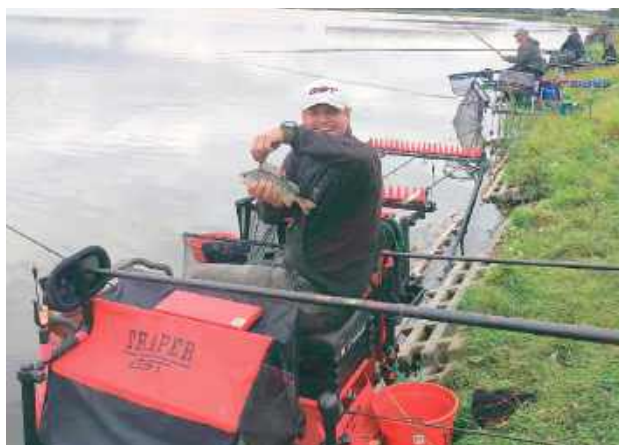
Mimo zmiennej pogody humory dopisywały wędkarzom