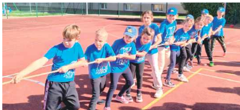
Przeciąganie liny to jedna z ulubionych konkurencji