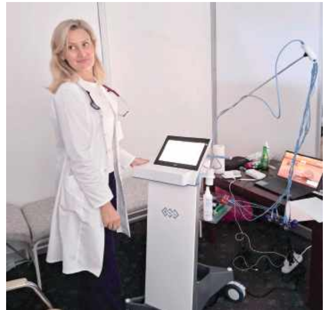
W kardiologii kluczowym czynnikiem jest czas. Im szybciej wykryjemy u pacjenta problem kardiologiczny, tym lepiej jesteś w stanie go leczyć