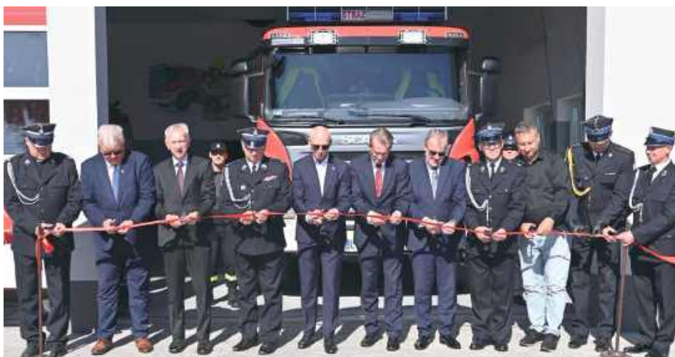
Przedstawiciele strażaków i władz przecięli wstęgę

Dla najmłodszych przygotowano dmuchańce, a wszyscy uczestnicy mogli skosztować tradycyjnej strażackiej gro-