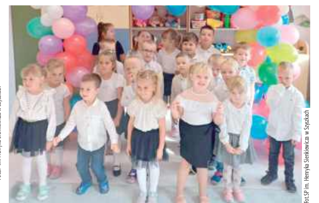
Najmłodszy przygotował program artystyczny