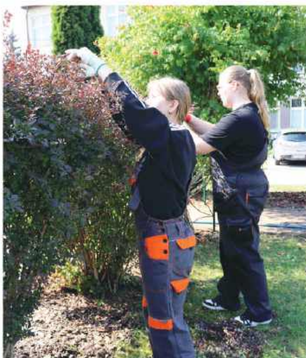
Technik architektury krajobrazu i arborystyki