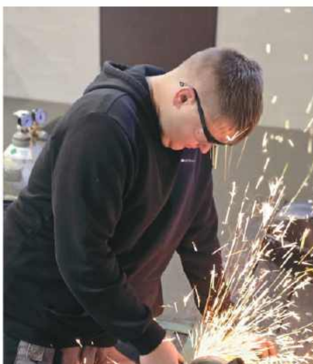
Mechanik operator pojazdów i maszyn rolniczych