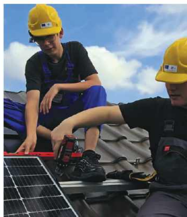
Technik urządzeń i systemów energetyki odnawialnej