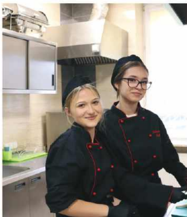
Technik żywienia i usług gastronomicznych