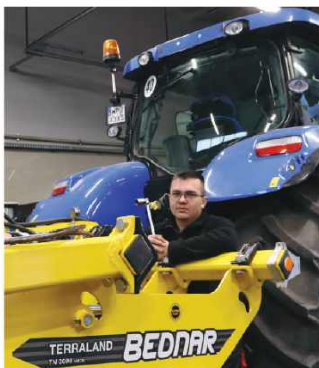
Technik mechanizacji rolnictwa i agrotechniki

Konkretny zawód. Konkretna umiejętność. Konkretna przyszłość. Lubisz działać? My też – uczymy w praktyce !!!