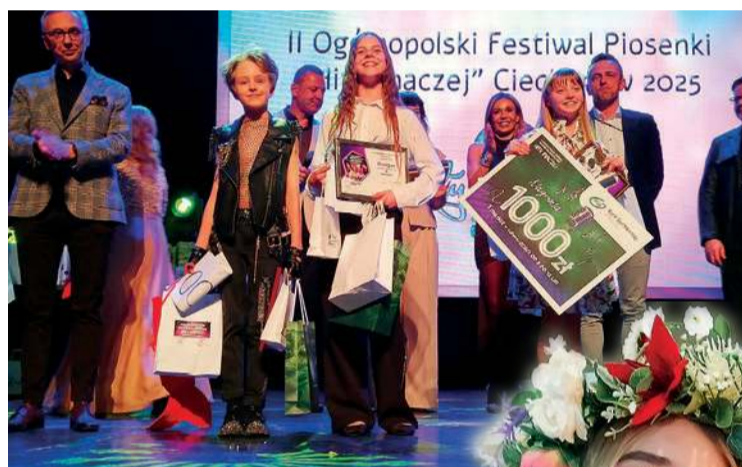
Zwycięzcy w kategorii do 12 lat