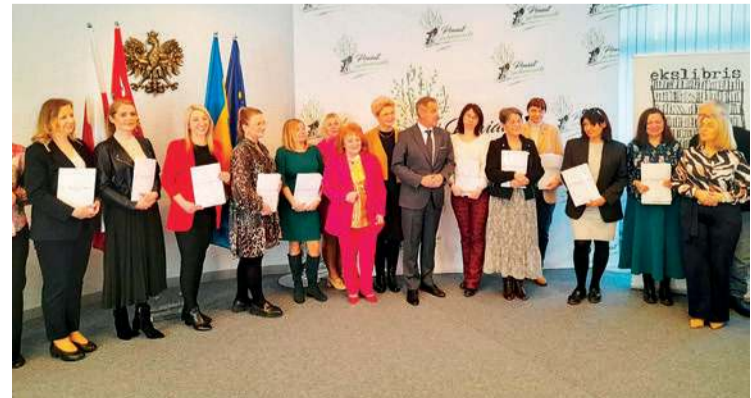
Szkolni koordynatorzy Konkursu