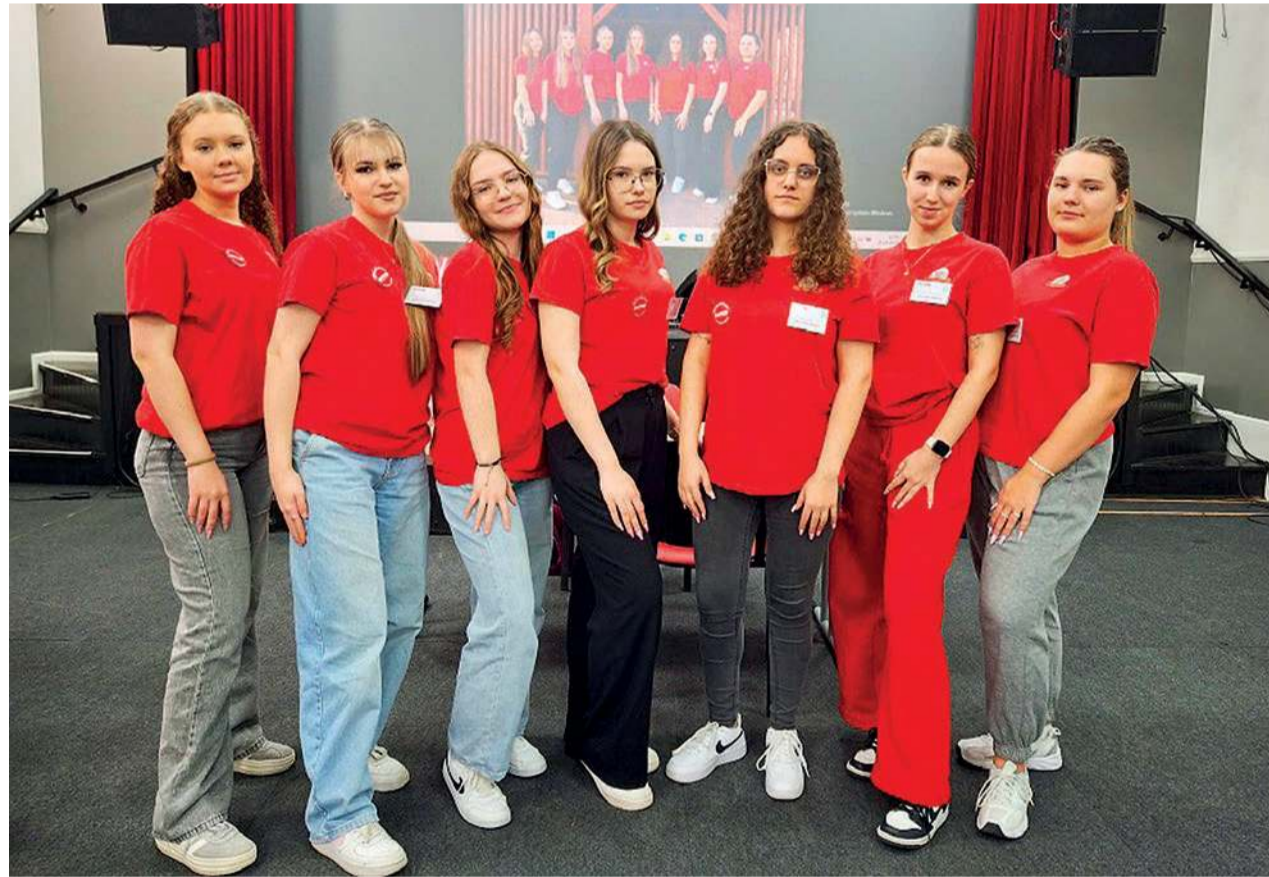
Brawo! Dzięki projektowi „Moje komórki – Twoje życie” uczennicom SLO STO w Raciążu udało się zarejestrować 60 nowych potencjalnych dawców szpiku.