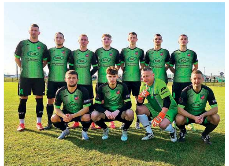
Wkra Żuromin w lidze nie powiedziała jeszcze ostatniego słowa...

20. kolejka (5-6 kwietnia): Delta - Żbik, Nadnarwianka - PAF, Drukarz - Kasztelan, Polonia - Wkra, Sokół - Narew, Huragan - Marcovia