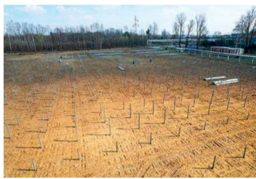
Farma powstanie przy ulicy Tysiąclecia

Panele fotowoltaiczne przy ul. Tysiąclecia będą ustawione na gruncie na tzw. stołach wykonanych w konstrukcji stalowej w układzie dwurzędowym wschód-zachód. Energia, która będzie wytwarzana na farmie fotowoltaiki w Ciechanowie ma zapewnić m.in. pokrycie części zapotrzebowania na