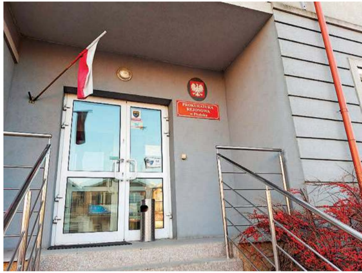
Płoński szpital złożył zawiadomienie do prokuratury w sprawie modernizacji o rozbudowy budynku E.

- Dziś mamy taki stan rzeczy, że ten budynek nie spełnia wymogów sanitarnych, jeśli chodzi o działalność, jaka jest tam prowadzona - mówił dyrektor szpitala, argumentując, że w 2018 r. była kontrola z Urzędu Wojewódzkiego, która