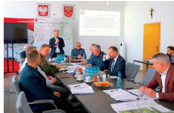
Powiatowa „gra decyzyjna”

Policyjne działania w takich sytuacjach mają na celu minimalizację strat, zapewnienie porządku publicznego oraz ratowanie ludzkiego życia. Priorytetem jest zapewnienie bezpieczeństwa oraz współpraca z innymi służbami. Policjanci ćwiczyli więc ewakuację ludności, kierowanie ruchem, udzielanie pomocy medycznej mieszkańcom oraz niedopuszczenie do przejawów łamania prawa, w tym szabrownictwa. RK