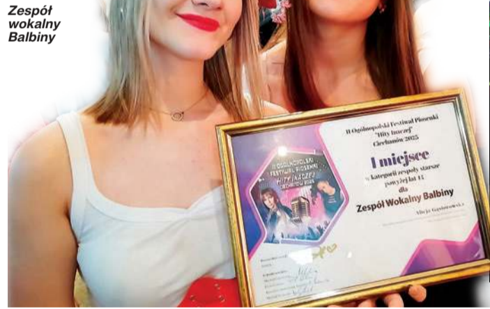
Zespół wokalny Balbiny

– Wybierz piosenkę, która jest hitem, zaśpiewaj ją z podkładem muzycznym,