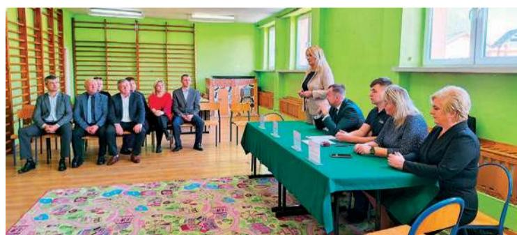
Gmina Załuski utworzy drugi żłobek. W piątek, 28 marca w SP w Szczytnie podpisano już umowę na roboty budowlane, by przystosować na ten cel pomieszczenia