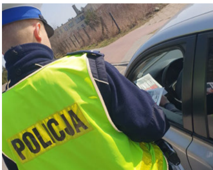
Akcja „Zwolnij, bo się przejeździsz”