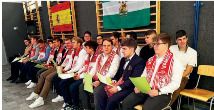
Technicy ze Staszica po powrocie z Hiszpanii