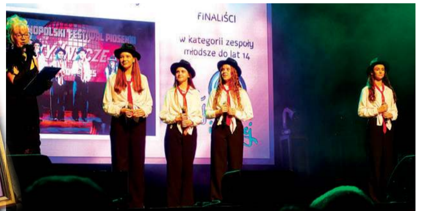
Czerwone Krawaty z Mławy

uważają, że jury jest najważniejsze i to jest jedyny głos, który może wam dać wiatr w skrzydła, czy jakkolwiek was to pozycjonuje, to ja jestem błędnie myślenie. Jedynym najważniejszym jury w waszym życiu, jeżeli chcecie śpiewać i swoją drogę łączyć ze sceną, to jest publiczność. To ona ma was kochać, ona ma was cenić, ona was będzie bronić. Ona zawsze będzie z wami, obojętnie, czy fałszujecie, czy źle zaśpiewacie, czy zapomnicie, wasze serca, wasza charyzma, to jak potraficie kupić publiczność, to jest wasz największy skarb i nad tym pracujecie. Jury, mimo że teraz sama podcinam gałąź, na której siedziałam przez ostatnie godziny, jest najmniej ważne.