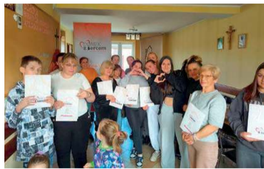
Stowarzyszenie Nasze Marzenia

Dzień wcześniej (22 marca) w tej samej akcji udział wzięli członkowie Stowarzyszenia Nasze Marzenia z Lubowid-