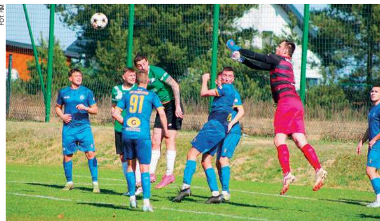
W Słoszewie padła aż dziewięć bramek...