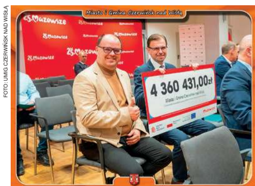
Investycja, na którą czerwiński samorząd pozyskał środki jest zaplanowana na 2025 rok. Zakres prac obejmuje m.in. modernizację hydroforu w Komsinie

Dofinansowanie w kwocie blisko 4,4 mln zł zostanie przeznaczony na realizację zadania „Zrównoważenie gospodarki wodnej na terenie miasta i gminy Czerwińsk nad Wisłą” i pokrywa 100 procent kosztów kwalifikowanych netto inwestycji.