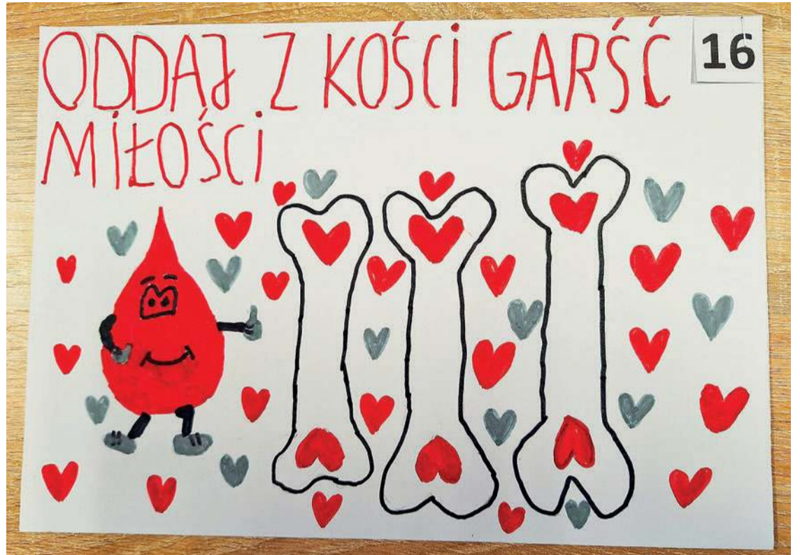
Jednym z elementów projektu był konkurs plastyczny dla dzieci, propagujący tematykę dawstwa szpiku. Na zdjęciu jeden z konkursowych rysunków. Bardzo przekonujący.