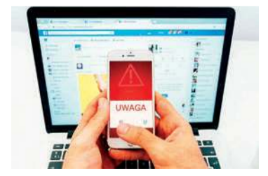
Szukając dobrych ofert w mediach społecznościowych trzeba zachować szczególną ostrożność