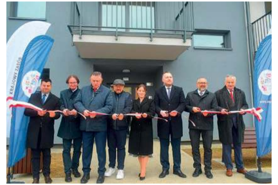
Budynek przy ulicy Padlewskiego w Płońsku jest pierwszą, zakończoną inwestycją SIM Północne Mazowsze. Podczas czwartkowej uroczystości mieszkańcy otrzymali klucze, a wszyscy zostali uwiecznieni na pamiątkowym zdjęciu

Dlaczego ich wybór mieszkanie SIM, które dopiero po spłacie kredytu może stać się ich własnością?