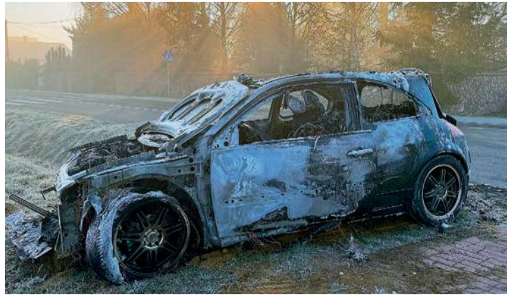
Tak wyglądał samochód następnego dnia