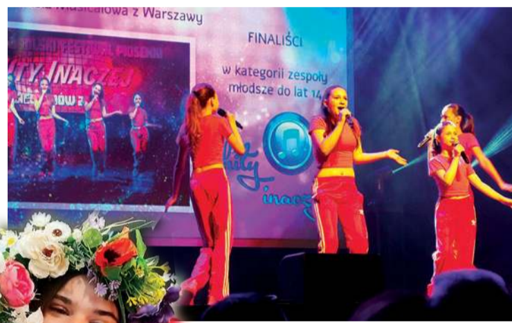
Warszawska Szkoła Musicalowa