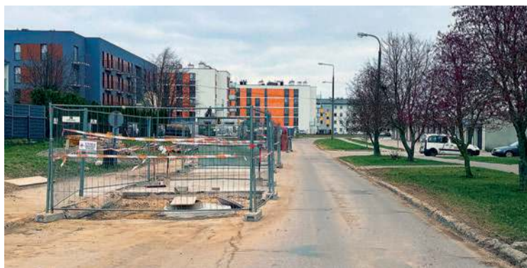
Ulica Karola Szwanke w Ciechanowie