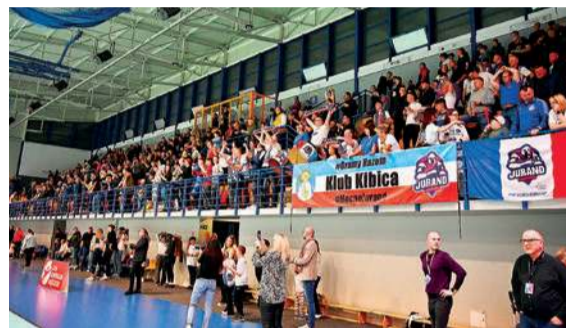
Radość kibiców po ostatnim gwizdku

21. kolejka (4-6 kwietnia): Padwa - Jurand, KPR - Pogoń, Stal - Nielba, Olimpia - Stal, Anilana - AZS AWF, SMS Kielce - Grunwald, Miedź - Gwardia