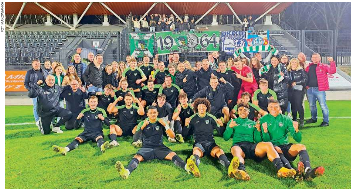
Szczęśliwi piłkarze Makowianki z kibicami po wygranej w Warszawie