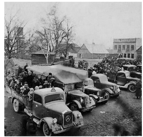
W zimną, marcową noc setki mieszkańców Sochocina: starsi i młodzi, mężczyźni, kobiety i dzieci musieli opuścić swoje domy. Spędzono ich pod kościół, a stąd ciężarówkami zostali wywiezieni do obozu w Pomiechówku.