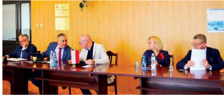
Sesja rady powiatu odbyła się w czwartek 27 marca

Na przeprowadzkę i dostosowanie budynku do potrzeb urzędostwa powiat otrzymał 9,8 mln. zł z programu Polski Ład. Okazało się jednak, że potrzebne są dodatkowe środki. W trakcie obrad, rada powiatu wyraziła zgodę na zaciągnięcie pożyczki długoterminowej w wysokości 5 mln zł. z Wojewódzkiego Funduszu Ochrony Środowiska i Gospodarki