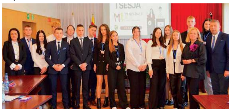
Rada młodzieży jest pełna entuzjazmu i zapału do działania