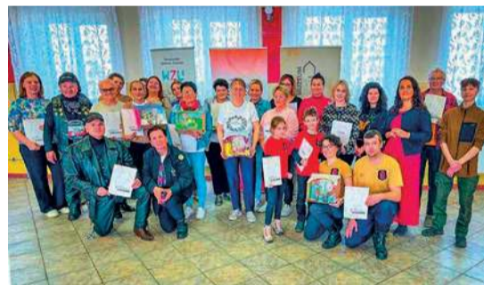
Stowarzyszenie Społeczno-Kulturowe WZU

dza oraz osoby, które chciały zaangażować się w warsztaty dla chorych dzieci. W wikariacie (salce przykościelnej) spotkało się 25 osób reprezentujących wszystkie pokolenia.