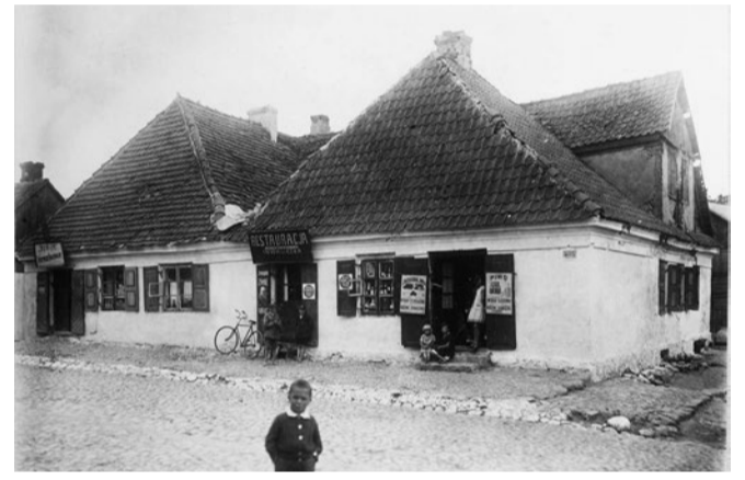
Restauracja w Sochocinie, lata międzywojenne