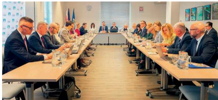
Marcowa sesja rady miasta

Przypomnijmy, że tegoroczny Ciechanowski Budżet Obywatelski wzbudził mnóstwo wątpliwości, przede wszystkim co do sposobu i uczciwości przy oddawaniu głosów. Okazało się, że w niektórych przypadkach wykorzystywano głosy niepełnoletnich mieszkańców, bez wiedzy ich rodziców czy opiekunów. Sprawa trafiła na policję, która prowadzi dochodzenie w tej sprawie. Również do urzędu miasta zgłosiło się wielu mieszkańców Ciechanowa, którzy zorientowali się, że ich głosy (oczywiście bez ich zgody) zostały wykorzystane w głosowaniach. Tutaj nasuwa się pytania, czy podobne