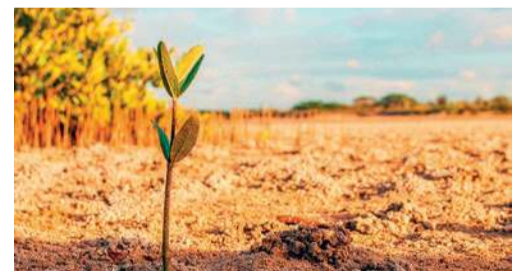
Małe sadzonki nie tylko są dobre dla środowiska - wzbogacają również ogród

W ramach akcji za przyniesioną makulaturę, plastikowe butelki lub drobny sprzęt elektryczny i elektroniczny będzie można otrzymać sadzonkę świerku pospolitego lub olchy. Można więc będzie nie tylko zasilic środowisko, ale też... własny ogródek – o nowe sadzonki. PB