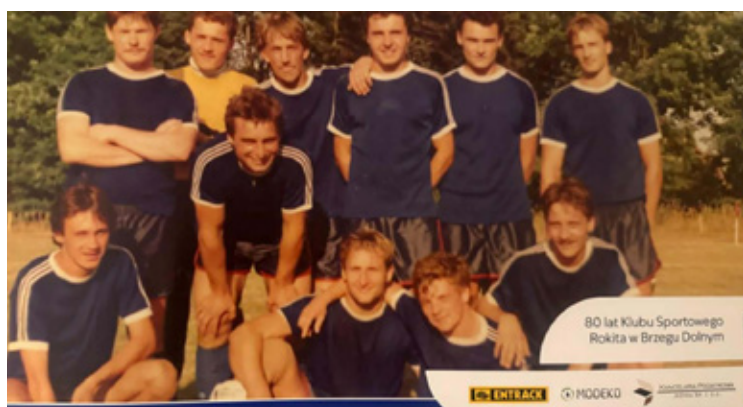
Słońce prawie jak w Libii.