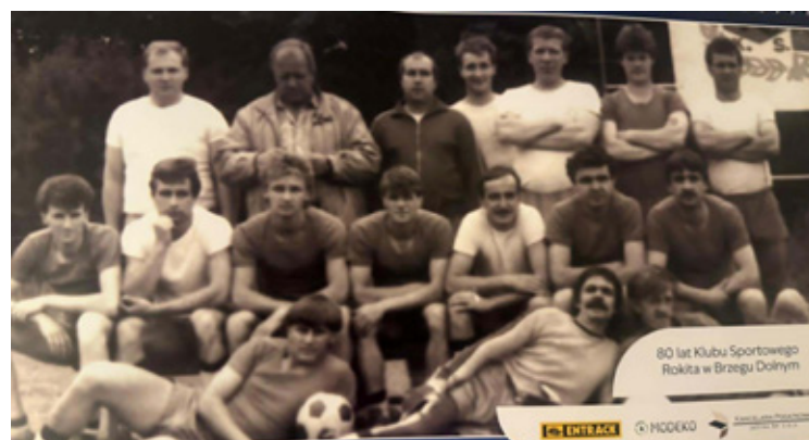
Stare fotografie mają swój urok.