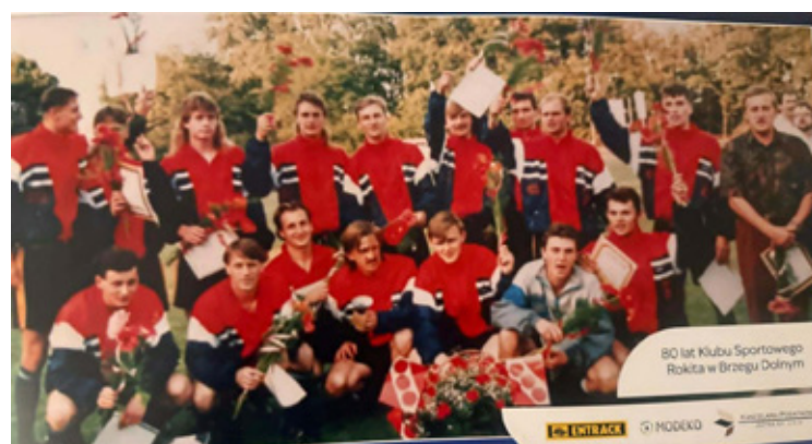
Entuzjazm i kwiaty.