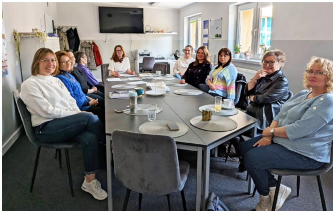
Spotkanie edukacyjne w sprawie wszawicy

Zasady postępowania w przypadku wykrycia problemu są jasne. Szkoła, po stwierdzeniu obecności pasożytów, ma obowiązek powiadomić rodziców