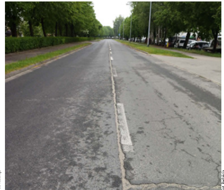
Czas na modernizację.

Projektanci duży nacisk położyli jednak przede wszystkim na bezpieczeństwo pieszych. W planach znalazły się nowoczesne, wyniesione przejścia dla pieszych wyposażone w dodatkowe oświetlenie. Takie rozwiązania mają wymuszać na kierowcach zmniejszenie prędkości i popra-