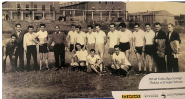
Wszyscy zmieścili się na zdjęciu.

O muzyczną oprawę i sportową atmosferę zadba DJ Zarzyk, ale prawdziwe emocje pojawią się również na murawie. Punktual-