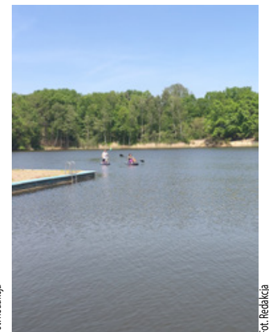
Można też popływać na deskach SUP.

Już teraz teren jest udostępniany mieszkańcom podczas ciepłych weekendów. Można korzystać z miejsc do grillowania i organizacji ognisk, odpoczywać nad wodą czy spędzać czas na