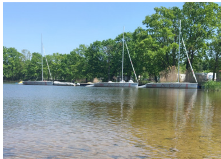
Miejsce dla najmłodszych.

Nowi najemcy podkreślają, że zależy im na stopniowym przywracaniu temu miejscu funkcji rekreacyjnej, ale także na współpracy z lokalną społecznością i samorządem. W działania związane z funkcjonowaniem ośrodka włączają się również gmina Brzeg Dolny, Sołectwo Wały oraz firma PCC Rokita.