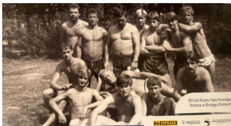
Musiąło być bardzo gorąco!