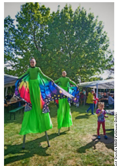
Cyrkownicy z Areny przykuwali wzrok swoimi umiejętnościami i wyjątkowymi strojami.

„Razem tworzymy wspólnotę”, to hasło widniało na plakatach i patrząc na frekwencję, trudno o lepsze podsumowanie tej niedzieli. Pozostaje czekać na kolejną edycję!