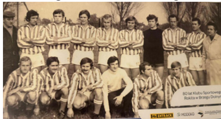
Dawne czasy, dawna moda na stroje.