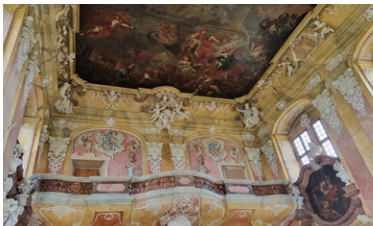
Sala Książęca zaprasza.