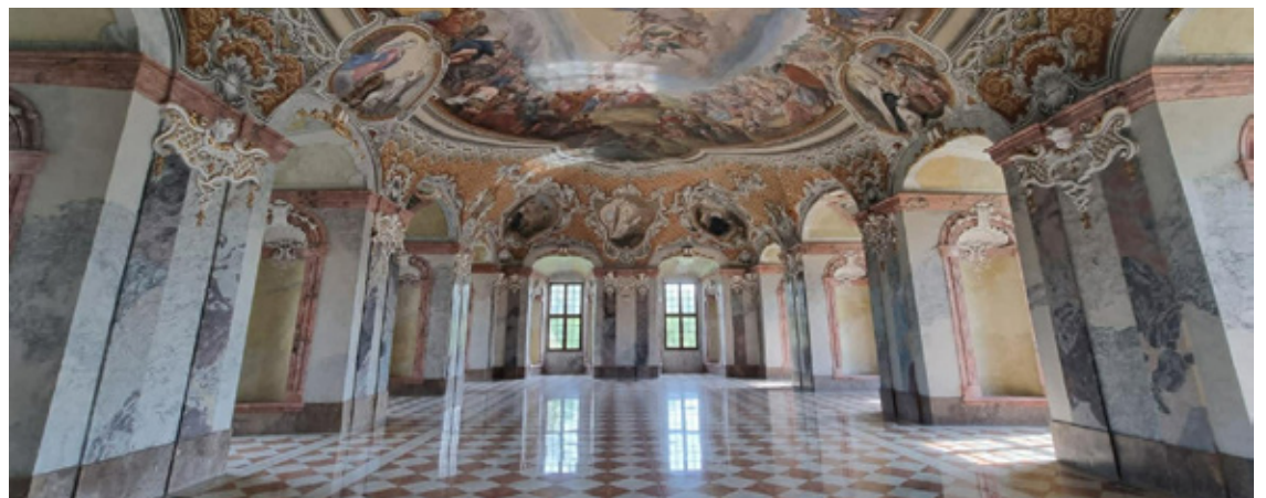
Klasztor w Lubiążu.

Już w weekend 23 i 24 maja 2026 roku Fundacja Lubiąż otwiera dla zwiedzających miejsca, które na co dzień pozostają pod kluczem.