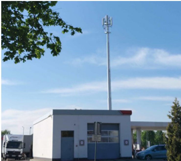
Nowy nadajnik sieci komórkowej na osiedlu Fabrycznym w Brzegu Dolnym.

W przestrzeni internetowej często pojawiają się alarmu-