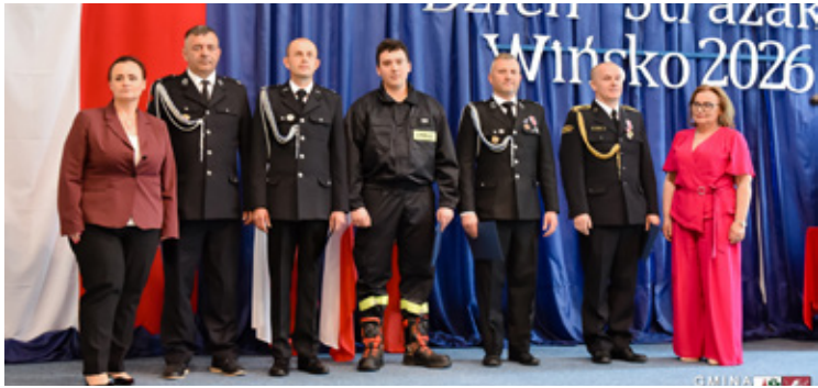
Tradycyjnie podczas obchodów Dnia Strażaka wręczono medale i awanse.

Maj to tradycyjnie czas, w którym kłaniamy się tym, którzy bez wahania ruszają na ratunek w myśl hasła „Bogu na chwałę, ludziom na użytek”. W tym roku podczas powiatowych obchodów Dnia Strażaka, które odbyły się w Wińsku podziękowano funkcjonariuszom PSP oraz druhom OSP za ich codzienną ofiarność, a także wręczyć zasłużone odznaczenia, medale i awanse na wyższe stopnie służbowe.