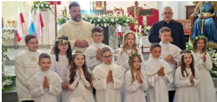
Komunia w parafii p.w. NMP Królowej Polski w Brzegu Dolnym.

W modzie dla dziewczynek dominują proste kroje i naturalne tkaniny. Odchodzi się od ciężkich, atlasowych falban na rzecz delikatnych koronek. Absolutnym