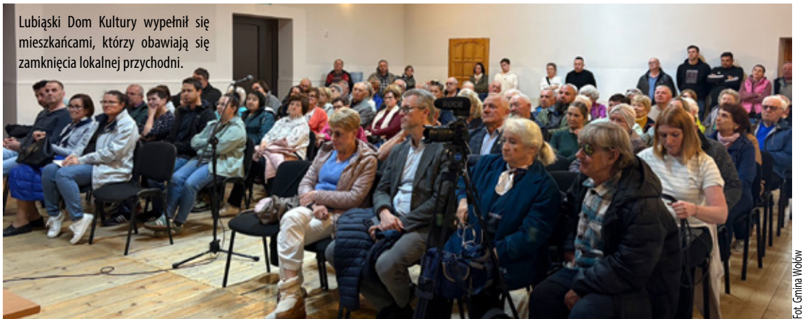
Lubiąski Dom Kultury wypełnił się mieszkańcami, którzy obawiają się zamknięcia lokalnej przychodni.