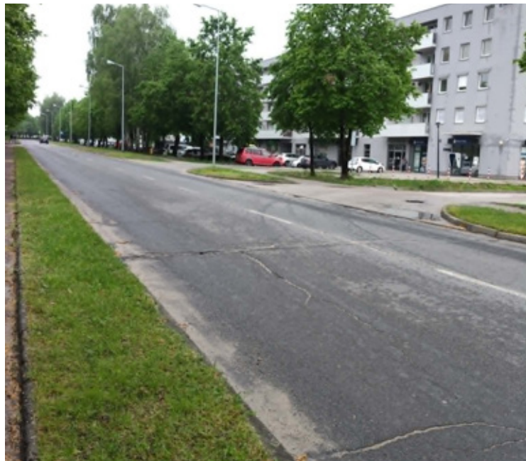
Obecnie ulica Ossolińskiego nie wygląda najlepiej.

To właśnie ta część miasta od dawna wymagała modernizacji. Mieszkańcy wielokrotnie zwracali uwagę nie tylko na stan nawierzchni, ale również na kwestie bezpieczeństwa, szczególnie w rejonie przejść dla pieszych