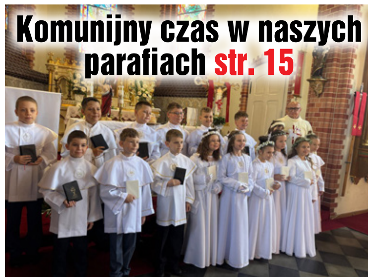
Komunijne uroczystości w Radecku.

Komunijny czas w naszych parafiach str. 15