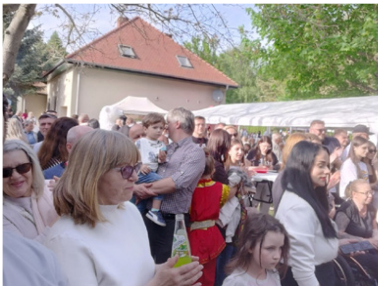
Tłumy mieszkańców postanowiły spędzić niedzielę na pikniku.