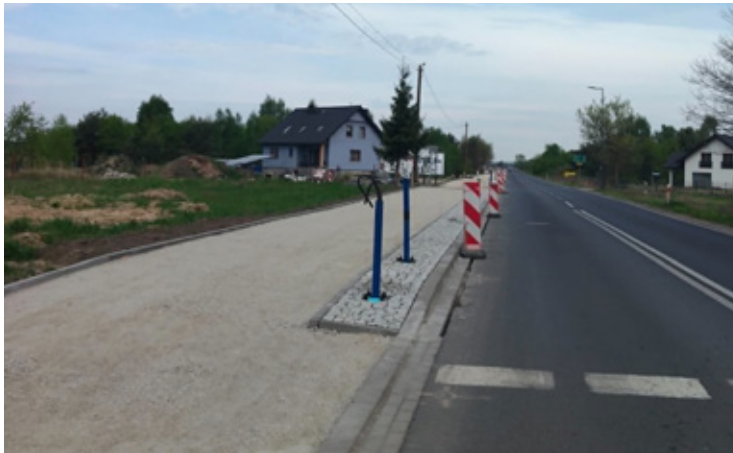
Chodnik łączący Stary Wołów z Wołowem w budowie.

Dla pieszych i rowerzystów najważniejsze jest jedno: koniec z uciekaniem przed samochodami na pobocze ruchliwej trasy. Nowa droga, która ma być gotowa w tym roku, będzie oświetlona na całej długości. Dzięki temu nawet powrót