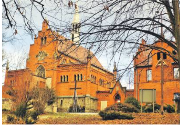
Kościół pw. Podwyższenia Krzyża Świętego w Żelowicach.

„Kondratowice tu mieszkam” to profil na Facebooku, który prowadzi Katarzyna Fuławka. Dzieli się na nim swoimi zdjęciami i opowieściami, które przyciągają tysiące obserwujących. Jak zaczęła się jej przygoda z fotografią, skąd czerpie inspirację i co sprawia, że gmina Kondratowice stała się dla niej tak wyjątkowa?