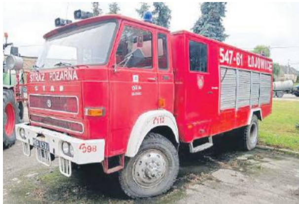
Ten leciwy wóz strażacki czeka na nowego właściciela.