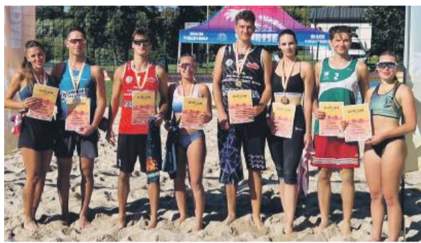
Tradycyjnie najlepsi odebrali nagrody

atmosferą. Publiczność mogła podziwiać wysoki poziom gry, a zawodnicy, mimo końcówki sezonu, pokazali świetną formę