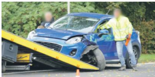
73-letni mieszkaniec Nysy z nieustalonych przyczyn zjechał na przeciwległy pas ruchu i czołowo zderzył się z prawidłowo jadącym autem marki Hyundai