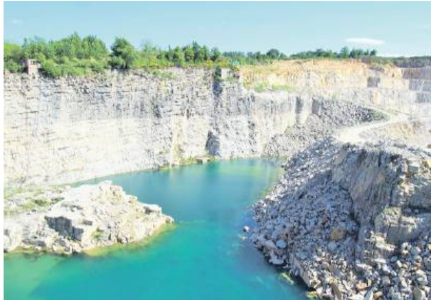
Wyrobisko w Górze Sobockiej z turkusową wodą.