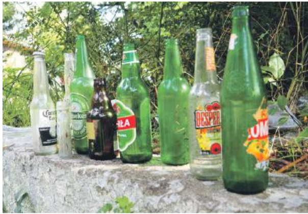
System kaucyjny to mechanizm promujący recykling i ponowne wykorzystanie opakowań

Sklepy o powierzchni handlowej ponad 200 metrów kw. będą musiały obowiązkowo zwracać kaucje za odpowiednio oznakowane opakowania i to bez okazania paragonu, że tam zostały kupione.