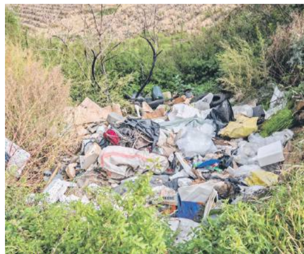
W okolicach Wójcina pojawiło się kolejne dzikie wysypisko.