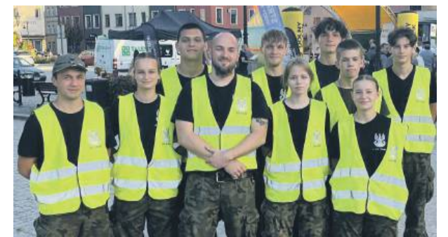
Jednostka Strzelecka w służbie mieszkańcom – zabezpieczenie Grand Prix Strzelina.