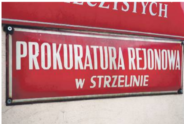
Prokuratura w obecnej fazie śledztwa nie chce ujawnić danych fałszerza. Wiadomo, że mężczyźni postawiono kilkadziesiąt zarzutów

Prokuratura w obecnej fazie śledztwa nie chce ujawnić danych fałszerza. Wiadomo, że mężczyźni postawiono kilkadziesiąt zarzutów. Ma też zakaz wykonywania działalności, czyli sporządzania kosztorysów dla urzędów. Sprawca przyznał się do postawionych zarzutów i złożył obser-