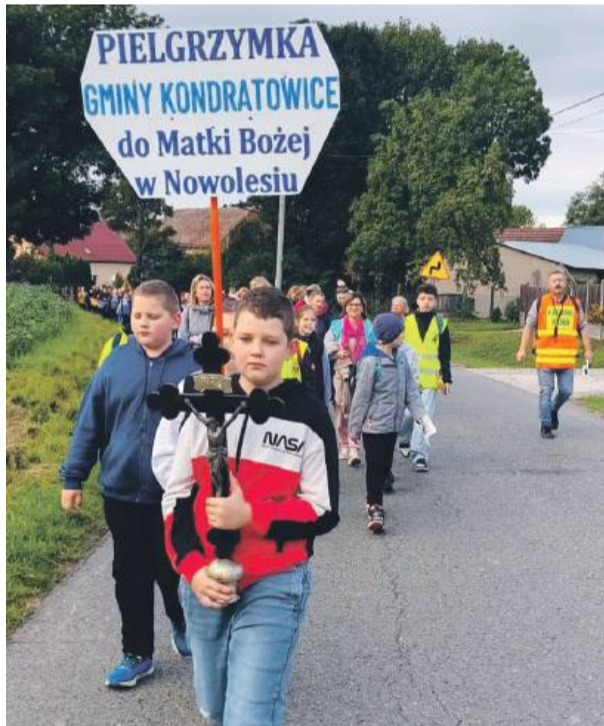
Wśród pielgrzymów była spora grupa młodzieży.