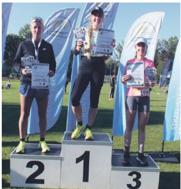
Podium klasyfikacji kobiet z powiatu strzelińskiego na dystansie 10 km