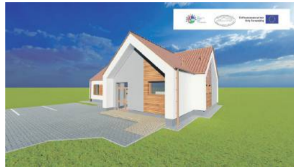
Tak ma wyglądać świetlica wiejska w Szczodrowicach. Wizualizacja została zamieszczona na profilu gminy Strzelin na Facebooku