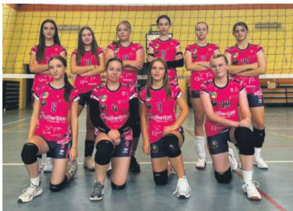
Drużyna siatkarek klubu Tygrysy Strzelin

Tygryśów Strzelin. Drużyna rozpocznie zmagania z ostatnich sparingów strze- lińscy siatkarze sprawdzą-