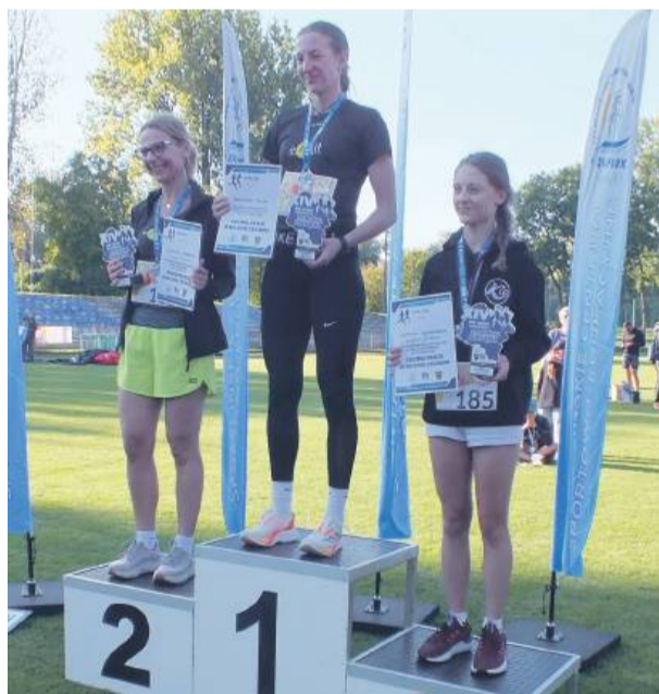
Podium klasyfikacji kobiet z powiatu strzelińskiego na dystansie 5 km