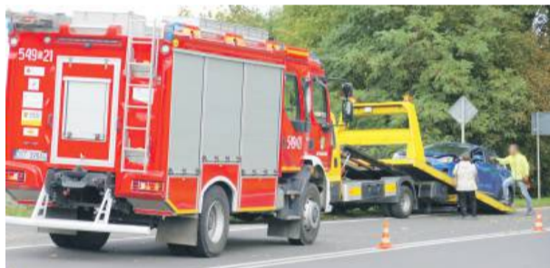
Jeden z samochodów został niemal całkowicie zniszczony