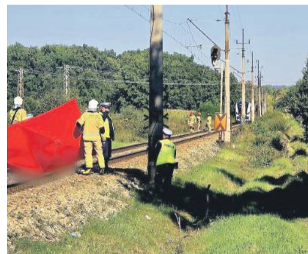
Do tragedii doszło na przejeździe kolejowym. Pociąg śmiertelnie potrafił 76-letniego rowerzystę

Przez ponad godzinę trwała przerwa w ruchu pociągów na trasie Wrocław - Strzelin - Ziębice. Wszystko z powodu tragicznego wypadku w miejscowości Nowy Dwór (gmina Ziębice).