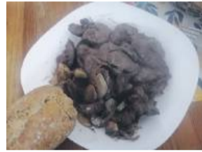
Nie jest to danie piękne, ale uwierzcie mi – było przepyszne

Sposób przygotowania: Wątróbkę opłukać i na sitku przelać gorącą wodą (nie wrzątkiem), tak żeby ją sparzyć. Osuszyć. Pie-