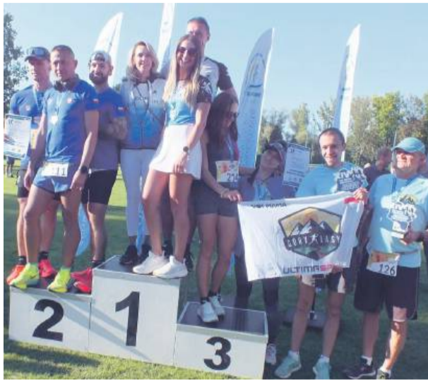
Strzelińscy policjanci zajęli drugie miejsce w klasyfikacji drużynowej na 10 km