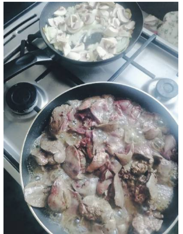
Niestety, nie da się tego usmażyć na jednej patelni, bo nie byłoby takie dobre

czarki umyć, obrać i pokroić w plastry. Cebulę obrać i posiekać w „piórka”. Na dwóch osobnych patelniach rozgrzać olej. Na pierwszą wrzucić wątróbkę, obsmażyć z jednej strony i dopiero potem odwracać (nie mieszać pomiędzy). Na drugiej podsmażyć cebulkę, a jak się zeszkli dodać pieczarki i dusić razem do miękkości. Na koniec połączyć zawartość obu patelni,