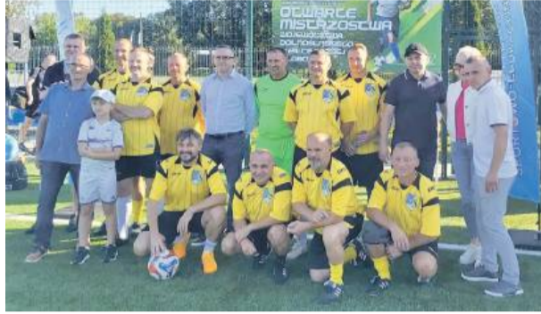
Drużyna Strzelca Strzelin wywalczyła mistrzowski tytuł

oldbojów. Zawodnicy udowodnili, że mimo upływu lat potrafią prezentować