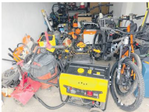
Przedmioty z kradzieży zabezpieczyła policja