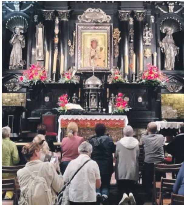
Wierni z parafii pw. Podwyższenia Krzyża Świętego w Strzelinie wzięli udział w pielgrzymce na Jasną Górę.