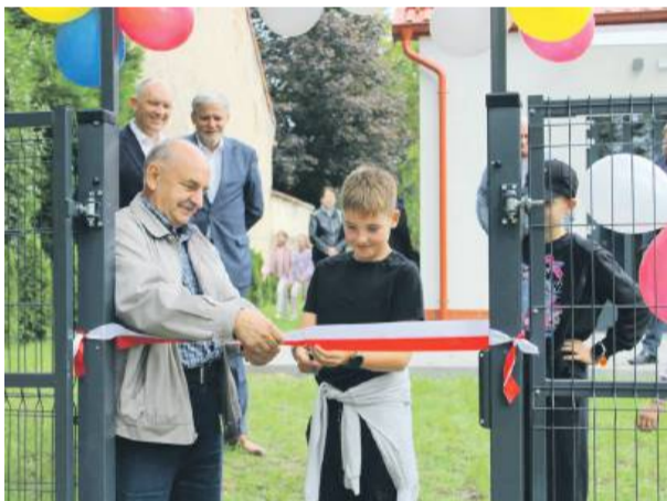
Symbolicznego przecięcia wstęgi dokonały dzieci, główni użytkownicy placu zabaw w Brzezicy.

Dodajmy, że koszt całej inwestycji to prawie 40 tys. zł. Połowa tej kwoty to dofinansowanie z budżetu województwa dolnośląskiego. W ramach zadania zamontowano nowy zestaw