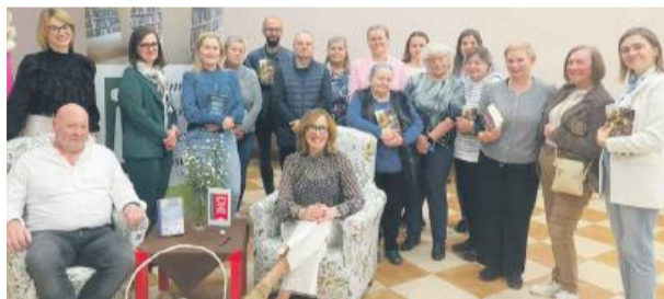
Autorka (w fotelu) z zadowolonymi czytelnikami.

Co wspólnego mają wiatraki, czekolada, tulipany i rowery? Czy pomysły można znaleźć na ulicy? Czy bliscy w pracy pomagają?