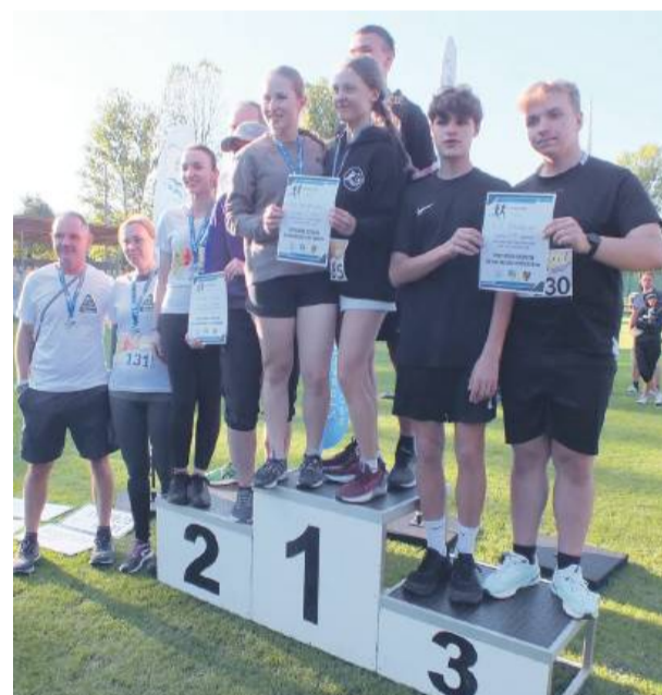
Najlepsze drużyny biegu na 5 km