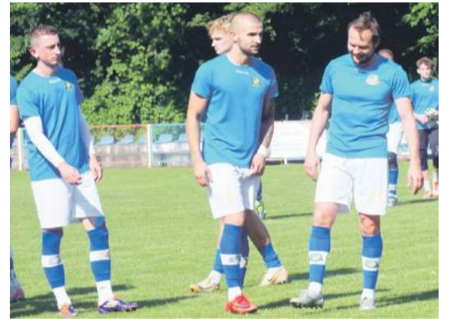
Piłkarze Strzelinianki stracili punkty w doliczonym czasie gry