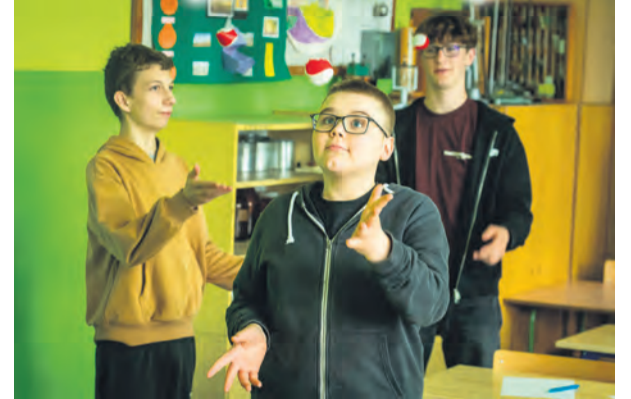
Zajęcia w ramach projektu „Klucz do uczenia 3.0” w Jeżewie w powiecie świeckim.