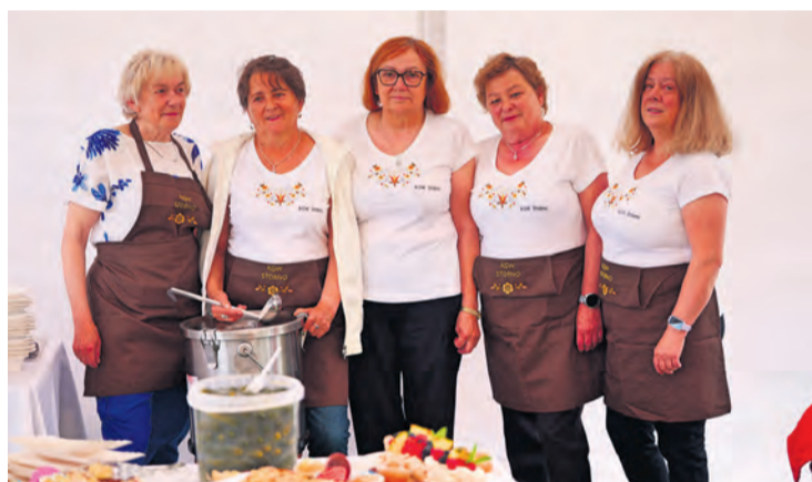
KGW Stobno skradło serca i podniebienia, serwując swojskie, fantastyczne menu.