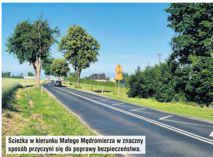
Ścieżka w kierunku Małego Mędromierza w znaczny sposób przyczyni się do poprawy bezpieczeństwa.

Według przekazanych informacji urzędu wojewódzkiego szansę na otrzymanie pieniędzy na drogi mają wszystkie samorządy z listy rezerwowej, ale te z tzw. priorytetem pierwszym. Akurat gmina Tuchola obecnie nie ma takiej inwestycji w zanadrzu.