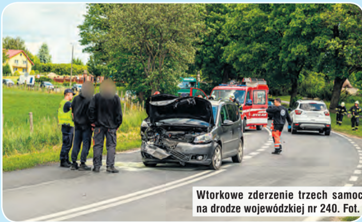
Wtorkowe zderzenie trzech samochodów w Bysławiu na drodze wojewódzkiej nr 240.