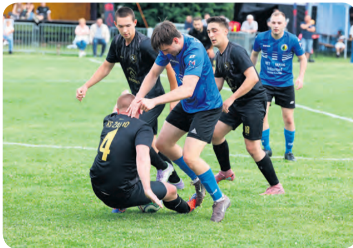
W derbach między KS Żalno a Cisem Cekcyn było wiele walki i ciekawych akcji podbramkowych.

Niezwykle żywy mecz w piątkowe popołudnie był na pewno świetnym, emocjonującym początkiem weekendu dla licznie zgromadzonych kibiców i choć miejscowi przegrali, na pewno nie mają się czego wstydzić, bo podjęli walkę i potrafili nakłonić do oklasków tych, którzy widzieli to z boku. W tym spotkaniu nie było miazdzącej przewagi Cisa, choć szczególnie w drugiej połowie to goście byli lepsi i zasłużenie wygrali. Obie drużyny były nastawione na otwartą grę i trudno było zli-