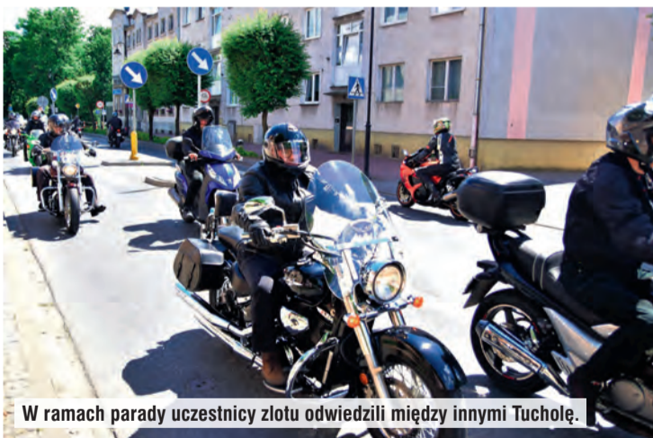
W ramach parady uczestnicy zlotu odwiedzili między innymi Tucholę.