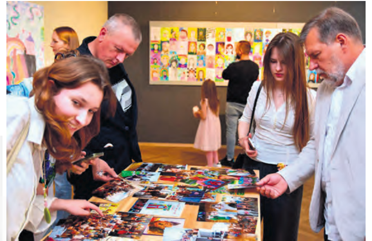
W sali wystawowej TOK-u zagościła jubileuszowa wystawa. Można na niej zobaczyć prace stworzone wspólnie przez uczestników z różnych grup wiekowych. Nie brakuje również archiwalnych fotografii, które przywołują wspomnienia i pozwalają odbyć sentymentalną podróż przez 10 lat historii Sztukarni.

Podczas jubileuszowej uroczystości młodzi artyści wielokrotnie odbierali dyplomy, gratulacje i nagrody za swoje osiągnięcia. Każdy uczestnik otrzymał rów-