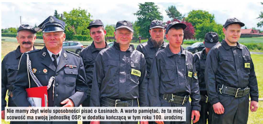
Nie mamy zbyt wielu sposobności pisać o Łosinach. A warto pamiętać, że ta miejscowość ma swoją jednostkę OSP, w dodatku kończącą w tym roku 100. urodziny.