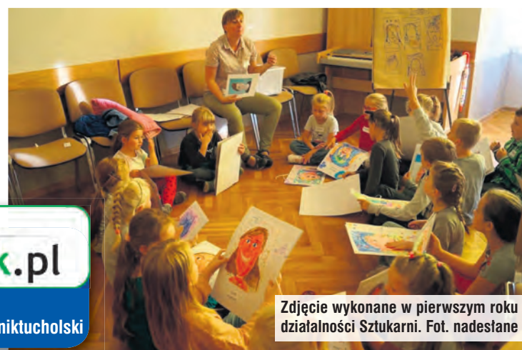
Zdjęcie wykonane w pierwszym roku działalności Sztukarni.

więcej zdjęć na tygodnik.pl filmy na facebook.com/tygodniktucholski