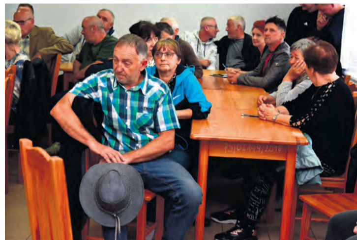
W murach świetlicy pojawiło się ponad 25 proc. mieszkańców uprawnionych do głosowania. W wyborach oddano wyłącznie głosy ważne.