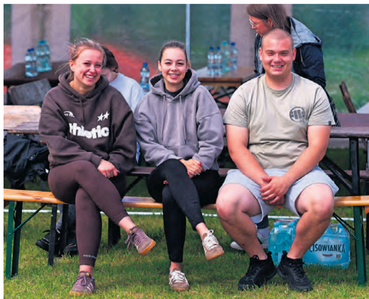
Dobre humory dominowały wśród wszystkich uczestników Dnia Strażaka w Stobnie.