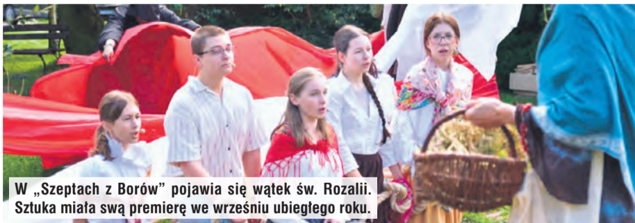
W „Szeptach z Borów” pojawia się wątek św. Rozalii. Sztuka miała swą premierę we wrześniu ubiegłego roku.

GOK w Gostycynie zaprasza mieszkańców oraz gości na wyjątkowe wydarzenie plenerowe pod nazwą „Misterium Nocy Świętojańskiej”.