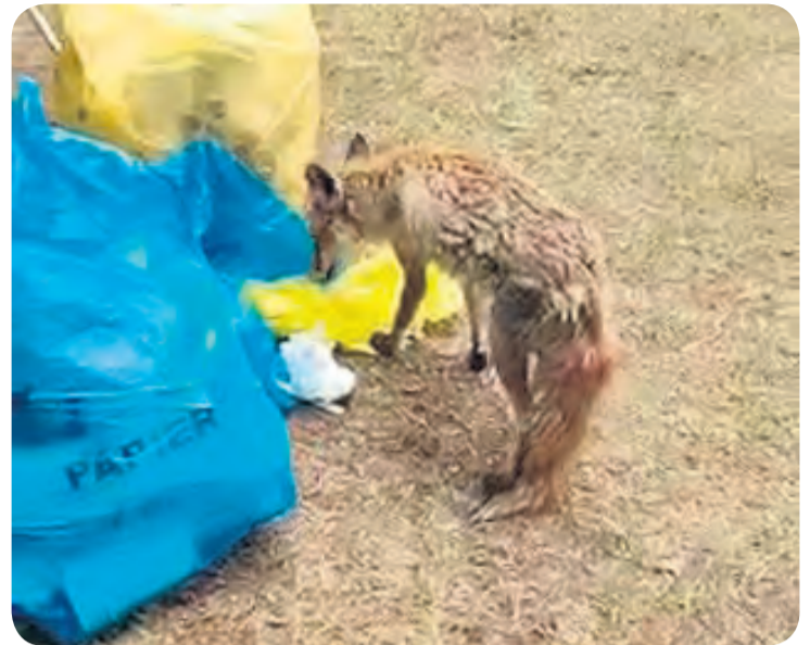
Kadr udostępniony przez Czytelniczkę. Domownicy obawiali się zachowania tego lisa i poszukiwali pomocy.

W art. 11. Ustawy o ochronie zwierząt, uzupełnionym odpowiednim rozporządzeniem, czytamy tylko o zwierzętach domowych lub gospodarskich. Do tych żyjących dziko stosuje się przepisy Prawa Łowieckiego, które w art. 2. mówi, że: „zwierzęta łowne w stanie wolnym, jako dobro