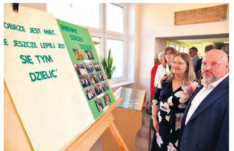
Goście mieli okazję obejrzeć kącik pamięci poświęcony patronowi placówki. Zobaczyć można w nim cytaty księdza, pamiątki.