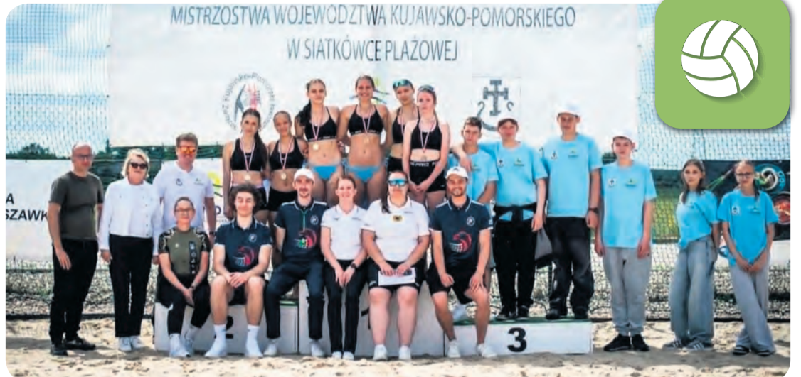
Tucholanki z prawej strony w najwyższym rzędzie.

W kolejnym etapie rozgrywek nieco problemów Tucholanki miały z Bydgoszczankami, ale udało się wygrać po tie-breaku. Piąty mecz był już półfinałem i tu Borowiaczki nie miały szczęścia – trafiły na trudne rywalki z pierwszego meczu. Dziewczęta z Jokera Świecie znów okazały się lepsze i wygrały wejście do finału w dwóch setach. Później zostały mistrzy-