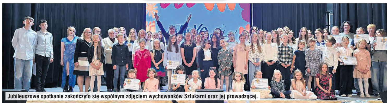
Jubileuszowe spotkanie zakończyło się wspólnym zdjęciem wychowanków Sztukarni oraz jej prowadzącej.