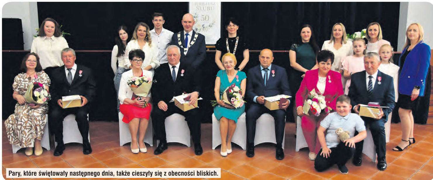
Pary, które świętowały następnego dnia, także cieszyły się z obecności bliskich.