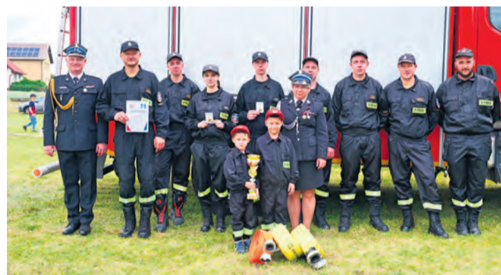
Jednostka z Raciaża wygrała zawody gminne dzięki bardzo udanej pierwszej serii.