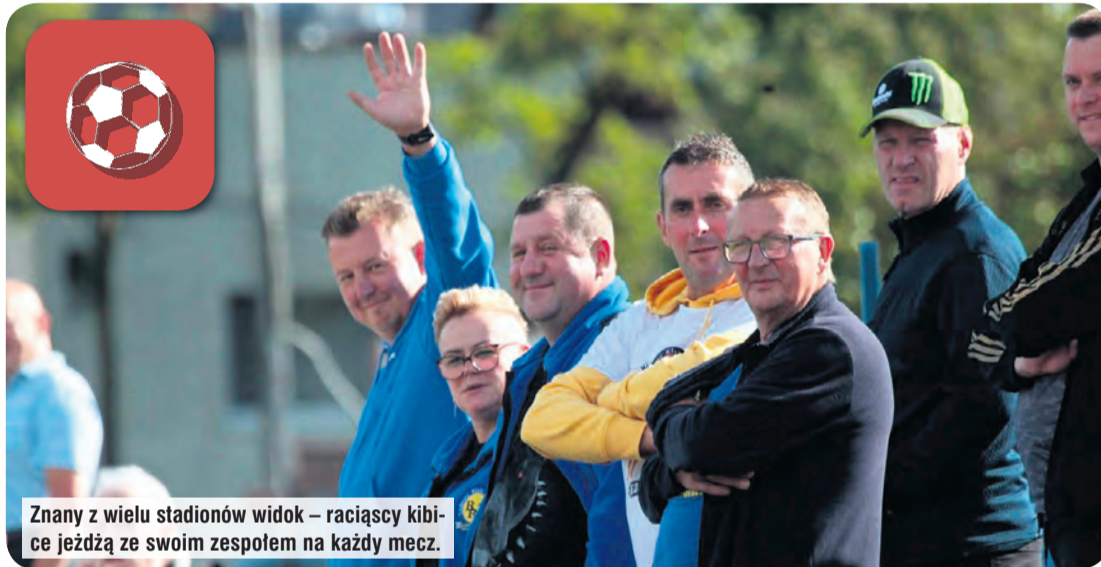
Znany z wielu stadionów widok – raciąscy kibice jeżdżą ze swoim zespołem na każdy mecz.

Jarosław Kania, fot. Dariusz Stoński Photography