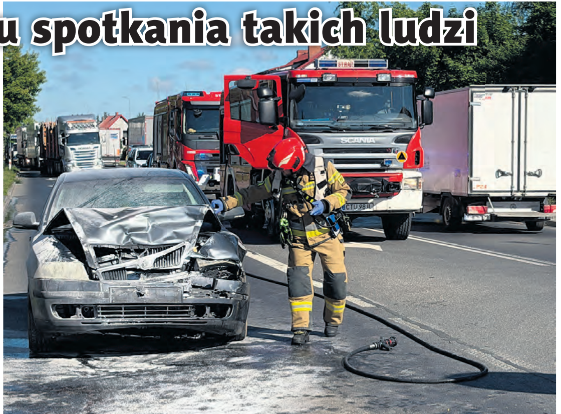
Akcja strażaków na ul. Warszawskiej. Jako pierwsi do gaszenia płomieni pod maską Skody ruszyli świadkowie. Skuteczny był zwłaszcza jeden z nich, dzięki któremu pożar się nie rozwinął.

– Policjanci ustalili, że 69-letni kierowca Skody nie zachował bezpiecznego odstępu od poprzedzającego go auta marki BMW i uderzył w jego tył. Pojazd marki BMW kierowała 50-letnia kobieta [pow. chojnicki-red.]. Nikt z uczestników zdarzenia nie doznał poważniejszych