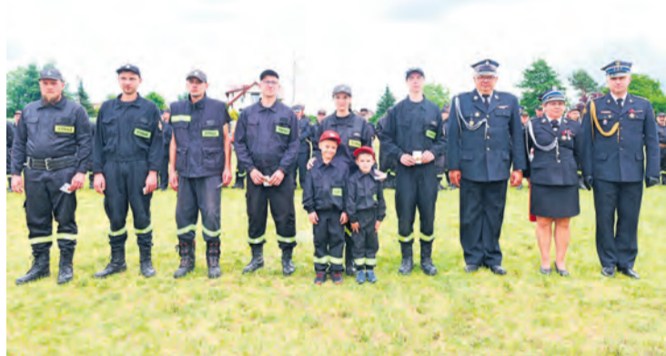
Druhowie i drużna z odznaką „Strażak Wzorowy”.