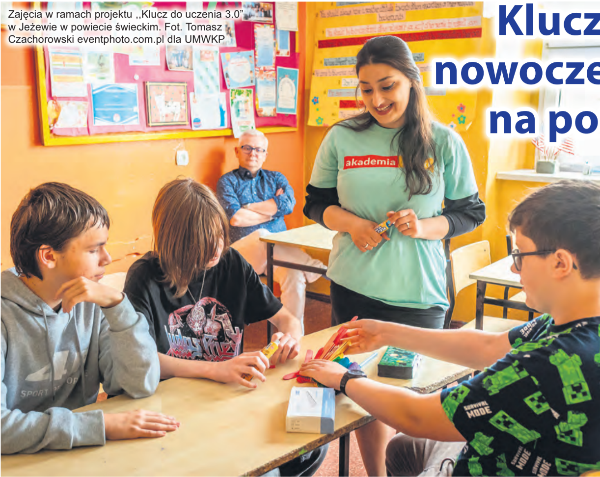
Zajęcia w ramach projektu „Klucz do uczenia 3.0” w Jeżewie w powiecie świeckim.