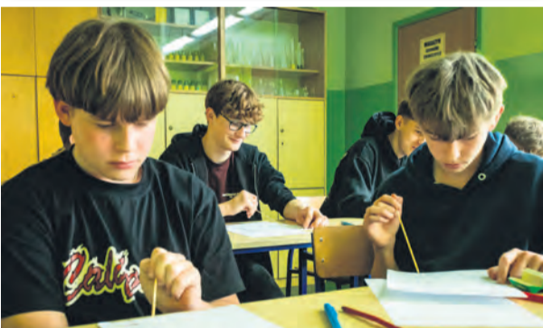
Zajęcia w ramach projektu „Klucz do uczenia 3.0” w Jeżewie w powiecie świeckim.

– „Klucz do uczenia 3.0” to projekt, który pomaga uczniom rozwijać potencjał, budować pewność siebie i przygotowywać się do dalszej edukacji oraz wyzwań współczesnego świata.