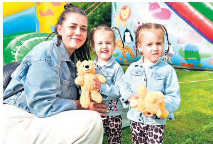
Dzieci, które uczestniczyły w sobotnim wydarzeniu, bawiły się znakomicie. Czekają na nie pluszowe misie oraz dmuchane zamki.