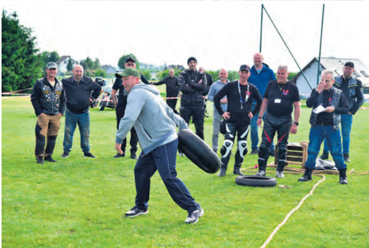
Konkursy cieszyły się dużym zainteresowaniem, a chętnych do udziału nie brakowało.