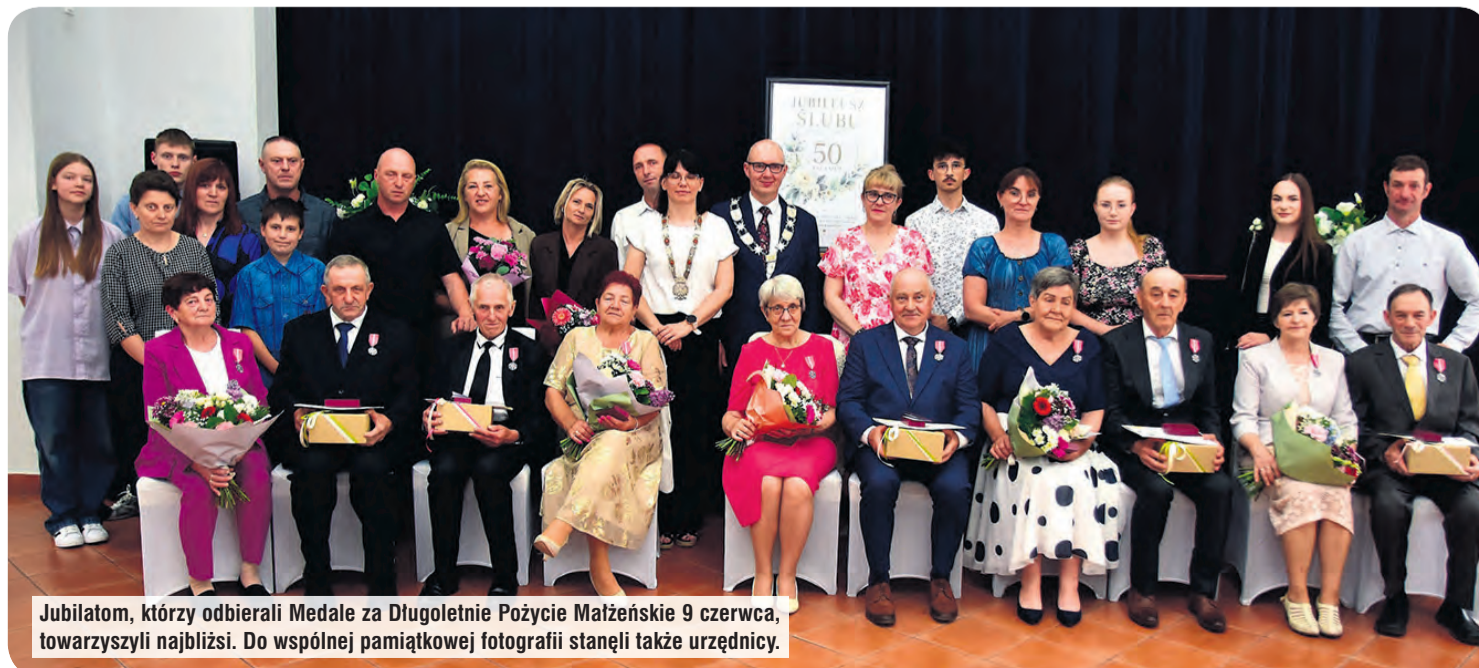
Jubilatom, którzy odbierali Medale za Długoletnie Pożycie Małżeńskie 9 czerwca, towarzyszyli najbliżsi. Do wspólnej pamiątkowej fotografii stanęli także urzędnicy.