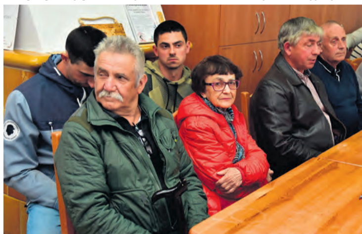
Zebranie wyborcze cieszyło się sporym zainteresowaniem mieszkańców.