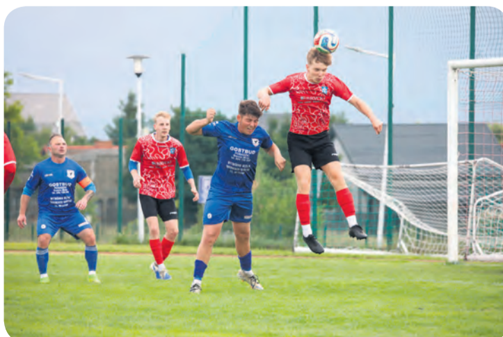
Końcówka meczu Myśliwca Gostycyn to huraganowy atak na bramkę Kamionki.