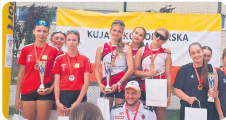
Podium wojewódzkiej Licealiady. Z lewej strony Tucholanki.

niami województwa. Tucholankom pozostał finał pocieszenia – mecz o trzecią lokatę. Tu już czekały przeciwniczki z Grudziądza.