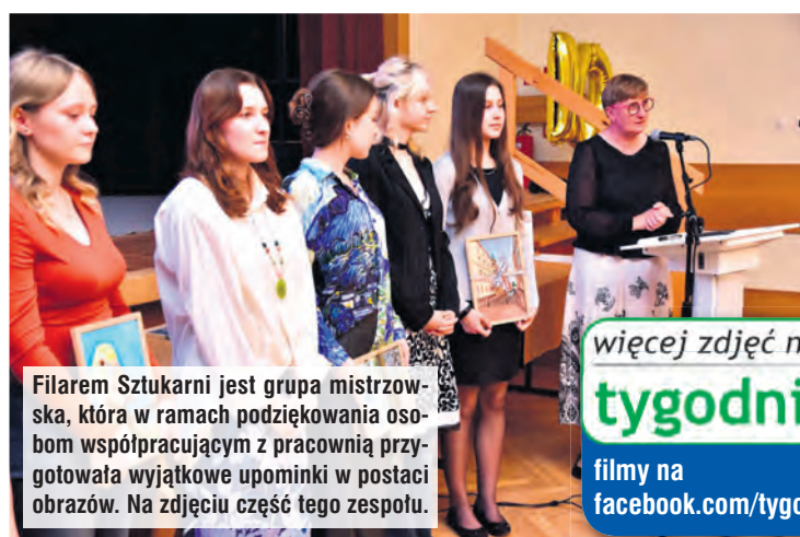
Filarem Sztukarni jest grupa mistrzowska, która w ramach podziękowania osobom współpracującym z pracownią przygotowała wyjątkowe upominki w postaci obrazów. Na zdjęciu część tego zespołu.

więcej zdjęć na tygodnik.pl filmy na facebook.com/tygodniktucholski