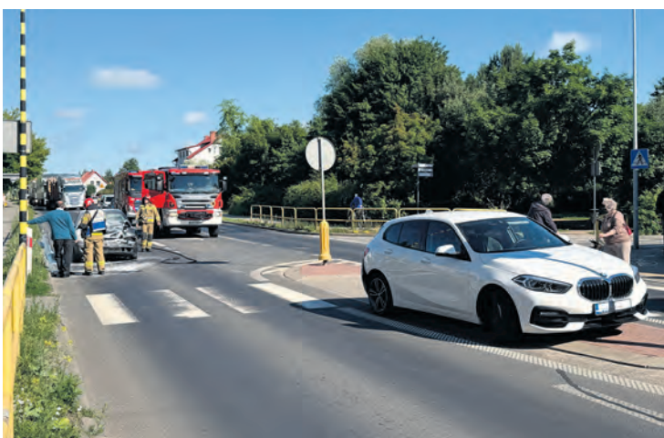
69-letni kierowca Skody nie zachował bezpiecznego odstępu od poprzedzającego go auta marki BMW i uderzył w jego tył. To był początek długiego dnia: dziadków i wnuczki, którzy dopiero po południu autem zastępczym mogli wrócić do domu.

Piotr Paterski, Anna Lipska, fot. Piotr Paterski