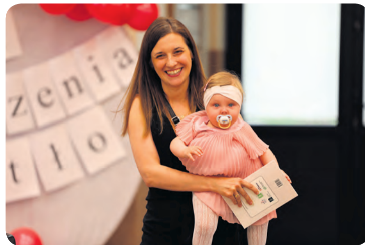
Pamiątkowe medale odbierały nawet dwa pokolenia.