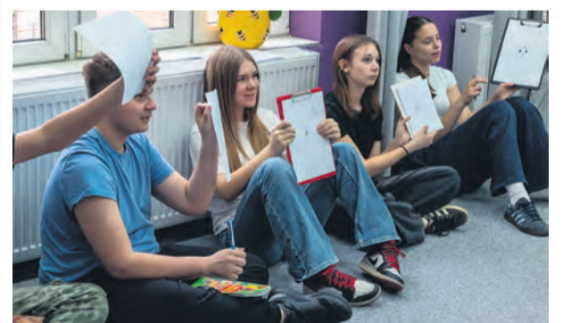
Zajęcia w ramach projektu „Klucz do uczenia 3.0” w Toruniu