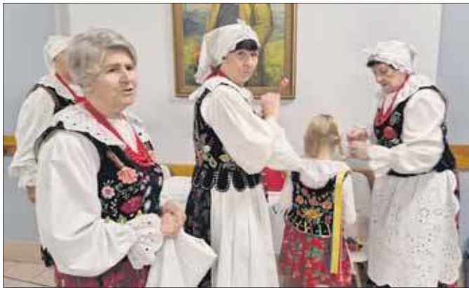
Dąbrowianki w trakcie przygotowań do występu