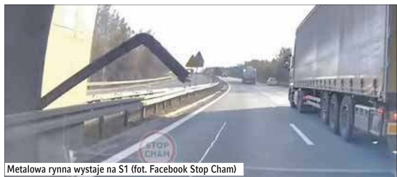
Metalowa rynnę wystaje na S1

Kierowca przejeżdżający drogą S1 wykazał się niezwykłym refleksem i cudem uniknął zderzenia z metalową rynną, która wystawała na lewy pas jezdni. Nagranie z tego niebezpiecznego zdarzenia na drodze w Jaworznie zostało opublikowane na stronie Stop Chama. cd. na str. 2