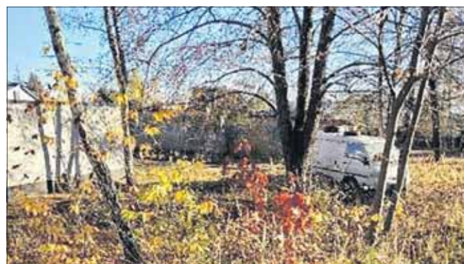
Porzucony samochód przy ulicy Piaskowej. Zdjęcie nadesłane przez mieszkańca

Z pytaniami w tej sprawie zwróciliśmy się do Straży Miejskiej w Jaworznie. Zapytaliśmy, dlaczego pojazd nie został do tej pory usunięty a także czy przyczyną braku interwencji może być to, że samochód znajduje się na terenie prywatnym.