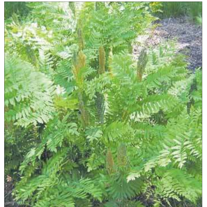
Osmunda regalis, czyli długosz królewski (wikipedia)

Nazwa własna Długoszyn ma najprawdopodobniej formę dzierzawczo-patronomiczną, pochodząca od imienia własnego Długosz. Rzadko podkreśla się wszakże to, że określenie „Długosz” jest w rzeczy samej zdrobnieniem imienia Długomił, w czasach słowiańskich bardzo popularnego.