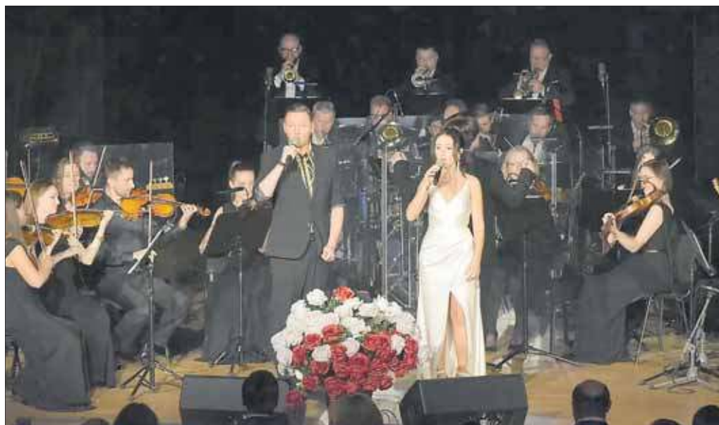
fot: Koncert „W starym kinie”

Ponoć lubimy to, co znany, wedle inż. Mamonia z „Rejsu”. Nic więc dziwnego, że na koncert „W starym kinie” bilety wyprzedano co do jednego. Koncert na scenie MDK zagrali wspólnie Orkiestra Kameralna Archetti i Orkiestra eM Band, poprowadził dyr. Maciej Szczurowski.