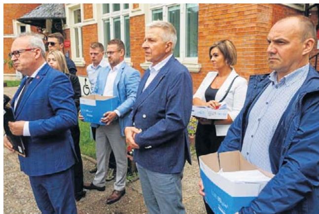
- Przywieźliśmy ze sobą ponad 7 tysięcy podpisów - mówią władze i mieszkańcy Augustowa, którzy wczoraj przyjechali do RDOŚ

stów ponownie stanął przed wizją boju o drogę. Tym razem jednak od wschodu miasta i z innym nastawieniem. O ile przed dwoma dekadami mieszkańcy byli za jak najszybszym wyprowadzeniem tirów z centrum, tak teraz sprzeciwiają się budowie obwodnicy po wschodniej stronie miasta. Ma ona połączyć DK8 z DK16 prowadzącą do przejścia granicznego w Ogrodnikach. Od ponad 20 lat szlak wiodący od przejścia granicznego z Litwą do Augustowa jest wolny o ciężkiego ruchu tranzytowego. Tyle że ze względów geopolitycznych Polska musi dostosować nośność drogi do wymogów wojskowych NATO. W konsekwencji oznacza to powrót wielkich ciężarówek na trasę aż do ronda Marconiego tuż za kanałem Bystrym w mieście i dalej do wylotu na Białystok i Łomżę. By uniknąć takiego scenariusza, Generalna Dyrekcja