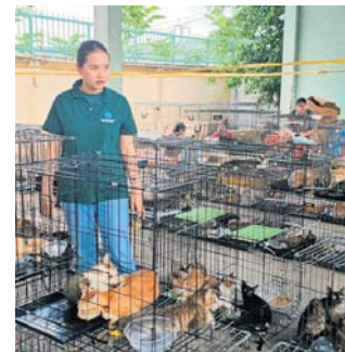
Ponad 40 porwanych kotów wróciło do właścicieli po tym, jak wietnamska policja rozbiła gang złodziei kotów

Około 40 kotów, które zostały skradzione, oddano właścicielom. Znalezione też 80 zamrożonych martwych kotów zwierząt. Organizacja obrony praw zwierząt Humane World for Animals zwróciła uwagę na ten problem,