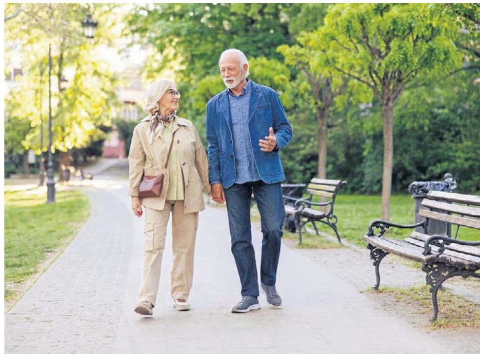
Mikroklimat Nałęczowa sprzyja obniżeniu ciśnienia i regeneracji serca

Sanatorium nie zastępuje leczenia specjalistycznego, ale jest jego ważnym uzupełnieniem. Dobrze dobrany ośrodek może poprawić wydolność organizmu, obniżyć ryzyko powikłań i nauczyć pacjenta życia z chorobą. Najważniejsze jest dopasowanie miejsca do konkretnej diagnozy i możliwości organizmu. W przypadku chorób serca właściwy wybór uzdrowska często decyduje o tym, czy wyjazd będzie tylko wypoczynkiem, czy realną terapią.