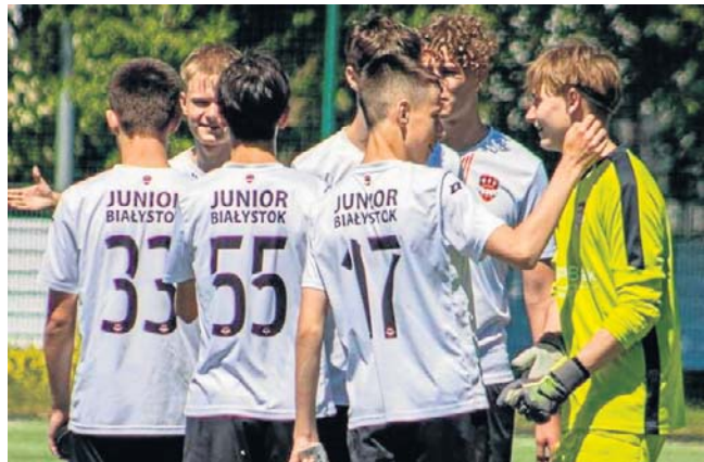
Zespół Akademii Piłkarskiej Junior Białostok wygrał ligę wojewódzką i w dwumeczu powalczy z Górnikiem Łęczna o prawo gry w Centralnej Lidze Juniorów U-17

Pierwszy mecz AP Junior - Górnik rozpocznie się w sobotę - 20 czerwca, o godz. 17, na stadionie przy ul. Elewatorskiej 4. Rewanż tydzień później w Łęcznej. ©