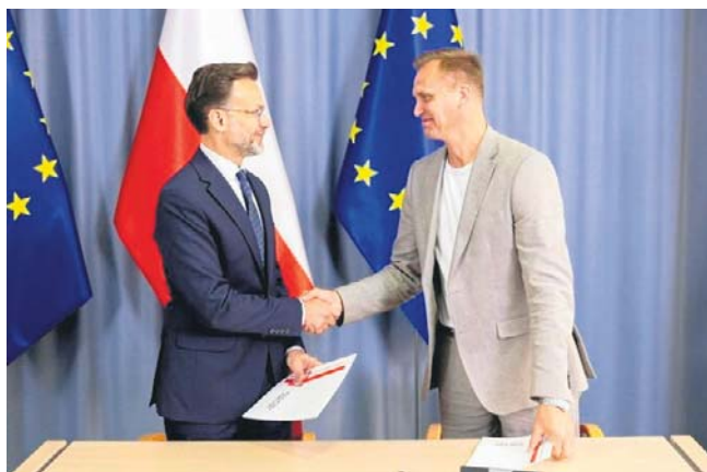
Wojewoda Jacek Brzozowski (z lewej) podpisał wczoraj 11 umów z przedstawicielami 10 samorządów

W puli pierwszych 11 umów największe dofinansowanie otrzymała gmina Juchnowiec Kościelny - prawie 4,5 mln zł