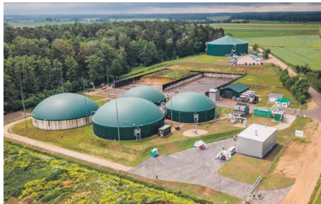
Biogazownia w Dzierżkach

- Bardzo ważną była dla nas dobra współpraca z lokalnymi władzami i społecz-