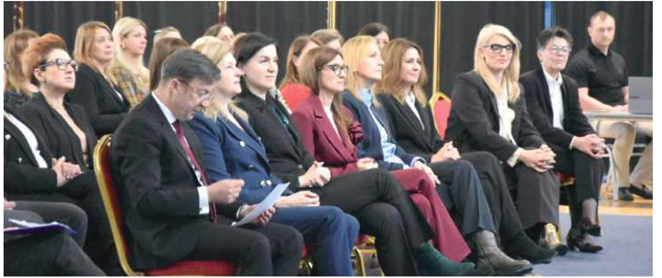
W spotkaniu brało udział aż 200 nauczycieli i dyrektorów