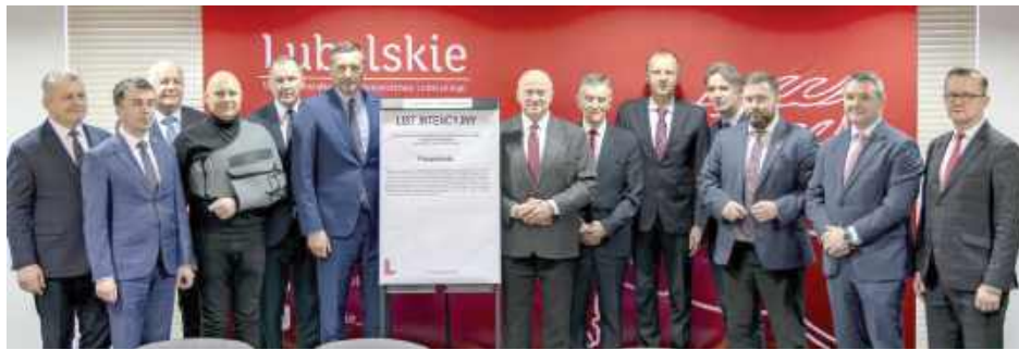
Do inicjatywy przystąpili przedstawiciele województwa lubelskiego, gmin uzdrowiskowych oraz aspirujących do tego statusu, a także powiatów, na terenie których te samorządy się znajdują