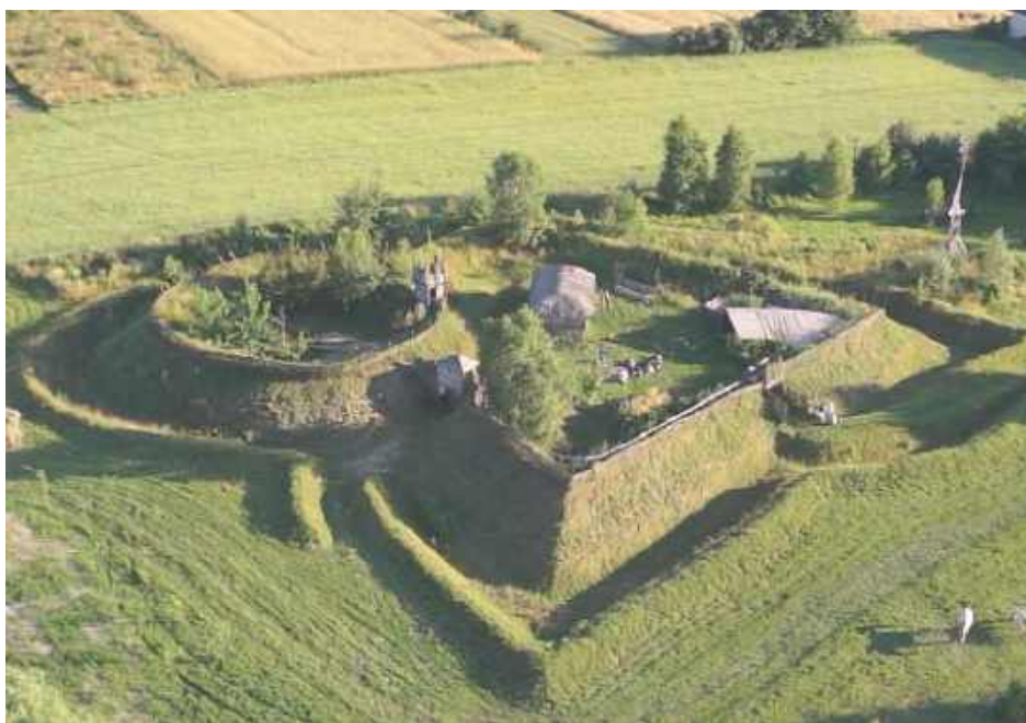
Słowiański Gród nie jest zwykłym skansenem. To przestrzeń, w której historia Słowian ożywała dzięki warsztatom, opowieściom o mitologii i pokazom dawnego rzemiosła. Obiekt wypracował sobie solidną markę w branży turystycznej, oferując spokój, bliskość lasu oraz unikalny klimat sprzyjający edukacji historycznej