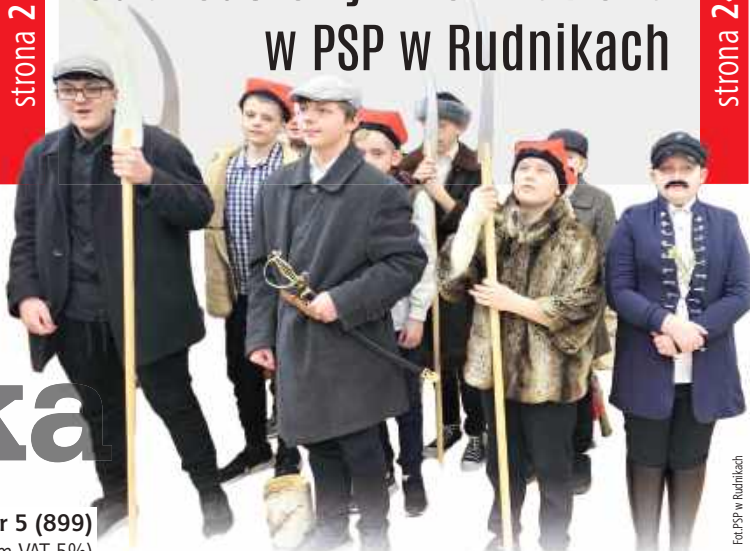
Imię Karola Krysińskiego zostało nadane szkole w 2006 roku

3 - 9 lutego 2026 r. nr 5 (899) Cena 4,99 zł (w tym VAT 5%)