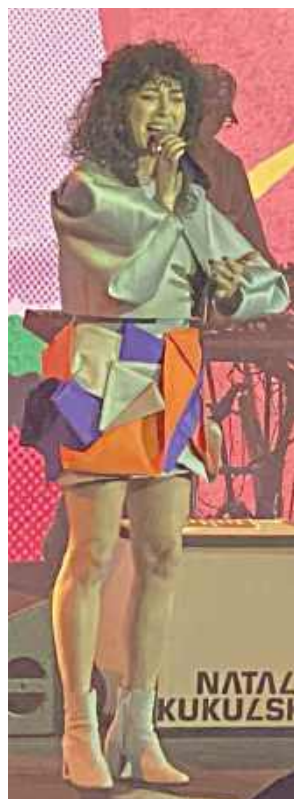
Występ Natalii Kukulskiej, która oświadczyła, że niedługo obchodzi pięćdziesiątkę, przyjęto gromkimi brawami