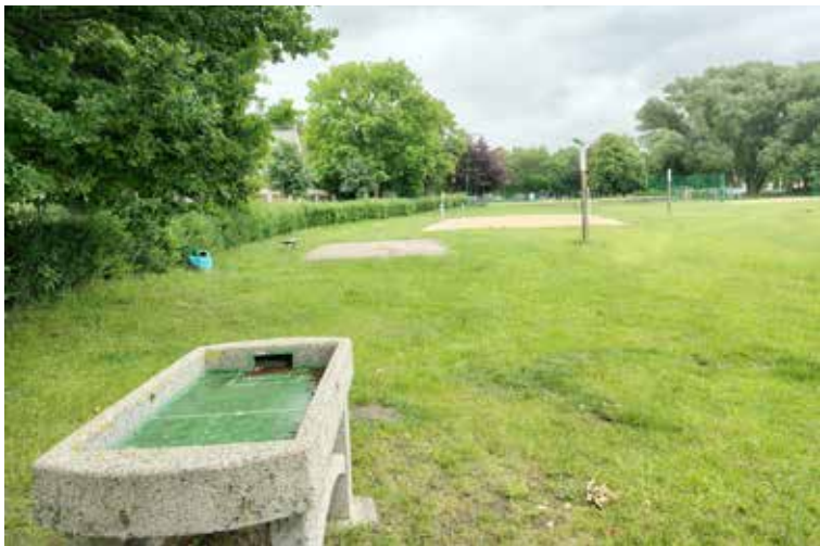
Oferta dla mieszkańców na plaży coraz skromniejsza

porządkowe na terenie miejskiego miejsca rekreacji to najwidoczniej koszenie trawy i opróżnianie koszy na śmieci, choć z tym ostatnim i tak bywa momentami ciężko.