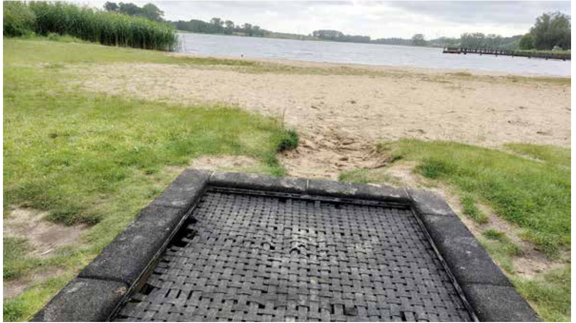
Widoczne uszkodzenia przy trampolinie