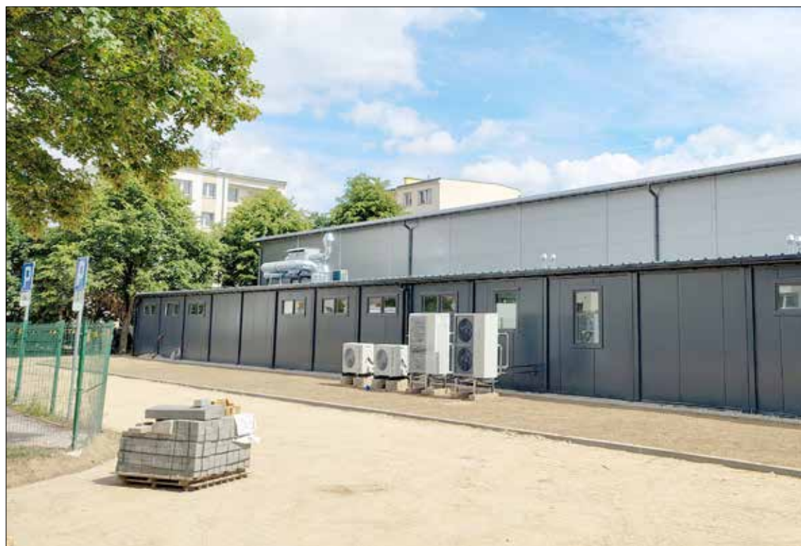
Stodoła gotowa na żniwa - trwają próby wialni wyposażonej w nowoczesne wentylatory