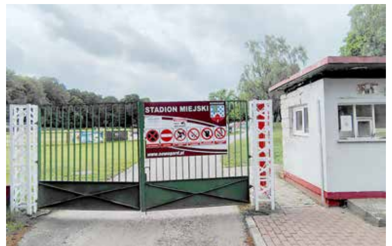
Numer do opiekuna obiektu widoczny jest na bramie