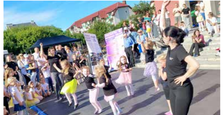
Najmłodsza grupa Szkoły Tańca Grace