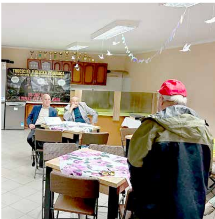
Spotkanie w Sikorkach

Oglądamy zdjęcia ze spotkań, które inwestorzy budowy obiektów przemysłowych na terenie byłej jednostki wojskowej w Glicku organizują w poszczególnych sołectwach leżących wokół tegoż byłego obiektu — notabene mocno kiedyś militarnego i zarazem mało ekologicznego. Świadomie używamy enigmatycznego określenia budowy obiektów przemysłowych , ponieważ coraz mniej rozumiemy, co tam ma być, a czego nie ma być; kto jest za, a kto przeciw; a zwłaszcza dlaczego jest za i dlaczego jest przeciw? Nie wiadomo także (w sensie intelektualnym), o czym rozmawiają obecni na tychże wiecach — są transparenty, więc wiecie — obecni tam zarówno na widowni, jak i za stołami. Coraz mniej rozumiemy, ponieważ przekaz medialno-społecznościowy (dominujący) pełen jest przymiotników, a rzeczowników, czyli rzeczowości, jak na lekarstwo (oj, niektórym przydałoby się ono pilnie) — zatem bełkot jest z każdej strony stołów (a może ringu), a sensu nie widać. Sądząc po ujęciach z poszczególnych świetlic, frekwencja licha: mieszkańców poszczególnych wsi policzyć można na palcach jednej, w porywach dwóch rąk, a większość stanowią albo „stali bywalcy”, czyli głównie wyznawcy ekologizmu totalnego — niektórzy dają nawet przykład osobisty życia w zgodzie z naturą (co na ogół jednocześnie oznacza: wbrew kulturze) — albo mieszkańcy Nowogardu żywnie zainteresowani demonstrowaniem „bezkompromisowego oddania sprawom publicznym”. Z takiej mieszanki z zasady chleba nie będzie, a więc mieszkańcy