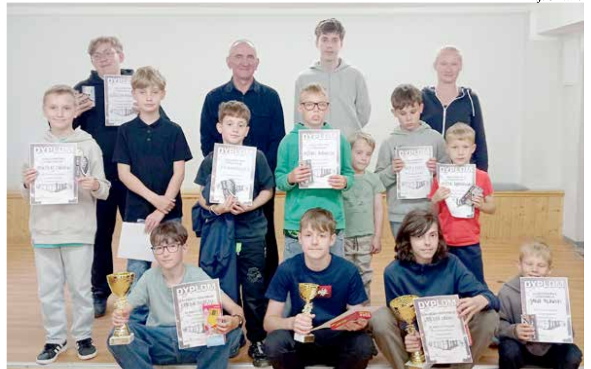
Uczestnicy turnieju wraz z organizatorami

wielkim zaciekawieniem poznawały nowe smaki i zapachy, rozwijając swoją ciekawość poznawczą. Wspólne kisznie w plenerze stymulowało wielozmysłowe poznawanie świata oraz kształtowało samodzielność i umiejętności praktyczne.