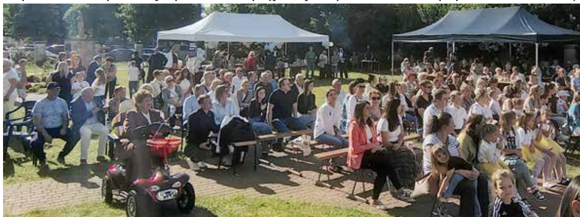
Piękna pogoda zachęcała do udziału