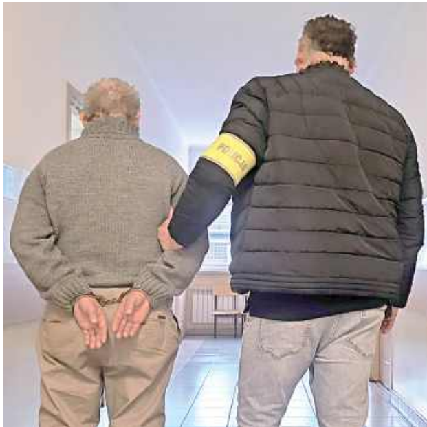
Duchowny niezwłocznie udał się do pomieszczenia, w którym przebywał mężczyzna. Ten tłumaczył, że nie miał zamiaru kraść, a do środka wszedł z powodu głodu

Duchowny niezwłocznie udał się do pomieszczenia, w którym przebywał mężczyzna. Ten tłumaczył, że nie miał