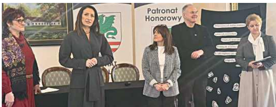
20 lutego w dworku Powiatowego Centrum Kultury i Promocji w Miętnej odbyło się II Dyktando Powiatowe

wie szkół ponadpodstawowych z całego powiatu. Po sprawdzeniu prac wyłoniono laureatów tegorocznej edycji: