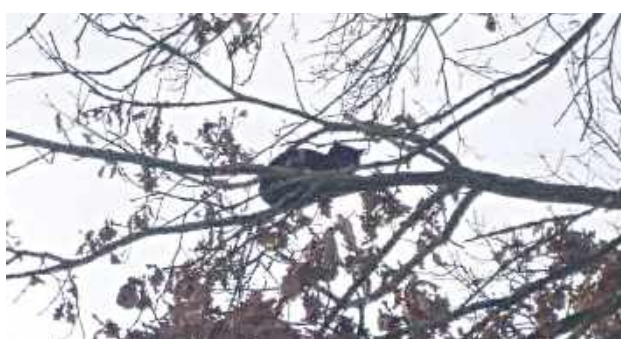
Ochotnicza Straż Pożarna w Wojnowie ponownie wykazała się sprawnością i profesjonalizmem podczas nietypowej interwencji w swojej miejscowości

Ochotnicza Straż Pożarna w Wojnowie ponownie wykazała się sprawnością i profesjonalizmem podczas nietypowej interwencji w swojej miejscowości.