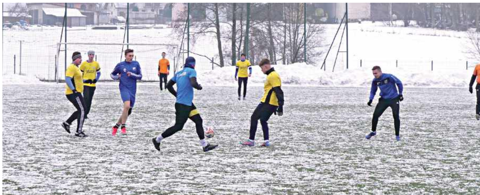
Do przerwy wynik oscylował w granicy normalnych. Po przerwie to był już pogrom. Sęp Żelechów wygrał z KS Puznówka 11:0

Do przerwy wynik oscylował w granicy normalnych. Po przerwie to był już pogrom. Sęp Żelechów wygrał z KS Puznówka 11:0.