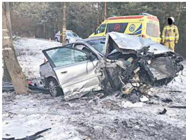
Do szpitala trafił zarówno kierowca, jak i 20-letni pasażer pojazdu

Do zdarzenia doszło w sobotę, 21 lutego przed godziną 10. Do Komendy Powiatowej Policji w Garwolinie wpłynęło zgłoszenie o samochodzie osobowym, który uderzył w drze-