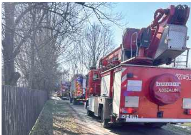
Trzy zwierzęta pozostały w środku objętego ogniem domu

W czwartek, 26 lutego w Wygodzie doszło do pożaru drewnianego domu jednorodzinnego. Z budynku przed przybyciem służb ewakuowano jednego mieszkańca oraz 26 psów. Trzy zwierzęta pozostały w środku objętego ogniem domu. Na miejscu przez ponad dwie godziny pracowało sześć zastępów straży pożarnej.