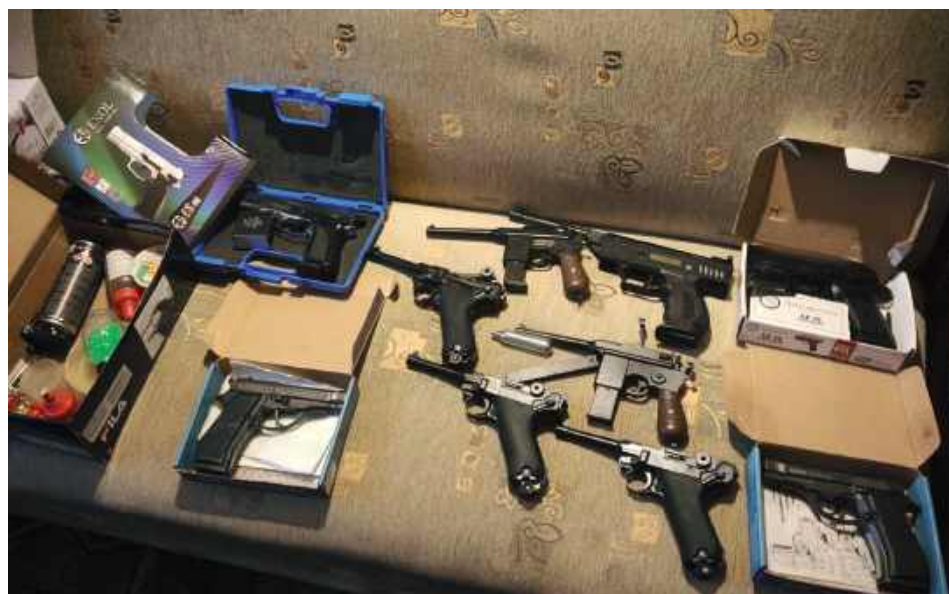
Mężczyzna oświadczył, że broń była jego własnością i stanowiła kolekcję, ponieważ od lat interesuje się tematyką militarną

Z relacji zgłaszających wynikało, że strzały oddawano od około roku, a 13 lutego