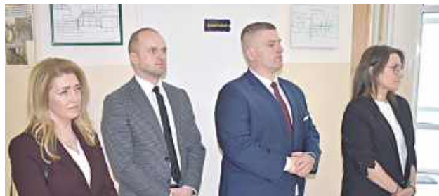
Projekt został zrealizowany dzięki dotacji celowej z Mazowieckiego Urzędu Wojewódzkiego w Warszawie w ramach Wojewódzkiego Programu Ochrony Ludności i Obrony Cywilnej na rok 2025. Wartość całego zadania oraz uzyskanego dofinansowania wyniosła 242 667 zł

20 lutego w Zespole Szkół nr 1 w Łaskarzewie odbyło się uroczyste przekazanie sprzętu ratowniczego oraz pomocy dydaktycznych zakupionych ze środków na obronę cywilną.