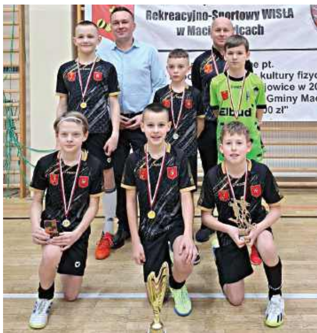
Wisła Maciejowice czerwoni