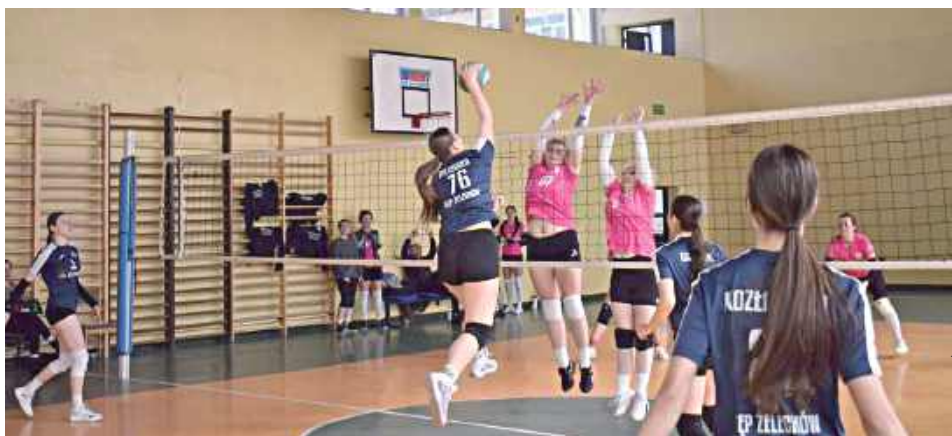
Zawodniczki Sępa Żelechów dopięły swego. Po świetnych występach znalazły się w najlepszej czwórce turnieju ALS

Zawodniczki Sępa Żelechów dopięły swego. Po świetnych występach znalazły się w najlepszej czwórce turnieju ALS.