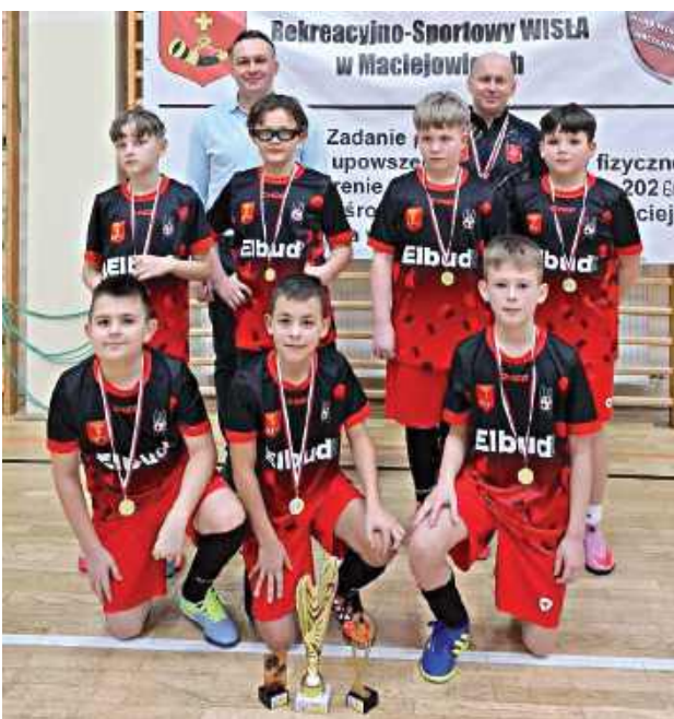
Wisła Maciejowice czarni