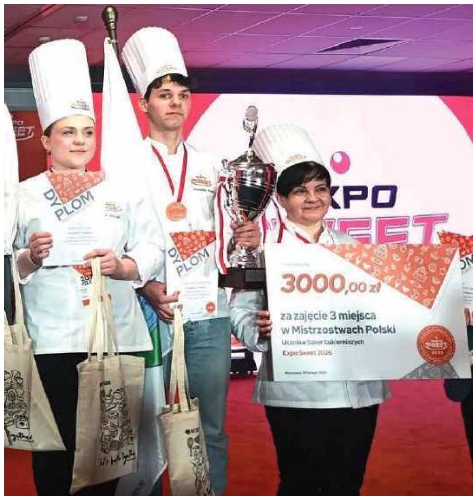
Zespół Szkół Ponadpodstawowych w Żelechowie od lat prowadzi kształcenie w zawodach branży gastronomicznej i spożywczej. Placówka uczestniczy w projektach edukacyjnych oraz współpracuje z zakładami pracy, umożliwiając uczniom odbywanie praktyk zawodowych

Mistrzostwa Polski Uczniów Szkół Cukierniczych organizowane są cyklicznie w ramach targów Expo Sweet. Wydarzenie łączy część wystawienniczą z programem konkursowym i szkoleniowym. W trakcie targów prezentowane są nowe technologie produkcji, surowce oraz rozwiązania dla branży gastronomicznej. Konkurs uczniowski ma na celu weryfikację umiejętności praktycznych oraz promowanie kształcenia zawodowego.