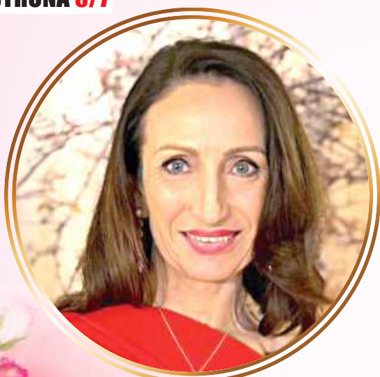
Iwona Kurowska starosta powiatu garwolińskiego