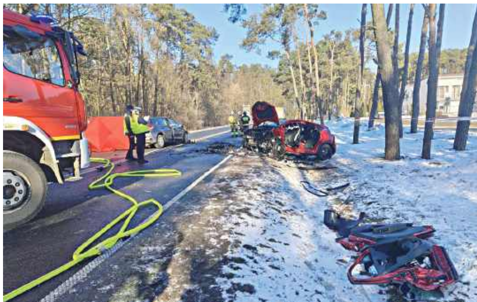
Komenda Miejska Policji w Siedlcach apeluje do wszystkich uczestników ruchu drogowego o zachowanie ostrożności, przestrzeganie przepisów oraz rozsądek

w Siedlcach apeluje do wszystkich uczestników ruchu drogowego o zachowanie ostrożności, przestrzeganie przepisów oraz rozsądek. Przypomina, że