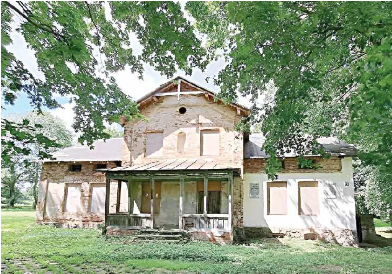
Dworek w Szczukach, w którym jako guwernantka pracowała Maria Skłodowska-Curie