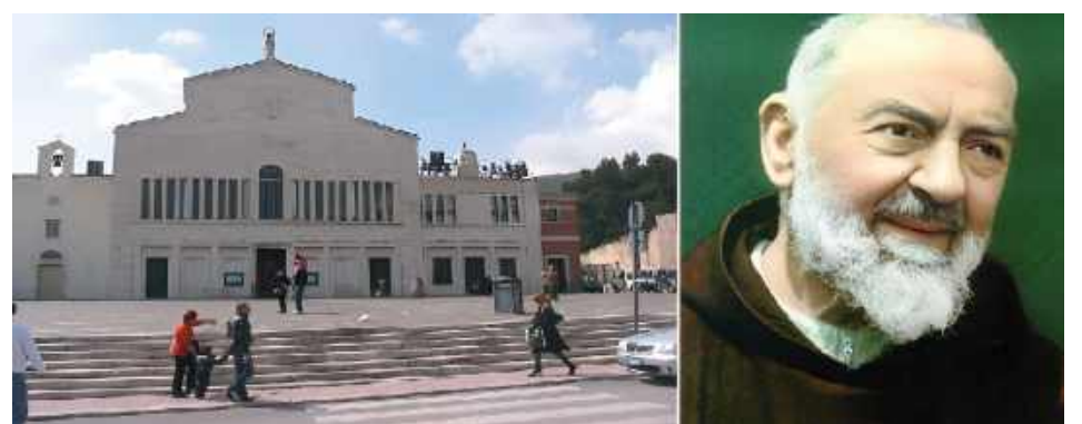
Pielgrzymi odwiedzą m.in. San Giovanni Rotondo - miejsce życia Świętego Ojca Pio