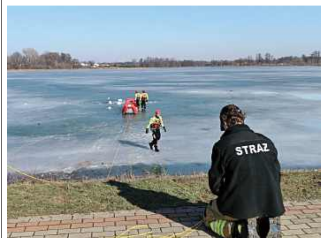
Ratownictwo wodno-lodowe pozostaje jednym z bardziej wymagających obszarów działań jednostek ochrony przeciwpożarowej