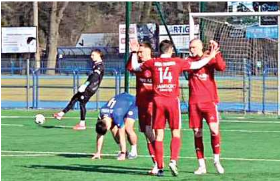
Mieli zacząć już w następny weekend. Do tego jednak nie dojdzie, ale Wilga Garwolin pokazuje, że jest gotowa do walki o utrzymanie