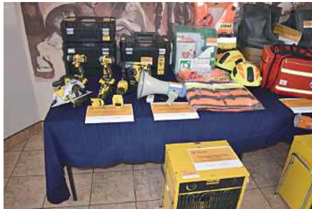
W ramach projektu zakupiono specjalistyczny sprzęt ratowniczy i logistyczny, który trafił do jednostki OSP oraz do zasobów miejskich