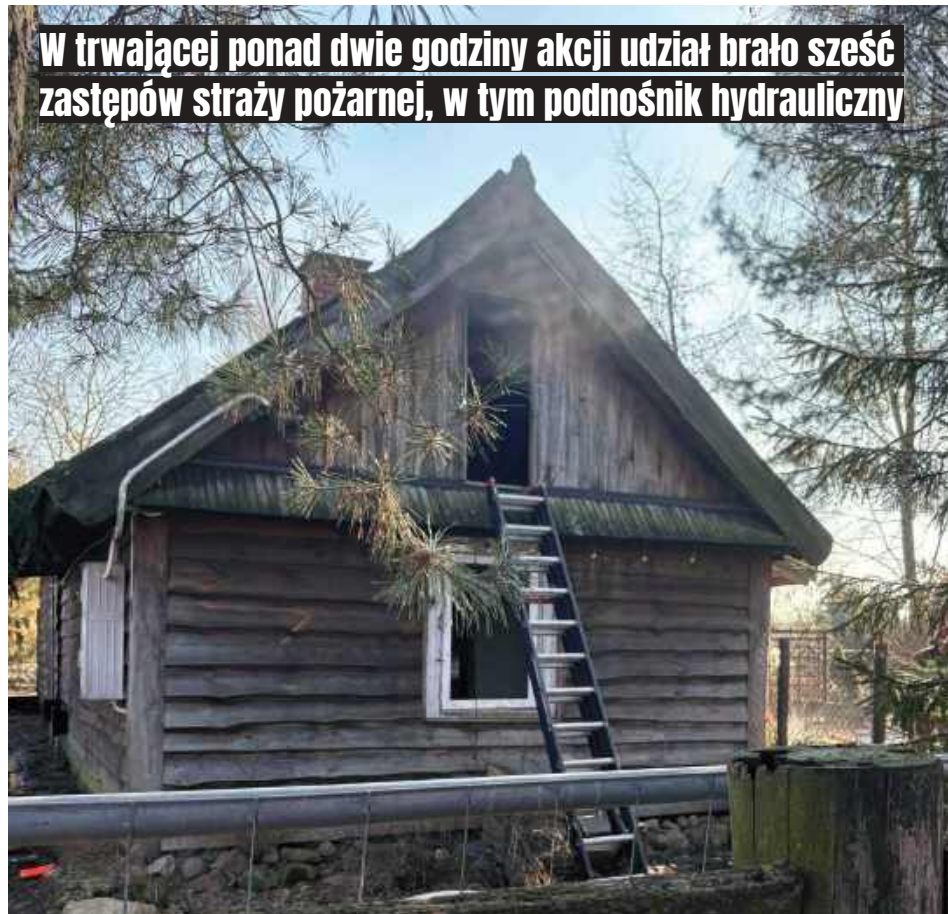
Ogień bardzo szybko objął drewnianą konstrukcję budynku

W trwającej ponad dwie godziny akcji udział brało sześć zastępów straży pożarnej, w tym podnośnik hydrauliczny