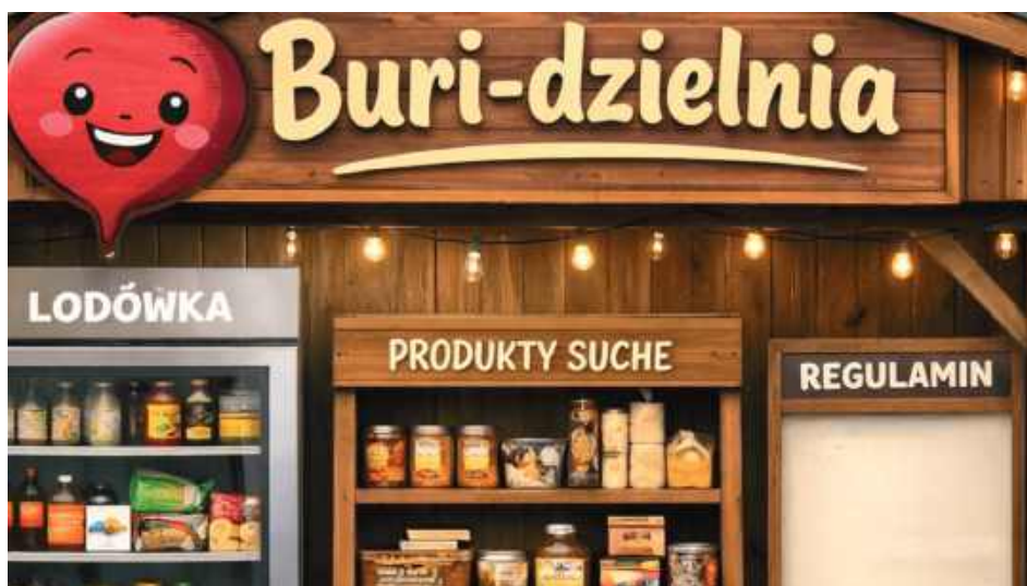
Łukasz Boratyński, lokalny przedsiębiorca i społecznik, rozpoczął zbiórkę na utworzenie jadłodzielnia pod nazwą „Buri-dzielnia”

„Buri-dzielnia” ma być ogólnodostępnym, zadaszonym i monitorowanym punktem wyposażonym w profesjonalną lodówkę i regały. Każdy będzie mógł zostawić nadwyżkę jedzenia – produkty