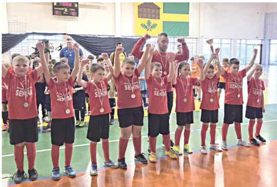
Zwycięski zespół w całym turnieju - Iskra II Pilawa

Multum goli, godziny świetnej gry i rywalizacji, a wszystko to na hali w Górninie. SPF Sabio kolejny raz pokazało, jak organizuje się turnieje.