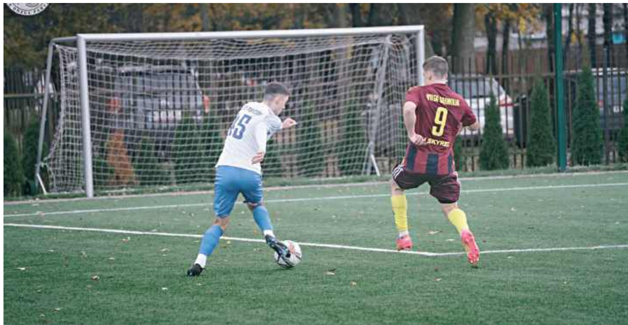
Orzeł Parysów po rewelacyjnej jesieni powrócił do treningów. Podopieczni Piotra Talara w zimie zaznali już każdego możliwego rezultatu

Lider już trenuje, co więcej, gra tak jak przyzwyczał kibiców. Trzy mecze, a w nich łącznie 22 bramki, dwanaście strzelonych, dziesięć straconych. To bilans, z którym zdecydowanie mogą utożsamić się kibice Orła Parysów. Ich zespół przyzwyczał, że na mecz nie wychodzi z pomysłem, by kurczowo bronić się pod własną bramką. W tym sezonie ten trend nieco się odwrócił. Owszem, „Paryżanie” aplikują rywalom absurdalną ilość goli, bo aż 50 w trzynastu meczach, dość powiedzieć, że o osiem więcej niż kolejny najskuteczniejszy zespół! Poprawiła się jednak również defensywa, która, wraz z Wisłą Dziecinów, jest najlepsza w lidze. Nieco inaczej wygląda to w sparingach, bo tutaj radosne strzelanie stało się znakiem rozpoznawczym „biało-niebieskich”. Jako pierwsi postrzelali z nimi zawodnicy akademii SportsMate360. Tutaj górą po dublecie Dominika