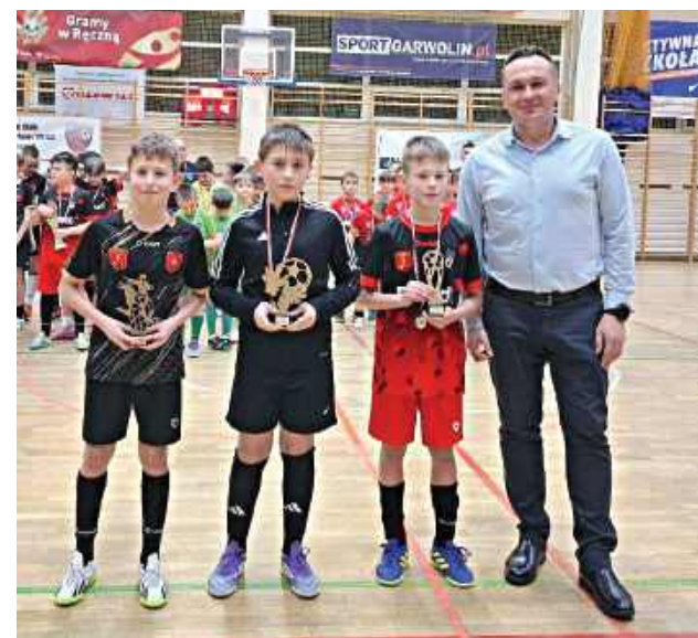
Wyróżnieni zawodnicy turnieju