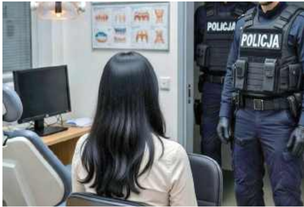
Jak ustalono, podejrzana przygotowywała dla pacjentów indywidualne plany leczenia, a następnie wprowadzała do systemu zaniżone kwoty, pozorując udzielanie rabatów

Funkcjonariusze policji mazowieckiej zatrzymali 29-letnią pracownicę gabinetu stomatologicznego podejrzaną o wielokrotne oszustwa finansowe na szkodę spółki, w której była zatrudniona. Według ustaleń śledczych kobieta manipulowała wycenami planów leczenia stomatologicznego i protetycznego, przywłaszczając różnice w płatnościach.