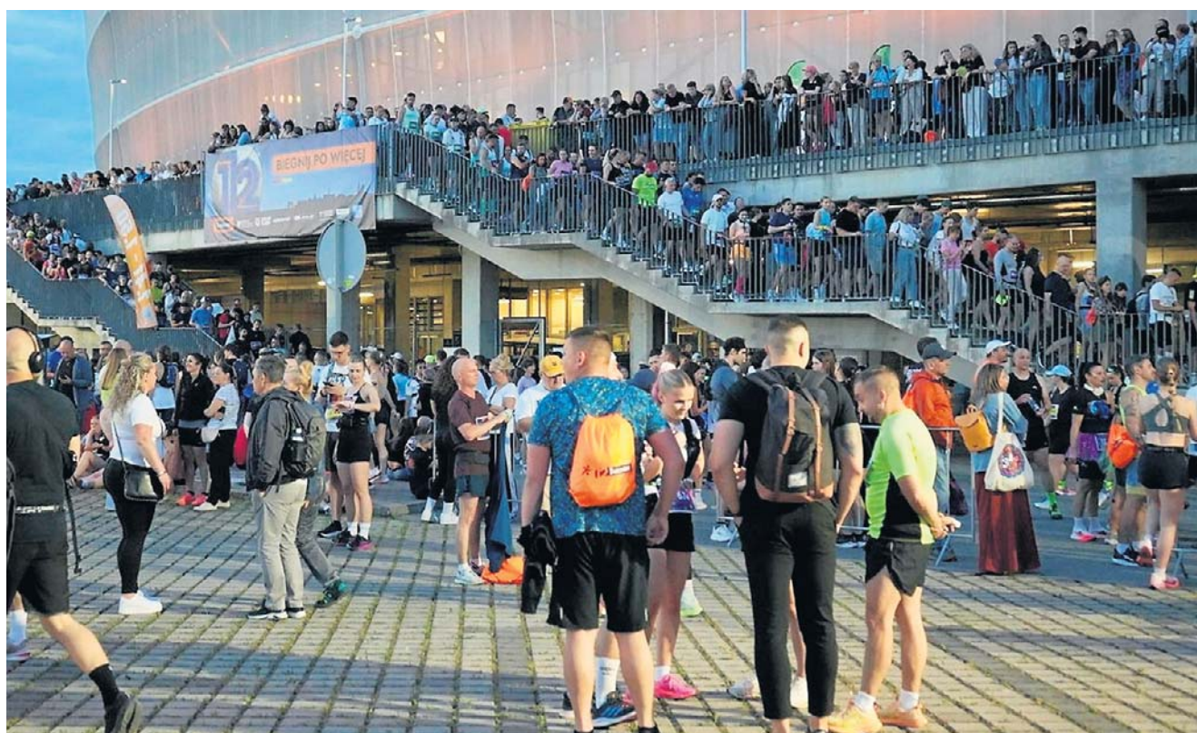
Kibice wypełnili stadion wielotysięcznym tłumem. Przez całą imprezę ulice Wrocławia rozbrzmiewały ich dopingiem.