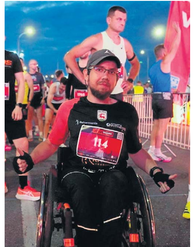
Wśród uczestników półmaroń ne zabrakło również osób niepełnosprawnych. Doskonale dały sobie radę!