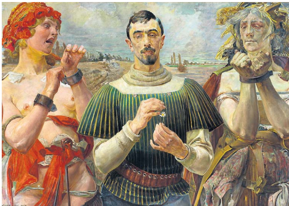
Namalowany w 1903 r. obraz jest jednym z najbardziej znanych dzieł Malczewskiego. Przedstawia Aleksandra Wielkopolskiego, wnuka carskiego namiestnika w Warszawie.

Najważniejszym z dzieł będzie „Hamlet polski”, olej Jacka Malczewskiego z 1903 r., symboliczny portret margrabiego Aleksandra Wielkopolskiego (1803-1877). Początek XX w. był dla malarza dość trudny. Liczne zgony w rodzinie, w szczególności śmierć matki skłoniły go do namalowania serii obrazów „Thanatos”. Dodatkowo w 1900 r. Mal-