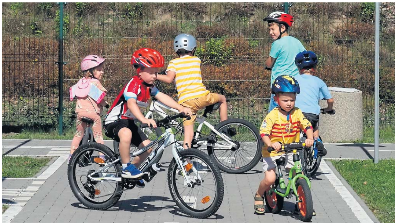
Dzieci muszą już jeździć na rowerach i hulajnogach elektrycznych w kaskach ochronnych. Równie ważna jednak – jeżeli nie ważniejsza – jest skrupulatna edukacja, związana z bezpieczeństwem ruchu drogowego.