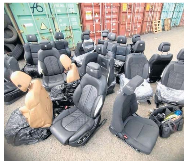
Za nabywanie, pomaganie w zbyciu lub ukrywanie rzeczy, pochodzących z przestępstwa można posiedzieć 10 lat.

Policjanci pionu kryminalnego od dłuższego czasu prowadzili działania operacyjne, mające na celu identyfikację osób, mogących mieć związek z procederem paserstwa oraz demontażu pojazdów, pochodzących z kradzieży. W toku