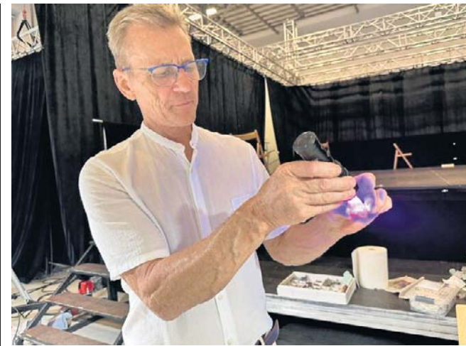
FOT. ADRIANNA SZURMAN

Jak dodaje, nie tylko on odpowie za posiadanie narkotyków. W czasie długiego weekendu policjanci zatrzymali też dwie inne osoby z narkotykami. 4 czerwca pojechali do jednego z mieszkań na Szczawienku, gdzie miały się znajdować niedozwolone substancje. Zatrzymali tam 38-letniego wałbrzyszanina, który miał przy sobie marihuanę i metamfetaminę. Potem na ulicy Niepodległości w Wałbrzychu wpadł 33-latek, który ukrywał w przenośnym głośniku srebrne zawiniątko z metamfetaminą. ©