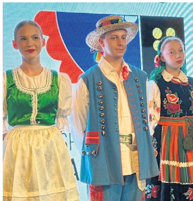
ZPiT Wałbrzych to już nie ten sam zespół, który znamy sprzed lat. To formacja, która idzie z duchem czasu.

- Od trzech lat zespół jest w strukturach Starej Kopalni. Chcę go pokazywać i promować także z innej strony. Serdecznie zachęcam do wstąpienia w szeregi zespołu. Dwa lata temu 40 osób zaśpiewało z Grubsonem „Ze gdzieś na szczycie góry, wszyscy razem spotkamy się”, później zatrzymaliśmy ruch w centrum miasta i zatańczyliśmy dla wałbrzyszan, a w tym roku chcieliśmy czegoś innego. Zespół nie miał własnego teledysku, a teraz