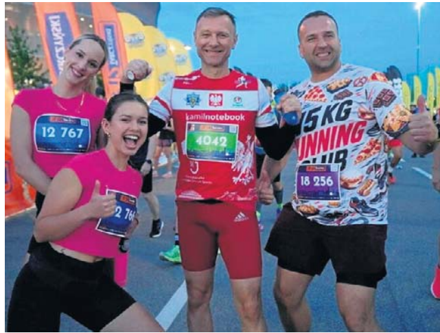
Nad przebiegiem wydarzenia czuwało blisko 1,3 tys. wolontariuszy oraz 200 pracowników scenotechniki.