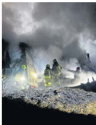
Ogień w Jarkowicach gasili strażacy z kilku gmin.