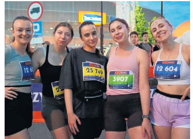
Na trasie pojawiło się 18 punktów kibica, przy których fani mogli wspierać wszystkich uczestników biegu.