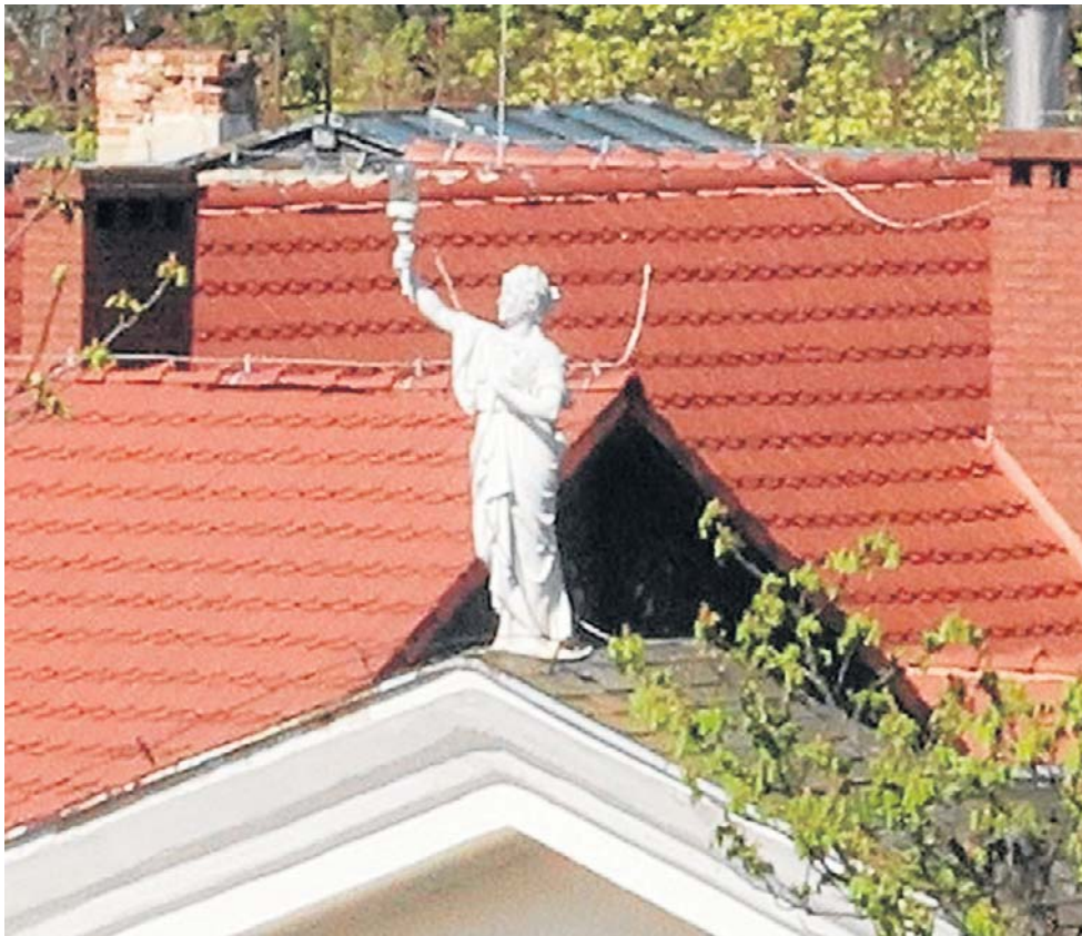
Rzeźba ze szczawieńskiego teatru przywołuje ogólny archetyp „kobiety z pochodnią”.

W teatrze organizowano cykliczne koncerty oraz wystawiano spektakle, goszczono gwiazdy sceny i muzyki. Wcześniej, gdy był to Teatr Książęcy, urządzano w nim urodziny Jana Henryka XI oraz Jana Henryka XV - imprezy z bogatą,