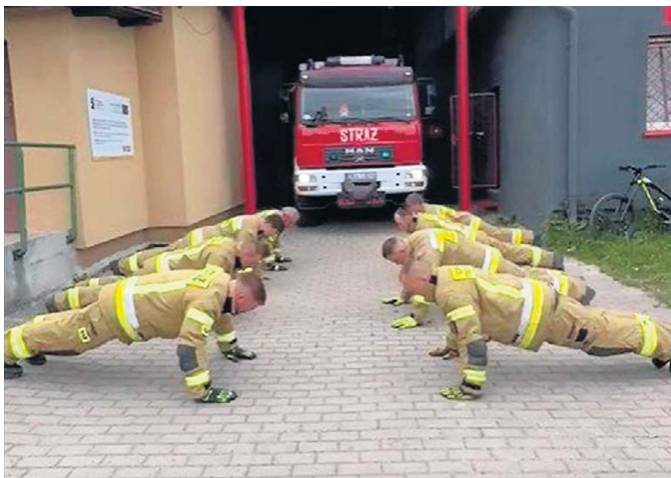
Challenge polega na wykonaniu minimum 10 pompek i wpłacie dobrowolnej kwoty.

* wykonanie symbolicznego zadania: minimum 10 pompek w pełnym umundurowaniu, * wpłata dobrowolnej kwoty na zbiórkę pomocową dla Klaudii,