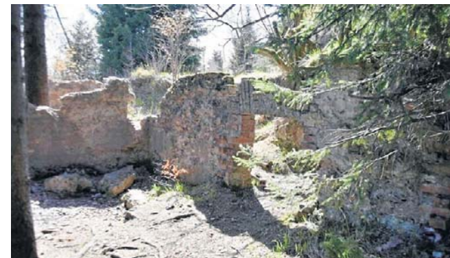
Wycieczka do ruin Pałacyku Myśliwskiego to krótka, wspaniała wędrówka w okolicach Andrzejówki.