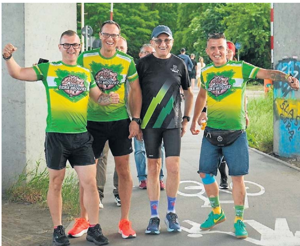
W rywalizacji elity dominowali reprezentanci Kenii, ale świetnie bawili się też amatorzy.