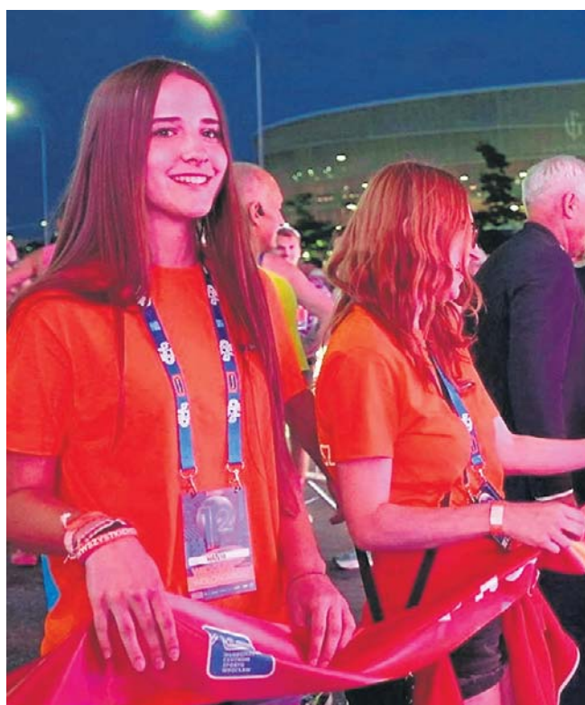
Biegacze wyruszyli na trasę o godz. 22.00, a ostatni przekroczył linię mety przed godz. 3.00 w nocy.