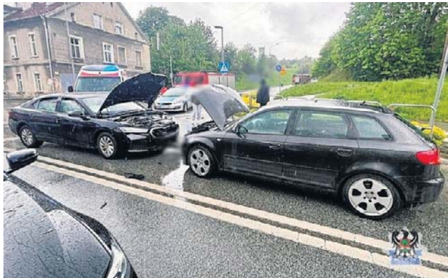
Zderzenie na skrzyżowaniu na Podgórzu. Jego sprawca był poszukiwany celem osadzenia w zakładzie karnym.