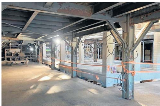
Cały projekt jest warty 35 mln zł. Z tego 20 mln zł to dofinansowanie z Funduszu Sprawiedliwej Transformacji.

- I o tym wszystkim będzie opowiadał przewodnik. Turyści będą szli wąskimi kładkami, ze względów bezpieczeństwa nie będzie można wchodzić tam samemu. Nie planujemy