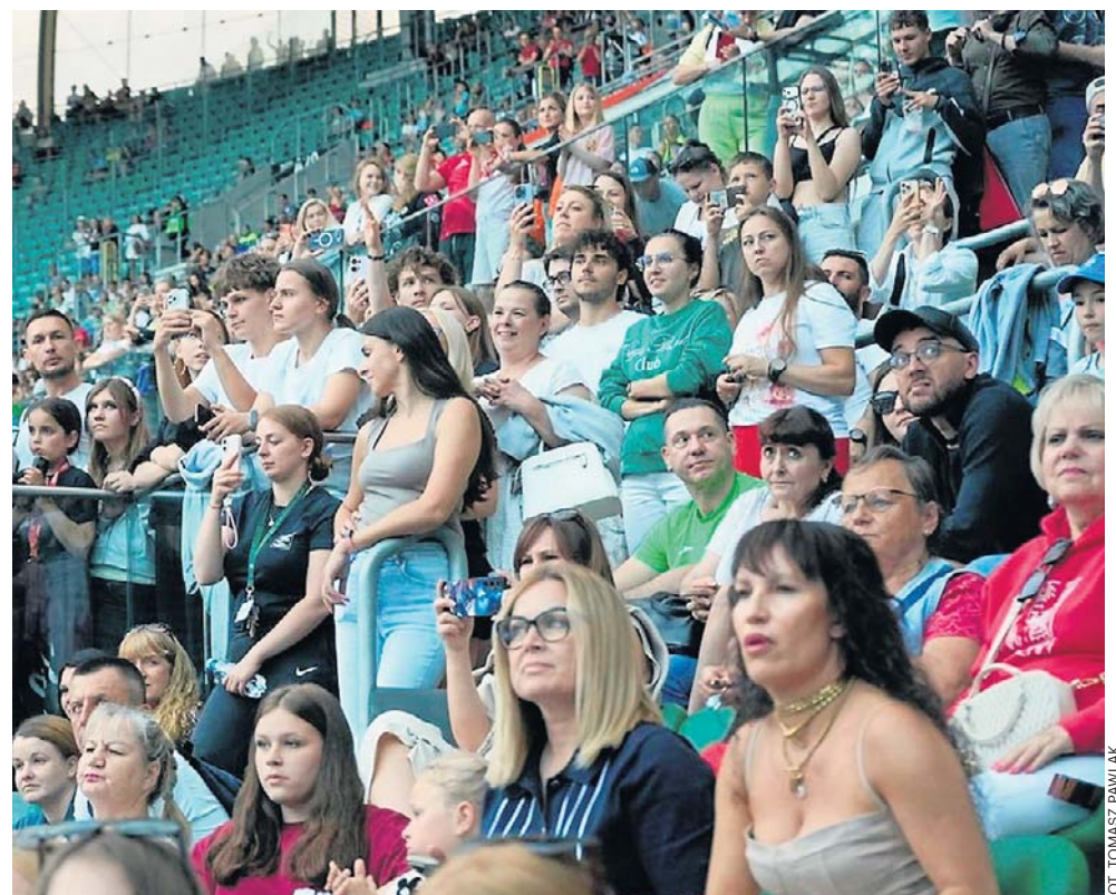
Linia startu i mety została przeniesiona ze Stadionu Olimpijskiego na Tarczyński Arenę.