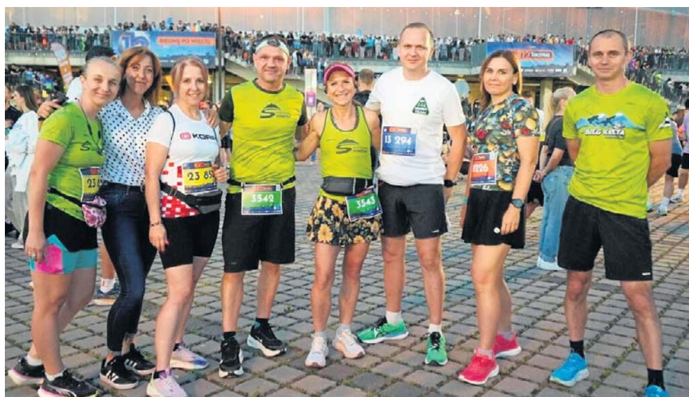
Tylko 7 tys. biegaczy było miejscowych - pozostali to przyjezdni z całej Polski i świata.