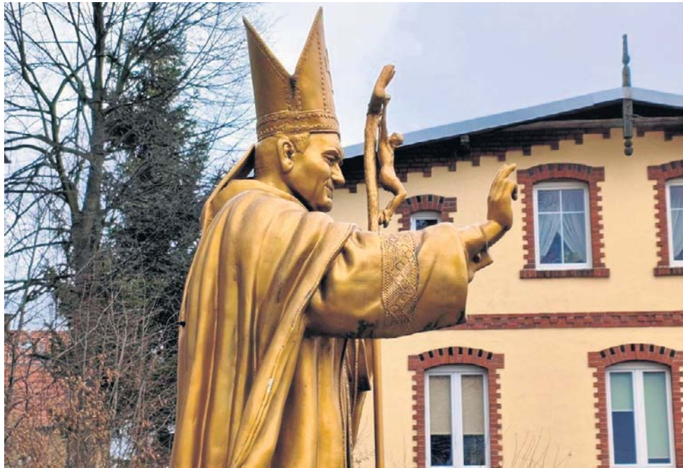
Złota statua, przedstawiająca Jana Pawła II stoi poniżej kościoła na Białym Kamieniu.

Mieszkańcy największej dzielnicy Wałbrzycha zamierzali o uhonorowaniu Jana Pawła II i prowadzą zbiórkę na rzecz budowy jego pomnika, który ma stanąć przed sanktuarium przy ul. Jana Pawła II na wałbrzyskim Podzamczu. Stowarzyszenia i środowiska katolickie dbają o pamięć o papieżu Polaku: organizują Wałbrzyski Marsz Papieski, chcą też, by pomnik zmarłego 2 kwietnia 2005 roku świętego