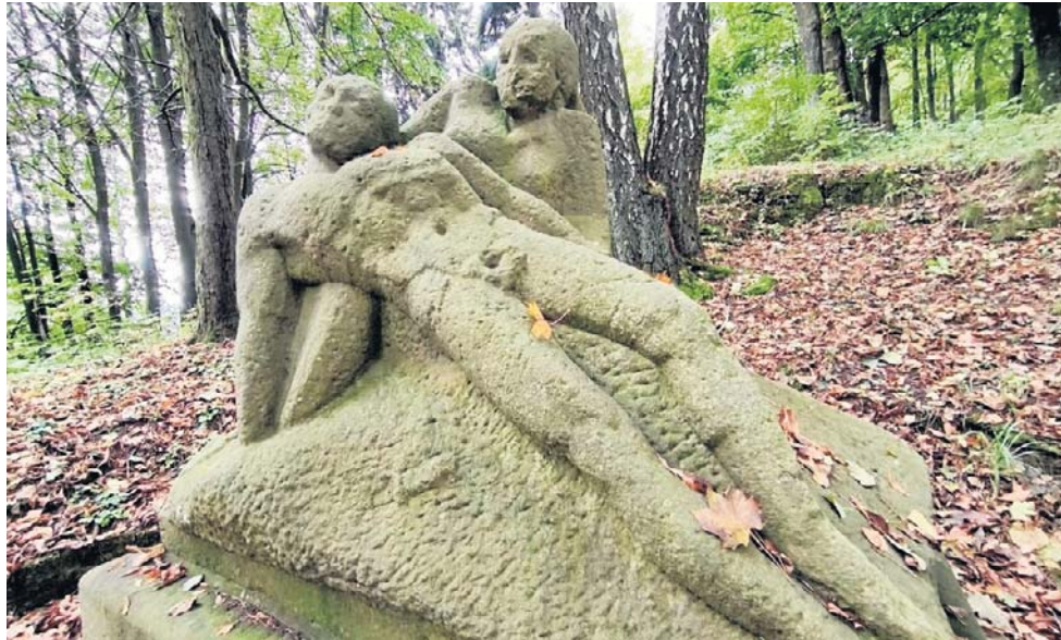
Przejmująca „pieta” w Mieroszowie ma już ponad 100 lat. Powstała w latach 20. XX w.

Najczęściej opowiadana opowieścią miłosną z historii naszego regionu są dzieje romansu Elizy Radziwiłłówny i księcia pruskiego Wilhelma Hohenzollerna. Mieli się poznać na balu karnawałowym w 1815 roku. Ona miała wtedy 12 lat, on 18. Ich miłości nie pobłogosławiono zgodą na małżeństwo. Radziwiłłówna nigdy nie wyszła za mąż. Zmarła na gruźlicę w 1834 roku, 8 lat po rozstaniu z Wilhelmem.