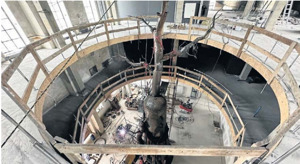
W centralnym miejscu muzealnej ekspozycji w Tyglu znajdzie się symboliczne drzewo.

Podpisujemy umowę na etap, który finalizuje wielki projekt, czyli Muzeum Wałbrzyszan Tygiel. Projekt jest wielki nie z uwagi na kubaturę czy war-