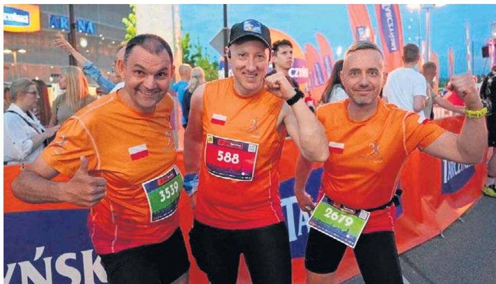
Na starcie stanęli biegacze z aż 58 krajów - łącznie ponad 26 tysięcy uczestników.