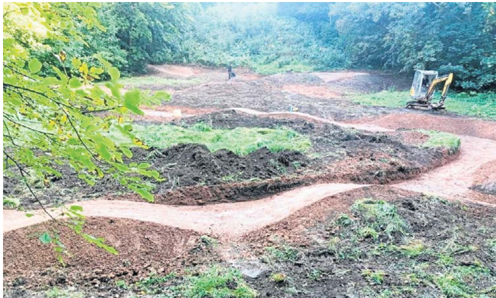
Prace ziemne odbyły się jesienią 2025 roku. Teraz pumtrack czeka już na rowerzystów.

Jednym z ikonicznych miejsc, ważnych dla lokalnej społeczności jest teren Parku Sobieskiego w Wałbrzychu, który przylega do trzech dzielnic. Jednak nie tylko mieszkańcy Śródmieścia, Nowego Miasta i Starego Zdroju mają do tego parku sentyment. Górzysty, leśny teren umiłowali też rowerzyści z całego miasta i regionu, którzy mają tu swoją infrastrukturę. Wspomnienia mieszkańców i chęć zagospodarowania tego terenu na nowo zaowocowały ciekawą, sportową funkcją. Zbocze Parkowej