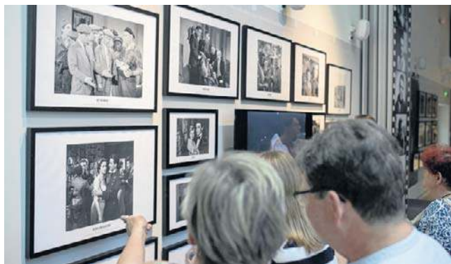
Ekspozycja nie jest jedynie przypomnieniem zawodowego dorobku pochodzącego z Bydgoszczy aktora

Na wystawie zaprezentowano fotografie dokumentujące naj-