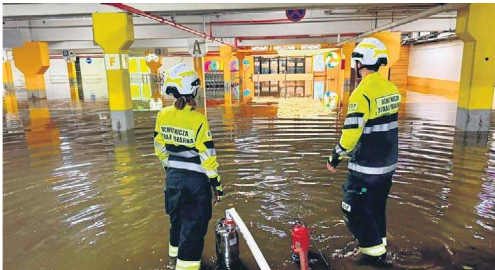
Prawie wszystkie zgłoszenia po burzy dotyczyły różnego rodzaju zalań wodą

- Największe zdarzenie, parując na powierzchnię zalania, to był chyba garaż podziemny centrum handlowego przy ul. Kruszwickiej. Mowa o kilku ty-