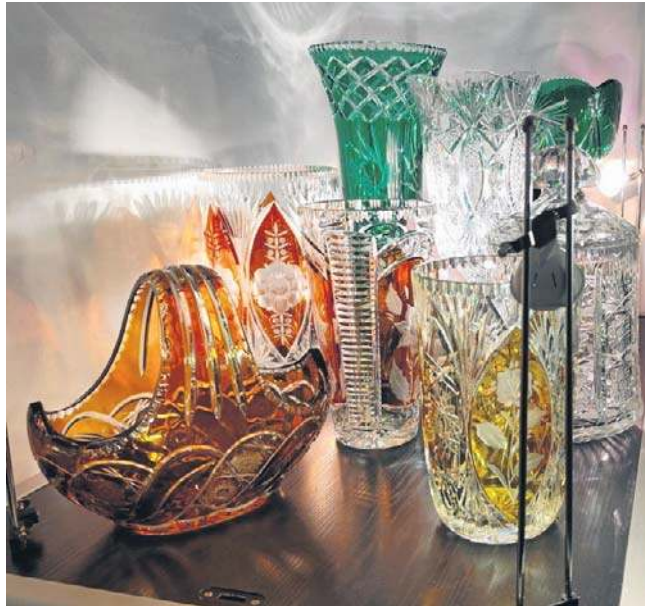
Kryształ wyprodukowane w inowrocławskiej hucie „Irena” zachwycają odwiedzających Muzeum im. Jana Kasprówicza w Inowrocławiu.

Huta Irena (Inowrocław) mieści się pomiędzy tymi poziomami. Najczęstsze patery