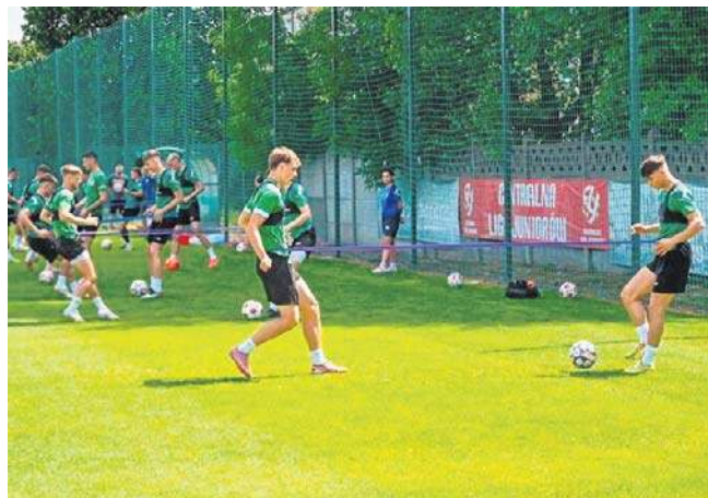
Zawodnicy Olimpii w pocie czoła wykuwają formę na nowy sezon w Betclit 2. Lidze

Start nowego sezonu w Betclit 2. Lidze za nieco ponad trzy tygodnie. Zawisza podejmie Sokoła Kleczew, a Olimpię czeka wyjazd do Avii Świdnik (26.07, godz. 16).