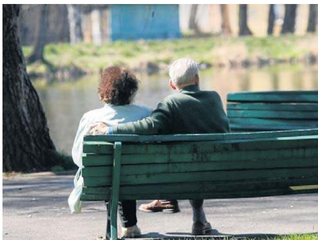
W województwie kujawsko-pomorskim z usług opiekuńczych korzysta ponad 8300 osób

Rośnie też znaczenie usług sąsiedzkich, w ubiegłym roku prowadzono je w 71 gminach (o 17 więcej niż rok wcześniej). To forma pomocy szczególnie ważna na terenach wiejskich i w mniejszych miejscowościach, gdzie dostęp do klasycznych usług opiekuńczych bywa trudniejszy.