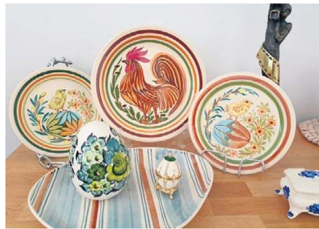
Włocławski fajans wraca dziś na stoły i do domów

Kolekcjonerzy z Węgier szukają wczesnych kostek Rubika. Zwykłe egzemplarze to 100-200 zł, ale wczesne wersje „Magic Cube” z pudełkiem osiągają 600-1 200 zł. Porcelana Zsolnay z eożną to inna liga: mniejsze obiekty zaczynają się od 1,5-2 tys. zł, większe formy dochodzą do 8 000-10 000 zł.