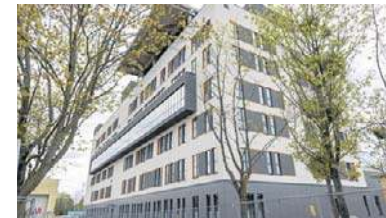
FOT. ARKADIUSZ WOIŚNIEWICZ

Wybrano firmę, która dokończy rozbudowę i modernizację szpitala Bizuela str. 4