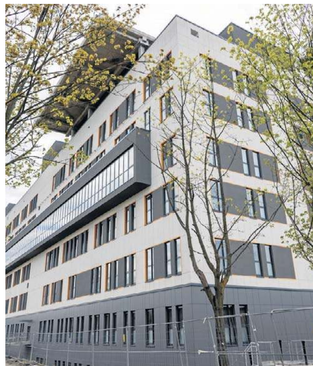
Budowa, która miała zakończyć się w 2023 r., w tym roku może zostawić wznowiona.

Pod koniec lutego 2026 r. otwarto oferty w przetargu na kontynuację prac. Collegium Medicum UMK planowało wydać 120 mln zł. Zgłosiły się cztery podmioty, które zaoferowały ceny od 211 do 230 mln zł. Gdy pytaliśmy o losy postępowania przetargowego w kwietniu, zespół prasowy uczelni