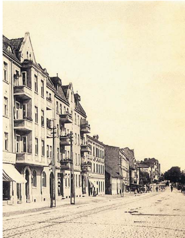
Ulica Chełmińska w Grudziądzu w 1925 roku. Za kamienicami widać ogródki działkowe

Ze względu jednak na zaszłą potrzebę dokładnego zbadania stanu psychicznego zbrodniarza wynik ekspertyzy specjalistów-psychojatrów będzie mógł być wiadomym dopiero za kilka dni, a z tą chwilą rozstrzygnięty zostanie problem, czy Murawskiego postawić przed sąd dożałny, czy też odpowiadać on będzie przed zwykłą izbą kar-