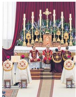
Święcenia czterech biskupów lefebrystów