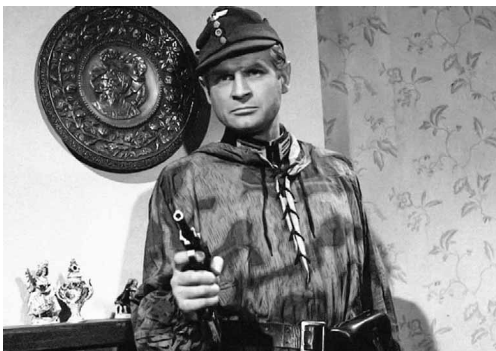
Filmowy J-23 w akcji. 18 odcinków serialu o Hansie Klossie emitowano na antenie TVP od 10 października 1968 do 6 lutego 1969 roku

Beljung publicznie wypowiedział się na temat pracy agenta tylko raz, w wywiadzie udzielono-