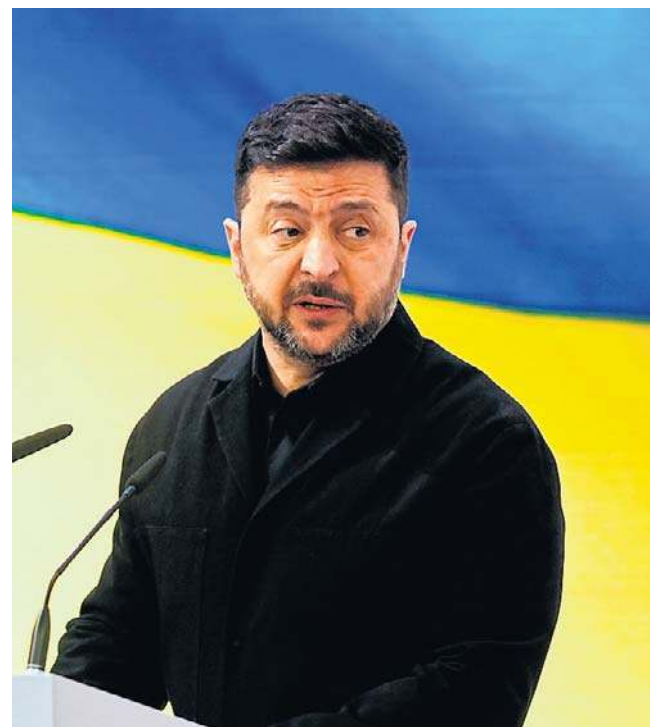
W niedzielę prezydent Zełenski wniósł do parlamentu projekt ustawy o budowie Panteonu Narodowego z imionami osób, które walczyły o wolną Ukrainę

– Bandera jako osoba, która ogłaszała w 1941 roku państwo ukraińskie i przez całe życie dążyła do uzyskania ukraińskiej niepodległości, bez wątpienia może być w panteonie. Ale listy nie ma. I obecnie są to jedynie