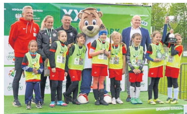
Dziewczynki z SP 1 Sianów

- Wiedzieliśmy, że pierwszy mecz będzie decydujący, żeby dobrze wejść w turniej. Udało się. No i też liczyliśmy się z tym, że byliśmy faworytem, ponieważ dla chłopców to jest już drugi finał. Dwa lata temu w kategorii U-10 zajęliśmy 3. miejsce