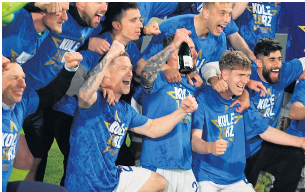
Lech już teraz przypieczętował obronę tytułu, zdobywając przeklęty teren - Radom

- Zdobył tytuł to jedno, ale obronił... duża klasa. Gratulacje