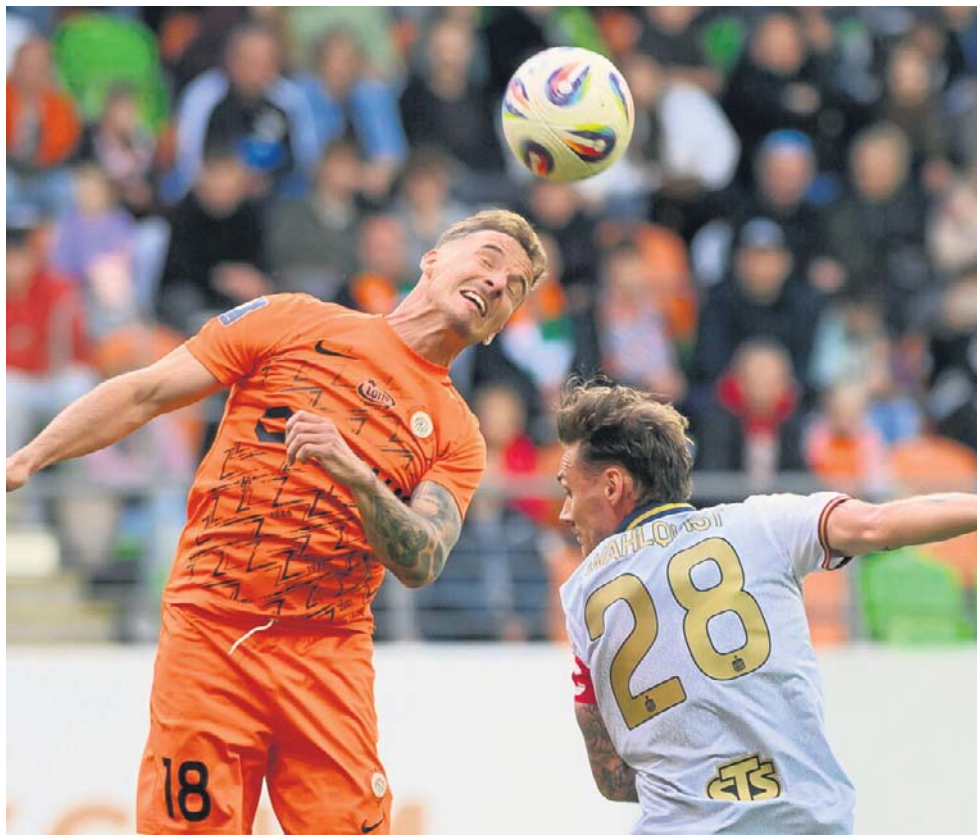
W Lubinie Pogoń więcej zainwestowała od gospodarzy, by wygrać ten mecz

Zagłębie, które miało realne szanse na europejskie puchary - też nie chciało przejść inicjatywy. - Nie byliśmy sobą