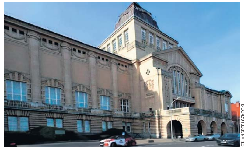
Rozpoczął się gruntowny remont zabytkowego budynku Muzeum Narodowego dofinansowany z funduszy europejskich