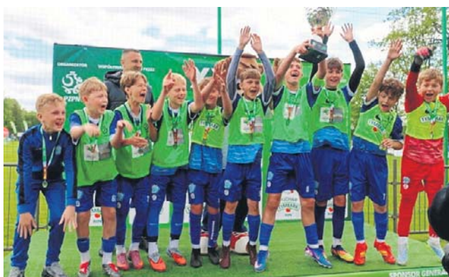
Chłopcy z SP 7 Koszalin