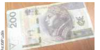
Za to przestępstwo grozi do 8 lat więzienia

Lublin: Policjanci zatrzymali 44-latką, który poszedł do piekarni i zapłacił za zakupy zabawkowym banknotem. Wręczył kasjerce imitację 200 złotych, po czym wyszedł.