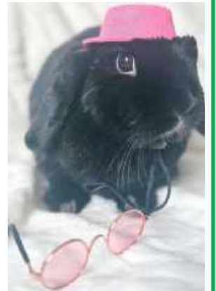
Redakcyjny pupil „Chloe” zaprasza do wysyłania wakacyjnych zdjęć!