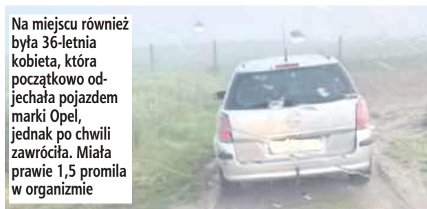
Na miejscu również była 36-letnia kobieta, która początkowo odjechała pojazdem marki Opel, jednak po chwili zawróciła. Miała prawie 1,5 promila w organizmie

- Funkcjonariusz Państwowej Straży Pożarnej zauważył dwa pojazdy, z których jeden ugrzązł w błocie i nie był w stanie ru-