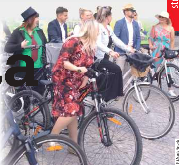
W Białej Podlaskiej zorganizowano dwa wyjątkowe rajdy rowerowe: Ladies Ride i Gentleman's Ride