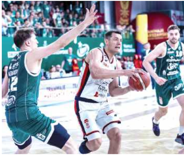
Start Lublin walczy z Legią Warszawa o złoto OBL

PGE Start Lublin - Legia Warszawa 78:84 (24:20, 15:34, 23:15, 16:15)