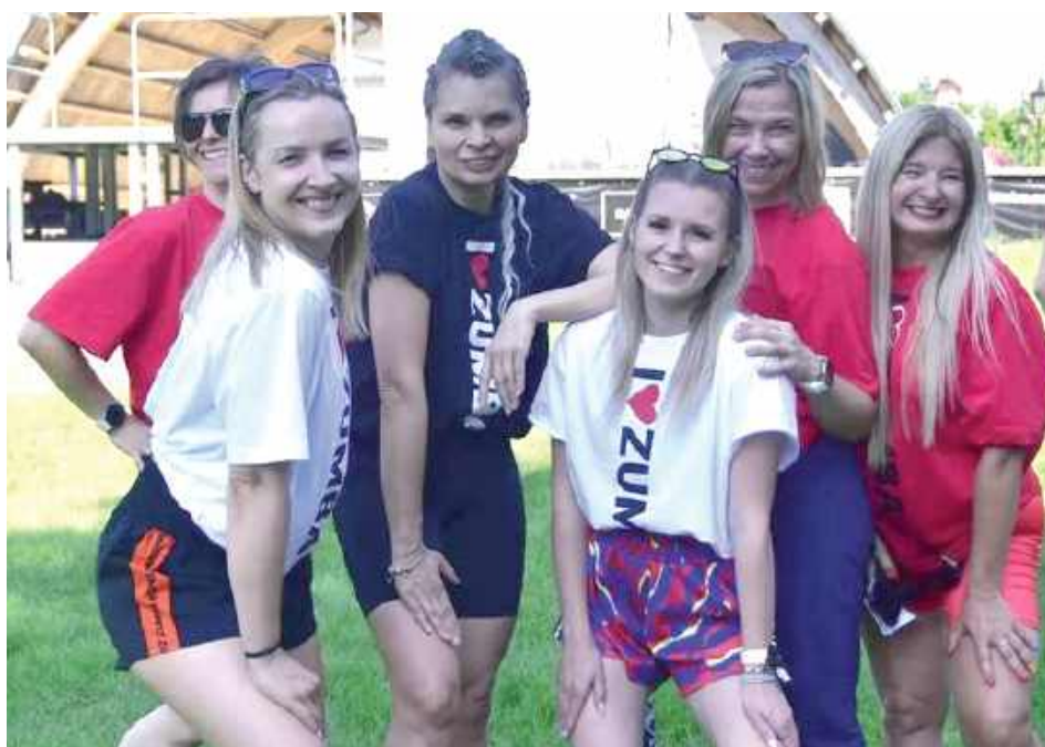
Instruktorzy nie zawiodły, poprowadziły energetyczny trening!

Zajęcia odbywały się w formule otwartej – bez zapisów i limitów. Każdy chętny mógł dołączyć, o ile był przygotowany na intensywny ruch. Wystarczyły wygodne ubranie, woda i odrobina motywacji.