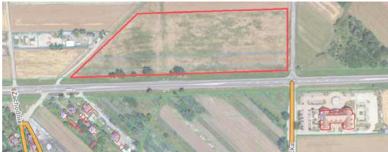
Obszar planowanej inwestycji został oznaczony kolorem czerwonym. Centrum handlowe ma powstać tuż obok drogi krajowej nr 2, po jej północnej stronie, w pobliżu ulic Zachodniej i Drohickiej

Decyzja o środowiskowych uwarunkowaniach została wydana po konsultacjach z Regionalnym Dyrektorem Ochrony Środowiska oraz Państwowym Gospodarstwem Wodnym Wody Polskie, które nie stwierdziły konieczności przeprowadzenia