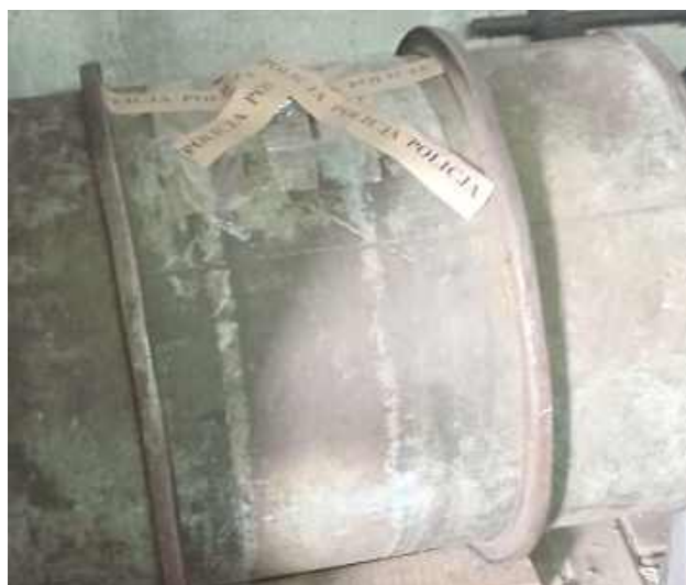
W trakcie rozmowy z funkcjonariuszami przyznał, że skradziony olej wykorzystywał do celów prywatnych

- Białscy policjanci zwalczający przestępczość przeciwko, ustalili, że 55-latek podejrzany jest o kradzież paliwa na szkodę swojego pracodawcy. Do zdarzeń dochodziło od początku 2022 roku. Z ustaleń funkcjonariuszy wynikało, że „amator cudzego mienia” regularnie kradł olej napędowy, który miał trafić do obsługiwanego przez niego koparki. By sprawa nie wyszła na jaw wykorzystywał do tego