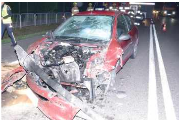
Jechał pod wpływem, spowodował wypadek, odpowie za to przed sądem

Będący pod wpływem alkoholu 35-letni mężczyzna doprowadził do kolizji z ciężarówką, a następnie uciekł z miejsca zdarzenia. Dzięki szybkiej reakcji służb został zatrzymany i odpowie za swoje czyny przed sądem.