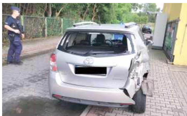
40-letni kierujący ciężarowym Mercedesem nie zachował bezpiecznej odległości od poprzedzającego go samochodu osobowego marki Toyota, który zatrzymał się przed przejściem dla pieszych. W wyniku czego najechał na tył Toyoty

W poniedziałek, 9 czerwca tuż przed godziną 16 policjanci z ryckiej drogówki podczas patrolowania ulic Dębłina zauważyli, że na ulicy 15 Pułku Piechoty Wilków