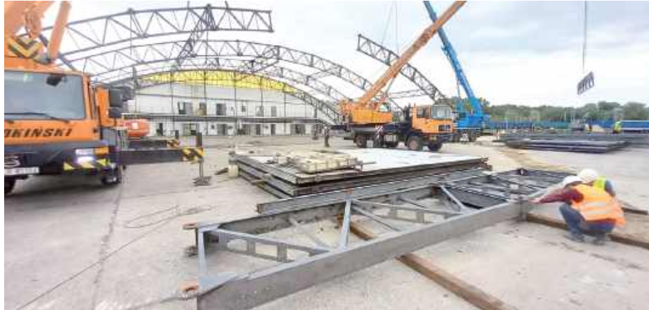
Trzy pojazdy i sześciu pracowników pracowało cztery tygodnie przy niezwykle dokładnym demontażu hangaru

Podczas budowy obiektów białskiego garnizonu Żelaznej Dywizji konieczne było usunięcie zabytkowego hangaru na dawnym lotnisku. Rozebrano go i przygotowano do ponownego złożenia w innym miejscu, aby służyć muzeum na ekspozycje historyczne.