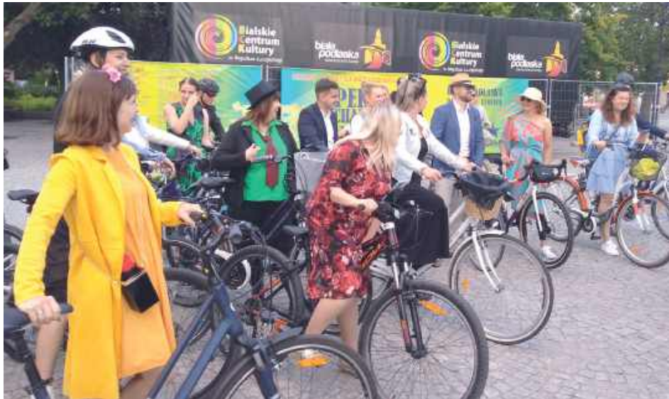
Na starcie podwójnego rajdu humory dopisywały. Uczestnicy zadbali o eleganckie stroje

W tym roku mistrzowskie szaleństwo zaczęło się od startu o północy 1 czerwca, gdy w trasę ruszyło ponad 500 rowerzystów na białskim pl. Wolności w nocnym rajdzie. A za kilkanaście godzin ruszyło ponad 200 osób w Rajdzie na Start 2025. Tak było później w wielu rajdach oraz