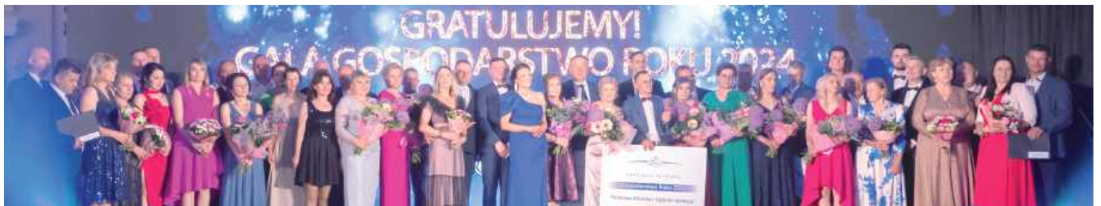
Oprócz nagród rzeczowych, konkurs był okazją do spotkania hodowców z różnych regionów Polski, wymiany doświadczeń oraz świętowania wspólnego sukcesu. Spomlek nagroził również hodowców za najwyższe dostawy mleka, najlepszą jakość mleka, najwyższą kazeinę w mleku, najwyższą dynamikę produkcji w 2024 roku. Po 10 rolników w każdej z tych kategorii otrzymało nagrody rzeczowe oraz statuetki