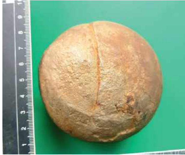
Kula zachowała się w dobrym stanie

- Kula wykonana jest ze stopu żelaza (stop zbliżony do żeliwa dość powszechnie