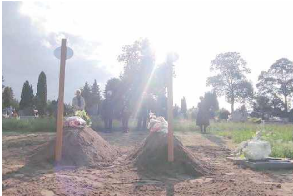
Cudzoziemcy i wolontariusze złożyli kwiaty na świeżo usypanych i poświęconych mogiłach

W czwartek po południu w Janowie Podlaskim odbył się pogrzeb dwóch migrantów z Etiopii. Na cmentarz przybył proboszcz białskiej Parafii Pra-