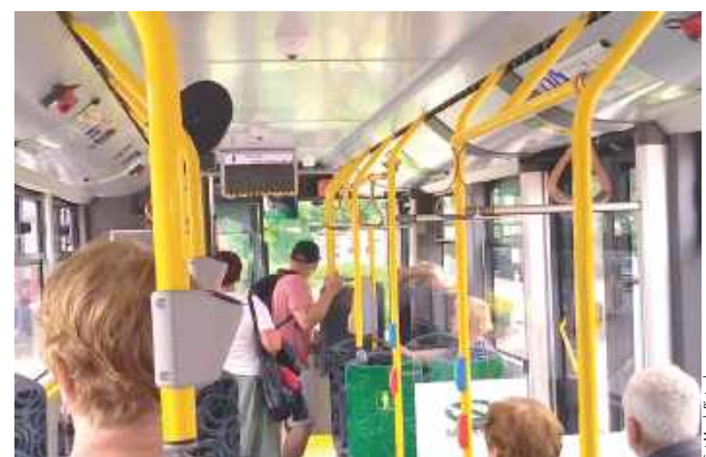
Stać też trzeba z głową

Kiedy nie ma tłoku w białskim autobusie i wiele miejsc siedzących jest wolnych, część nie tylko młodych pasażerów stoi w trakcie jazdy niedaleko drzwi. Często bywa, że kierowcy spodziewają się, że te osoby będą wysiadać, zatem przystają na każdym przystanku, choć nikt