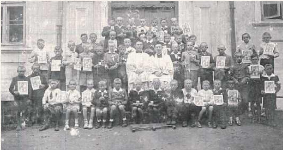
Dzieci przy luteriańskiej szkole w Cycowie, lata 30. XX wieku. Wejście do niewielkiej świątyni mieściło się nie we froncie a w bocznej ścianie. Do 1924 roku wspólnota miała tylko kantora, po utworzeniu parafii na stałe obsługiwał jej już własny pastor. Zdjęcie ze strony parafii luteriańskiej w Lublinie

Opuszczony kościółek, który kiedyś był cerkwią unicką, a potem prawosławną. Ewangelicki dom modlitwy, który był też szkołą, magazynem i wiejskim domem kultury. Kaplica, którą wywieziono do Białej Podlaskiej, a teraz stoi w Dobratyczach. Spacerując po miejscowości, natrafimy też na różne cmentarze. Prawosławny (u zbiegu ulic Nowej i Chełmskiej), ewangelicki (przy ul. Nowej) i rzymskokatolicki (przy ul. Chełmskiej). Nie zachowały się za to ślady po kirkucie.