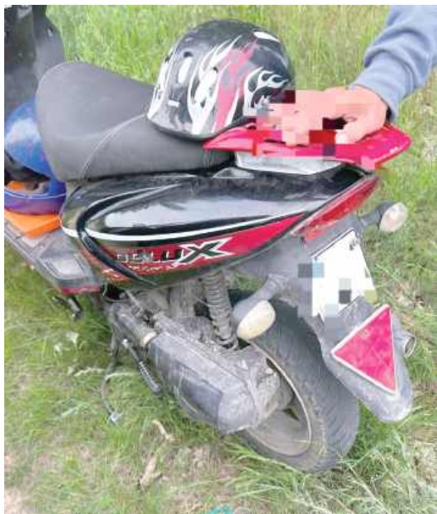
W trakcie kontroli okazało się również, że pojazd nie posiada badań technicznych

Pijany motorowarzysta w rękach policji. Po jednoślad przyjechała nietrzeźwa partnerka