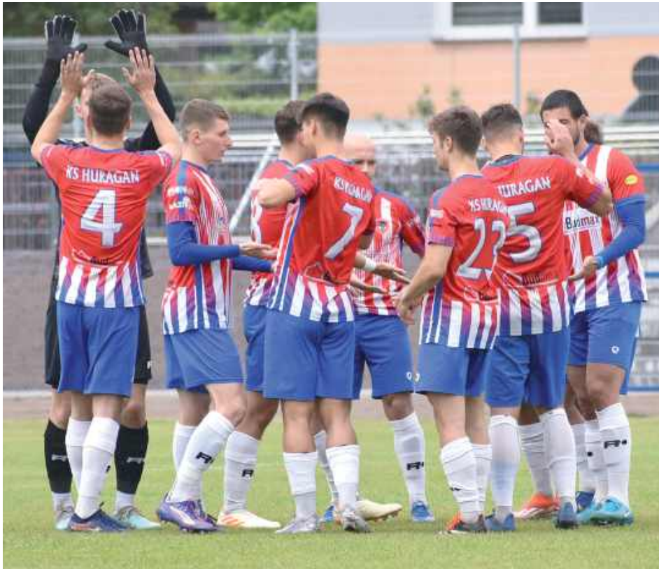
Zespół z Międzyrzeca może świętować zajęcie 11 miejsca w IV lidze

Druga połowa rozpoczęła się od kolejnych ataków zawod-