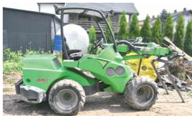
51-latek najprawdopodobniej został częściowo przygnieciony przez to urządzenie

- Ze wstępnych ustaleń wynika, że 41-letni pracownik jednej z firm remontowych obsługiwał ładowarkę, którą podniósł płyty betonowe z zamiarem umiesz-