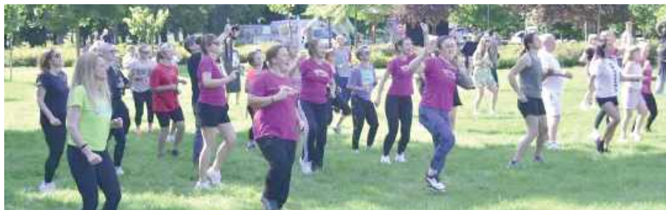
Uczestnicy mogli spróbować swoich sił w ćwiczeniach z muzyką latino i pop - poradzili sobie świetnie!

W trakcie wydarzenia prowadzona była także zbiórka na rzecz Hospicjum dla Dzieci im. Małego Księcia w Lublinie. Uczestnicy mieli okazję wesprzeć działalność placówki,