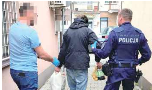
Produkty spożywcze w stanie nienaruszonym zostały zwrócone do sklepu. Sprawcą kradzieży sklepowej był 32-letni mieszkaniec powiatu ryckiego, który został ukarany mandatem karnym w wysokości 500 złotych za swoje przewinienie

W poniedziałkowe popołudnie (9 czerwca) będący poza służbą policjant ryckiej komendy jadący samochodem ulicami Ryk zwrócił uwagę na mężczyznę, który wyszedł z jednego ze sklepów z wózkiem zakupowym i produktami spożywczymi.