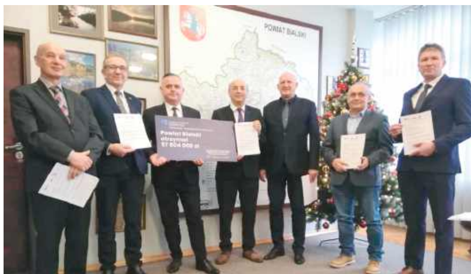
Podpisanie umowy na realizację inwestycji pn. Budowa i rozbudowa drogi łączącej europejski szlak drogowy E-30 z Portem Małaszewicze i linią kolejową E-20.

Planowana inwestycja ma na celu budowę od podstaw nowego odcinka drogi powiatowej oraz rozbudowę istniejących odcinków dróg gminnych i wewnętrznych PKP, nadając im jedną kategorię jako droga powiatowa klasy Z (zbiorcza). Droga docelowo ma przebiegać od projektowanego wiaduktu nad torem KWK Wólka Dobryńska wg projektu CARGOTOR (gmina Zalesie) do ul. Kodeńskiej przed Granicznym Punktem Odpraw Fitosanitarnych w Kobylanach, z wiaduktem drogowym nad torami istniejącej bocznicy GASPOL i projektowanej INBAP (gmina Terespol).