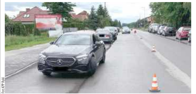
9-letnia dziewczynka wybiegła zza zaparkowanego pojazdu stojącego wzdłuż drogi wprost pod nadjeżdżający samochód marki Mercedes-Benz

W poniedziałek, 9 czerwca przed południem dyżurny ryckiej komendy został powiadomiony o zdarzeniu drogowym na ul. 15 Pułku Piechoty Wilków AK w Rykach w pobliżu szkoły podstawowej.