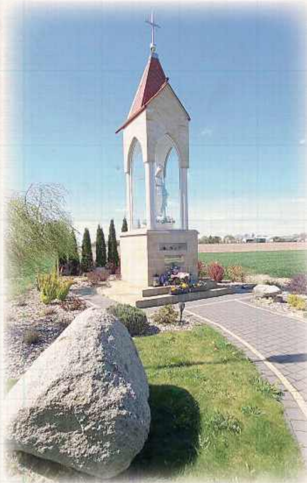
W 2019 roku wybudowano w Jabłoni przy ulicy Jaśminowej kapliczkę ku czci Matki Bożej Królowej Pokoju i Pojednania. Jest ona miejscem stałego kultu oraz prywatnych pielgrzymek. W internecie znajdziemy profil facebookowy Objawienia Matki Bożej w Jabłoni w latach 1875-1876, który opowiada o zdarzeniach z lat 1874-1875 i ich obecnych echem