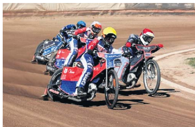
Wybrzeże Gdańsk po trzech remisach w końcu wygrało na wyjeździe. Postarało się o to w Opolu