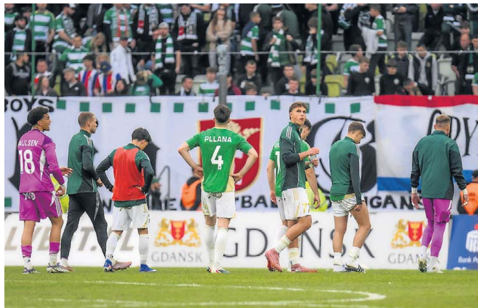
W Lechii jest ogromne rozczarowanie pod spadku z PKO Ekstraklasy

W ostatnim meczu w Gdańsku tym sezonie drużyna AP Orle- nu Gdańsk pokonała Le- cha/UAM Poznań 2:1 w Orle- nie Ekstralidze. (stan)