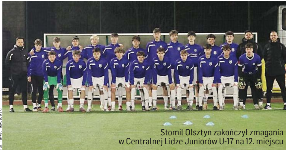
Stomil Olsztyn zakończył zmagania w Centralnej Lidze Juniorów U-17 na 12. miejscu

Co było kluczem do przełamania kryzysu w trakcie rundy wiosennej? - Wydaje mi się, że dopadł nas też delikatny kryzys motorycz-