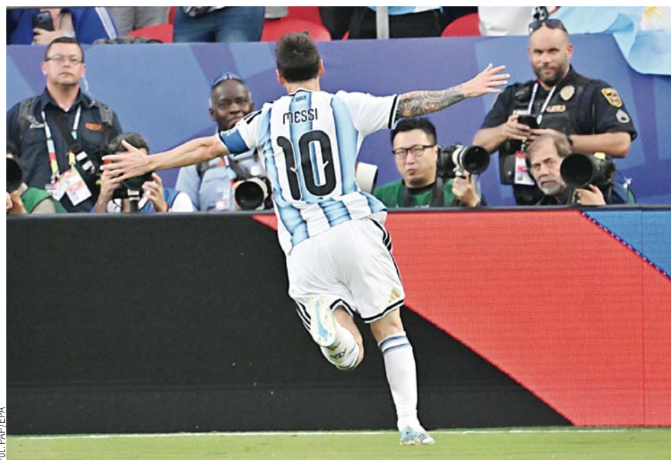
Lionel Messi w sześciu mundialach zdobył - na razie - 16 bramek

Napastnik Realu Madryt poprowadził Francję do