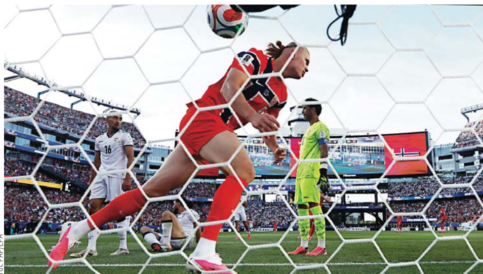
Erling Haaland poprowadził Norwegów do zwycięstwa nad Irakiem

>>> 02:50, grupa A: Meksyk - Korea Południowa (TVP 1, TVP Sport)