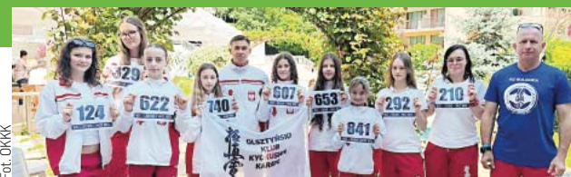
Reprezentacja Olsztyńskiego Klubu Kyokushin Karate w Warnie

Ekipa ze stolicy Warmii i Mazur ostatecznie pięć razy stanęła na podium, poza tym zajęła wiele wysokich lokat.