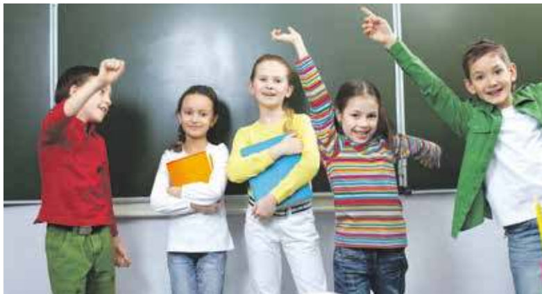
Do rozpoczęcia roku szkolnego daleko, ale o dodatki już można się starać

Podstawowym świadczeniem wspomagającym wychowanie dzieci jest