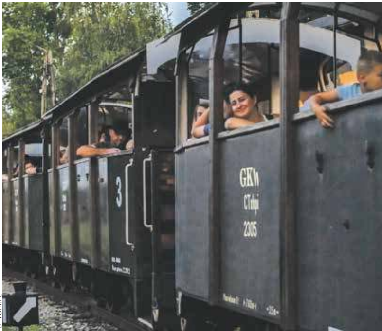
Przejażdżka wąskotorówką to kapitalna atrakcja

Wakacje to dla bytomskiej wąskotorówki najbardziej pracowity czas w roku. Pociągi ciągnące wagoniki wyruszają na szlak z Bytomia przez Tarnowskie Góry do Miasteczka Śląskiego i z powrotem w każdy piątek, sobotę, niedzielę i święta. Jeśli jeszcze nie korzystaliście z tej atrakcji, to naprawdę ten straszny błąd.