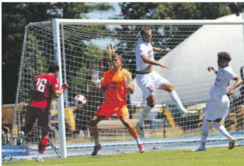
Na razie Polonia gra w sparingach, ale 1. Liga coraz bliżej