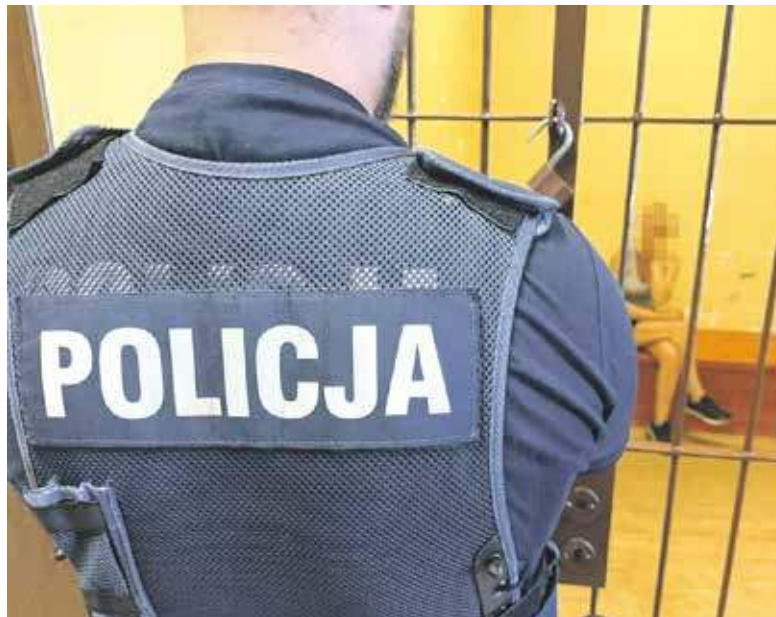
Aresztowana bytomianka zachowała się kompletnie nieodpowiedzialnie

Zdumiony świadek tego zdarzenia zareagował błyskawicznie. Zablokował przejazd i uniemożliwił kobiecie ucieczkę. Jednocześnie powiadomił o wszystkim policjantów ze Zbrosławic. Ci pojawili się na miejscu bardzo szybko, a towarzyszy-