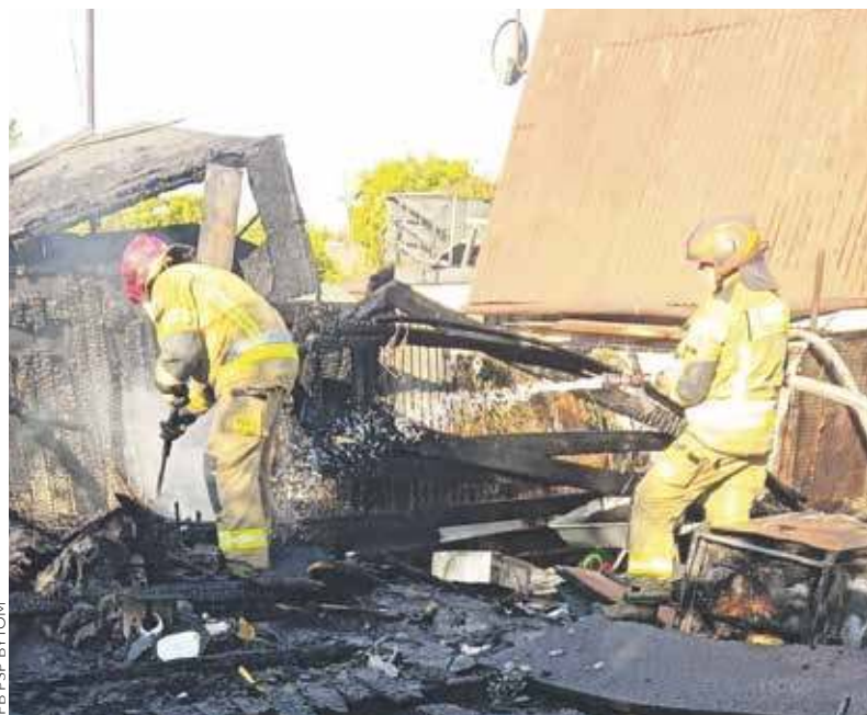
Z altan zostały jedynie zwęglone resztki

Do wielkiej detonacji doszło wczesnym rankiem 3 lipca na terenie ogródków działkowych przy ulicy Zabrzańskej. W jej efekcie zapaliły się altany, a wezwani strażacy mieli mnóstwo roboty.