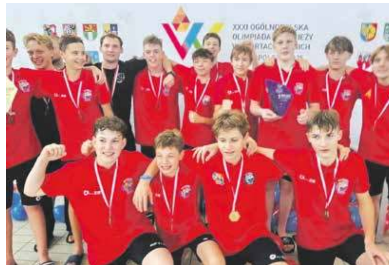
Złota ekipa U15