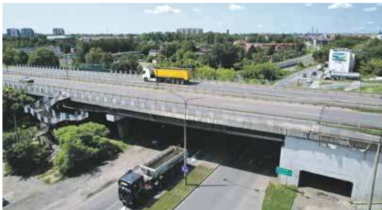
Wymagający naprawy wiadukt ma kolosalne znaczenie i służy wielu kierowcom

Dlatego też zarządzający obiektem bytomski Miejski Zarząd Dróg i Mostów w oparciu o przeprowadzoną ekspertyzę, a także na podstawie wniosków z przeglądów okresowych