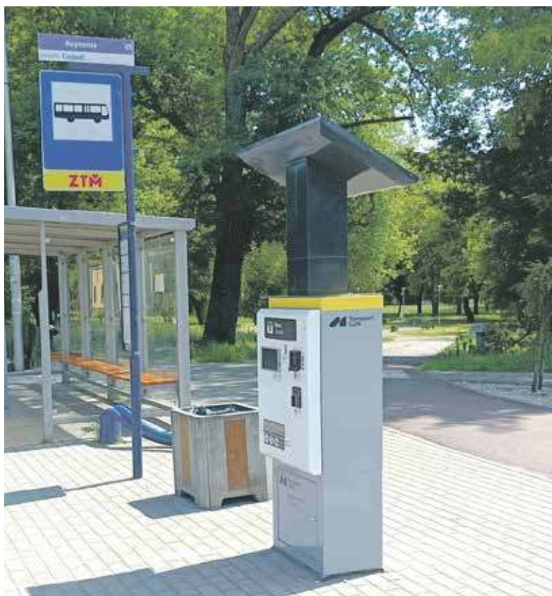
Takich solarnych biletomatów mamy w regionie aż 132

Niedawno sfinalizowano ostatni, trzeci etap inwestycji, w ramach którego liczba urządzeń zwiększyła się o następne pół setki. Od końca czerwca służą one pasażerom w 20 gminach. – W tym etapie oddaliśmy do użytku naszym podróżnym 50 biletomatów – mówi Michał Wadowski, p.o. dyrektor ZTM.