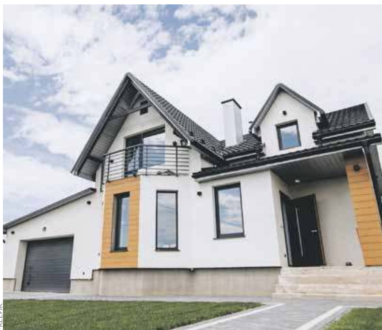
Czy budowa domu w Polsce będzie koszmarnym wyzwaniem?

- Kiedy po raz pierwszy o tym usłyszałem, wydawało mi się, że to żart na Prima Aprilis. Ale jeśli to rzeczywiście