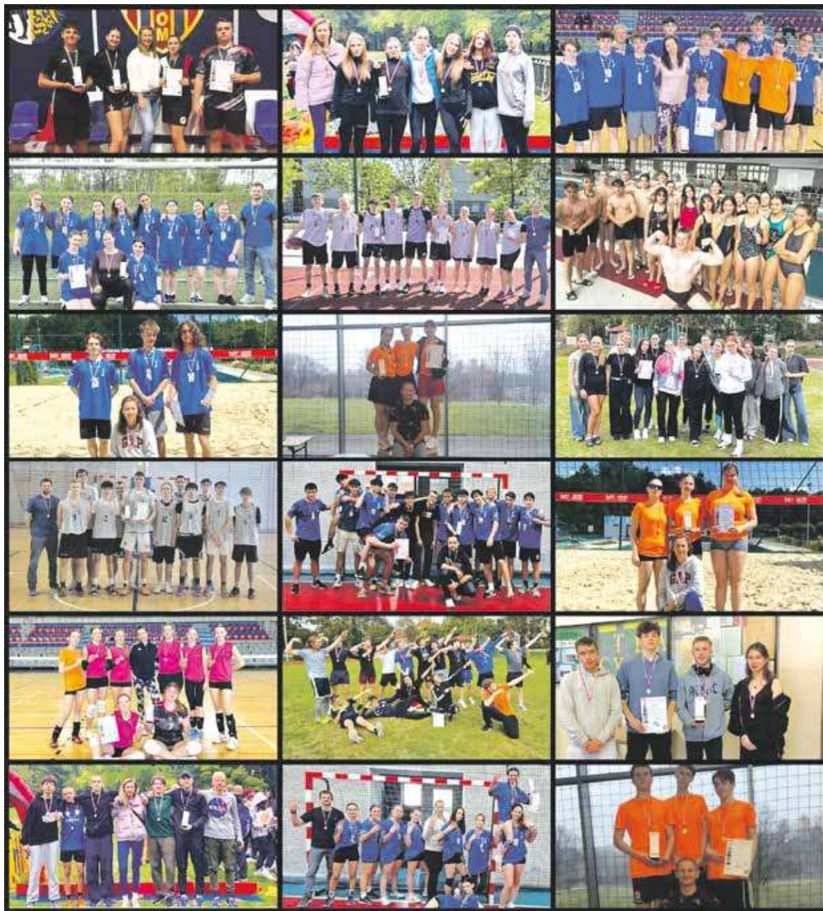
I LO zostało najbardziej usportowioną szkołą średnią w Bytomiu