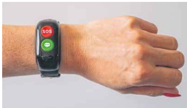
Obsługa opaski jest bardzo prosta

Łatwe w obsłudze opaski bezpieczeństwa są niewielkie i wyposażone w dwa przyciski: zielony oraz czerwony. Za ich pomocą można wysłać ważne i mogące uratować życie komunikaty. Prawdopodobnie najważniejszy jest sygnał SOS, a więc wezwanie pomocy. Poza tym opaska służy jako detektor upadku. Jeśli posiadająca ją osoba przewróci się, wiadomość o tym zostanie wysłana automatycznie.