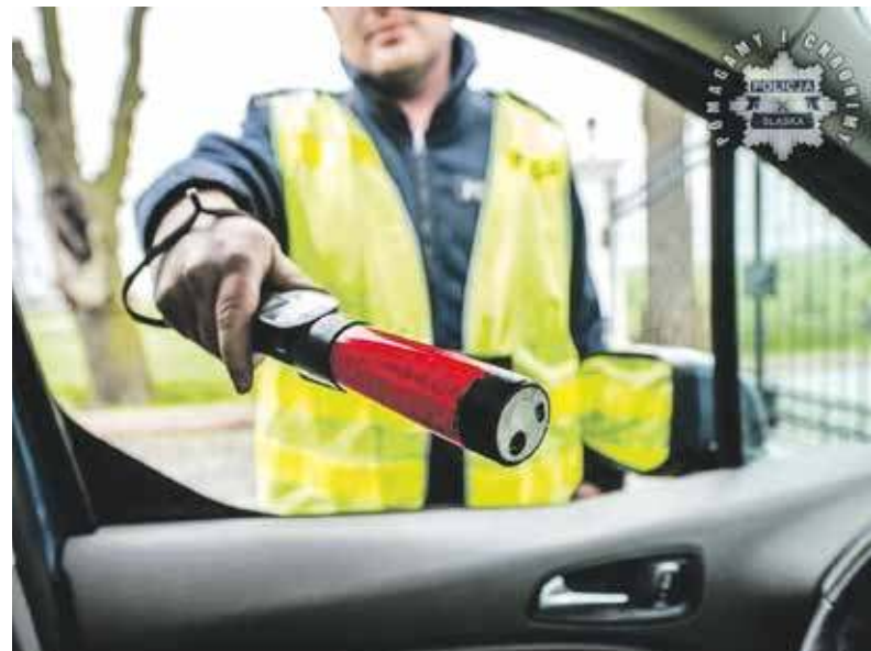
Policjanty niy roz sprowdzajom, cy kierowcy niy jezdjom po łozartymu

Ale som tyz przislówki ftoe sie tworzy bez dołożynie na przodku słówka „po” - we polskim tyz tak jest.