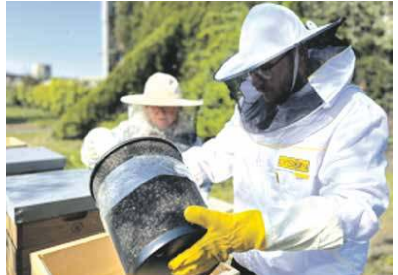
Pszczoły z Koksowni mają dawać miód z charakterem

Jak ważne są pszczoły w naszym ekosystemie wiadomo nie od dzisiaj. Dają nie tylko miód, ale też zapylają niemal wszystkie rośliny. Stąd od kil-