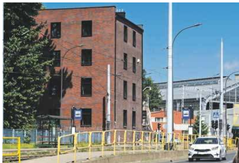
Odnowiony gmach prezentuje się rewelacyjnie

Przez wiele ostatnich lat okazały, oglądany każdego dnia przez dziesiątki przejeżdżających tędy i przechodzących osób stał pusty. Nie było pomysłu na jego ponowne zagospodarowanie, a przede wszystkim środków finansowych na konieczną modernizację.