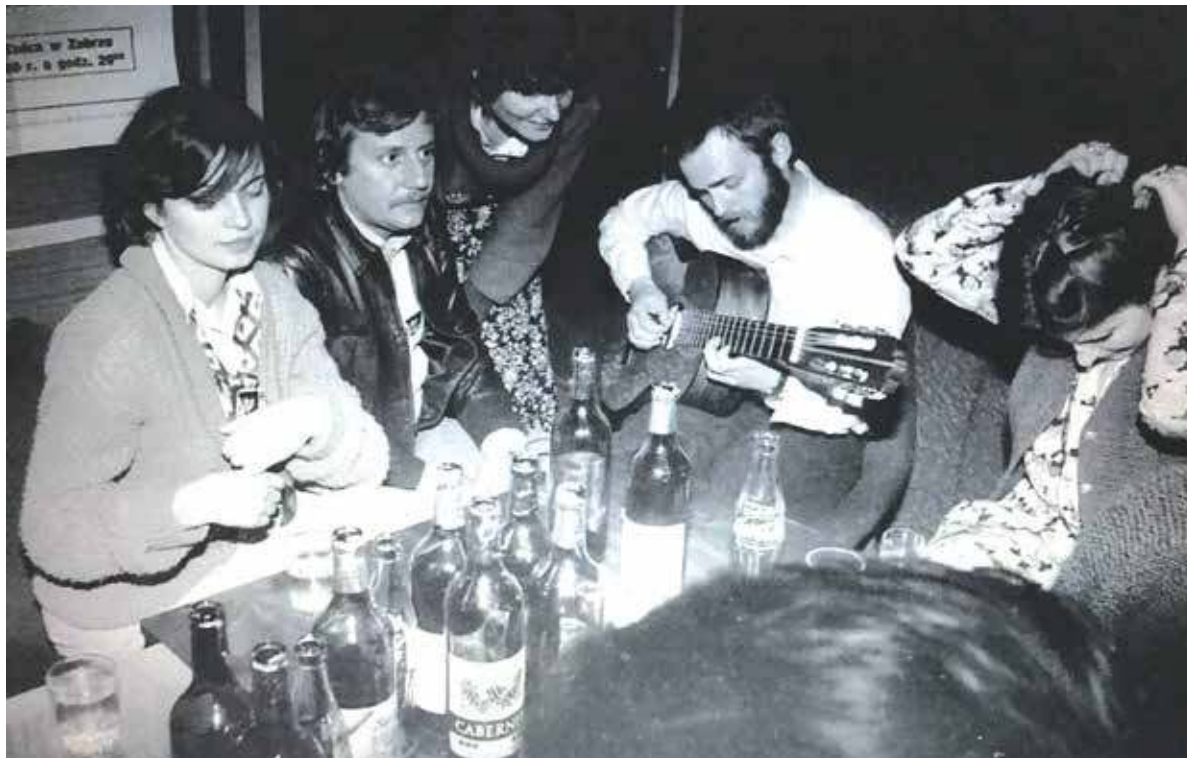
Pyrlíkowski klimat, czyli wino i kultura