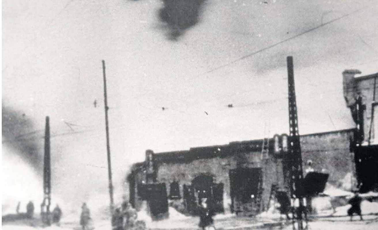
Straty w wyniku pożaru magazynów ocenia się na milion - a nawet do trzech milionów marek!

Sam port zbudowany był w latach 1896 - 1902 i później rozbudowany. Składał się z szeregu magazynów lekkiej, drewnianej konstrukcji, często przylegających do siebie. Okupujący Poznań od 10 września 1939 roku Niemcy pilnowali kompleksu, ale wobec wprowadzonego przez siebie terroru i rozbijania kolejnych powstających grup ruchu oporu, nie