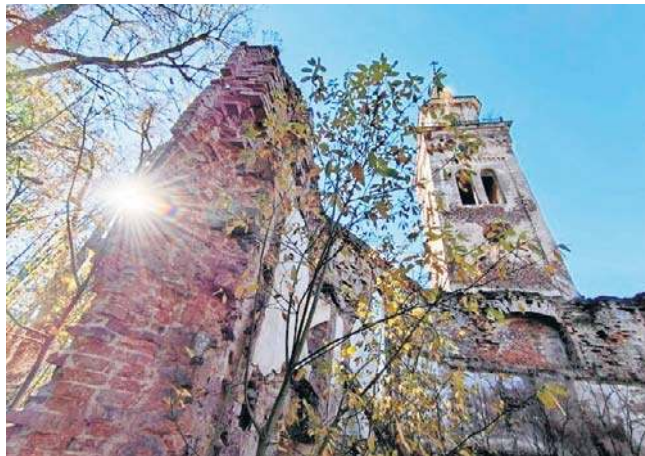
Opuszczony po wojnie kościół to dziś ruina. Dwukrotnie trawił ją ogień, co mocno osłabiło konstrukcję budowli.

pierwszej połowie XIX wieku, znakomicie zachowany i odnowiony przez obecnego właściciela - czytamy w anonsie.