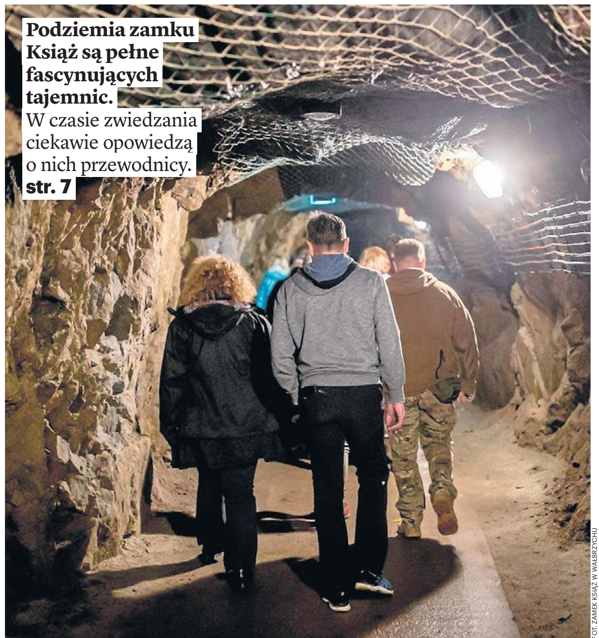
FOT. ZAMEK KSIĄŻ W WAŁBRZYCHU