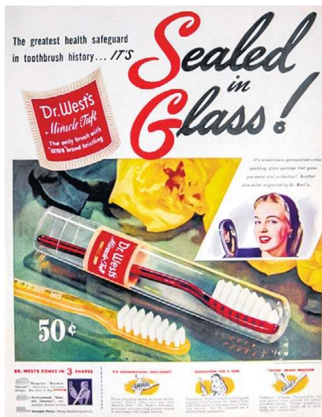
Jedna z pierwszych reklam nylonowej szczoteczki. Otrzymały one nazwę „Dr. West's Miracle-Tuft” i miały charakterystyczne, kolorowe uchwyty.

A w kolejce czekają urządzenia, których zasada czyszczenia zębów opiera się na tzw. technologii jonowej. Światło UV generowane jest przez lampę UV LED, na promieniowanie reaguje płytka tytanowa umieszczona w uchwycie szczoteczki, a emitowane ujemnie naładowane jony przyciągają bakterie płytki nazębnej do główki szczoteczki. Pozwala to - wedle zapewnień inżynierów od stomatologii - na niemal całkowite wyeliminowanie bakterii streptococcus mutans, odpowiedzialnych za rozwój próchnicy. Dodatkowo technologia jonowa pozytywnie wpływa na stan zdrowia dziąseł, ponocznąc poprawiając ich kondycję. ©