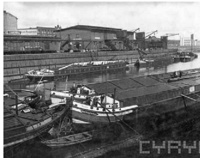
Przedwojenne zdjęcie części portu rzeczno-ego nad Wartą.