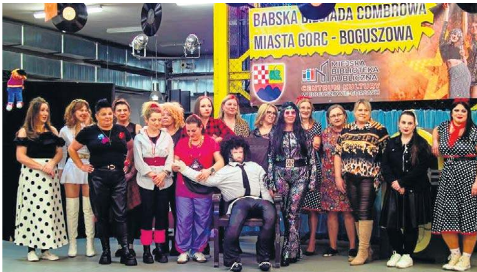
W 2026 roku panie bawiły się CKK Witold jako „dzieci kwiaty” w rytm przebojów Elvisa.