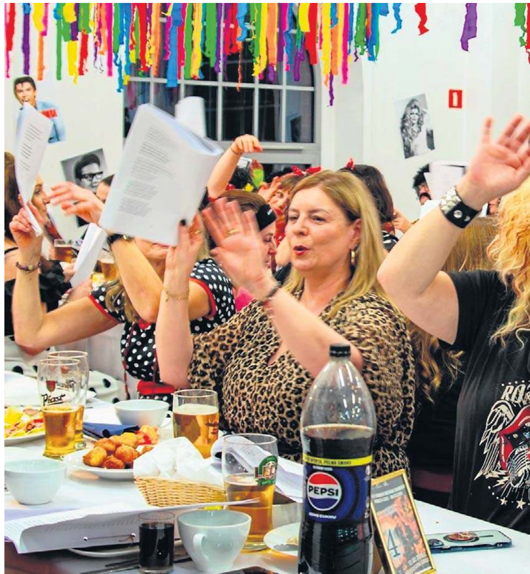
Babska Biesiada Combrowa w Gorcach ma bardzo długie tradycje. Zawsze odbywa się w tłusty