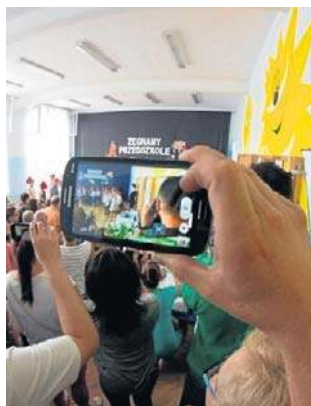
Rodzice i dzieci żegnają się z przedszkolem nr 8.