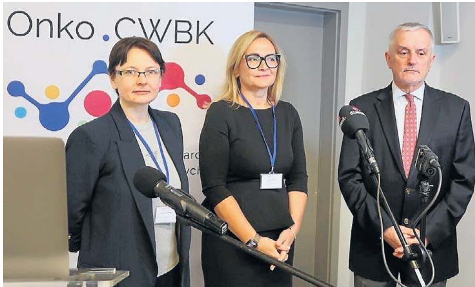
Uczestnicy konferencji podkreślali ogromną wagę nowoczesnych terapii onkologicznych.

Zaznaczył też, jak ważne jest pozyskanie przez wałbrzyski szpital kilkudziesięciu milionów złotych na rozwój hema-