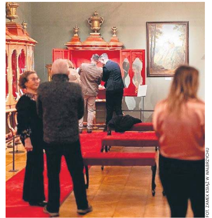
Gabinet Osobliwości to przestrzeń, w której kolekcjonerzy mogą pokazać swoje zbiory i podzielić się pasją.