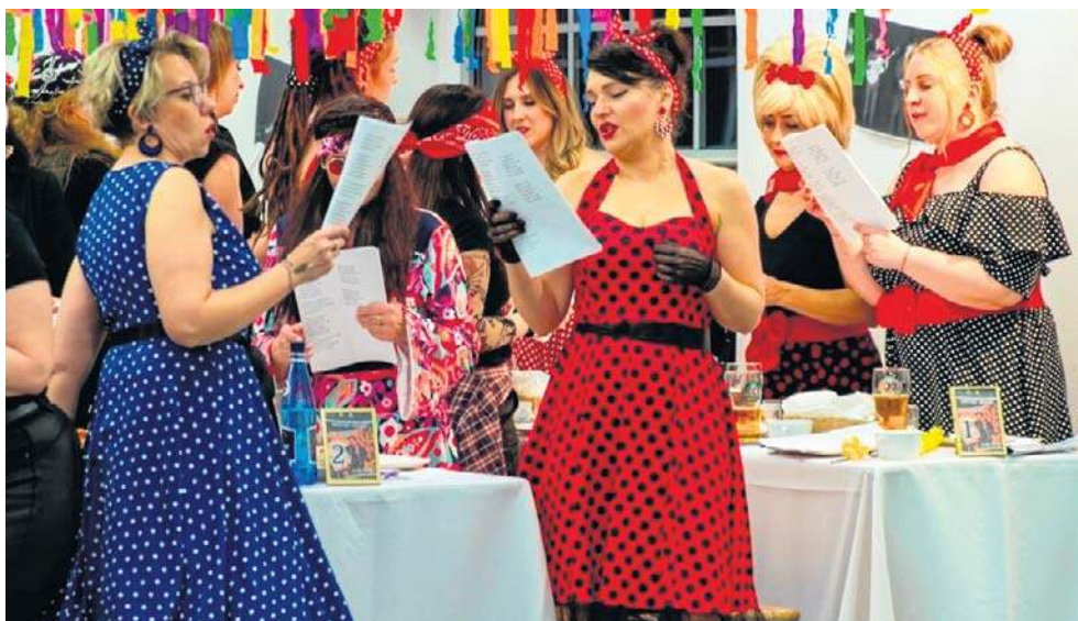
Bilety na wydarzenie rozchodzą się, niczym świeże bułeczki. Bo też zabawa jest przednia!