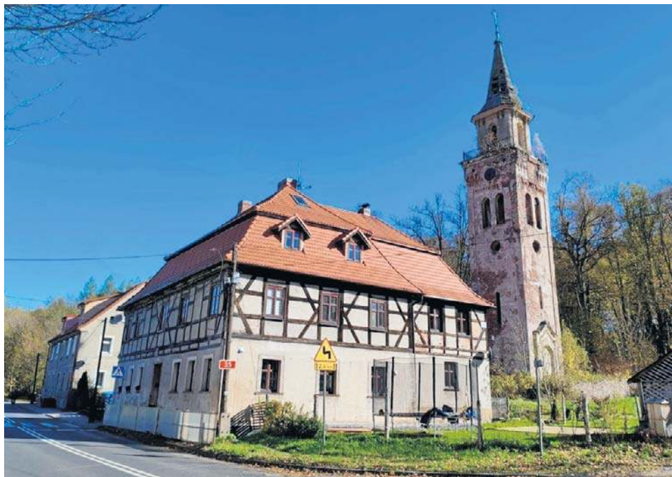
Pastorówka, wybudowana w pierwszej połowie XIX wieku jest znakomicie zachowana.

- Wyjątkowy, zabytkowy dom mieszkalny o powierzchni 433,73 m kw. w Unisławiu Śląskim. Obiekt jest wpisany do ewidencji zabytków jako tzw. dawna pastorówka. Dom wybudowany w latach świetności Unisławia Śląskiego, w