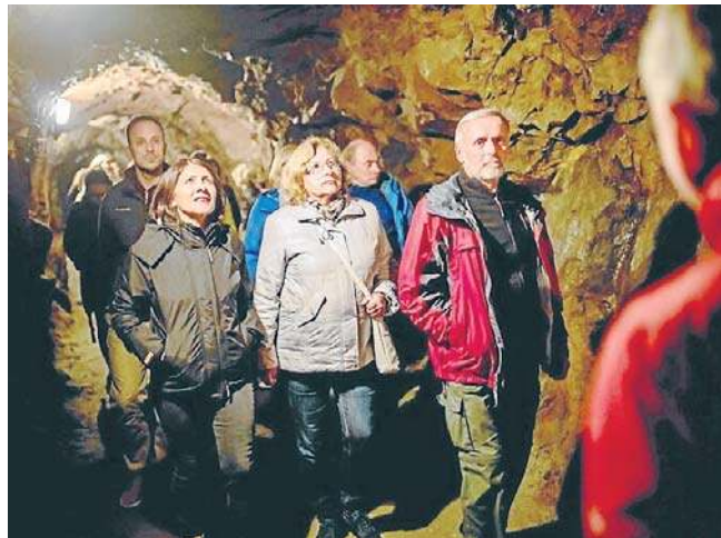
FOT. ZAMEK KSIĄŻ W WAŁBRZYCHU

Podziemia zamku Książ to tajemnicze, fascynujące miejsce. Przekonały się o tym tysiące zwiedzających.