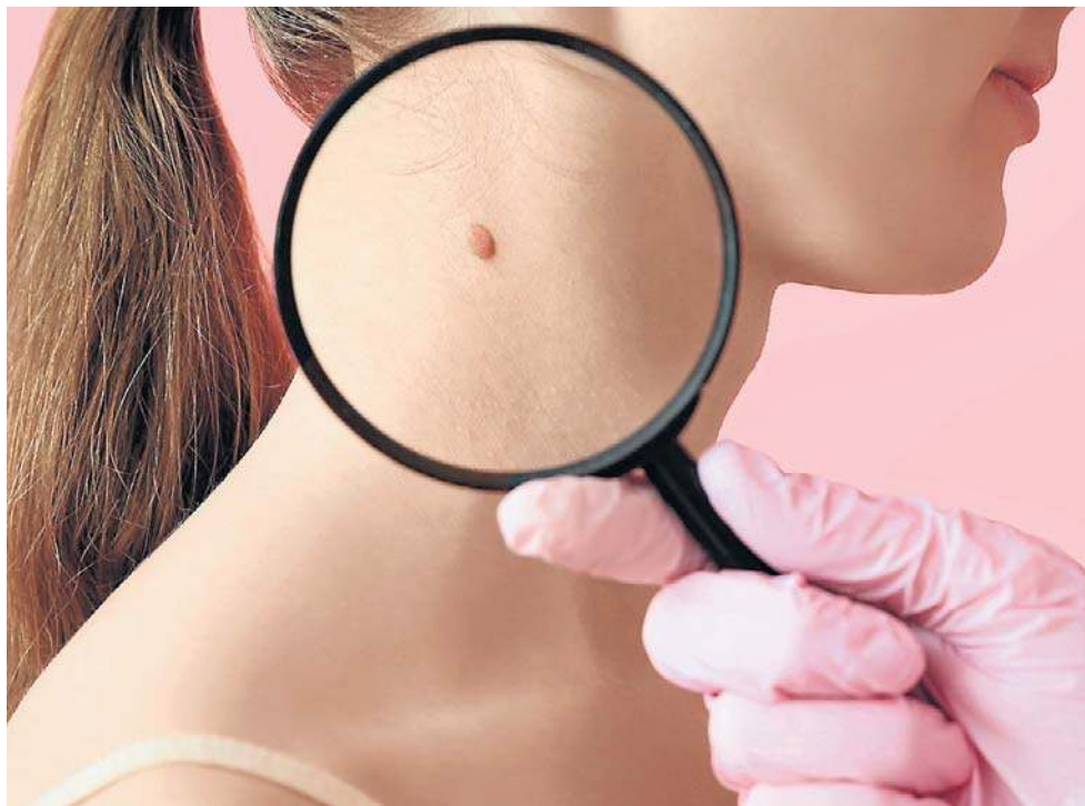
Niektóre objawy raka zbijają z tropu nawet lekarzy.

Aby wykryć rozwijającą się chorobę, należy przeprowadzić szereg badań, zaczynając od tradycyjnej morfologii krwi z rozmazem mikroskopowym - to jedno z podstawowych badań, które może wykazać nieprawidłowości sugerujące białaczkę lub inne nowotwory krwi. Wykorzystuje się także m.in. ● biopsję aspiracyjną szpiku kostnego lub trepanobiopsję ● badanie histopatologiczne, ● badania obrazowe (np. USG, PET-CT), ● metody chirurgiczne.