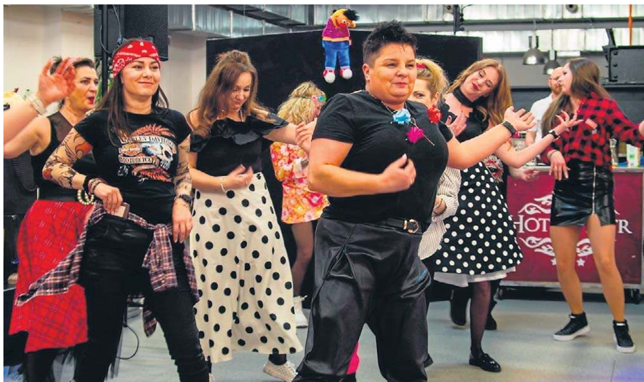
Podczas imprezy w Gorcach muzyka jest grana na żywo. Do tańców są zapraszani goście, nie brakuje niespodzianek.