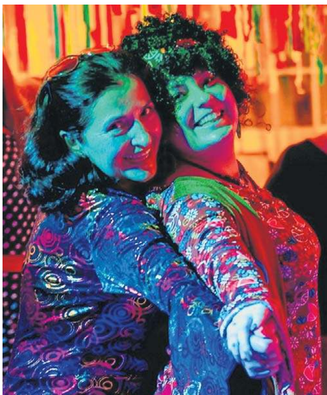
Baby combrowe spędzają wieczór na zabawie w gronie koleżanek. Nowicjuszkę przechodzi tego dnia chrzest.