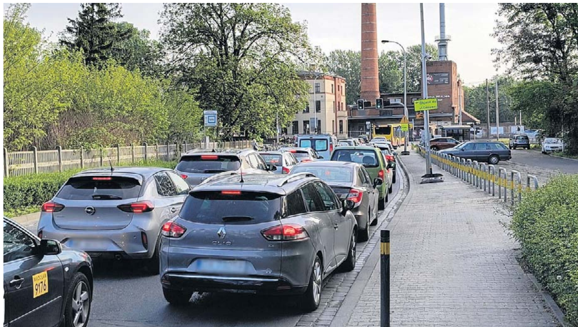
Opolska i Karwińska były wczoraj zdecydowanie bardziej zakorkowane, niż zwykle...

Tragedia pod Wrocławiem. Nie żyje pracownik drogowy str. 6