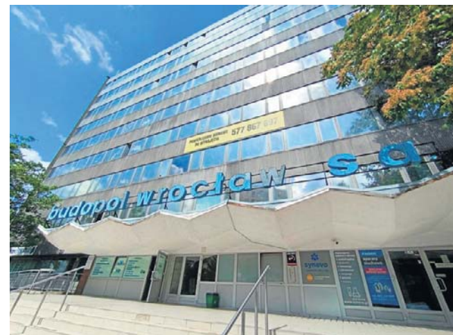
Budynek po dawnym Budopolu wygląda tak, jakby od dekad nie było tam żywej duszy.

Według informacji portalu Urbanity.pl rozpoczęcie budowy planowane jest na drugi kwartał 2026 roku. ©©