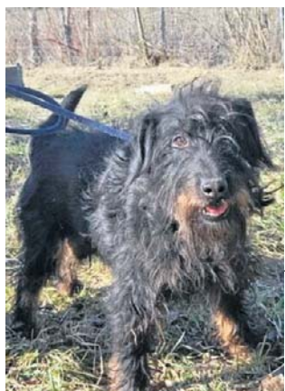
Edur kocha ludzi, nie przepada za innymi psami i kotami

Edur i Etna czekają w schronisku w Świdnicy na nowy dom. Suczka Elza znalazła już dom.