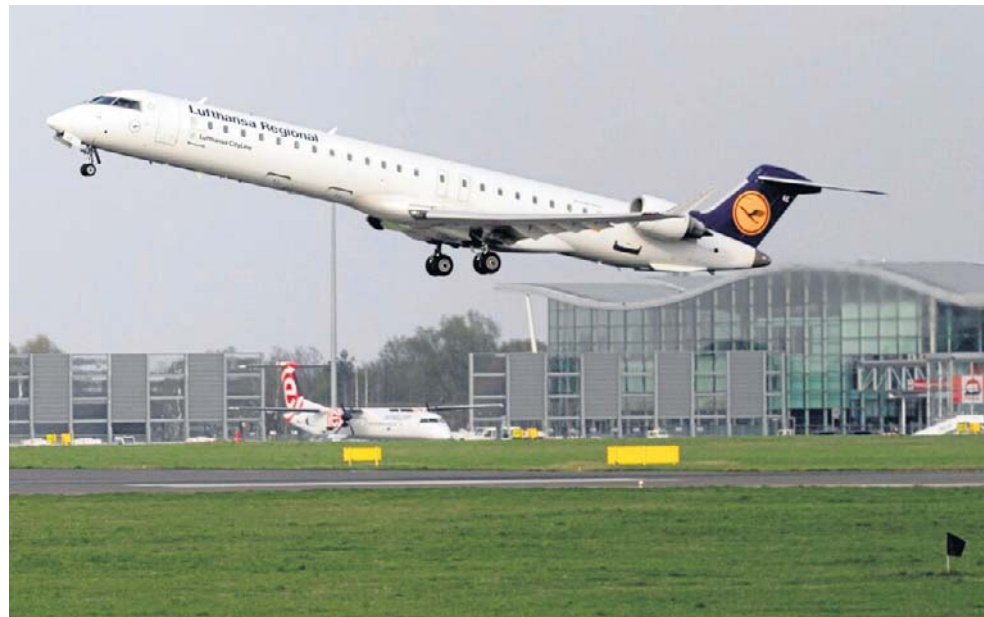
Na trasie Wrocław-Monachium będą latać większe samoloty: Airbusy A319, A320 i A321. To maszyny większe, niż dotychczas używane na tej trasie przez Lufthansę

- Powrót lotów z Wrocławia do Monachium to doskonała informacja dla pasażerów korzystających z naszego lotniska. Dzięki połączeniu ze stolicą Bawarii otrzymują oni niemal nieograniczone możliwości kontynuowania podróży w dowolny zakątek świata. Bardzo dziękuję linii Lufthansa za konstruk-