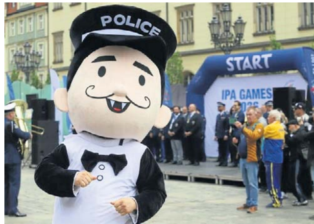
Wczoraj miała miejsce ceremonia uroczystego otwarcia igrzysk.

Do Wrocławia przyjechało około 700 policyjnych sportowców z 30 państw, m.in.: z Anglii, Austrii, Bośni i Hercegowiny, Bułgarii, Cypru, Chorwacji, Czarnogóry, Danii, Estonii, Gibraltaru, a także Grecji, Irlandii, Islandii, Francji, Finlandii, Kanady, Litwy, Ło-