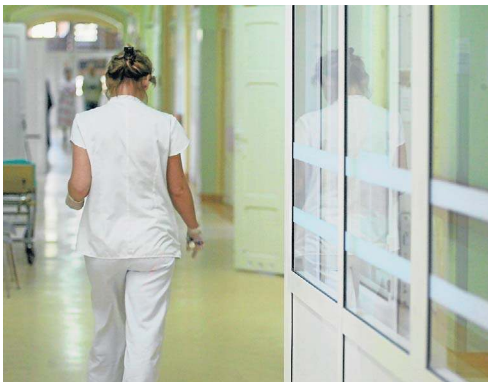
Nowe przepisy rozszerzające uprawnienia inspekcji pracy mogą zamieszać m.in. w szpitalach

- W sektorze ochrony zdrowia skutki reformy będą szczególnie odczuwalne, co wynika z unikalnej struktury zatrudnienia lekarzy oraz chronicznych niedoborów kadrowych. Reforma nie jest zmianą prawa pracy, lecz zmianą jego egzekucji. W sektorze medycznym, gdzie kontrakty są fundamentem operacyjnym, oznacza to wysokie ryzyko lokalnych turbulencji kadrowych, presji