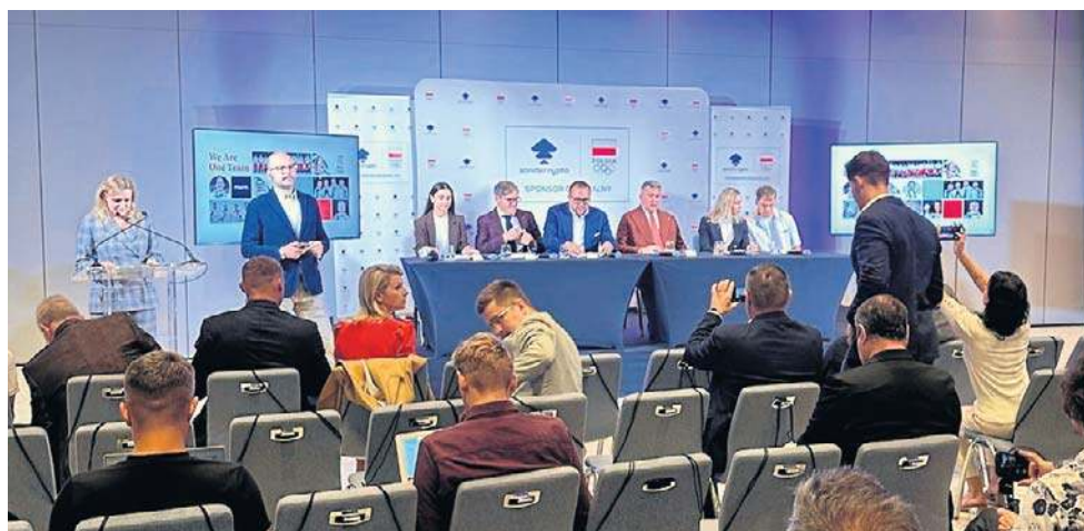
W przypadku zondacrypto wiarygodność była wzmacniana przez narrację o „polskiej giełdzie”, lokalnym graczu, który rzekomo działa bliżej standardów tradycyjnych finansów

W przypadku zondacrypto ta wiara była dodatkowo wzmacniana przez narrację o „polskiej giełdzie”, lokalnym graczu, który rzekomo działa bliżej standardów tradycyjnych finansów. Problem w tym, że rzeczywistość prawna i właścicielska tej platformy jest znacznie bardziej złożona – i znacznie mniej komfortowa z punktu widzenia użytkownika. Giełda ma formalną siedzibę w Estonii, a jej struktura właścicielska prowadzi do podmiotów zarejestrowanych w Szwajcarii. W praktyce ozna-