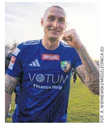
Stanclik strzelił bramkę z okolic koła środkowego