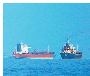
Porty nad Zatoką Perską muszą być dostępne albo dla wszystkich, albo dla nikogo

Rzecznik dodał, że porty nad Zatoką muszą być dostępne albo dla wszystkich, albo dla nikogo. Ostrzegł także,