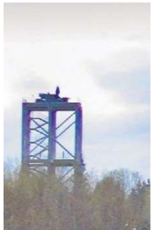
Rezydencji Putina strzeże już blisko 30 wież z systemami rakietowymi Pancyr

Wcześniej Radio Swoboda odkryło również, że ponad 20 wież z karabinami maszynowymi dużego kalibru, a także kilka platform z przeciwlotniczym kompleksem rakietowym Pancyr zostało zbudowanych na terenie i na obrzeżach specjalnej strefy ekonomicznej Ałabuga.