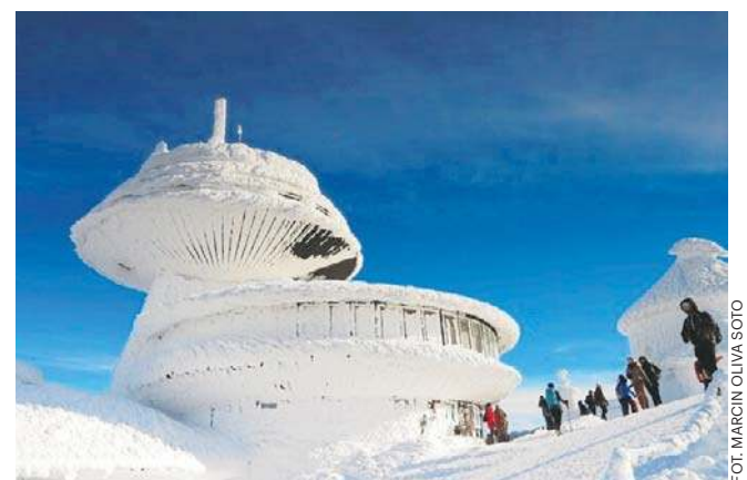
FOT. MARCIN OLIVA SOTO

- Ze względu na status zabytku oraz warunki pogodowe panujące na szczycie, wykonawca będzie musiał zastosować niestandardowe rozwiązania techniczne pod nadzorem konserwatora - napisał na swoim Facebooku minister infrastruktury Dariusz Klimczak. - To wielki krok w stronę przywrócenia jej pełnej funkcjonalności dla meteorologów oraz turystów! ©