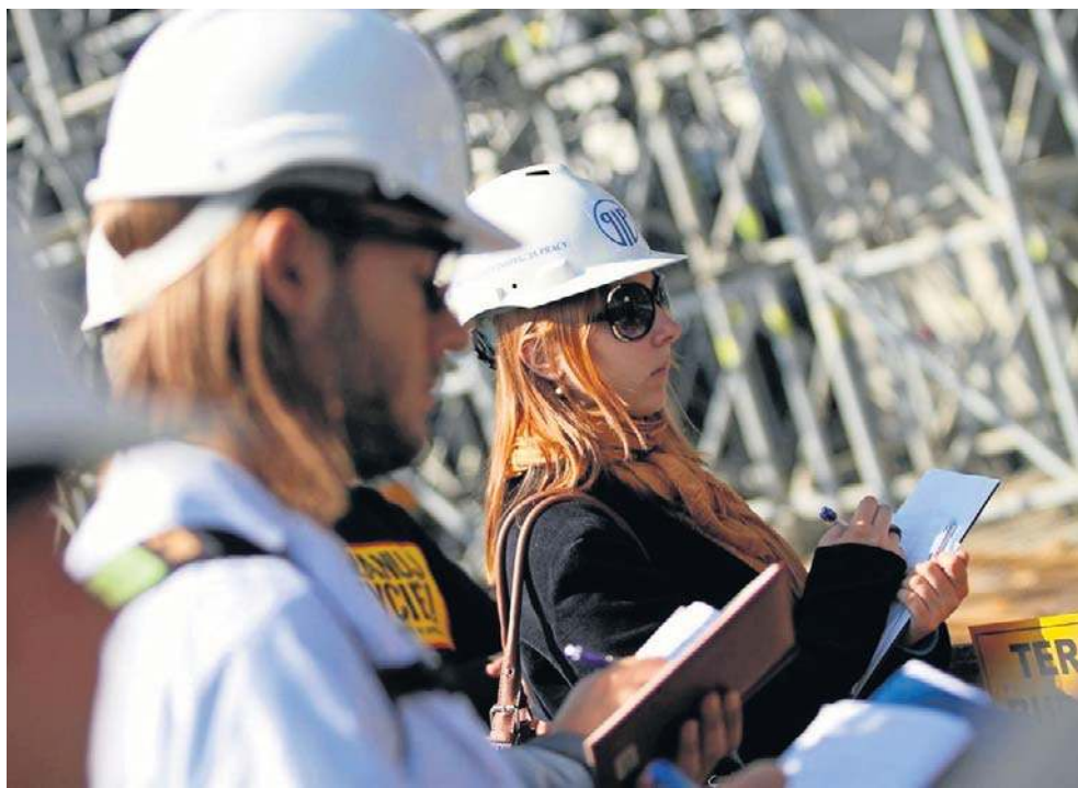
Uprawnienia inspekcji pracy będą szersze niż dotychczas

Jak zmiana umowy będzie wyglądała w praktyce? Najpierw inspektor wyda firmie polecenie usunięcia naruszenia (czyli zatrudnienie pracownika). Jeśli przedsiębiorca nie wykona polecenia, inspektor PIP będzie mógł złożyć wniosek do okręgowego in-