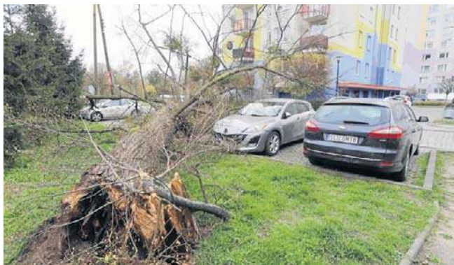
FOT. JAROSŁAW JAKUBCZAK

Służby zabezpieczyły taśmą drewniany słup, natomiast drzewo zostało już wstępnie pocięte. Szczęśliwie nikt nie odniósł obrażeń. ©