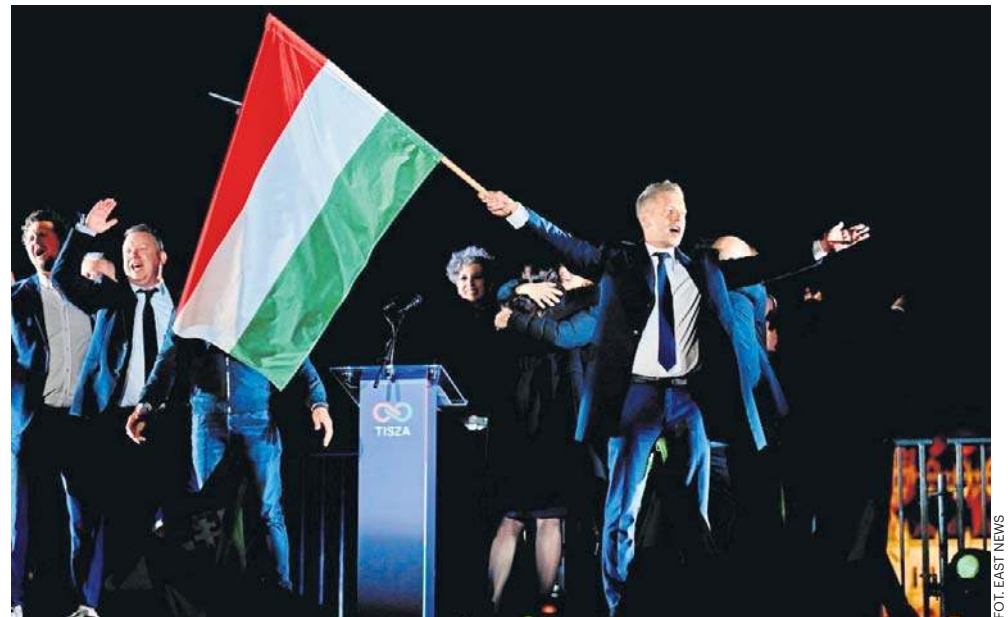
Objęcia urzędu premiera przez Petera Magyara należy oczekiwać najpóźniej w drugiej połowie maja - tak wynika z węgierskiej konstytucji i przepisów wyborczych

- Odzyskałiśmy nasze państwo, uwolniliśmy je. TISZA nie tylko wygrała, ale będzie mieć większość konstytucyjną