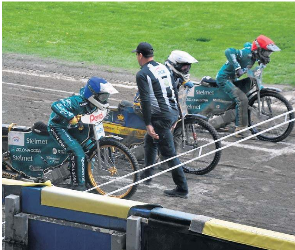
Żużlowcy Falubazu (niebieski i czerwony kask) triumfowali na gorzowskim torze

We wtorek rozegrana została pierwsza kolejka nowego sezonu U24E. W Gorzowie nie obyło się jednak bez perturbacji związanych z pogodą. Zawody zostały zaplanowane na godz. 17.00, a dopiero kilkadziesiąt minut przed tą porą zakończyły się kilkugodzinne opady deszczu. Zawodów jednak nie odwołano i o godz. 18.20 żużlowcy ruszyli do pierwszego wyścigu. Ten rozgrywany był na raty, bo w pierwszych dwóch podejściach dochodziło do upadków. Kibice zastanawiali się, czy uda się rozegrać choćby z dwanaście biegów potrzebnych do zaliczenia wyników. Tor z każdym wyścigiem jednak popra-