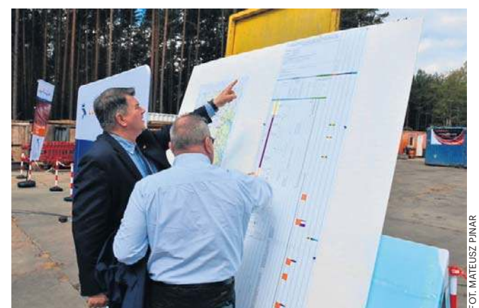
Projekt kopalni „Nowa Sól” trwa już tak naprawdę od 12 lat i zainwestowano w niego 500 mln zł.

Firma chciałaby, żeby te odpady, które nie zostaną pod ziemię, były przerabiane np. na piasek czy węglan wapnia dla rolnictwa i cementowni.