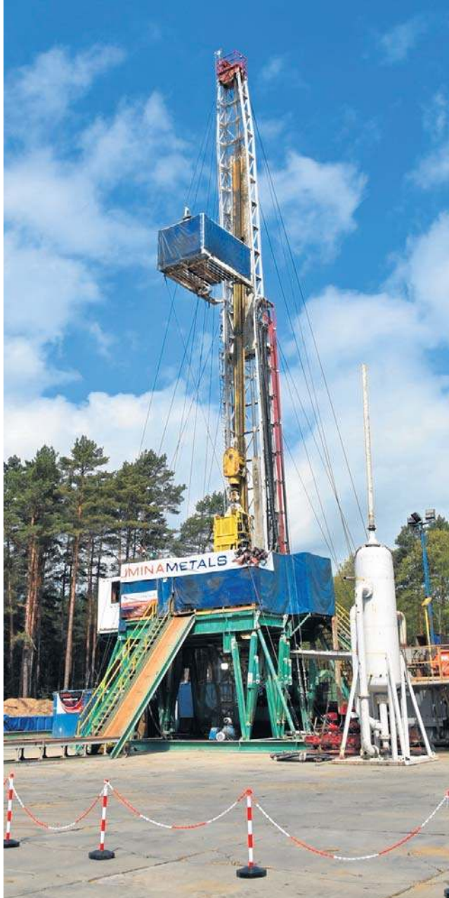
Odwiert na terenie gm. Sława będzie sięgał mniej więcej 1900 m.

CEO Luminy zaznacza, że dotychczasowe badania wskazują na obecność w regionie 10