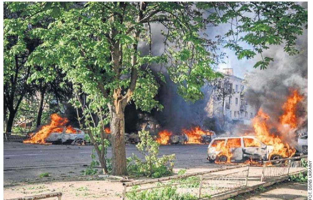
W ciągu doby w rosyjskich atakach zginęło 27 osób, 120 zostało rannych

Władze obwodu charkowskiego podały w środę w godzinach porannych, że Rosjanie zaatakowali jedną z dzielnic Charkowa. Uszkodzone zostały