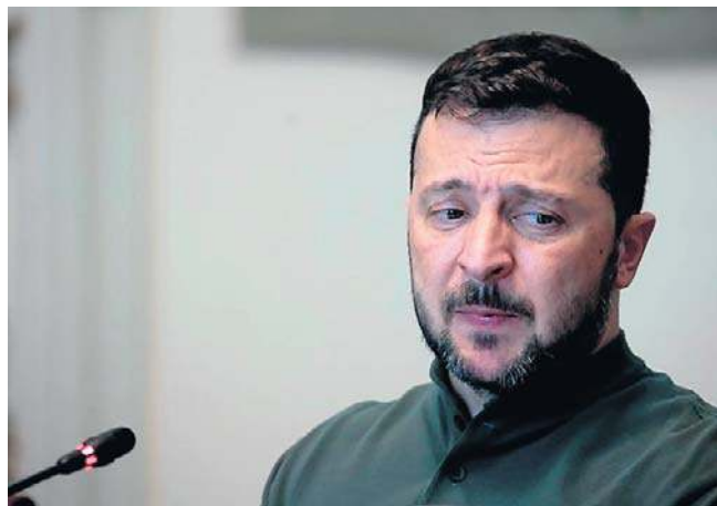
Prezydent Zelenski zaproponował podzielenie się doświadczeniem w walce z dronami

Ukraiński przywódca odwiedził w ciągu ostatnich dwóch miesięcy kilka państw Bliskiego Wschodu, w tym dwukrotnie Arabię Saudyjską, Zjednoczone Emiraty Arabskie, Katar czy Syrię. Zelenski informował wcześniej, że Ukraina rozpoczęła współpracę z państwami tej części świata, dzieląc się z nimi doświadczeniem w walce z irańskimi dronami. PAP