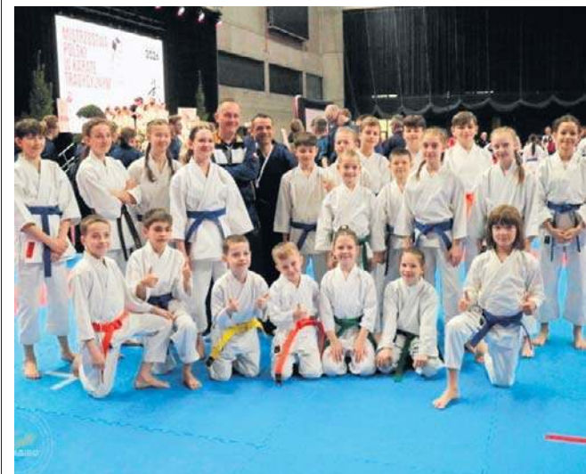
Reprezentanci ABiRO spisali się znakomicie, zdobyli w Grodzisku Mazowieckim 16 medali mistrzostw Polski