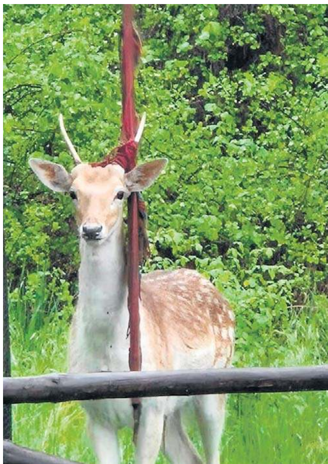
Daniela można spotkać w okolicach Nowin Wielkich, na trasie z Bogdańca w kierunku Witnicy

- Ostatnia informacja wskazuje, że daniel był widziany na terenie gminy Bogdaniec, przy przejeździe w Motylewie. Bardzo prosimy: jeśli go zobaczycie, zadzwońcie do nas lub na numer alarmowy 112 i wskażcie dokładną lokalizację - apelują urzędnicy z Witnicy.