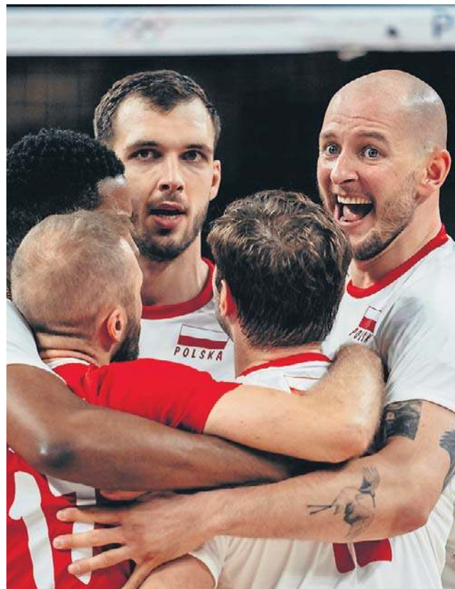
Wszystko wskazuje na to, że tych panów nie zobaczymy w tym sezonie w naszych barwach narodowych...